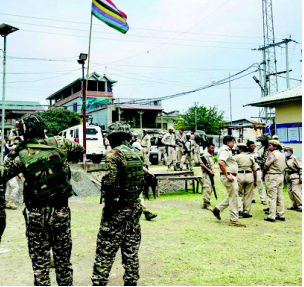
મણિપુર પોલિંગ બૂથ પર ફાયરિંગ વાયરલ વીડિયોમાં સશસ્ત્ર લોકો દેખાયા

તા.૧૯ ઓનલાઈન પ્રસારિત થઈ રહેલા ૨૩ સેકન્ડના વીડિયોમાં ગોળીબાર દરમ્યાન બૂમો પાડતા લોકોની સાથે અરાજક દેશ્ય જોવા મળ્યા. સુત્રોએ જણાવ્યું કે, ઈશ્કાલ પૂર્વ જિલ્લાના ભમોન કંપુમાં ઈલેક્ટ્રોનિક વોટિંગ મશીનો પણ નષ્ટ કરી દેવામાં આવી છે. ઉપદ્રવીઓએ મતદાન કેન્દ્રની અંદર માત્ર ભાજપના એજન્ટોની માંગ કરી. એવા વીડિયો ઓનલાઈન સામે આવ્યા છે, જેમાં પોલીસ કર્મચારીઓને મતદાન કેન્દ્ર પર સુરક્ષા ઉપાયોને મજબૂત કરતા દર્શાવવામાં આવ્યા છે. ખાસ કરીને રાજ્યની બે સીટો આંતરિક મણિપુર અને બાલ્ક મણિપુર પર આજે મતદાન થઈ રહ્યું છે. આ પહેલા દિવસે મણિપુરના મુખ્યમંત્રી એન. બિરેન્સિંહ ૨૦૨૪ની સામાન્ય ચૂંટણી માટે ચાલી રહેલા પ્રથમ તબક્કાના મતદાનમાં ઈશ્કાલ પૂર્વના લુવાંગસાંગબામ મમાંગ લીકાઈમાં એક મતદાન કેન્દ્ર પર પોતાના વોટ નાંખ્યા. પાછલા વર્ષે ૩ મેથી મણિપુરમાં પર્વતીય આધારિત કુટ્ટી અને ખીણ સ્થિત મેઈનેઈ લોકોની વચ્ચે હિંસક જાતીય અથડામણો જોવા મળી, જેમાં અનેક લોકો મૃત્યુ પામ્યા અને હજારો લોકો બેઘર થયા.