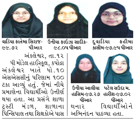
ધી મોડેલ હાઈસ્કૂલ, કાપોદ્રા અંકલેખર પાતે ધો. ૧૦ એસએસસીનું પરિણામ ૧૦૦ ટકા આપ્યું હતું. જેમાં નીચે પ્રમાણેના વિદ્યાર્થીઓ ઉત્તીર્ણ થયા હતા. આ પ્રસંગે શાળા ટ્રસ્ટી મંડળ, શાળાના પ્રિન્સિપાલ તથા શિક્ષકોએ પાસ