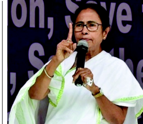
આરોપોને લઈને ગવર્નર સી.વી. આનંદ બોઝ અને તુષમ્બલ કોંગ્રેસ (TMC) વચ્ચેના ઝઘાડામાં મીડિયા સાથે વાત કરતા બોઝે કહ્યું કે તે મમતા બેનરજીની "દીદીગીરી" સહન કરશે નહીં અને એવો પણ ઘાવો કર્યો કે આ મમતા બેનરજીની 'દીદીગીરી' છે. તે "ગંદું રાજકારણ" મેં છે. ભારતીય જનતા પાર્ટી (BJP) પર પ્રહાર કરતાં મમતા બેનરજીએ આરોપ લગાવ્યો કે સંદેશપાલીની ઘટના ભગવા શિબિરનું 'પર્યાય' હતું. મમતા બેનરજીએ આરોપ લગાવ્યો છે કે, લોકોએ જોવું છે કે કેવી રીતે ભાજપે સંદેશપાલીનું કાવતરું ઘડ્યું હતું. મોદી બાબુ આ મુદ્દાને ઉકેલશે. સ્ત્રી માટે પૈસા કરતાં તેની ગરિમા વધુ મહત્વની છે. તેઓએ જે કહ્યું છે તે સૌથી વધુ બ્રહ્મ ગુનો છે. ફરિયાદોને એ પણ ખબર ન હતી કે સ્ટેશનમાં તેમની વિરુદ્ધ ફરિયાદ કરી હતી. ૮ મેના રોજ, રાજ્યપાલે તેમના પર લાગેલા આરોપોને દૂર કરવા માટે રાજ્યભવનના કેટલાક સીસીટીવી ફૂટેજ બતાવ્યા હતા.

કોલકાતા, તા.૧૨ કથિત 'ઇડતી'ના આરોપ બાદ, મુખ્ય પ્રધાન મમતા બેનરજીએ શનિવારે રાજ્યપાલ સી.વી. આનંદ બોઝના રાજીનામાની માંગ કરી હતી અને ઉલ્લેખ કર્યો હતો કે તેઓ રાજ્યપાલને મળવા માટે ક્યારેય રાજ્યભવનમાં જશે નહીં કારણ કે તેઓ માને છે કે તેમની બાજુમાં બેસવું એ પણ 'પાપ' છે. પાર્ટીના ઉમેદવાર રચના બેનરજી માટે હુગલી જિલ્લાના સત્રગ્રામમાં ચૂંટણી પ્રચારમાં મમતાએ કહ્યું કે રાજ્યપાલે સ્પષ્ટતા કરવી જોઈએ કે તેમણે તેમના પદ પરથી કેમ રાજીનામું ન આપવું જોઈએ. પશ્ચિમ બંગાળના મુખ્યમંત્રીએ કહ્યું કે તેમણે કહ્યું હતું કે તે દીદીગીરી સહન કરશે નહીં. દાદાગીરી અને દીદીગીરી બંને સહન નહીં થાય તે સારું છે. તેમણે એક સંવાદિત વિડિયો બહાર પાડ્યો છે અને મં સમગ્ર ફૂટેજ અને તેની સામગ્રી જોઈ છે. તે આઘાતજનક છે. મને બીજા વિડિયો મળ્યો છે. જો હું રાજ્યપાલને મળીશ તો હું તેમને રસ્તા પર મળીશ પરંતુ રાજ્યભવનની અંદર જઈશ નહીં.