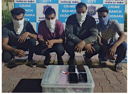
કાર્ડમ બ્રાન્ડે નીટમી ટીમ શહેરી વિસ્તારમાં પેટ્રોલિંગની કામગીરી કરી રહી હતી, તે દરમિયાન બાતમી મળી હતી કે, પંદર દિવસ પહેલાં જીએસએફસીના ગેટ સામેની ડિલિવરી સર્વિસ નામની ટ્રીકરનો કરતા ચાર શખ્સોએ ભેગા મળી ગોરવા ગેટ સર્કલ ખાતેની પેટાલુસ નામની કપડાની દુકાનમાંથી કપડાના પાર્સલો કાઢી લીધા હતા. ત્યારબાદ પાર્સલોમાંથી સ્ત્રી પુરૂષોના કપડાઓ ચોરી કર્યાં હતા. આ ચારેય શખ્સો હાલ દશરથ ગામ પાણીની ટાંકી પાસે ચોરી કરેલા કપડા બપેલી થેલીઓ સાથે ઊભા રહી કપડાઓ વેચવા જવાની તૈયારીમાં છે. જેના આધારે જેથી

વડોદરાના પેન્ટાલુન શો રૂમ દ્વારા મહારાષ્ટ્રના ભિવંડી ખાતે મોકલેલા બ્રાન્ડેડ કપડાંના પાર્સલમાંથી રૂ.૬૪ હજારના કપડાઓની ચોરી કરનાર ડિલિવરી કંપનીમાં કામ કરતાં ચાર શખ્સોને કાર્ડમ બ્રાન્ડે ઝડપી પાડ્યા હતા. તેમની પાસેથી ચોરીના કપડા અને રકમ મળી ઉપ હજારનો મુદ્દામાલ કબજે કરી આગળની કાર્યવાહી માટે ગોરવા પોલીસને સુપરત કરાયા છે.