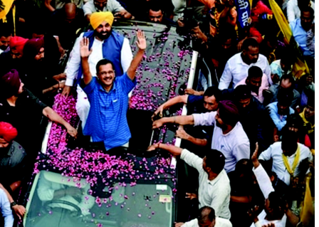
કેજરીવાલે કહ્યું કે પંજાબમાં પણ ભાજપની આવી જ દશા થશે. ૪ જૂને, મોદી સત્તામાં આસેશે નહીં. ઈન્ડિયા ગઠબંધન સરકાર બનાવશે અને AAP તેનો ભાગ હશે. દિલ્હી એક સંપૂર્ણ રાજ્ય બનશે. કેજરીવાલે કહ્યું હતું કે નરેન્દ્ર મોદી માટે ભાજપને મત આપવાથી અમિત શાહ વડા પ્રધાન બનશે કારણ કે નરેન્દ્ર મોદી ૭૫ વર્ષના થવા પછી આવતા વર્ષે નિવૃત્ત થશે. આ નિવેદન પછી ભાજપે હતું કે નરેન્દ્ર મોદી જ વડા પ્રધાન રહેશે અને ભાજપે કેજરીવાલ પર તેનો ભાગ હશે. દિલ્હી એક સંપૂર્ણ રાજ્ય બનશે. કેજરીવાલે કહ્યું હતું કે નરેન્દ્ર મોદી માટે ભાજપને મત આપવાથી અમિત શાહ વડા પ્રધાન બનશે કારણ કે નરેન્દ્ર મોદી ૭૫ વર્ષના થવા પછી આવતા વર્ષે નિવૃત્ત થશે. આ નિવેદન પછી ભાજપે હતું કે નરેન્દ્ર મોદી જ વડા પ્રધાન રહેશે અને ભાજપે કેજરીવાલ પર તેનો ભાગ હશે. દિલ્હી એક સંપૂર્ણ રાજ્ય બનશે. કેજરીવાલે કહ્યું હતું કે નરેન્દ્ર મોદી માટે ભાજપને મત આપવાથી અમિત શાહ વડા પ્રધાન બનશે કારણ કે નરેન્દ્ર મોદી ૭૫ વર્ષના થવા પછી આવતા વર્ષે નિવૃત્ત થશે. આ નિવેદન પછી ભાજપે હતું કે નરેન્દ્ર મોદી જ વડા પ્રધાન રહેશે અને ભાજપે કેજરીવાલ પર તેનો ભાગ હશે. દિલ્હી એક સંપૂર્ણ રાજ્ય બનશે.

(એજન્સી) દિલ્હીના મુખ્ય પ્રધાન અરવિંદ કેજરીવાલે શનિવારે રાજ્યોમાં તેમના રોક શોમાં જણાવ્યું હતું કે - હરિયાણા, રાજસ્થાન, કર્ણાટક, મહારાષ્ટ્ર, પશ્ચિમ બંગાળ, બિહાર અને ઉત્તર પ્રદેશમાં ભાજપની બેઠકોની સંખ્યા ઘટશે. કેજરીવાલે કહ્યું કે આ તેમની આગાહી નથી પરંતુ નિષ્ણાતો, મનોવિજ્ઞાનીઓ અને વિશ્લેષકોની અભિપ્રાય છે જેમની સાથે તેઓ જેલની બહાર આવ્યા પછી છેલ્લા ૨૦ કલાકમાં સંપર્કમાં આવ્યા હતા. કેજરીવાલે કહ્યું હતું કે, હું જેલમાંથી બહાર આવ્યો ત્યારથી છેલ્લા ૨૦ કલાકમાં મેં ઘણા નિષ્ણાતો સાથે ફોન પર વાત કરી છે. બધા કંઈ રહ્યા છે કે ભાજપ બહુમતી મેળવશે નહીં. દિલ્હીમાં ભાજપ તમામ સાત બેઠકો ગુમાવશે.