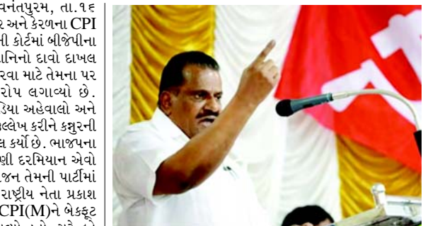
ભૂતકાળમાં પણ તેઓ બેદરકાર રહ્યા હતા. જયરાજને જવડેકરને મળવાનો ઈન્કાર કર્યો ન હતો, પરંતુ કહ્યું હતું કે, તિરૂવનંતપુરમમાં અક્કુલમ ખાતે તેમના પુત્રના ફલેટમાં થયેલી મીટિંગ બિન-રાજકીય હતી. ત્યારપછી તેમણે કહ્યું કે, જવડેકરે તેમની અધોપિત મુલાકાત લીધી હતી. CPI(M) રાજ્ય સચિવાલયે તેમનો પુલાસો સ્વીકાર્યો અને તેમને કલીનચીટ આપી અને પાર્ટીએ તેમને સુરેન્દ્રન સામે કાનૂની કાર્યવાહી શરૂ કરવા નિર્દેશ આપ્યો.

તિરૂવનંતપુરમ, તા. ૧૬ LDF (લેફ્ટ ડેમોક્રેટિક ફ્રન્ટ)ના કન્વીનર અને કેરળના CPI (M)ના વરિષ્ઠ નેતા ઈ.પી.જયરાજને કમરુની કોર્ટમાં બીજેપીના પ્રદેશ ઉપાધ્યક્ષ સોબા સુરેન્દ્રન સામે માનહાનિનો દાવો દાખલ કર્યો છે, જેમાં પછીથી તેમની છબી ખરાબ કરવા માટે તેમના પર પામાવિહોણા આરોપો લગાવવાનો આરોપ લગાવ્યો છે. જયરાજને ૨૬ એપ્રિલે પ્રકાશિત થયેલા મીડિયા અહેવાલો અને બે દિવસ પછી સુરેન્દ્રને આપેલા ઈન્ટરવ્યુનો ઉલ્લેખ કરીને કમરુની ન્યાયિક પ્રથમ વર્ગ મેજિસ્ટ્રેટ કોર્ટમાં કેસ દાખલ કર્યો છે. ભાજપના નેતાએ તાજેતરમાં યોજાયેલી લોકસભા ચૂંટણી દરમિયાન એવો દાવો કરીને વિવાદ ઉભો કર્યો હતો કે જયરાજને તેમની પાર્ટીમાં જોડાવાની નજીક છે. જયરાજને ભાજપના રાષ્ટ્રીય નેતા પ્રકાશ જવડેકર સાથે મુલાકાત કરીને તેમની પાર્ટી CPI(M)ને બેકફૂટ પર મૂક્યા બાદ આ આરોપ લગાવવામાં આવ્યો હતો. સુરેન્દ્રને આરોપ લગાવ્યો હતો કે જયરાજને પાવર દલાલ ટીજી નંદકુમાર ઉર્ફ દલાલ નંદકુમાર સાથે મળીને તેમનો સંપર્ક કર્યો હતો અને ભાજપમાં જોડાવાની યોજના બનાવી હતી. કેરળમાં ૨૬ એપ્રિલે ચૂંટણી યોજાવાની હતી ત્યારે પણ આ આરોપે CPI(M) અને જયરાજને બેકફૂટ પર મૂક્યા હતા. આ આરોપ રાજકીય વિવાદમાં ફેરવાઈ જતાં, મુખ્યમંત્રી પિનરાઈ વિજયને જાહેરમાં ટિપ્પણી કરી કે જયરાજને સતર્ક રહેવું જોઈતું હતું અને