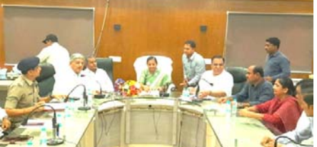
કેન્દ્ર સરકારનાં રાજ્યકક્ષાના