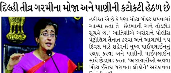
હકીકત એ છે કે ઘણા મોટા બોલ્ટ કાપવામાં આવ્યા હતા તે છેડપાની અને તોડફોડ સુચવે છે. આતિશીએ અરોરાને પોલીસ પેટ્રોલિંગ તૈનાત કરવા અને આગામી ૧૫ દિવસ માટે શહેરની મુખ્ય પાઈપલાઈનનું રક્ષણ કરવા અને પાણીની પાઈપલાઈન સાથે કડક કરતા 'ભ્રષ્ટાચારીઓ અથવા ખોટા ઈરાદા ધરાવતા લોકોને' અટકાવવા વિનંતી કરી.

(એજન્સી) નવી દિલ્હી, તા. ૧૬ દિલ્હીના જળ પ્રધાન આતિશીએ પોલીસ કમિશનર સંજય અરોરાને પત્ર લખીને આગામી ૧૫ દિવસ સુધી પેટ્રોલિંગ અને મુખ્ય પાઈપલાઈન્સની સુરક્ષા માટે કર્મચારીઓની તૈનાત કરવાની વિનંતી કરી, કારણ કે, રાષ્ટ્રીય રાજધાની જળ સંકટ સાથે ઝડપી રહી છે.