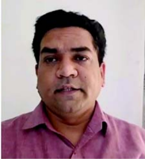
સમાન છે અને મિશ્રા દ્વારા આપવામાં આવેલું વિભાજનકારી નિવેદન હાનિકારક છે.

મિશ્રાએ આરોપ લગાવ્યો હતો કે, AAP સરકાર બકરી ઈંદ માટે વધારાની વ્યવસ્થા કરવાના બહાને હિન્દુ-બહુમતી વિસ્તારોમાંથી પાણીનો પુરવઠો ડાયવર્ટ કરી રહી છે. મિશ્રાએ વીડિયોમાં કહ્યું છે કે, દિલ્હીમાં પાણીની ગંભીર કટોકટીનું સૌથી મોટું કારણ જાણીને તમે ચોંકી જશો. હિંદુ બહુમતીવાળા વિસ્તારોમાંથી પાણીને અવરોધિત કરવામાં આવી રહ્યું છે અને મુસ્લિમ વિસ્તારોમાં વધારાનો પુરવઠો મોકલવામાં આવી રહ્યો છે. લોકસભા ચૂંટણીમાં મોદીને મત આપવા બદલ હિંદુઓને સજા આપવામાં આવી રહી છે. યમુના વિહાર, મોંજપુર અને ગોકુલપુરીમાંથી પાણી સીલમપુર, જલ્દાબાદ અને સીમાપુરીમાં મોકલવામાં આવી રહ્યું છે. આઈપી એક્સટેન્શનનું પાણી અલ્લાહ કોલોનીને આપવામાં આવી રહ્યું છે. રાજેન્દ્ર નગર, કરોલ બાગ અને આનંદ પરબતમાંથી પાણીને અટકાવીને જામા મસ્જિદ અને મતિયા મહેલને આપવામાં આવે છે. આવું કેમ કરવામાં આવી રહ્યું છે? શું હવે પાણી પુરવઠો પણ ધર્મ પર આધારિત હશે?