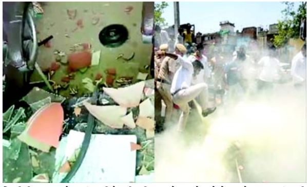
દિલ્હીની જનતા માટે પૂરતું પાણી મેળવી રહી છે. આજે આપણે જે તંગીનો સામનો કરી રહ્યા છીએ તે તેમના ભ્રષ્ટાચાર, બિન-આયોજન અને ગેરવહીવટને કારણે છે.

(એજન્સી) તા. ૧૬ એનઆઈના અહેવાલ મુજબ દિલ્હીમાં ચાલી રહેલી પાણીની કટોકટીથી સમગ્ર રાજધાનીમાં વિરોધ પ્રદર્શન, તોડફોડ અને ઉગ્ર રાજકીય આક્ષેપબાજ શરૂ થઈ છે. પાણીની તીવ્ર તંગીને લઈને રવિવારે અજાણ્યા વ્યક્તિઓએ છતરપુરમાં આવેલી દિલ્હી જલ બોર્ડ (ડીજેબી) કાર્યાલયમાં તોડફોડ કરી હતી. ANI દ્વારા શેર કરાયેલા ફોટોમાં ડીજેબી ઓફિસમાં તૂટેલી બારી અને તૂટેલા માટીના વાસણો દેખાય છે. આમ આદમી પાર્ટી (AAP) એ ઘટનાનો બીજો વીડિયો શેર કરીને આક્ષેપ કર્યો કે, તોડફોડ કરનારાઓ ભાજપના નેતાઓ અને કાર્યકરો હતા. વીડિયોમાં એક વ્યક્તિ ભાજપનો ખેસ પહેરેલો જોવા મળ્યો હતો.