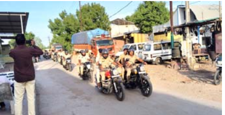
જંબુસર, તા. ૧૬

આવૃત્તી કાલ ઈદ-ઉલ-અઝહાનો તહેવાર હોય વિસ્તારમાં કાયદો અને વ્યવસ્થા જળવાય રહે તેમજ ભયમુક્ત વાતાવરણમાં પર્વની ઉજવણી પાર પડે તે હેતુસર જંબુસર પોલીસે દ્વારા ફ્લેગ માર્ચ કરવામાં આવી હતી. પોલીસ અધિકારી તેમજ કમ્પાઉન્ડ દ્વારા જંબુસર નગરમાં સંવેદનશીલ વિસ્તારોમાં અણખી ભાગોળ