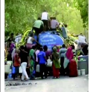
જલ્દાબાદ અને સીમાપુરીમાં મોકલવામાં આવી રહ્યું છે. આઈપી એક્સટેન્શનનું પાણી અલ્લાહ કોલોનીને આપવામાં આવી રહ્યું છે. રાજેન્દ્ર નગર, કરોલ બાગ અને આનંદ પરબતમાંથી પાણીને અટકાવીને જામા મસ્જિદ અને મતિયા મહેલને આપવામાં આવે છે.

(એજન્સી) તા. ૧૬ દિલ્હીમાં પાણીની ગંભીર કટોકટી ચાલી રહી છે ત્યારે ભારતીય જનતા પાર્ટીના નેતા કપિલ મિશ્રાએ મુખ્યમંત્રી અરવિંદ કેજરીવાલની સરકાર પર ગંભીર આરોપો લગાવ્યા છે. રવિવારે સવારે પોસ્ટ કરવામાં આવેલા એક વીડિયો સંદેશમાં મિશ્રાએ આરોપ લગાવ્યો હતો કે, આમ આદમી પાર્ટી (AAP) અયોગ્ય રીતે પાણીનું વિતરણ કરી રહી છે. તે હિંદુ-પ્રભાસિત વિસ્તારોમાં સપ્લાય અટકાવીને તેને મુસ્લિમ બહુમતીવાળા વિસ્તારોમાં પાણીને વાળી રહ્યા છે. આ આરોપે રાષ્ટ્રીય રાજધાનીમાં પાણીની વિકટ સમસ્યામાં સાંપ્રદાયિક રંગ ઉમેર્યો છે.