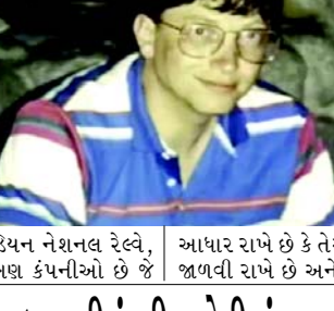
આધાર રાખે છે કે તેઓ સમય જતાં તેમના ડિવિડન્ડ ચૂકવણીને જાળવી રાખે છે અને વધે છે.

નોંધપાત્ર રીતે, ગેટ્સના પોર્ટફોલિયોમાં ૭૦%થી વધુ શેરો (૨૪માંથી ૧૭) ડિવિડન્ડ ચૂકવે છે, જે આવક-ઉત્પાદક રોકાણો માટેની તેમની પસંદગીને પ્રકાશિત કરે છે. કેનેડિયન નેશનલ રેલવે, જે આવક-ઉત્પાદક રોકાણો માટેની તેમની પસંદગીને પ્રકાશિત કરે છે. કેનેડિયન નેશનલ રેલવે, જે આવક-ઉત્પાદક રોકાણો માટેની તેમની પસંદગીને પ્રકાશિત કરે છે. કેનેડિયન નેશનલ રેલવે, જે આવક-ઉત્પાદક રોકાણો માટેની તેમની પસંદગીને પ્રકાશિત કરે છે. કેનેડિયન નેશનલ રેલવે, જે આવક-ઉત્પાદક રોકાણો માટેની તેમની પસંદગીને પ્રકાશિત કરે છે.