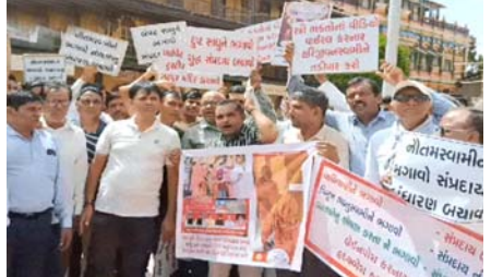
સમિતિ દ્વારા વિરોધ કરવામાં આવી રહ્યો છે. મંદિરમાં લંપટ સંતો સામે બેનરો લગાવી નારેબાજી કરવામાં આવી હતી. બેનરોમાં આ પાખંડી સંતોને દૂર કરવાની માગ કરાઈ રહી છે. ઉલ્લેખનીય છે કે, વધુ એક સ્વામીની પાપલીલા સામે આવી છે. જેમાં રાજકોટની યુવતી સાથે ખોટા લગ્ન કરી ધર્મવ્યવહાર સામે આવીને વારંવાર દુષ્કર્મ આચર્યું હતું તેમજ હોસ્તેલ સંચાલકે દેવા પીવાવાળી ગર્ભપાત કરાવ્યો હતો. સ્વામીનારાયણ સંપ્રદાયના સાધુઓના અશ્લિલ વીડિયો વાઈરલ થયા છે. વડતાલ, ગઢડા

(સંવાદદાતા દ્વારા) અમદાવાદ, તા. ૧૬ સ્વામીનારાયણ સંપ્રદાયના લંપટ સાધુઓના એક પછી એક કરતૂતો બહાર આવી રહ્યા છે. લંપટાઈ કરતા વીડિયોસુધી વિરૂદ્ધના કૃત્ય કરતા સંતોના વીડિયો સામે આવતા હરિભક્તોમાં ભારે રોષ ભૂમ્કો ઉઠ્યો છે. જેને લઈ ભક્તો હવે ધર્મને બચાવવા માટેનો આવા છે. ત્યારે ગઢડા સ્વામિનારાયણ ગોપીનાથ મંદિરે મોટી સંખ્યામાં હરિભક્તોએ છાજિયાં લઈ વિરોધ પ્રદર્શન કર્યું હતું. આ સાથે જ ટ્રસ્ટીઓને આવેદનપત્ર આપી લંપટ સાધુઓને હટાવવાની માગ સાથે ૭ દિવસનું અલ્ટીમેટમ આપવામાં આવ્યું છે. વડોદરામાં ત્રણ સ્વામી વિરુદ્ધ થયેલી દુષ્કર્મની ફરિયાદ તેમજ ગઢડામાં સુષ્ટિ વિરુદ્ધનાં કાર્યો સહિતની બાબતોને લઈને હરિભક્તોમાં સતત વિરોધ વધતો જાય છે. ત્યારે આજે સ્વામીઓની લંપટલીલા અને વાઈરલ વીડિયોને લઈ મોટી સંખ્યામાં હરિભક્તો ગઢડા મંદિર પર પહોંચ્યા હતા. જ્યાં સ્વામિનારાયણ સિદ્ધાંત હિત રક્ષક સહિતના મંદિરના સાધુઓના વીડિયો વાઈરલ થયા છે. જેના કારણે સનાતન ધર્મ અને સ્વામીનારાયણ સંપ્રદાયના હરિભક્તોમાં નારાજગી સંતોને દૂર કરવાની માગ કરાઈ રહી છે. ઉલ્લેખનીય છે કે, વધુ એક સ્વામીની પાપલીલા સામે આવી છે. જેમાં રાજકોટની યુવતી સાથે ખોટા લગ્ન કરી ધર્મવ્યવહાર સામે આવીને વારંવાર દુષ્કર્મ આચર્યું હતું તેમજ હોસ્તેલ સંચાલકે દેવા પીવાવાળી ગર્ભપાત કરાવ્યો હતો. સ્વામીનારાયણ સંપ્રદાયના સાધુઓના અશ્લિલ વીડિયો વાઈરલ થયા છે. વડતાલ, ગઢડા