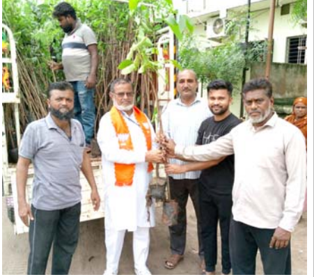
રવિવારના રોજ ‘એક પેડ માં કે નામ અંતર્ગત’ મકતમપુરા વોર્ડમાં ૭૫ જેટલા વૃક્ષોનું રોપણ કરવામાં આવ્યું હતું. જેમાં ક્તેવાડી કેનાલ પાસે ફુલેલ પાર્ક અને મીનાઝ પાર્ક સોસાયટીમાં ગુજરાત રાજ્ય હજી કમિટીના ચેરમેન ઈકબાલ સૈયદે સોસાયટીમાં આજવાનો સાથે રહી વૃક્ષારોપણ કર્યું હતું. વડાપ્રધાનની પહેલાને સ્થાનિકોએ અભિનંદન પાઠવ્યા હતા. આ પ્રસંગે કણાવતી મહાનગર માયનોરિટી મોરચાના પ્રમુખ પણ હાજર રહ્યા હતા.