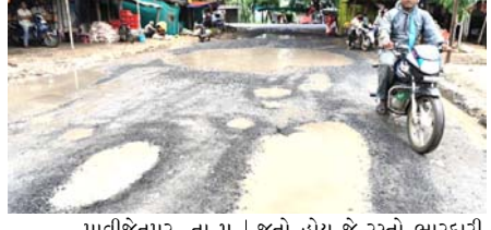
પાવીજેતપુર, તા. ૫

પાવીજેતપુર તાલુકાના સિહોદ ચોકડી ઉપર વાંકી જવાનું રસ્તા ઉપર અવર જવર કરતા હોય ત્યારે વાહન ચાલકો ત્રાહિમામ પોકારી રહ્યા છે. આજ રસ્તો સીધો લોહાન, સિથોલ, નાનિબેજ, મોટિબેજ, ડુંગરવાંટ, વાંકી, ભખપુરી, મોટા કાંટવા, ઉચાપાન, કદવાલ સુધીના ૨૦થી વધુ ગામોની જનતાને હાલાકી સામનો કરવાનો વારો આવ્યો છે. તેથી તંત્ર સિહોદ રસ્તા ઉપર પડેલા ખાડાને તાત્કાલિક પુરાવે અને ખખડખજ રસ્તાથી જનતાને છુટકારો અપાવે એવી જનતાની બુલંદ માંગ ઉઠવા પામી છે.