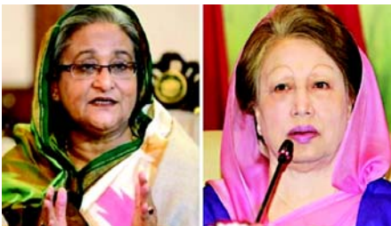
નોંધપાત્ર હિસ્સો પાકિસ્તાનમાં કાર્યરત ચીની સંસ્થાઓમાંથી આવ્યો હોવાનું માનવામાં આવે છે.

જમાત-એ-ઈસ્લામી, તેના ભારત વિરોધી વલણ માટે જાણીતી છે, તેનો હેતુ વિદ્યાર્થીઓના વિરોધને રાજકીય ચળવળમાં ફેરવવાનો હતો. ઈન્ટેલિજન્સ ઈન્ટરપ્રેટ સૂચવે છે કે ઈસ્લામી છાત્ર શિબિરના સભ્યો દ્વારા કેટલાક મહિલાઓની આ ઝીણવટપૂર્ણ આયોજન કરવામાં આવ્યું હતું. ગુમચર સૂત્રોએ જણાવ્યું હતું કે અમુક ભંગોળો