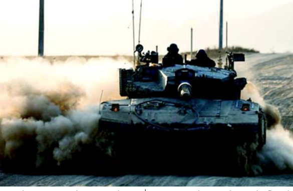
અમેરિકા દ્વારા એકમનું જાહેરમાં નામ આપવામાં આવ્યું નથી પરંતુ તે ઈઝરાયેલની નેત્લાહ યેહુદા બટાલિયન હોવાનું માનવામાં આવે છે, જે ઐતિહાસિક રીતે કબજા હેઠળના પશ્ચિમ કાંઠે સ્થિત છે.

(એજન્સી) તા.૧૦ લશ્કરી સહાય પેકેજનો એક ભાગ ઈઝરાયેલી આર્મી યુનિટને જશે, જેના પર કબજા હેઠળના પશ્ચિમ કાંઠે પેલેસ્ટીનીના ગંભીર અધિકારોના ઉલ્લંઘનોનો આરોપ છે. સ્ટેટ ડિપાર્ટમેન્ટે જણાવ્યું છે કે, યુનાઈટેડ સ્ટેટ્સ યુએસ નિર્મિત શસ્ત્રો અને લશ્કરી સાધનો પર ખર્ચ કરવા માટે ઈઝરાયેલને વધારાના $ ૩૦૦.૫ કરોડ મોકલશે, ગાઝામાં ઘાતક યુદ્ધ તેના ૧૦મા મહિનામાં ચાલુ છે અને વ્યાપક ઈઝરાયેલી લશ્કરી દુરૂપયોગના દાવાઓ વચ્ચે તેણે પેલેસ્ટીની પ્રદેશ પર કબજો જમાવ્યો છે. રાજ્ય વિભાગના પ્રવક્તાએ જણાવ્યું હતું કે વિભાગે અમેરિકા કોંગ્રેસને સૂચિત કર્યું હતું કે બિઝનેસ વહીવટીતંત્ર ઈઝરાયેલને અબજો ડોલરનું વિદેશી લશ્કરી પિરાણા મુક્ત કરવાનો ઈરાદો ધરાવે છે. યુએસ પ્રોડક્ટ્સ મીડિયાએ સૌપ્રથમ ભંડોળના પ્રકાશન અંગે અહેવાલ આપ્યો હતો, જે એપ્રિલમાં કોંગ્રેસ દ્વારા પસાર કરાયેલ ઈઝરાયેલ માટે $ ૧૪૦૦.૫ કરોડ પૂરક ભંડોળ બિલમાંથી આવે છે. પૂરક બજેટ ઈઝરાયેલને $૩૦૦ કરોડની વાર્ષિક યુએસ લશ્કરી સહાય ઉપરાંત છે. નવી નાણાકીય સહાયનો એક ભાગ ઈઝરાયેલી લશ્કરી એકમને જશે, જેના પર કબજા હેઠળના વેસ્ટ બેંકમાં પેલેસ્ટીની સામે માનવ અધિકારોનું ઉલ્લંઘન કરવાનો આરોપ છે. સ્ટેટ ડિપાર્ટમેન્ટે જણાવ્યું હતું કે તેણે એકમને પ્રતિબંધિત કરવા વિરુદ્ધ નિર્ણય લીધો છે, જે ઈઝરાયેલી સૈન્યને પ્રથમવાર સહાય અવરોધિત કરત. “આ એકમ દ્વારા ઉલ્લંઘન” ને સંબોધવા માટેના ઈઝરાયેલી પ્રયાસોથી સંતુષ્ટ છે જેને “અસરકારક રીતે સુધારેલ છે.”