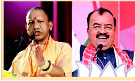
ભાજપના આંતરિક સૂત્રો કહે છે કે યુપી સીએમ યોગી અને તેમના નાયબ મૌર્ય વચ્ચે 'કામચલાઉ ચુકવિરામ' ૧૦ વિધાનસભા બેઠકો માટે પેટાયૂંટણી સુધી ચાલુ રહેવાની સંભાવના છે, જેથી સમાજવાદી પાર્ટી દ્વારા કરવામાં આવેલા આક્રમણને અટકાવી શકાય

ઉત્તર પ્રદેશના નાયબ મુખ્ય પ્રધાન કેશવ મૌર્યએ રાજ્યમાં "વધતા ભ્રષ્ટાચાર" અને "સાયબર ક્રાઈમની વધતી ઘટનાઓ" ને સમાપ્ત કરવા ટોચના પોલીસ અધિકારીને આપેલા સૂચનો, શાસક ભારતીય જનતા પાર્ટીના મુખ્યપ્રધાન યોગી આદિત્યનાથ અને નાયબ મુખ્યપ્રધાન વચ્ચે સતત સત્તાની ટક્કરનો નવો સંકેત છે. જેના કારણે રાજકીય વર્તુળોમાં ભ્રમર ઉભા થયા છે. એસીએસ (હોમ) ટીપક કુમાર, ડીજીપી પ્રશાંત કુમાર અને અન્ય વરિષ્ઠ અધિકારીઓ સાથેની બેઠક પછી મૌર્યએ સોમવારે સવારે એક્સ (અગાઉ ટ્રિબ્યુટર) પરની પોસ્ટમાં જાહેરમાં તેમની સૂચનાઓની નોંધ કરી. રાજકીય વર્તુળોમાં વધતા ભ્રષ્ટાચાર અને સાયબર ક્રાઈમ અંગેના તેમના સંદર્ભને યોગી પર છુપા હુમલા તરીકે જોવામાં આવે છે, જેઓ ગુહ બાબતોનો પોર્ટફોલિયો ધરાવે છે.