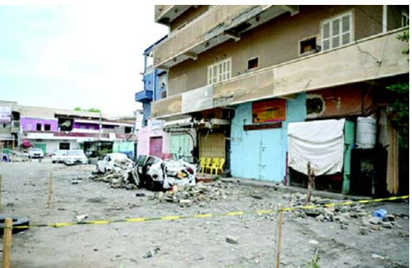
તેમણે ઉમેર્યું, “હું આશા રાખું છું કે, મારા આગામી અહેવાલ દ્વારા, હું તે અથવા તે વ્યક્તિઓમાંથી કેટલાક લોકો જે આ માટે સૌથી વધુ જવાબદાર છે તેમના ધરપકડના વોરંટ માટેની અરજીઓ જાહેર કરી શકી.”

(એજન્સી) તા.૧૦ આંતરરાષ્ટ્રીય કોર્ટ દ્વારા અદાલત (આઈસીસી) ફરીયાદી, કરીમ ખાને ડાર્ફર પ્રદેશમાં “છ મહિનાના દુઃખ”નો સંદર્ભ આપતા જણાવ્યું હતું કે, સુદાનમાં પરિસ્થિતિ બગડી રહી છે. કેબુઆરીથી જુલાઈ સુધીમાં ડાર્ફરની પરિસ્થિતિ અંગેના તેમનો તાજેતરનો અહેવાલ રજૂ કરતાં ખાને યુએન સિક્યુરિટી કાઉન્સિલને જણાવ્યું હતું કે તે “ડાર્ફરના લોકો માટે આ ભયંકર છે મહિના દુઃખના અને ત્રાસના મહિના રહ્યા છે.” અહેવાલમાં ડાર્ફરની પરિસ્થિતિને “ગહન માનવીય દુર્ઘટના” તરીકે દર્શાવવામાં આવી છે, ખાને ભારપૂર્વક જણાવ્યું હતું કે છેલ્લા છ મહિનામાં બળાત્કાર, બાળકો સામેના ગુનાઓ અને સંવેદનશીલ નાગરિકોના વધતા અહેવાલો સાથે પરિસ્થિતિ વધુ બગડી રહી છે. તેમણે કહ્યું, “હું આ પ્રકારના ગુનાઓને લગતા આરોપોને પ્રાથમિકતા આપું છું જે ઐતિહાસિક રીતે સુદાનમાં અને વિશાળ વિશ્વમાં અપ્રમાણસર રીતે સૌથી વધુ સંવેદનશીલ છે, જે અમારી વસ્તીના સૌથી સંવેદનશીલ પાસાને અસર કરે છે.” ડાર્ફરને “ખૂબ જ અંધકારમય સ્થળ” તરીકે વર્ણવતા, ICC વડીલે કહ્યું કે તેમ છતાં અહેવાલમાં “કેટલીક પ્રગતિ” અને ICC તે લોકોની “તપાસ” કરી રહી છે જેઓ ડાર્ફરમાં ચાલી રહેલા સંઘર્ષ માટે જવાબદાર “સહાય અને પ્રોત્સાહન” આપી રહ્યા છે.