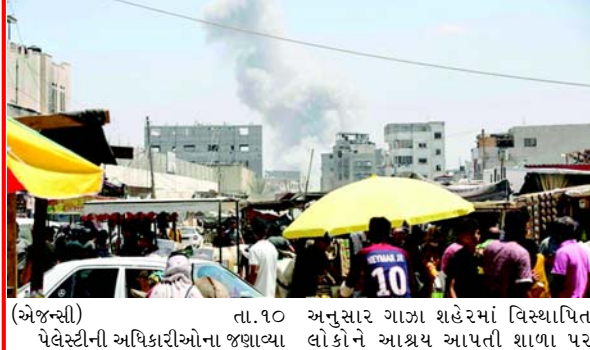
(એજન્સી) તા.૧૦ અનુસાર ગાઝા શહેરમાં વિસ્થાપિત પેલેસ્ટીની અધિકારીઓના જણાવ્યા લોકોને આશ્રય આપતી શાળા પર

ગાઝાની સિવિલ ડિકેન્સ એજન્સીએ જણાવ્યું હતું કે આ લોકો નમાઝ અદા કરી રહ્યા હતા ત્યારે ઈઝરાયેલના ૨,૦૦૦ પાઉન્ડના બોમ્બ : આ જગ્યા હમાસનો અડ્ડો હતો : ઈઝરાયેલ