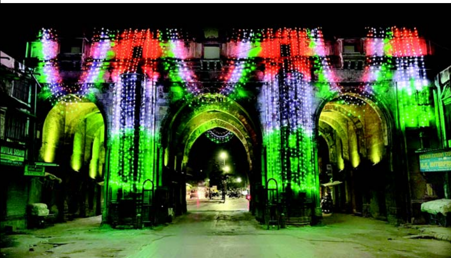
દેશભરમાં આઝાદીના પર્વની તૈયારીઓ પૂરજોશમાં ચાલી રહી છે. આઝાદીના પર્વની ઉજવણીમાં દેશની શાન સમા છે તિરંગો. તિરંગાના ત્રણ રંગો ભારતની ભવ્યતાની ઝાંખી કરાવે છે. અમદાવાદ શહેરને હેરિટેજ સિટીનો દરજ્જો મળ્યો છે. અહીં અનેક સ્થાપત્યો પૈકી પ્રસિદ્ધ ત્રણ દરવાજા અમદાવાદની શાન પૈકી એક છે. ૧૫મી ઓગસ્ટ એટલે કે સ્વતંત્રતા દિવસ પૂર્વે ત્રણ દરવાજા પર તિરંગાના રંગો લઈ રોશનીનો જગમગાટ કરવામાં આવ્યો છે. જે રોશનીથી ઝળહળી ઉઠતાં નયનરમ્ય નજારો જોવા મળે છે. પ્રસ્તુત તસવીરમાં આ દેશ્ય દેશ્યમાન થાય છે જે ભારતની અને અમદાવાદની ભવ્યતાના દર્શન કરાવે છે.