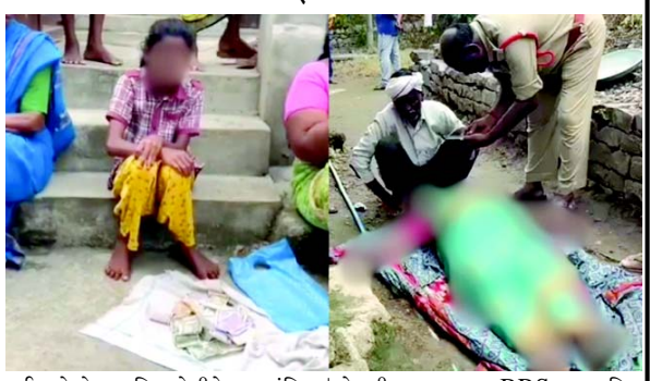
યઈ રહ્યો છે. સ્થાનિક પોલીસે પણ અંતિમ સંસ્કાર માટે થોડી રકમ દાનમાં આપી હતી. બાદમાં યુવતીએ સ્થાનિક રહેવાસીઓની મદદથી તેની માતાના અંતિમ સંસ્કાર કર્યા હતા. ભારત રાષ્ટ્ર સમિતિ (BRS) ના કાર્યકારી પ્રમુખ કેટી રામા રાવે સોશિયલ મીડિયા પ્લેટફોર્મ 'X' પર જણાવ્યું હતું કે

(એજન્સી) તેલંગાણાના નિર્મલ જિલ્લાના એક ગામમાં રવિવારે એક મહિલાએ કથિત રીતે આત્મહત્યા કરી હતી. જેના પગલે મહિલાની ૧૨ વર્ષની પુત્રીએ પૈસાના અભાવે દાન તરીકે મળેલા પૈસાથી તેની માતાના અંતિમ સંસ્કાર કર્યા હતા. પોલીસ અધિકારીઓએ આ જાણકારી આપી. તેણે કહ્યું કે છોકરીના પિતાનું પહેલા જ નિધન થઈ ચૂક્યું છે. પોલીસના જણાવ્યા અનુસાર, બાળકીની માતાએ ગુરૂવારે રાત્રે કથિત રીતે ફાંસી લગાવીને આત્મહત્યા કરી હતી. તે સમયે યુવતી નજીકમાં જ તેની માસીના ઘરે સૂતી હતી. અધિકારીઓએ જણાવ્યું હતું કે, દુઃખી છોકરી તેના ઘરની બહાર લાચાર બનીને બેઠી હતી કારણ કે તેની પાસે અંતિમ સંસ્કાર માટે પૈસા ન હતા અને સ્થાનિક રહેવાસીઓએ તેને દાન તરીકે પૈસા આપ્યા હતા. આ ઘટનાનો હૃદય સ્પર્શી વીડિયો સોશિયલ મીડિયા પર વાયરલ