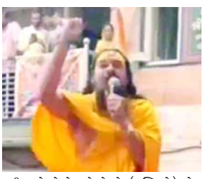
કહી રહ્યો છે કે, જો તેઓ (મુસ્લિમો) એક હિન્દુને મારી નાખશે તો અમે ૧૦૦ મુસ્લિમોને

(એજન્સી) બાલોત્રા, તા. ૧૯ રાજસ્થાનના બાલોત્રા વિસ્તારમાં એક હિન્દુ સાધુએ મુસ્લિમ સમુદાય વિરુદ્ધ ભડકાઉ ભાષણ આપીને કોમી તણાવમાં વધારો કર્યો છે. મુસ્લિમ વિરોધી નકરતનું ભાષણ શનિવારે ૧૭ ઓગસ્ટના રોજ આપવામાં આવ્યું હતું જ્યારે સાધુ એક વિશાળ સભાને સંબોધિત કરી રહ્યા હતા. તેમણે મુસ્લિમોને 'રાક્ષસ અને નરભક્ષક' તરીકે ઓળખાવ્યા, જ્યારે તેમની સામે સામુદાયિક હિંસા કરવા માટે આહવાન કર્યું. સોશિયલ મીડિયા પર સામે આવી રહેલા એક વીડિયોમાં સાધુ કથિત રીતે ત્રિરંગો અને ભગવા ધ્વજ ધરાવતા ભીડને સંબોધતા જોઈ શકાય છે. તે