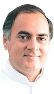
ગાંધીએ તેને દેશના દરેક ગામડાઓમાં અને શહેરોમાં લાવ્યું કરાવી હજારો બહેનોને રાજકારણમાં સંભાવનાઓનું આકાશ ઉડાવવા માટે ખુલ્લું કરી આપ્યું છે.

અમદાવાદ, તા. ૧૯ “ સાચું ભારત ગામડાઓમાં વસે છે ” યુગપુરુષ મહાત્મા ગાંધીની માનવીય અભિગમની આ ભાવનાને પોતાના જીવનમાં ઉતારી બંધારણ અને લોકશાહીનાં રક્ષણ માટે વિચારશીલ મહાપુરુષ એવા દેશનાં છઠ્ઠા સૌથી યુવાન વડાપ્રધાન સ્વ. રાજીવ ગાંધીની જન્મજયંતી નિમિત્તે સ્થાનિક સ્વરાજ્યની સંસ્થાઓ સાથે જોડાયેલ દરેક સ્ત્રીઓએ તેમને પોતાના ચાહુ કાર્યકાળમાં જ અનામત આપવા બદલ તેમનો આભાર માનવો જોઈએ. માત્ર કાળજી પર જ સ્ત્રીઓને દેશનાં સંચાલનમાં અનામત આપવાની જગ્યાએ સ્વ. રાજીવ