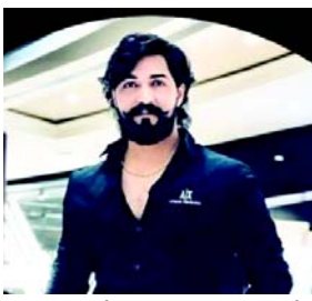
ગયા હતા અને મામલાની તાત્કાલિક નોંધ લીધી હતી અને પીઝિટ આઈએમએસ પોલીસ સ્ટેશનમાં આરોપી યુવક વિરુદ્ધ એક આઈઆર નોંધી હતી. કાઉન્સેલિંગની સાથે વિદ્યાર્થીના પરિવારજનો અને એડવોકેટ સમક્ષ વિદ્યાર્થીની મેડિકલ તપાસ પણ કરવામાં આવી હતી. પીઝિટ વિદ્યાર્થીનું નિવેદન મેજિસ્ટ્રેટ સમક્ષ નોંધવામાં આવ્યું છે. ફરિયાદમાં પીઝિટ યુવતીએ જણાવ્યું કે ૧૬ ઓગસ્ટના રોજ

આરોપી ડોક્ટર તેનું પીઝિટ આઈએમએસથી અપહરણ કરીને તેને અંબાલા અને ચંદીગઢ લઈ ગયો અને આ દરમિયાન આરોપીઓએ તેની પર ત્રાસ ગુજાર્યો અને મારપીટ પણ કરી. પ્રાથમિક તપાસમાં જાણવા મળ્યું છે કે પીઝિટ વિદ્યાર્થી અને આરોપી ડોક્ટરને પીઝિટ આઈએમએસના કોર્ટમાં રજૂ કરવામાં આવશે. પીઝિટ વિદ્યાર્થીની બીડીએસનો અભ્યાસ કરે છે જ્યારે આરોપી ડોક્ટર એનાટોમી શીખવે છે. બંને એકબીજાને લગભગ ૫-૬ મહિનાથી ઓળખે છે. યુવતીના નિવેદન અને તપાસમાં અત્યાર સુધી જાતીય સતામણી/બળાત્કારનો કોઈ કેસ બહાર આવ્યો નથી. મામલાની ગંભીરતા જોઈને પોલીસે દરરોડો પાડી આરોપી ડોક્ટરની ધરપકડ કરી હતી અને આવતીકાલે તેને કોર્ટમાં રજૂ કરવામાં આવશે. મામલાની ઉડાણપૂર્વક તપાસ કરવામાં આવી રહી છે. પોલીસે પીઝિટ અને તેના પરિવારના સતત સંપર્કમાં છે અને તેને શક્ય તમામ મદદ પૂરી પાડવામાં આવી રહી છે.