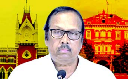
મેડિકલ કોલેજ અને હોસ્પિટલના પૂર્વ પ્રિન્સિપાલની કરડોડિયલ પૂછપરછ કરવાની માંગ કરી હતી, જેથી મહિલા ડોક્ટર સાથે બનાવકાર અને હત્યાની તપાસમાં વધુ માહિતી મેળવી શકાય.

(એજન્સી) કોલકાતા, તા. ૧૯ તૃણમૂલ કોંગ્રેસના વરિષ્ઠ સાંસદ સુખેન્દુ શેખર રોયે સોમવારે કોલકાતા પોલીસ દ્વારા મોકલવામાં આવેલી નોટિસને પડકારતી કલકત્તા હાઈકોર્ટમાં અરજી કરી હતી. આ નોટિસ તેમના દ્વારા સોશિયલ મીડિયા પર કરવામાં આવેલી એક પોસ્ટના સંદર્ભમાં મોકલવામાં આવી છે, જેમાં તેમણે આર.જી. કાર મેડિકલ કોલેજ અને હોસ્પિટલના ડોક્ટર પર કથિત બનાવકાર અને હત્યાના મામલામાં સવાલ ઊઠાવ્યા હતા. કોલકાતા પોલીસે રવિવારે તેને નોટિસ જારી કરી હતી, જેમાં તેને પૂછપરછ માટે હાજર થવા માટે કહેવામાં આવ્યું હતું. રોયના વકીલે આ નોટિસને પડકારવા માટે હાઈકોર્ટમાં પિટિશન દાખલ કરવાની પરવાનગી માંગી હતી, જેને જસ્ટિસ રાજીવ બારદ્વાજે મંજૂર કરી હતી. આ કેસની સુનાવણી મંગળવારે હાથ ધરાશે. સુખેન્દુ શેખર રોયે પોતાની સોશિયલ મીડિયા પોસ્ટમાં સીબીઆઈને કોલકાતાના પોલીસ કમિશનર અને આર.જી. કાર