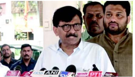
પક્ષમાં જોડાઈ શકે છે. જેએમએમના કેટલાક અન્ય ધારાસભ્યો પણ સોરેનના સંપર્કમાં છે.

થવાની રાહ જોવાઈ રહી છે. બીજી તરફ ચૂંટણી પહેલાં જ પક્ષપલટો શરૂ થઈ ગઈ છે. મહારાષ્ટ્રમાં એનસીપી, શિવસેના, શિવસેના-યુબીટી, ભાજપ, કોંગ્રેસ અને એનસીપી-એસપીના નેતાઓ પક્ષ બદલતા જોવા મળ્યા છે. બીજી તરફ ઝારખંડના પૂર્વ સીએમ ચંપાઈ સોરેન વિશે એવા સમાચાર છે કે, તેઓ આજે એટલે કે ૧૮મી ઓગસ્ટે દિલ્હીમાં ભાજપ નેતાઓને મળી શકે છે અને કેન્દ્રમાં સત્તાધારી