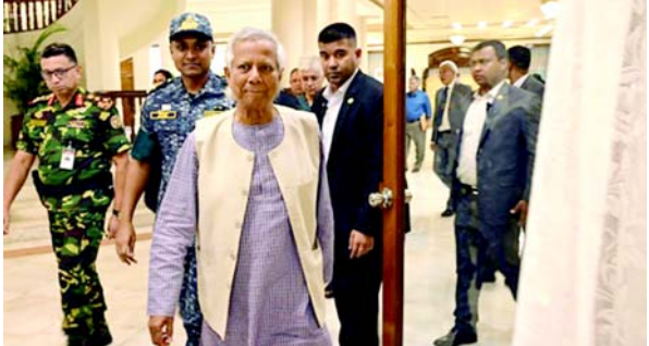
વિદ્યાર્થી વિરોધ નેતાઓની મુખ્ય માંગને પૂર્ણ કરે છે. તેમના પુરોગામી શેખ હસીના ૧૫ વર્ષ સત્તામાં રહ્યા પછી પ ઓગસ્ટના રોજ હેલિકોપ્ટર દ્વારા દેશમાંથી ભાગી ગયા હતા, જેમણે સરકાર વિરોધી વિરોધને કારણે પદ ત્યાગ કર્યા હતા. અશાંતિ અને સામૂહિક વિરોધના અઠવાડિયા કે સંયુક્ત રાષ્ટ્રની ઉભલાવી નાખ્યા તેમાં પણ દેશના તપાસનો વિષય છે. આ મહિનાની શરૂઆતમાં તબીબી ચેરિટી ડેક્રેટર્સ વિઝાઉટ બોર્ડર્સ, જે તેના કેન્દ્ર નામ MSF દ્વારા ઓળખાય છે તેણે જણાવ્યું હતું કે પશ્ચિમી રખાઈન રાજ્યમાં લશ્કર અને બળવાખોર અરાકાન આર્મી (AA) વચ્ચે વધતા સંઘર્ષ વચ્ચે યુદ્ધ સંબંધિત ઈજાઓ સાથે વધુ રોહિંગ્યા મ્યાનમારથી બાંગ્લાદેશ આવી રહ્યા છે. એક નિવેદનમાં ઉમેર્યું હતું કે, કાયલામાં ૪૦ ટકાથી વધુ મહિલાઓ અને બાળકો છે. ૮૪ વર્ષીય નોબેલ શાંતિ પુરસ્કાર વિજેતા અર્થશાસ્ત્રી યુનુસ આ મહિને યુરોપથી પરત ફર્યા હતા જ્યારે તેમને રાષ્ટ્રપતિ મોહમ્મદ શહાબુદ્દીન દ્વારા વચગાળાની સરકારનું નેતૃત્વ કરવા માટે પસંદ કરવામાં આવ્યા હતા, જે

(એજન્સી) બાંગ્લાદેશના વચગાળાના નેતા મુહમ્મદ યુનુસે તેમનું પ્રથમ મુખ્ય સરકારી નીતિ સંબોધન કર્યું હતું જેમાં તેમણે દેશમાં આશ્રય મેળવતા રોહિંગ્યા સમુદાયને સમર્થન આપવા અને બાંગ્લાદેશના કાપડના વેપારને જાળવી રાખવાનું વચન આપ્યું હતું. રાજદ્રોહીઓ અને યુએનના પ્રતિનિધિઓ સમક્ષ પોતાની પ્રાથમિકતાઓ નક્કી કરતાં યુનુસે વચન આપ્યું હતું કે તેમની સરકાર 'બાંગ્લાદેશમાં આશ્રય પામેલા લાખથી વધુ રોહિંગ્યા લોકોને સમર્થન આપવાનું ચાલુ રાખશે'. તેમણે કહ્યું, 'અમને રોહિંગ્યા માનવતાવાદી કામગીરી માટે આંતરરાષ્ટ્રીય સમુદાયના સતત પ્રયત્નોની જરૂર છે અને તેમના વતન, મ્યાનમારમાં, સલામતી, ગૌરવ અને સંપૂર્ણ અધિકારો સાથે તેમના સ્વદેશ પરત ફરવાની જરૂર છે.' બાંગ્લાદેશમાં લગભગ ૧૦ લાખ રોહિંગ્યા રહે છે. તેમાંથી મોટાભાગના ૨૦૧૭માં સૈન્ય કેડકાઉન પછી પડોશી મ્યાનમાર ભાગી ગયા હતા જે હવે સંયુક્ત રાષ્ટ્રની અદાલત દ્વારા નરસંહારની તપાસનો વિષય છે. આ મહિનાની શરૂઆતમાં તબીબી ચેરિટી ડેક્રેટર્સ વિઝાઉટ બોર્ડર્સ, જે તેના કેન્દ્ર નામ MSF દ્વારા ઓળખાય છે તેણે જણાવ્યું હતું કે પશ્ચિમી રખાઈન રાજ્યમાં લશ્કર અને બળવાખોર અરાકાન આર્મી (AA) વચ્ચે વધતા સંઘર્ષ વચ્ચે યુદ્ધ સંબંધિત ઈજાઓ સાથે વધુ રોહિંગ્યા મ્યાનમારથી બાંગ્લાદેશ આવી રહ્યા છે. એક નિવેદનમાં ઉમેર્યું હતું કે, કાયલામાં ૪૦ ટકાથી વધુ મહિલાઓ અને બાળકો છે. ૮૪ વર્ષીય નોબેલ શાંતિ પુરસ્કાર વિજેતા અર્થશાસ્ત્રી યુનુસ આ મહિને યુરોપથી પરત ફર્યા હતા જ્યારે તેમને રાષ્ટ્રપતિ મોહમ્મદ શહાબુદ્દીન દ્વારા વચગાળાની સરકારનું નેતૃત્વ કરવા માટે પસંદ કરવામાં આવ્યા હતા, જે