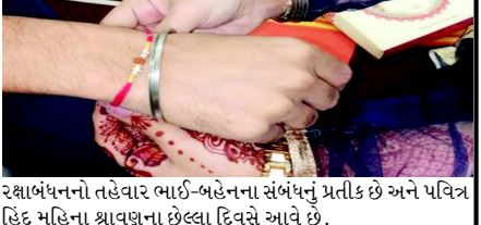
રક્ષાબંધનનો તહેવાર ભારી-બહેનના સંબંધનું પ્રતીક છે અને પવિત્ર હિંદુ મહિના શ્રાવણના છેલ્લા દિવસે આવે છે.

(એજન્સી) તા. ૧૯ દિલ્હી યુનિવર્સિટીના કેટલાક વિદ્યાર્થીઓએ સોમવારે જૂની દિલ્હીની જામા મસ્જિદમાં મુસ્લિમ પુરૂષો, સ્ત્રીઓ અને બાળકો સહિત પસાર થતા લોકોને રાખડી બાંધીને રક્ષાબંધનની ઉજવણી કરી. ક્રાંતિકારી યુવા સંગઠનના સભ્યો દ્વારા 'ક્રોમી સમરસતાની રાખડી બાંધો' કાર્યક્રમનું આયોજન કરવામાં આવ્યું હતું. આ સંગઠન દિલ્હી યુનિવર્સિટીનું વિદ્યાર્થી સંગઠન છે જે મજબૂત વર્ગ અને હાસિયામાં ધકેલાઈ ગયેલા વર્ગનું પ્રતિનિધિત્વ કરે છે. વિદ્યાર્થીઓએ સાંપ્રદાયિક સૌહાર્દનો સંદેશ આપવા માટે ભૂરખા પહેરેલી મહિલાઓ અને પરંપરાગત કેપ પહેરેલા પુરૂષોને રાખડી બાંધી હતી.