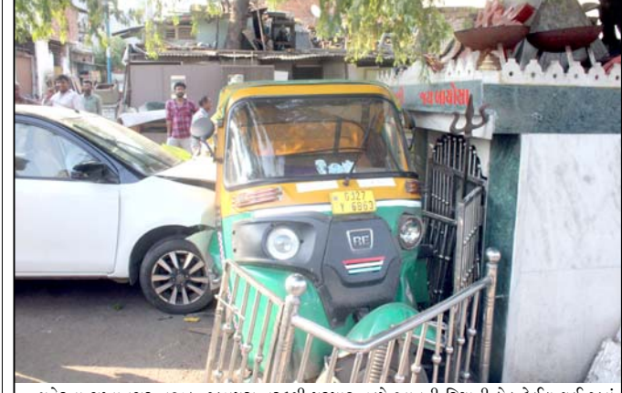
શહેરના ગુલાનગર નજીક જુહાપુરા તરફથી પૂરપાટ ઝડપે આવતી રિક્ષાની ફેર ફેઈલ થઈ જતાં રોડ ઉપર આવેલ એક ધાર્મિક સ્થળના ઓટલા ઉપર ચડી જઈ બે રાઉન્ડ ગોળ ફેરી પાસે ઉભેલી કારની વચ્ચે ઘૂમી રહ્યાં ઉભી રહી જતાં જોનારા લોકોને આ ક્રી રીતે થયું ? તે સમજવું ભારે થઈ પડ્યું હતું. જ્યારે રિક્ષામાં સવાર મુસાફરો અને રિક્ષા ડ્રાઈવર ઈજાગ્રસ્ત થતા સારવાર અર્થે ખસેડવામાં આવ્યા હતા. જ્યારે મોડી સાંજે કેનની મદદથી રિક્ષાને બહાર કાઢવામાં આવી હતી.