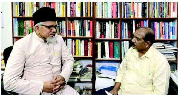
સંગઠનો સામે તમને શું પડકારો લાગે છે ?

(એજન્સી) જમાત-એ-ઈસ્લામી હિંદના ઉપ-પ્રમુખ પ્રો. સલીમ એન્જિનિયર એક આંતર-ધર્મ નેતા છે જે વિવિધ ધર્મ જુથોના સભ્યો વચ્ચે સાંપ્રદાયિક સંવાદિતા અને પરસ્પર સમજણને પ્રોત્સાહન આપે છે. તેઓ ફોરમ ફોર ડેમોક્રેસી એન્ડ કોમ્યુનલ એમિટી (FDCA) ના જનરલ સેક્રેટરી અને ધાર્મિક નેતાઓના સંયુક્ત રાષ્ટ્રીય મંચ, કેન્દ્રીય ધાર્મિક જન મોરચાના રાષ્ટ્રીય સંયોજક પણ છે. તેઓએ MOHD નોશાદ પાન સાથેની એક મુલાકાતમાં સાંપ્રદાયિક સંવાદિતાને પ્રોત્સાહન આપવા અને શાંતિ અને સાંપ્રદાયિક સોહાર્દ ધરાવતા ભારતનું નિર્માણ કરવા માટે સમગ્ર ભારતમાં સ્થાનિક સ્તરે શરૂ કરાયેલ સદ્ભાવના મંચ વિશે વાત કરી હતી.