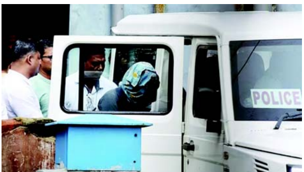
પોલીસ કમિશનર, કોલકાતાના નામે રજીસ્ટર કરવામાં આવી હતી. સોશિયલ મીડિયા પરના કેટલાક લોકો આની આસપાસ મૂંઝવણ ઊભી કરવાનો પ્રયાસ કરી રહ્યા છે, કોલકાતા પોલીસના તમામ સરકારી વાહનો વિવિધ એકમોને સોંપવામાં આવે તે પહેલાં સત્તાવાર રીતે પોલીસ કમિશનર હેઠળ નોંધવામાં આવે છે. મહિલા ઇ ઓગસ્ટના રોજ હોસ્પિટલના સેમિનાર હોલમાં મૃત હાલતમાં મળી આવી હતી. તે ઉદ્ કલાકની લાંબી શિફ્ટ દરમિયાન ત્યાં સૂવા ગઈ હતી. તેના શબપરીક્ષણમાં બાળાત્કાર અને ૨૫

(એજન્સી) તા. ૨૭ કોલકાતા બાળાત્કાર અને હત્યા : મહિલા ઇ ઓગસ્ટના રોજ હોસ્પિટલના સેમિનાર હોલમાં મૃત હાલતમાં મળી આવી હતી. કોલકાતા ડોક્ટર બાળાત્કાર-હત્યા : સંજય રોય, કોલકાતા પોલીસના નાગરિક સ્વયંસેવક કે જેના પર આરજી કર મેડિકલ કોલેજ અને હોસ્પિટલના ડોક્ટર પર બાળાત્કાર અને હત્યા કરવાનો આરોપ છે, તે પોલીસ કમિશનરના નામે નોંધાયેલ મોટરસાઈકલનો ઉપયોગ કરતો હતો. આ કેસની તપાસ કરી રહેલી સીબીઆઈ કોલકાતા પોલીસમાં તેના કનેક્શનની તપાસ કરી રહી છે. દરમિયાન, મીડિયા અહેવાલો અને સોશિયલ મીડિયામાં માહિતી બહાર આવતા, કોલકાતા પોલીસે એક નિવેદન બહાર પાડ્યું. તેઓએ કબુલ્યું હતું કે બાઈક પોલીસ કમિશનરના નામે નોંધાયેલ છે. જો કે, તેઓએ કહ્યું કે પોલીસ કમિશનરના નામે તમામ સરકારી વાહનોની નોંધણી કરવાની પ્રમાણભૂત પ્રથા છે. 'સંજય રોય દ્વારા ઉપયોગમાં લેવાતી બાઈક-આરજી કર હોસ્પિટલના કથિત જાતીય શોષણ અને હત્યા કેસમાં મોંઘા આરોપી- જે સીબીઆઈને સોંપવામાં આવે તે પહેલા કોલકાતા પોલીસે કબજે કરી હતી, તે