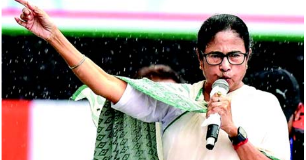
ફાયરિંગ કરવાનું કાવતરું છે. આવતીકાલે પરીક્ષાઓ છે. શું વિદ્યાર્થીઓ આવું કરી શકે છે ? તેઓ રાજકારણ કરી રહ્યા છે. ભટ્ટાચાર્યએ જણાવ્યું કે, આવા વિરોધ માટે પોલીસ પાસેથી કોઈ પરવાનગી માંગવામાં આવી નથી. વિરોધ પ્રદર્શનો થઈ શકે છે પરંતુ તેઓએ પરવાનગી લેવી પડશે અને તેઓ નિયુક્ત સ્થળોએ શાંતિપૂર્ણ રીતે યોજવા જોઈએ. ટીએમસીના નેતા કુષાલ ઘોષે રાજ્ય સચિવાલયમાં રેલી પાછળના હેતુઓ પર સવાલ ઉઠાવ્યા, અને વિદ્યાર્થીઓને પૂછ્યું કે તેઓ સીબીઆઈ ઓફિસ તરફ ક્યૂ થા માટે કરી રહ્યા નથી, કારણ કે એજન્સીએ તપાસ શરૂ કરી છે. ઘોષે રેલીમાં હિંસાની હિમાયત કરતા બે વ્યક્તિઓને કથિત રીતે દર્શાવતા વિડિયો પણ રજૂ કર્યા હતા.

(એજન્સી) તા. ૨૭ કોલકાતાની આરજી કર મેડિકલ કોલેજ અને હોસ્પિટલમાં પોસ્ટ ગ્રેજ્યુએટ ડોક્ટરની બાળાત્કાર અને હત્યા અંગે ભારે હોબાળા વચ્ચે, તુષ્ટમૂલ કોંગ્રેસે પશ્ચિમ બંગાળના મુખ્યપ્રધાન મમતા બેનરજીના રાજીનામાની હાકલ વચ્ચે તેણીનો બચાવ કર્યો છે અને વિપક્ષની આ માંગને 'પિતૃસત્તાક' ગણાવી છે. ટીએમસીએ પ્રશ્ન કર્યો હતો કે જ્યારે તેમના રાજ્યોમાં જુવન્ય ગુનાઓ થાય છે ત્યારે પુરૂષ મુખ્યમંત્રીઓ પર શા માટે આવા સમાન આલેખો કરવામાં આવતા નથી. ઘણી જગ્યાએ આટલી બધી ઘટનાઓ બની છે. સતત ત્રણ ચૂંટણી જીતનાર દેશના એકમાત્ર મહિલા મુખ્યમંત્રીના રાજીનામાની માંગ શા માટે ? અન્ય સ્થળોએ બનેલી ઘટનાઓ માટે કોઈ પુરૂષ મુખ્યમંત્રીના રાજીનામાની માંગ કરવામાં આવી નથી. આ પિતૃસત્તાક વલણ છે.