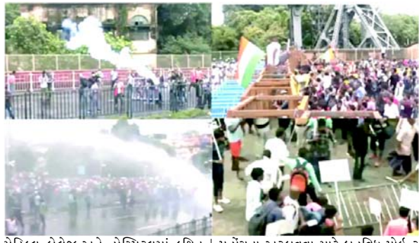
મેડિકલ કોલેજ અને હોસ્પિટલમાં કથિત બળાત્કાર અને હત્યા કેસ અંગે મુખ્યમંત્રી મમતા બેનરજીના રાજીનામાની માંગ કરવાનો હતો. હાલમાં બિજા પાસે ભીડને આગળ વધવા માટે પ્રદર્શનકારીઓએ બેરિકેડને તોડવાનો પ્રયાસ કર્યો અને પોલીસ પર પથ્થરમારો કર્યો ત્યારે પોલીસ દ્વારા લાઠીચાર્જનો ઉપયોગ કરવો પડ્યો ત્યારે મુખ્ય સ્થળે જામીન પર બોલ્ટ કરીને લોકોને જવાબમાં કોલકાતા પોલીસે ચાર વ્યક્તિઓની ધરપકડ કરી જેમાં તેઓ પર પથ્થરમારો 'ગેરકાયદેસર અને અનધિકૃત' જાહેર કરાયેલા વિરોધમાં સમગ્ર શહેરમાં ભારે પોલીસ બંદોબસ્ત જોવા મળ્યો હતો. ડીસીપી સાઉથ ઈસ્ટ ક્રાંતિલાલ પાટીલે જણાવ્યું, 'આ ઘટના સોમવારે રાત્રે ૧૧:૩૦થી ૧૨:૦૦ વાગ્યાની વચ્ચે સંતોષ નગર પોલીસ સ્ટેશનની હદમાં બની હતી. પોલીસે તાત્કાલિક કાર્યવાહી કરી અને સીસીટીવી દ્વારા ટ્રેકિંગ કર્યા પછી બે લોકોને કસ્ટડીમાં લીધા. તેમાંથી એક વ્યક્તિ મુખ્ય જવાબદાર છે. મુખ્ય સ્થળે પર ૬૦૦થી વધુ કોલકાતા પોલીસ કર્મચારીઓ તેનાતી સાથે શહેર એક કિલ્લામાં પરિવર્તિત થઈ ગયું હતું. કાલીઘાટ સ્થિત મમતા બેનરજીના નિવાસસ્થાન પાસે પણ સુરક્ષા સહન કરવામાં આવી હતી. મધ્ય કોલકાતાના કોલેજ સ્વરે અને હાલમાં સંતરાગાદીથી શરૂ થયેલી રેલી વિરોધકર્તાઓને રાજ્ય સચિવાલય સુધી

પોલીસની ફૂર કાર્યવાહી મામલે ભાજપે મમતા સરકારને નિશાન બનાવી, તૃણમૂલ કોંગ્રેસે શાંતિ હોળવાનો પ્રયાસ ગણાવ્યો