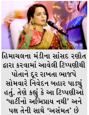
હિમાચલના મંડીના સાંસદ રણોત દ્વારા કરવામાં આવેલી ટિપ્પણીથી પોતાને દૂર રાખતા ભાજપે સોમવારે નિવેદન બહાર પાડ્યું હતું. તેણે કહ્યું કે આ ટિપ્પણીઓ 'પાર્ટીનો અભિપ્રાય નથી' અને પક્ષ તેની સાથે 'અસંમત' છે

દૈનિક ભાસ્કર સાથેના ઈન્ટરવ્યુમાં તેણીની ટિપ્પણીથી રાજકીય તોફાન ઊભું થયું છે અને ભાજપ ડેમોક્રેટીક મોડમાં આવી ગયું છે અને તેણીના મંતવ્યોથી પોતાને દૂર રાખ્યા છે. દિલ્હીમાં મીડિયા વિભાગ દ્વારા સોમવારે જારી કરાયેલ એક નિવેદનમાં પાર્ટીએ કહ્યું છે કે બેડૂતોના આંદોલનના સંદર્ભમાં કંગનાની ટિપ્પણી એ પાર્ટીનો અભિપ્રાય નથી અને તે તેની સાથે અસંમતિ વ્યક્ત કરે છે. રાજાવાતને ભવિષ્યમાં આવા નિવેદનો ન આપવાનો નિર્દેશ આપવામાં આવ્યો છે. ભાજપ "સબકા સાથ, સબકા વિકાસ, સબકા વિચારસ અને સબકા પ્રયાસ" અને સામાજિક સમરસતાના તેના સિદ્ધાંતને અનુસરવા માટે સંકલ્પબદ્ધ છે. હરિયાણા ભાજપના નેતાઓએ કોલકાતાની વિધાનસભાની ચૂંટણીમાં બેડૂતો સામેની તેણીની ટિપ્પણીથી પાર્ટીને થતા નુકસાન વિશે માહિતગાર કરવા માટે પાર્ટી હાઈકોમિશનનો સંપર્ક કર્યો હોવાનું જણવા મળ્યા પછી કેન્દ્રીય ભાજપે હસ્તક્ષેપ કર્યો છે. ઘણા BJP નેતાઓ રનોતેની ટિપ્પણીના પરિણામ વિશે ચિંતિત છે. કંગનાની આગામી ફિલ્મ ઈમરજન્ટ પ્રમોટ કરવાના હેતુ સાથે આ ઈન્ટરવ્યુની એક ક્લિપ X રવિવારના રોજ શેર કરવામાં આવી હતી અને આ અભિનેત્રી દ્વારા તેને ફરીથી પોસ્ટ કરવામાં આવી હતી. તેમાં તેણીને કહેતા સાંભળી શકાય છે કે જે બાંગ્લાદેશમાં થયું તે અહીં ભારતમાં થઈ શકે છે. જો અમારું દેશનું નેતૃત્વ મજબૂત ન હોત તો આનું થયું હોત. જ્યારે બેડૂતોએ દિલ્હીની બહાર વિરોધ પ્રદર્શન કર્યો હતો, ત્યારે ત્યાં લાશો લટકતી હતી અને બળાત્કાર થઈ રહ્યા હતા. અને, જ્યારે બેડૂતો