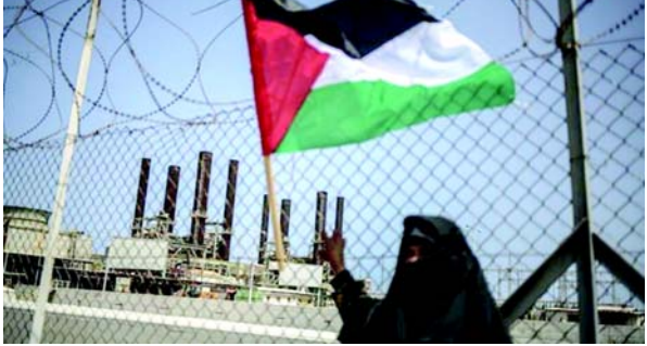
આરોપ લગાવ્યો છે. ૭ ઓક્ટોબર ઈઝરાયેલમાં હમાસ દ્વારા કરવામાં આવેલા હુમલા બાદ વેસ્ટ બેંકમાં હિંસા વધી છે. સોમવારનું નિવેદન હિંસાના દિવસો પછી આવ્યું છે, રામલલાહ સ્થિત પેલેસ્ટિનિયન આરોગ્ય મંત્રાલયે જણાવ્યું કે ઈઝરાયેલે ભુધવારે ઉત્તરી વેસ્ટ બેંકમાં એક સાથે દરોડા સુરક્ષિત નથી. અલ્બેનિઝ, યુએન માનવ અધિકાર પરિષદ દ્વારા નિયુક્ત સ્વતંત્ર નિષ્ણાત પરંતુ જેઓ યુએન વતી બોલતા નથી, તેમણે ગાઝામાં તેના સંઘર્ષમાં ઈઝરાયેલ પર નરસંહાર કરવાનો વારંવાર સમાપ્ત કરવા આહ્વાન કર્યું છે, જેનો તેણે ૧૯૯૭થી કબજો કર્યો છે. અલ્બેનિઝે જણાવ્યું કે, 'રંગભેદ ઈઝરાયેલ એક સાથે ગાઝા અને વેસ્ટ બેંકમાં નાબૂદ, બદલી અને પ્રાદેશિક વિસ્તરણની એકંદર પ્રક્રિયાના ભાગ રૂપે નિશાન બનાવી રહ્યું છે.' તેમણે જણાવ્યું કે 'લાંબા ગાળાની મુક્તિ ઈઝરાયેલને પેલેસ્ટીનથી કબજે કરેલા પેલેસ્ટીની મૃત્યુ પામ્યા છે. મધ્ય પૂર્વમાં રહી છે અને પેલેસ્ટીનીઓને રાષ્ટ્રીય સમૂહ તરીકે સમાપ્ત કરવા માંગના દળોની દયા પર છોડી રહી છે,' તેમણે કહ્યું.

(એજન્સી) તા.૪ ગાઝામાં ઈઝરાયેલની 'નરસંહારની હિંસા' વેસ્ટ બેંકમાં એક વિશાળ લશ્કરી ઝુંબેશ વચ્ચે કબજે કરેલા પેલેસ્ટીની પ્રદેશના અન્ય ભાગોમાં ફેલાવાનું જોખમ ધરાવે છે, એક સ્વતંત્ર યુએન નિષ્ણાતે સોમવારે ચેતવણી આપી હતી. પેલેસ્ટીની પ્રદેશમાં અધિકારોની સ્થિતિ પર યુએનના વિશેષ દૂત ફ્રાન્સેસ્કા અલ્બેનિસે એક નિવેદનમાં ચેતવણી આપી કે ઈઝરાયેલ તાજેતરમાં કબજાવાળા વેસ્ટ બેંકમાં તેની ઝુંબેશને વધુ તીવ્ર બનાવી રહ્યું છે, જે ઈઝરાયેલી પ્રદેશ દ્વારા ગાઝાથી અલગ થયેલ છે, તે 'ખતરનાક' વૃદ્ધિ દર્શાવે છે. તેમણે જણાવ્યું કે 'ઈઝરાયેલની નરસંહારની હિંસા ગાઝામાંથી બહાર નીકળી જવાની અને કબજા હેઠળના પેલેસ્ટીની પ્રદેશમાં ફેલાઈ જવાની ધમકી આપે છે. લેખન દિવાલ પર છે અને અમે તેને અવગણી શકતા નથી. એવા વધતા પુરાવા છે કે ઈઝરાયેલના અનિયંત્રિત નિયંત્રણ હેઠળ કોઈ પેલેસ્ટીની આરોગ્ય મંત્રાલયે જણાવ્યું કે ઈઝરાયેલે ભુધવારે ઉત્તરી વેસ્ટ બેંકમાં એક સાથે દરોડા સુરક્ષિત નથી. અલ્બેનિઝ, યુએન માનવ અધિકાર પરિષદ દ્વારા નિયુક્ત સ્વતંત્ર નિષ્ણાત પરંતુ જેઓ યુએન વતી બોલતા નથી, તેમણે ગાઝામાં તેના સંઘર્ષમાં ઈઝરાયેલ પર નરસંહાર કરવાનો વારંવાર