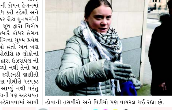
હોવાની તસવીરો અને વિડીયો પણ વાયરલ થઈ રહ્યા છે.

(એજન્સી) તા.૪ કોપન હેગનતા ચાર ડેનમાર્ક ની રાજધાની કોપન હેગનમાં ગાજા ઉપરના ઈઝરાયેલી આક્રમણનો વિરોધ કરી રહેલી અને દેખાવો કરી રહેલી વિખ્યાત સામાજિક કાર્યકર ગ્રેટા થુનબર્ગની પોલીસે ધરપકડ કરી હતી. એક વિદ્યાર્થી જૂથ દ્વારા વિરોધ દેખાવનું આયોજન કરવામાં આવ્યું હતું ત્યારે કોપર હેગન પેલેસ્ટીની પાસે ૨૦ જેટલા લોકોએ બિલ્ડિંગના મુખ્ય પ્રવેશ દ્વારને આડે ઊભા રહીને રસ્તો રોકી લીધો હતો અને ત્રણ દેખાવ કરો અંદર ઘૂસી ગયા હતા ત્યારે પોલીસે છ લોકોની ધરપકડ કરી હતી કોપન હેગન યુનિવર્સિટી દ્વારા ઈઝરાયેલ ની સંસ્થાઓ સાથે સંપર્ક કાપી નાખવામાં આવ્યો નથી તેનો આ વિદ્યાર્થી જૂથો વિરોધ કરી રહ્યા હતા ત્યારે સ્વીડનની જાણીતી પર્્યાવરણ સામાજિક ચળવળ કર ગ્રેટાની પણ પોલીસે ધરપકડ કરી દીધી હતી. પોલીસે જો કે તેનું નામ આપ્યું નથી પરંતુ વિદ્યાર્થીઓના પ્રવક્તાએ જણાવ્યું હતું કે ગ્રેટાની પણ અટકાયત કરી લેવામાં આવી છે તેને હાથ કડી પણ પહેરાવવામાં આવી