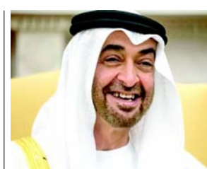
બાંગ્લાદેશી નાગરિકોની સજાનો અમલ તાત્કાલિક ધોરણે મુલતવી કરી દેવા અને આ તમામને માફી મળી હોવાથી એમને વતન પાછા મોકલવાની વ્યવસ્થા કરવાનો

આદેશ બહાર પાડી દીધો છે. તેમણે જણાવ્યું હતું કે યુએઈ તેની ધરતી પર રહેનારા લોકોને અભિપ્રાય વ્યક્ત કરવાની આઝાદી અને અધિકાર આપે છે પરંતુ સાથે સાથે એ પણ નિશ્ચિત કરવામાં આવે છે કે એમના વિરોધ અને અભિપ્રાયને કારણે દેશ અને દેશની પ્રજાના હિતોને નુકસાન ન થાય. ૧૯ જુલાઈ શુક્રવારના રોજ અબુધાબી કેડરલ આદાલતે ગ્રણ બાંગ્લાદેશી નાગરિકોને આજીવન કેદની સજા ફટકારી હતી અને અન્ય ૫૪ને એમની જેલ સજા પૂરી થઈ જાય એટલે એમના વતન પરત કરી દેવાનો આદેશ આપ્યો હતો.