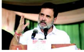
જમ્મુ-કાશ્મીરના લોકોનો અધિકાર ધીનવાયો, સરકારે યુવાનોને બેરોજગારી સિવાય કંઈ આપ્યું નથી : રાહુલ ગાંધી