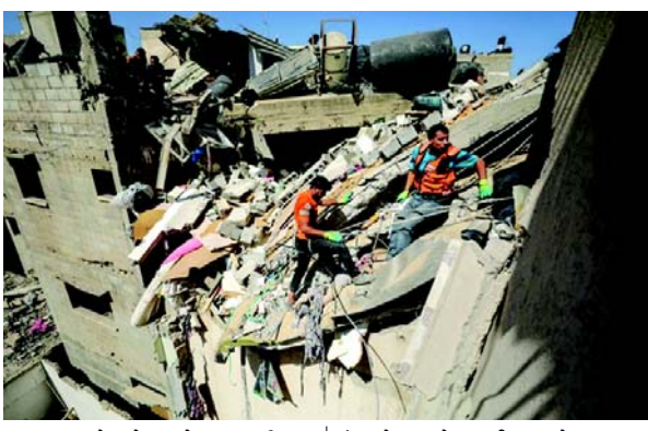
હુમલાના સ્થળે પહોંચવાનો પ્રયાસ કરી રહ્યા છે કારણ કે વિસ્તારમાં હમાસ અને ઈઝરાયેલ વચ્ચે લડાઈ ચાલુ છે. 'હજી પણ લોકો કાટમાળ નીચે દટાયેલા છે.'

(એજન્સી) તા. ૨૫ ઈઝરાયેલી દળોએ ગાઝામાં ટાંકી અને હવાઈ હુમલામાં ઓછામાં ઓછા ૩૩૦ પેલેસ્ટીનનો મૃત્યુ પામ્યા છે, જ્યારે ટેક ઈજિપ્તી સરહદ નજીક ઉત્તરપશ્ચિમ રફાહમાં આગળ વધી છે. આ પ્રદેશમાં ઈઝરાયેલના હુમલા શુક્રવારે ચાલુ રહ્યા હતા, જ્યારે લેબનાન-ઈઝરાયેલ સરહદી વિસ્તારમાં હમાસના સાથી હિઝબુલ્લાહ સાથે સમાંતર અથડામણો તીવ્ર બની હતી. દક્ષિણના શહેર રફાહમાં મેકબાહ વિસ્તારમાં બે રહેણાંક મિલકતો પર ઈઝરાયેલી હવાઈ હુમલામાં ત્રણ બાળકો સહિત ઓછામાં ઓછા ૧૩ પેલેસ્ટિનનો મૃત્યુ પામ્યા, તબીબી સુત્રોએ અલ જઝીરાને જણાવ્યું હતું. મધ્ય ગાઝાના દેર અલ-બલાહથી અલ જઝીરાના તારિક અબુ અઝમે જેણે જણાવ્યું કે હુમલામાં બંને મિલકતો સંપૂર્ણપણે નાશ પામી હતી. તેમણે જણાવ્યું કે, 'નાગરિક સુરક્ષા દળો