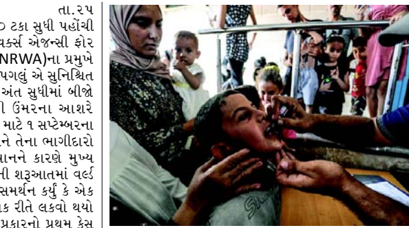
રાઉન્ડ સફળતાપૂર્વક સમાપ્ત થયો છે. તેમણે જણાવ્યું કે, આ વિસ્તારના ૯૦ ટકા બાળકોને પ્રથમ ડોઝ મળ્યો છે. તેમણે જણાવ્યું કે, 'સંઘર્ષના પશોએ મોટાભાગે અન્યથા જરૂરી 'માનવતાવાદી વિરામ'નો આદર કર્યો છે, જે દર્શાવે છે કે જ્યારે રાજકીય ઈચ્છાશક્તિ હોય, ત્યારે સહાય વિકાસ વિના પહોંચાટી શકાય છે. અમારો હવે પછીનો પડકાર એ છે કે બાળકોને તેમની બીજી સહાય પૂરી પાડવી.

(એજન્સી) તા. ૨૫ ગાઝામાં પોલિયો રસીકરણ કવરેજ ૯૦ ટકા સુધી પહોંચી ગયું છે, યુનાઈટેડ નેશન્સ રિલીફ એન્ડ વર્ક્સ એજન્સી ફોર પેલેસ્ટીન રેફ્યુજીસ ઈન ધ નીયર ઈસ્ટ (UNRWA)ના પ્રમુખે જણાવ્યું હતું. તેમણે જણાવ્યું કે, આગળનું પગલું એ સુનિશ્ચિત કરવાનું છે કે લાખો બાળકોને મહિનાના અંત સુધીમાં બીજી ડોઝ મળે. ગાઝામાં ૧૦ વર્ષથી ઓછી ઉંમરના આશરે ૬૪૦,૦૦૦ બાળકોને પોલિયોથી બચાવવા માટે ૧ સપ્ટેમ્બરના રોજ શરૂ થયેલી આ ઝુંબેશ UNRWA અને તેના ભાગીદારો માટે ઈઝરાયેલના ચાલુ બોમ્બિંગ અભિયાનને કારણે મુખ્ય પડકારો રજૂ કરી રહી હતી. ગયા મહિનાની શરૂઆતમાં વર્લ્ડ હેલ્થ ઓર્ગેનાઈઝેશન (અબીએચઓ) એ સમર્થન કર્યું કે એક બાળક ટાઈપ ૨ પોલિયો વાયરસથી આંશિક રીતે લકવો થયો હતો, ૨૫ વર્ષમાં પેલેસ્ટીન પ્રદેશમાં આ પ્રકારનો પ્રથમ કેસ છે. આ મહિનાની શરૂઆતમાં મધ્ય અને દક્ષિણ ગાઝામાં ૪૬૬,૦૦૦થી વધુ પેલેસ્ટીનની બાળકોને રસી આપવામાં આવી હતી, જ્યારે ઉત્તર ગાઝામાં અંતિમ ૨૦૦,૦૦૦ બાળકોને રસી આપવાની ઝુંબેશ ૧૦ સપ્ટેમ્બરના રોજ શરૂ થઈ હતી, પ્રવેશ પ્રતિબંધો, સ્થળાંતરના આદેશો અને બળતણની અછત હોવા છતાં. UNRWAના પ્રમુખ કિલિપ લાઝારિનીએ જણાવ્યું કે, ગાઝામાં પોલિયો રસીકરણ અભિયાનનો પ્રથમ