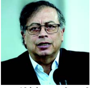
આપણામાંથી જેઓ જીવન ટકાવી રાખવાની શક્તિ ધરાવે છે તેઓ ધ્યાન આપ્યા વિના બોલે છે. આ જ કારણ છે કે જ્યારે આપણે મત આપીએ છીએ. ગાઝામાં નરસંહાર બંધ કરો, તેઓ અમારી વાત સાંભળતા નથી જે માનવતાનો નાશ કરી શકે છે તે અમારી વાત સાંભળતો નથી. પેટ્રોએ આબોહવા સંકટને રોકવા માટે ઊર્જા સંક્રમણના મહત્વ પર ભાર મૂક્યો હતો. તેમણે આબોહવા પરિવર્તન પર

(એજન્સી) તા. ૨૫ કોલંબિયાના રાષ્ટ્રપતિ ગુસ્તાવો પેટ્રોએ મંગળવારે યુએન જનરલ એસેમ્બલીમાં તેમના ભાષણ દરમિયાન ગાઝા પટ્ટી પરના હુમલાઓ માટે ઈઝરાયેલના વડાપ્રધાન બેન્જામિન નેતાન્યાહુની ટીકા કરી. પેટ્રોએ જણાવ્યું કે, 'તે આ અસમાનતા છે, જેમાં આપણે આબોહવા સંકટના પરિણામે સામૂહિક વિનાશનો તર્ક અને નેતાન્યાહુ જેવા ગુનેગાર દ્વારા ગાઝા પર ફેંવામાં આવેલા બોમ્બનો તર્ક શોધીએ છીએ.' રાષ્ટ્રપતિએ જણાવ્યું કે, 'જ્યારે ગાઝાનો અંત આવશે, ત્યારે સમગ્ર માનવતાનો અંત આવશે.' 'આજ આપણી પાસે ૨૦,૦૦૦ મૃત બાળકો છે. સંયુક્ત રાષ્ટ્ર મહાસભામાં રાષ્ટ્રપતિ આ સ્થિતિ પર હસ્યા.' કોલંબિયાના વડાપ્રધાન ગુસ્તાવો પેટ્રોએ મંચ પર માત્ર વિશ્વ શક્તિઓનો અવાજ સંભળાય છે. તેમણે જણાવ્યું કે, 'વિશ્વના કોઈપણ દેશની શક્તિનો ઉપયોગ હવે રાજકીય અને આર્થિક શક્તિ દ્વારા કરવામાં આવતો નથી, પરંતુ માનવતાનો નાશ કરીને કરવામાં આવે છે.