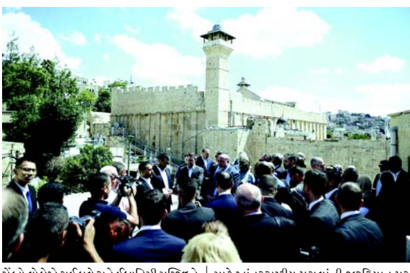
સંકેતો લોકોએ ગઈકાલે રાત્રે ઈબ્રાહિમી મસ્જિદને અપમાનિત કર્યું. તેઓએ એક જોરદાર કોન્સર્ટનું આયોજન કર્યું જેમાં ગાયન અને નૃત્યનો સમાવેશ થયો હતો. મંત્રાલયે મસ્જિદના ઈઝરાયેલી ઉલ્લંઘનને સમાપ્ત કરવા અને પેલેસ્ટીનની ઈસ્લામિક પવિત્ર સ્થળ પર તેમની હાજરી અને અધિકારો પુનઃસ્થાપિત કરવા સક્ષમ બનાવવા માટે આંતરરાષ્ટ્રીય પગલાંની જરૂરિયાત પર ભાર મૂક્યો હતો. ઈન્ટરનેશનલ કોર્ટ ઓફ જસ્ટિસે જુલાઈમાં ચુકાદો આપ્યો કે ઈઝરાયેલનો કબજો ગેરકાયદેસર છે અને આ મહિનાની શરૂઆતમાં યુએન જનરલ એસેમ્બલીએ ભારે માંગ કરી કે ઈઝરાયેલ ભાર મહિનાની અંદર તેનો કબજો સમાપ્ત કરે.

(એજન્સી) તા. ૨૫ પેલેસ્ટીનના ધાર્મિક એન્ડોમેન્ટ્સ એન્ડ અફર્સ મંત્રાલયે મંગળવારે જણાવ્યું કે હેબ્રોનમાં ઈઝરાયેલી કબજા સત્તાવાળાઓએ સતત આઠમા દિવસે ઈબ્રાહિમી મસ્જિદમાં સવારની નમાઝ પર પ્રતિબંધ મૂક્યો છે. પેલેસ્ટીનની ઈન્ફોર્મેશન સેન્ટરે અહેવાલ આપ્યો છે. મંત્રાલયે મસ્જિદમાં નમાઝ અદા કરવા પર પ્રતિબંધ મૂકવા માટે ઈઝરાયેલી સૈન્યની ટીકા કરી, આ પગલાને મસ્જિદમાં ઈસ્લામિક ઉપાસનાના ક્રમોને દબાવવાના હેતુથી ખતરનાક પગલું ગણાવ્યું, ભવિષ્યમાં તેના પર સંપૂર્ણ પ્રતિબંધ મૂકવાના દરિજોણથી. તેણે હેબ્રોનની મધ્યમાં ઈબ્રાહિમી મસ્જિદમાં ઈઝરાયેલ દ્વારા કરવામાં આવેલા ઉલ્લંઘનની ગંભીરતા વિશે ચેતવણી આપી હતી, અહેવાલ આપ્યો કે ઈઝરાયેલી દળોએ સોમવારે ઈસ્લામિક પવિત્ર સ્થળમાં પ્રવેશતા વિદેશી રાજદ્વારી પ્રતિનિધિમંડળને અવરોધિત કર્યું હતું. મંત્રાલયે જણાવ્યું કે આ મુલાકાતીઓને મસ્જિદની અંદર યહુદી કરણ અને અપવિત્રતા જોવાથી રોકવાનો પ્રયાસ હતો, જેમાંથી મોટાભાગનો ગેરકાયદેસર યહુદી વસાહતીઓ દ્વારા અવકાશી અને અસ્થાયી રૂપે કબજો કરવામાં આવ્યો છે. વાસ્તવમાં