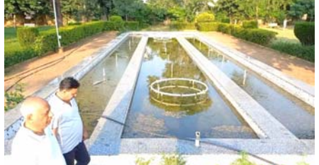
પાલનપુર, તા. ૨૫

પાલનપુરના કલેક્ટર કચેરી સામે આવેલ બગીચામાં ફુવારો આવેલો છે. જે ફુવારામાં વરસાદને સમય વીત્યો હોવા છતાં પાણીનો નિકાલ ન કરાતા મચ્છરોનો ઉપદ્રવ વધતા ગંદકી ફેલાઈ છે. જેથી સરકારમાં મોર્નિંગ વોક, કસરત અને યોગા માટે આવતા સિનિયર સિટીઝનોએ રોગચાળાની દહેશત વ્યક્ત કરતા સત્વરે સફાઈ થાય તેવી માંગણી કરી હતી. સ્વચ્છતા ડી સેવા અભિયાન વચ્ચે પાલનપુર શહેરમાં ડેન્ગ્યુ અને વાયરલ ફીવર સહિતનાં રોગચાળો વકરી રહ્યો છે. ત્યારે પાલનપુરમાં તંત્રના નાક નીચે જ સ્વચ્છતા અભિયાનનું સુરસુરિયું થયેલું જોવા મળ્યું હતું. તંત્ર દ્વારા શહેરભરમાં સ્વચ્છતા અભિયાન યદાવધવામાં આવી રહ્યું છે. ત્યારે પાલનપુરની કલેક્ટર કચેરીમાં આવેલ બગીચો જ પણ