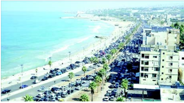
ઘણી સરકારો આંતરરાષ્ટ્રીય કાયદા, માનવ અધિકાર સંમેલનો અને સંયુક્ત રાષ્ટ્રના ઠરાવોની અવગણના કરવા માટે હકદાર હોવાનું માને છે. તેમણે જણાવ્યું કે, 'તેઓ બીજા દેશ પર આક્રમણ કરી શકે છે, સમગ્ર સમાજને નષ્ટ કરી શકે છે, અથવા તેમના પોતાના લોકોના કલ્યાણને સંપૂર્ણપણે અવગણી શકે છે. અને કંઈ થશે નહીં. 'મુક્તિ' મધ્ય પૂર્વ, યુરોપ, આફ્રિકા અને અન્યત્ર પણ જોઈ શકાય છે. મધ્ય પૂર્વના સંઘર્ષમાં, ગુટેરેસે જણાવ્યું કે 'ગાઝા એક સતત દુઃસ્વપ્ન છે જે સમગ્ર પ્રદેશને તેની સાથે લઈ જવાની ધમકી આપી રહ્યું છે. લેબનાનથી આગળ ન જુઓ.' તેમણે જણાવ્યું કે તમામ દેશોએ લેબેનોન અને ઈઝરાયેલ વચ્ચે 'વધતા તણાવથી ચિંતિત' થવું

(એજન્સી) તા. ૨૫ યુએન સેક્રેટરી-જનરલ એન્ટોનિયો ગુટેરેસે મંગળવારે સભ્ય દેશોને ચેતવણી આપી કે ઈઝરાયેલ સાથે વધતા તણાવ વચ્ચે લેબેનોન 'બીજું ગાઝા બની જશે'. વિશ્વનો સામનો કરી રહેલા 'મહાકાવ્ય પરિવર્તન' પર પ્રકાશ પાડતા, ગુટેરેસે ન્યૂયોર્કમાં તેના મુખ્ય મથક ખાતે ૭૮મી યુએન જનરલ એસેમ્બલીના ઉદ્ઘાટન દરમિયાન સભ્ય દેશોને સંબોધિત કર્યા. તેમણે જણાવ્યું કે 'આપણું વિશ્વ એક વાસ્તવિકતા છે, આપણે એવા પડકારોનો સામનો કરી રહ્યા છીએ જેનો પહેલાં ક્યારેય સામનો કરવો પડ્યો નથી-એવા પડકારો કે જેને વૈશ્વિક ઉકેલની જરૂર છે. ભૌગોલિક રાજકીય વિભાજન વધુ ઊંડું થઈ રહ્યું છે.' ગ્લોબલ વોર્મિંગ તરફ ધ્યાન દોરતા, સંયુક્ત રાષ્ટ્રના પ્રમુખે જણાવ્યું કે 'યુલો ચાલુ રહે છે અને તે કેવી રીતે સમાપ્ત થશે તે અંગે કોઈ સંકેત નથી.' તેમણે પરમાણુ શસ્ત્રોના જોખમને વર્ણવિત કર્યું અને કહ્યું કે 'નવા શસ્ત્રો ઘેરો પડકારો પાડી રહ્યા છે.' તેમણે જણાવ્યું કે 'અમે અકલ્પનીય, એક પાવડર કેંગ તરફ આગળ વધી રહ્યા છીએ જે સમગ્ર વિશ્વને ગળી જવાની ધમકી આપે છે. ગુટેરેસે તેમનું ભાષણ બે મુખ્ય વાસ્તવિકતાઓ પર આધારિત છે: વર્તમાન વૈશ્વિક પરિસ્થિતિ 'બિનટકાઈ' છે અને વિશ્વ સામેના પડકારો 'ઉકેલ શકાય તેવા' છે. તેમણે ભારપૂર્વક જણાવ્યું કે 'વિશ્વમાં મુક્તિનું સ્તર રાજકીય રીતે અભય અને નૈતિક રીતે અસહ્ય છે.' તેમણે બેઠ વ્યક્ત કર્યું કે