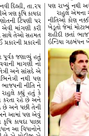
પણ રાખ્યું નથી અમે એ કહી લુલવાના નથી. રાહુલે એમના એક્સ હેન્ડલ પર ટ્વિટ કર્યું હતું કે સરકારની નીતિઓ કોણ નક્કી કરે છે? ભાજપ કે વડાપ્રધાન મોદી? ૭૦૦ ખેડૂતો જેમાં મોટાભાગના હરિયાણા અને પંજાબના હતા એમની શહીદી છતાં ભાજપના લોકોને હજુ સંતોષ થયો નથી. પરંતુ ઈન્ડિયા ગઠબંધન ખેડૂતો સામેના કોઈપણ કાયદાને સફળ થવા

(એજન્સી) નવી દિલ્હી, તા. ૨૫ લોકસભા વિરોધ પક્ષના નેતા રાહુલ ગાંધીએ ત્રણ કૃષિ કાયદા પાછા લાવવાની ભાજપના સાંસદ કંગના રણોતની ટિપ્પણી પર ભાજપની આકરી ઝાટકણી કાઢી હતી અને એવી માંગણી કરી કે વડાપ્રધાન નરેન્દ્ર મોદીએ આ વિધાનો સાથે તેઓ સહમત નથી અને તેનો વિરોધ કરે છે અથવા તો કોઈ પ્રકારની પ્રકારની રમત છે કે કેમ તેની સ્પષ્ટતા કરવી જોઈએ. કોંગ્રેસ આગેવાને કોંગ્રેસ અગ્રણીએ ભાર પૂર્વક જણાવ્યું હતું કે ૨૬ કરાયેલા ત્રણ કૃષિ કાયદા પાછા લાવવાની માંગણીનો વિરોધ પક્ષો જાહેર વિરોધ કરશે આ અભિનેત્રી અને સાંસદે એ યાદ રાખવું જોઈએ કે તેઓ હવે માત્ર અભિનેત્રી નથી પણ ભાજપના સાંસદ છે એટલે એમના નિવેદનો ભાજપની નીતિ ને અનુરૂપ હોવા જોઈએ. વિડીયો નિવેદનમાં રાહુલે કહ્યું હતું કે ભાજપના લોકો વિભિન્ન વિચારો ન પરીક્ષણ કરતા રહે છે અને તેઓ લોકોને એક વિચાર વ્યક્ત કરવાનું કહે છે અને પછી તેની શું પ્રતિક્રિયા આવે છે તે જોતા રહે હોય છે. અને આમાં પણ એવું જ થયું છે એમના જ એક સાંસદે ત્રણ કાળા કૃષિ કાયદા પાછા લાવવાની વાતો શરૂ કરી છે એટલે શું વડાપ્રધાન આ વિધાનોને વિરોધ કરે છે કે કોઈ જાતની રમત થઈ રહી છે એ મોદીજી એ સ્પષ્ટ કરવું જોઈએ. કોંગ્રેસના નેતાએ સ્પષ્ટ કહ્યું હતું કે શું તેમને લોકો કૃષિ કાયદા પાછા લાવવા માંગો છો અને જો એવું હોય તો ઈન્ડિયા બ્લોક સાથે મળીને એ કાયદાનો વિરોધ કરે છે અને કરશે તેની તમને હું ખાતરી આપું છું. ૭૦૦ લોકો શહીદ થયા છે એ યાદ રહ્યો રાખવું જ જોઈએ અને એમની શહીદી નું સન્માન કરવું જોઈએ. એમના માટે મોદીજી હજુ સુધી બે મિનિટ તો મૌન