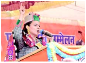
પક્ષના વલણનું પ્રતિનિધિત્વ કરતા નથી. " મંડીના સાંસદે વધુમાં જણાવ્યું હતું કે ખેતીના

(એજન્સી) નવી દિલ્હી, તા.૨૫ અભિનેતામાંથી રાજકારણી બનેલી કંગના રનીત હવે નાબૂદ કરાયેલા ફાર્મ કાયદાઓ પરની તેની ટિપ્પણી માટે ફરીથી ચર્ચામાં છે અને તેના પોતાના પક્ષે તેના નિવેદનથી છોડે ફાટ્યો છે. મંડીના સાંસદે, લોકસભાની બહાર પત્રકારો સાથે વાત કરતી વખતે, ફાર્મ બિલને સમર્થન આપ્યું હતું અને ખેડૂતોને વિનંતી કરી હતી કે તેઓ તેને પાછા ખેંચવાની માંગ કરે. રણોતે તેની ટિપ્પણી પર ઝડપથી દિલગીરી વ્યક્ત