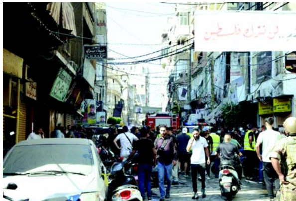
મહિલાઓ અને બાળકો હતા. આંતરરાષ્ટ્રીય સમુદાયે લેબેનોન પરના હુમલાઓ સામે વેતવણી આપી છે, કારણ કે તે ગાઝા સંઘર્ષમાં પ્રાદેશિક રીતે ફેલાવાનું જોખમ ધરાવે છે.

(એજન્સી) તા. ૨૫ યુએન શરણાર્થી એજન્સીના પ્રમુખે મંગળવારે સમર્થન કર્યું કે લેબેનોનમાં તાજેતરના ઈઝરાયેલી હવાઈ હુમલામાં મૃત્યુ પામેલા સંક્રમણમાં બે કર્મચારીઓનો સમાવેશ થાય છે. ગ્રાન્ડીએ UNHCR વતી તેમના પરિવારો, મિત્રો અને સહકર્મીઓ પ્રત્યે સંવેદના વ્યક્ત કરી. ઈઝરાયેલી સૈન્યએ સોમવારે સવારે લેબેનોન સામે ઘાતક હવાઈ હુમલા શરૂ કર્યા, જેમાં ૮૫ મહિલાઓ અને ૫૦ બાળકો સહિત ઓછામાં ઓછા ૫૫૮ લોકો મૃત્યુ પામ્યા અને ૧,૮૩૫ ઘાયલ થયા. હિઝબુલ્લાહ અને ઈઝરાયેલ ગાઝા પર ઈઝરાયેલના યુદ્ધની શરૂઆતથી જ સીમાપાર યુદ્ધમાં રોકાયેલા છે, જેમાં હમાસ દ્વારા ગયા ઓક્ટોબર ૭ના રોજ કરવામાં આવેલા ક્રોસ બોર હુમલા બાદ ૪૧,૪૦૦થી વધુ લોકો મૃત્યુ પામ્યા છે, જેમાં મોટાભાગની