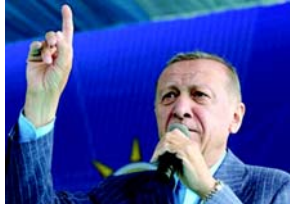
માનવતાના નામે હું માનવતાના સામાન્ય મંચ પરથી ખુલ્લેઆમ કેટલાક સત્યો બોલવા માંગુ છું.' રાષ્ટ્રપતિએ યુએનની ટીકા કરી જે તેના સ્થાપક મિશનને પૂર્ણ કરવા માટે સંઘર્ષ કરી રહી છે અને 'ધીમે ધીમે નિષ્ક્રિય, બોજરૂપ અને જડ માળખામાં ફેરવાઈ રહી છે'. તેમણે જણાવ્યું કે અમે જોઈએ છીએ કે આંતરરાષ્ટ્રીય શાંતિ અને સુરક્ષા પાંચ વિશે પાષાંકૃત વ્યક્તિઓની ધૂન પર છોડી દેવા માટે ખૂબ જ મહત્વપૂર્ણ છે. એર્દોગને લાંબા સમયથી સંયુક્ત રાષ્ટ્રમાં સુધારાની માંગ કરી છે અને સુરક્ષા પરિપદના બિન-પ્રતિનિધિ સભ્યપદનો ઉલ્લેખ કરીને 'વિશ્વ પાંચ કરતાં મોટું છે' સૂત્રનો ઉપયોગ કર્યો છે. 'આનું સૌથી નાટકીય ઉદાહરણ ગાઝામાં ૩૫-દિવસીય હત્યાકાંડ છે,' તેમણે ભારપૂર્વક જણાવ્યું હતું. ગાઝા પટ્ટી પર ઈઝરાયેલના આક્રમણનો ઉલ્લેખ કરતા એર્દોગને જણાવ્યું કે, ઈઝરાયેલે તેના અવિરત આક્રમણ શરૂ કર્યું ત્યારથી ગત ૭ ઓક્ટોબરથી

(એજન્સી) તા. ૨૫ તુર્કીના રાષ્ટ્રપતિ રેસેપ ટૈયપ એર્દોગને મંગળવારે આંતરરાષ્ટ્રીય સમુદાયને ઈઝરાયેલના વડાપ્રધાન બેન્જામિન નેતાન્યાહુને રોકવા વિનંતી કરી, જેમ કે તેઓએ પેલીઓ પહેલા નાગી સરમુખત્યાર એડોલ્ફ હિટલર સાથે કર્યું હતું. ન્યૂયોર્કમાં યુએન જનરલ એસેમ્બલીની ૭૮મી બેઠકમાં પોતાના સંબોધનમાં એર્દોગને જણાવ્યું કે, 'ઈઝરાયેલના વલણે ફરી એક વખત દર્શાવ્યું છે કે આંતરરાષ્ટ્રીય સમુદાય માટે પેલેસ્ટીનની નાગરિકો માટે સુરક્ષા વ્યવસ્થા વિકસાવવી જરૂરી છે.' તેમના સંબોધન પહેલા એર્દોગને સંયુક્ત રાષ્ટ્રમાં પેલેસ્ટીનના પ્રતિનિધિને જોઈને આનંદ વ્યક્ત કર્યો, 'લાંબા સંઘર્ષ પછી, તેઓને સભ્ય દેશોમાં તે સ્થાન આપવામાં આવ્યું છે જે તેઓ લાયક છે: 'હું ઈચ્છું છું કે આ ઐતિહાસિક પગલું લેવામાં આવે સંયુક્ત રાષ્ટ્ર.' હું અન્ય દેશોને પણ આમંત્રિત કરું છું કે જેમણે હજી સુધી આમ કર્યું નથી, શક્ય તેટલી વહેલી તકે પેલેસ્ટીન રાજ્યને માન્યતા આપે અને આ નિષ્ણાતિક સમયે ઈતિહાસની પરી બાજુએ તેમનું સ્થાન લે.' એર્દોગને જણાવ્યું કે તે એવા દેશના નેતા છે જે હાથપાયે દુર નથી, પરંતુ તેના 'કેન્દ્ર' પર છે. તેમણે જણાવ્યું કે, 'કેટલાક લોકોને અસ્વસ્થતા અનુભવાય તો પણ કેટલાક લોકો ફરી એકવાર અમારી ટીકા કરે તો પણ આજે