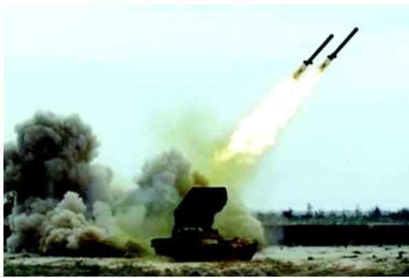
દ્વારા જાહેર કરવામાં આવેલા વીડિયોમાં દાવો કરવામાં આવ્યો છે કે ફાઈ ૧ અને ફાઈ ૨ ૨૦ એમએમ રોકેટ છે, જે ૬ મીટર લાંબુ છે અને ૮૩ કિલોના વોરહેડથી સજ્જ છે. તેની ઓપરેશનલ રેન્જ ૭૦ કિમી સુધી હોવાનું કહેવાય છે.

(એજન્સી) તા. ૨૫ લેબેનીઝ પ્રતિકાર સમૂહ હિઝબુલ્લાહે ઉત્તરી કબજા હેઠળના પેલેસ્ટીનમાં ઓછામાં ઓછી ૨૦ મિસાઈલો છોડી છે. અલ-મયાદીન ન્યૂઝ નેટવર્ક અનુસાર, હિઝબુલ્લાહે કબજાવાળા પેલેસ્ટીન અને હેફાના ઉત્તરમાં ગેલિલી ક્ષેત્રમાં ઓછામાં ઓછા ૨૦ રોકેટ છોડ્યા હતા. કેટલીક મિસાઈલો નિયુક્ત લક્ષ્યોને અથડાવી હતી, જ્યારે એક હાઈફા શહેરમાં પડી હતી. ઉત્તર કબજાવાળા પેલેસ્ટીનને નિશાન બનાવતા હુમલાના તાજેતરના મોજાના ભાગરૂપે, હિઝબુલ્લાહે ચાલી રહેલા સંઘર્ષમાં પ્રથમ વખત ફાઈ-૧ અને ફાઈ-૨ તરીકે ઓળખાયેલી મિસાઈલોનો ઉપયોગ કર્યો છે. હુમલાના કેટલાક કલાકો પછી, હિઝબુલ્લાહે રોકેટ વિશે વધારાની વિગતો જાહેર કરી, જેમાં તેમના લોન્ચિંગના દસ્તાવેજકરણના ફોટા અને વીડિયોનો સમાવેશ થાય છે. હિઝબુલ્લાહે