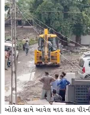
ઓફિસ સામે આવેલ મદદ શાહ પીરની

દરગાહ શહીદ કરવામાં આવતા મુસ્લિમ સમાજે ભારે આઘાતની લાગણી અનુભવી છે. મીરા નગરમાં આવેલ દરગાહ કોઈપણ રૂપે નડતર રૂપ હતી નહીં. ગત તા. ૨૧.૯.૨૪ ના રોજ જૂનાગઢ મહાનગરપાલિકાના ટાઉન પ્લાનિંગ ઓફિસર દ્વારા દરગાહનું દબાણ હટાવી લેવા માટે નોટિસ આપવામાં આવી હતી ત્યારબાદ આજે મીરા નગર ખાતે દબાણ હટાવ સુંબેશ શરૂ કરવામાં આવી હતી. જેમાં મીરા નગર સોસાયટીમાં આવેલ મકાનોમાં આસામીતો દ્વારા જે દબાણ કરવામાં આવ્યું હતું તે દબાણ , ઓટલા, ગેટ સહિતના દબાણો દૂર કરવામાં આવ્યા છે.