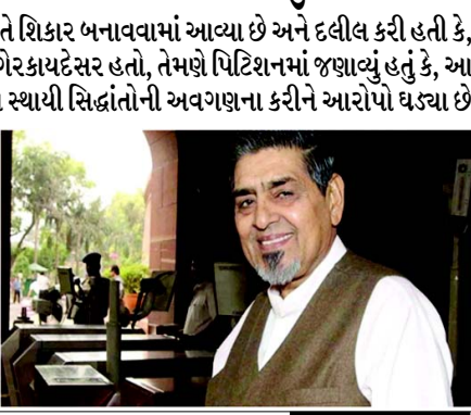
દલીલ કરી હતી કે, ટ્રાયલ કોર્ટનો તેમની સામે આરોપો ઘડવાનો આદેશ વિકૃત, ગેરકાયદેસર હતો. તેમણે પિટિશનમાં જણાવ્યું હતું કે, આ આદેશ દ્વારા ટ્રાયલ કોર્ટ ભૂલથી અરજદાર વિરુદ્ધ કાયદાના સ્થાયી સિદ્ધાંતોની અવગણના કરીને આરોપો ઘડ્યા છે. સુનાવણી દરમિયાન ટાઈટલરના વકીલે અરજી રજૂ કરી અને દાવો કર્યો કે, તે ઘટના સમયે સ્થળ પર હાજર ન હતા. આ અરજીનો સીબીઆઈના વકીલ અને પીડિતો એ વિરોધ કર્યો હતો જેમણે એવી રજૂઆત કરી હતી કે, આ અરજીનો નિર્ણય પહેલાથી જ હાઈકોર્ટે ફગાવી દીધો હતો. તેમની અરજીમાં ટાઈટલરે દાવો કર્યો હતો કે, તેમની સામે લગાવવામાં આવેલા આરોપોને સમર્થન આપવા માટે કોઈ વિશ્વસનીય પુરાવા નથી અને ટ્રાયલ કોર્ટનો આદેશ ખોટી ધરણા પર હતો અને યાંત્રિક રીતે પસાર કરવામાં આવ્યો હતો અને તેને એડી કરવો જોઈએ. ટાઈટલરે ટ્રાયલ કોર્ટના ૨૦ ઓગસ્ટના આદેશને ૨૬

ટાઈટલરે તેની અરજીમાં દાવો કર્યો હતો કે, તેઓને ખોટી રીતે શિકાર બનાવવામાં આવ્યા છે અને દલીલ કરી હતી કે, ટ્રાયલ કોર્ટનો તેમની સામે આરોપો ઘડવાનો આદેશ વિકૃત, ગેરકાયદેસર હતો, તેમણે પિટિશનમાં જણાવ્યું હતું કે, આ આદેશ દ્વારા ટ્રાયલ કોર્ટ ભૂલથી અરજદાર વિરુદ્ધ કાયદાના સ્થાયી સિદ્ધાંતોની અવગણના કરીને આરોપો ઘડ્યા છે. સુનાવણી દરમિયાન ટાઈટલરના વકીલે અરજી રજૂ કરી અને દાવો કર્યો કે, તે ઘટના સમયે સ્થળ પર હાજર ન હતા. આ અરજીનો સીબીઆઈના વકીલ અને પીડિતો એ વિરોધ કર્યો હતો જેમણે એવી રજૂઆત કરી હતી કે, આ અરજીનો નિર્ણય પહેલાથી જ હાઈકોર્ટે ફગાવી દીધો હતો. તેમની અરજીમાં ટાઈટલરે દાવો કર્યો હતો કે, તેમની સામે લગાવવામાં આવેલા આરોપોને સમર્થન આપવા માટે કોઈ વિશ્વસનીય પુરાવા નથી અને ટ્રાયલ કોર્ટનો આદેશ ખોટી ધરણા પર હતો અને યાંત્રિક રીતે પસાર કરવામાં આવ્યો હતો અને તેને એડી કરવો જોઈએ. ટાઈટલરે ટ્રાયલ કોર્ટના ૨૦ ઓગસ્ટના આદેશને ૨૬