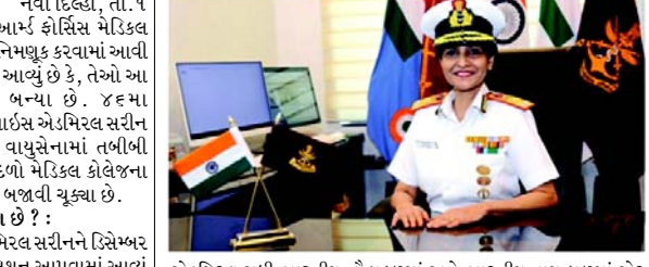
સર્જન વાઈસ એડમિરલ આરતી સરીનને આર્મ્ડ ફોર્સિસ મેડિકલ સર્વિસીસ (DGAFMS)ના મહાનિર્દેશક તરીકે નિમણૂક કરવામાં આવી છે, એક સત્તાવાર અખબારી યાદીમાં જણાવવામાં આવ્યું છે કે, તેઓ આ પદ સંભાળનાર પ્રથમ મહિલા અધિકારી બન્યા છે. ૪૬મા ડીજીએએએમએસ તરીકે પદ સંભાળતા પહેલા વાઈસ એડમિરલ સરીન નૌકાદળમાં તબીબી સેવાઓના મહાનિર્દેશક, વાયુસેનામાં તબીબી સેવાઓના મહાનિર્દેશક, તેમજ પુણેમાં સશસ્ત્ર દળો મેડિકલ કોલેજના ડિરેક્ટર અને કમાન્ડ (AFMC) તરીકે ફરજ ભજવી ચૂક્યા છે. સર્જન વાઈસ એડમિરલ આરતી સરીન કોણ છે ? : AFMC, પુણેના પૂર્વ વિદ્યાર્થી, વાઈસ એડમિરલ સરીનને ડિસેમ્બર ૧૯૮૫માં આર્મ્ડ ફોર્સિસ મેડિકલ સર્વિસીસમાં કમિશન આપવામાં આવ્યું હતું, તે AFMC, પુણેમાંથી રેડિયો ડાયગ્નોસિસમાં MD છે અને ટાટા મેમોરિયલ હોસ્પિટલ, મુંબઈમાંથી રેડિયેશન ઓન્કોલોજીમાં ડિપ્લોમેટ નેશનલ બોર્ડ છે, જે પિટ્સબર્ગ યુનિવર્સિટીમાંથી ગામા નાઈક સર્જરીની તાલીમ સાથે પૂરક છે. તેમની ૩૮ વર્ષની કારકિર્દીમાં ફ્લેગ ઓફિસરે આર્મી હોસ્પિટલ (R&R) અને કમાન્ડ હોસ્પિટલ (સધર્ન કમાન્ડ)/AFMC પુણેમાં પ્રોફેસર અને રેડિયેશન ઓન્કોલોજીના વડા, INHS આંધ્રિની પાલ્લેમાં પ્રોફેસર ઓફિસર ભારતીય નૌકાદળના દક્ષિણ અને પશ્ચિમી નૌકા કમાન્ડમાં કમાન્ડ મેડિકલ ઓફિસર સહિત અનેક શૈક્ષણિક અને વહીવટી ફરજો ભજવી છે. ફ્લેગ ઓફિસરને ભારતીય સશસ્ત્ર દળોની ત્રણેય શાખાઓમાં સેવા આપવાનું દુર્લભ ગૌરવ હતું, તેમણે ભારતીય સેનામાં લેફ્ટનન્ટની કેપ્ટન, સર્જન લેફ્ટનન્ટની સર્જન વાઈસ

AFMC, પુણેના પૂર્વ વિદ્યાર્થી, વાઈસ એડમિરલ સરીનને ડિસેમ્બર ૧૯૮૫માં આર્મ્ડ ફોર્સિસ મેડિકલ સર્વિસીસમાં કમિશન આપવામાં આવ્યું હતું, તે AFMC, પુણેમાંથી રેડિયો ડાયગ્નોસિસમાં MD છે અને ટાટા મેમોરિયલ હોસ્પિટલ, મુંબઈમાંથી રેડિયેશન ઓન્કોલોજીમાં ડિપ્લોમેટ નેશનલ બોર્ડ છે, જે પિટ્સબર્ગ યુનિવર્સિટીમાંથી ગામા નાઈક સર્જરીની તાલીમ સાથે પૂરક છે. તેમની ૩૮ વર્ષની કારકિર્દીમાં ફ્લેગ ઓફિસરે આર્મી હોસ્પિટલ (R&R) અને કમાન્ડ હોસ્પિટલ (સધર્ન કમાન્ડ)/AFMC પુણેમાં પ્રોફેસર અને રેડિયેશન ઓન્કોલોજીના વડા, INHS આંધ્રિની પાલ્લેમાં પ્રોફેસર ઓફિસર ભારતીય નૌકાદળના દક્ષિણ અને પશ્ચિમી નૌકા કમાન્ડમાં કમાન્ડ મેડિકલ ઓફિસર સહિત અનેક શૈક્ષણિક અને વહીવટી ફરજો ભજવી છે. ફ્લેગ ઓફિસરને ભારતીય સશસ્ત્ર દળોની ત્રણેય શાખાઓમાં સેવા આપવાનું દુર્લભ ગૌરવ હતું, તેમણે ભારતીય સેનામાં લેફ્ટનન્ટની કેપ્ટન, સર્જન લેફ્ટનન્ટની સર્જન વાઈસ