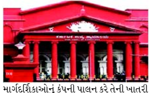
માર્ગદર્શિકાઓનું કંપની પાલન કરે તેની પાતરી કરવા મહિલા અને બાળ વિકાસ મંત્રાલયને હાકલ કરી. તેણે ટેક્સી સેવાઓનો ઉપયોગ કરતી મહિલાઓ અને બાળકો માટે રક્ષણાત્મક નિયમોની પણ માંગ કરી હતી. કર્ણાટક સ્ટેટ રોડ સેફ્ટી ઓથોરિટીને ANI ટેકનોલોજીને જારી કરાયેલી નોટિસને લગતી કાર્યવાહી ઝડપી કરવા માટે પણ નિર્દેશ આપવામાં આવ્યો હતો, જેમાં ૮૦ દિવસની સમયમર્યાદા પૂર્ણ થઈ હતી. અરજીનો અપૂરતો જવાબ આપવા બદલ રાજ્ય સરકારને એક લાખ રૂપિયાનો દંડ ચૂકવવાનો આદેશ આપવામાં આવ્યો છે. કાર્યવાહી દરમિયાન, અરજદારના વકીલે દલીલ કરી હતી કે OLA એક POSH સંપોર્ટેડ કંપની છે અને તેના ડ્રાઈવરોની ફરિયાદો માટે તે જવાબદાર હોવી જોઈએ. તેનાથી વિપરીત, OLAN વકીલે દાવો કર્યો હતો કે, ડ્રાઈવરો સ્વતંત્ર કોન્ટ્રાક્ટર છે અને કમ્પાઈનીઓ નથી. આમ કંપનીને શ્રમ કાયદા હેઠળ જવાબદારીમાંથી મુક્તિ મળે છે.

(એજન્સી) બેંગલુરુ, તા. ૧ કર્ણાટક હાઈકોર્ટે OLA કેસની પરેન્ટ કંપની ANI ટેકનોલોજીને ૨૦૧૯માં તેમના એક ડ્રાઈવર દ્વારા જાતીય સતામણીની કથિત ઘટનાને પગલે મહિલાને પાંચ લાખ રૂપિયાનું વળતર આપવાનો આદેશ આપ્યો છે. આ નિર્ણય જિસ્ટિસ એમજીએસ કમલ દ્વારા આપવામાં આવ્યો હતો. કોર્ટે OLANની આંતરિક ફરિયાદ સમિતિ (ICC)ને કામના સ્થળે મહિલાઓની જાતીય સતામણી (પ્રિવેન્શન, પ્રોહિબિશન અને ડિસ્પેલ) એક્ટ, ૨૦૧૩ (POSH એક્ટ) અનુસાર યોગ્ય તપાસ કરવા પણ નિર્દેશ આપ્યો છે. તપાસ ૮૦ દિવસમાં પૂર્ણ થવી જોઈએ અને જિલ્લા અધિકારીને અહેવાલ સહમિત કરવો જોઈએ. વધુમાં ANI ટેકનોલોજીને અરજદારના મુકદ્દમાના ખર્ચ માટે ૫૦,૦૦૦ રૂપિયા ચૂકવવા સૂચના આપવામાં આવી છે. કોર્ટે POSH એક્ટની કલમ ૧૬નું પાલન કરવા પર ભાર મૂક્યો હતો, જે સામેલ વ્યક્તિઓની ઓળખની ગુપ્તતાની પાતરી આપે છે. અરજદારે શરૂઆતમાં તેની ફરિયાદને પૂર્ણ સ્વીકારી હતી, પરંતુ કંપનીના ICC, બાહ્ય કાનૂની સલાહના આધારે, અધિકારક્ષેત્રના અભાવને ટાંકીને તપાસ કરવાનો ઈન્કાર કર્યો હતો. મહિલાએ ત્યારપછી હાઈકોર્ટે સંપર્ક કર્યો, તેની ફરિયાદની તપાસ કરવા માટે OLANને આદેશની માંગણી કરી અને POSH