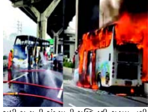
સુધી મૃત્યુની સંખ્યાની પુષ્ટિ કરી શક્યા નથી કારણ કે તેઓએ ઘટનાસ્થળની તપાસ પૂર્ણ કરી નથી, પરંતુ બચી ગયેલા લોકોની સંખ્યાના

(એજન્સી) બેંગલોક, તા. ૧ અધિકારીઓ અને બચાવકર્તાઓએ જણાવ્યું હતું કે, ઉપનગરીય બેંગલોકમાં યુવાન વિદ્યાર્થીઓને તેમના શિક્ષકોને લઈ જતી બસમાં આગ લાગી હતી જેમાં સવાર ૨૫ લોકોના મોતની આશંકા છે. વાહનવ્યવહાર મંત્રી સુરિયા જુગુન્ડગુડગીટે ઘટનાસ્થળે પત્રકારોને જણાવ્યું હતું કે, બસ મધ્ય ઉથાઈ ધાની પ્રાંતથી ૪૪ મુસાફરોને શાળાની સફર માટે બેંગલોક લઈ જઈ રહી હતી ત્યારે રાજધાનીના ઉત્તરીય ઉપનગર પશ્ચિમ ધાની પ્રાંતમાં બપોરના સુમારે આગ લાગી હતી. ગુડ પ્રધાન અનુપીતન ચર્નવિરાકુલે જણાવ્યું હતું કે અધિકારીઓ હજુ