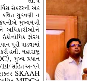
જો કે, MIDC બાકી રહેલી રકમની ચૂકવણી કરવામાં ખરાબ રીતે નિષ્ફળ રહી છે, જેના પરિણામે અમારા ક્લાયન્ટ, અમારા ક્લાયન્ટની કેડિટ અને નાણાકીય પરિસ્થિતિને નોંધપાત્ર નાણાકીય નુકસાન થયું છે અને હાનિ પહોંચી છે. આમ, MIDC આથી વાર્ષિક ૧૮%ના દરે વ્યાજ સાથે રૂ. ૧.૫૮,૬૪,૬૨૫.૯૦ની કુલ બાકી રકમ ચૂકવવા માટે જવાબદાર છે... નોટિસ જણાવે છે કે, 'આ મુદ્દો ભારત અને સ્વિટ્ઝર્લેન્ડ વચ્ચેના આંતરરાષ્ટ્રીય સંબંધોને અસર કરી રહ્યો છે, અને વણઉકેલાયેલી ચૂકવણીથી ઉદ્ભવતા કોઈપણ વિવાદો અથવા તકરારોને રોકવા માટે તાત્કાલિક ઉકેલ જરૂરી છે.' તે એ પણ પ્રકાશિત કરે છે કે જ્યારે સેવાઓ ચોક્કસ સંખ્યામાં વ્યક્તિઓને ઓફર કરવાની હતી, ત્યારે WEF સંમેલનમાં મુલાકાતીઓ તે સંખ્યા કરતાં વધી ગયા હતા, તેમ છતાં કંપનીએ સેવાઓ પહોંચાડી હતી અને તેમના મજૂરી માંગણીઓને સંતોષી હતી. તે જણાવે છે કે, "અમારા ક્લાયન્ટ દ્વારા MIDCના પ્રતિનિધિઓને કોલ અને મેઈલ દ્વારા ચૂકવણી માટેની વારંવાર વિનંતીઓ કરવા છતાં ચૂકવણીમાં સતત વિલંબ થયો છે. MIDC અને તેના પ્રતિનિધિઓએ આ વિલંબ માટે સતત બહાનું પૂરું પાડ્યું છે. MIDC અને તેના પ્રતિનિધિઓએ અમારા ક્લાયન્ટ પ્રત્યેની તેમની ફરજો, જવાબદારીઓ અને જવાબદારીની ઈરાદાપૂર્વક અવગણના કરી છે." નોટિસમાં એમ પણ કહેવામાં આવ્યું છે કે MIDC અને તેના પ્રતિનિધિઓએ સ્વિસ ફર્મને નોંધપાત્ર નાણાકીય અને આર્થિક નુકસાન કર્યું છે, તેમજ તેના દ્વારા કર્યા વ્યક્તિઓને નુકસાન પહોંચાડ્યું છે. તે જણાવે છે કે, 'આવું જાણીજોઈને અને ઈરાદાપૂર્વક કરવામાં આવી રહ્યું હોવાનું જણાય છે.'