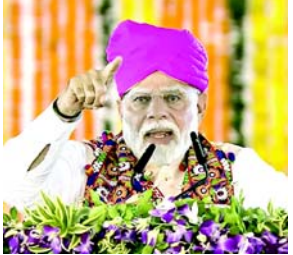
શુભ ઈરાદા ધરાવતા નથી એવા લોકોની કેટલી નજીક કોંગ્રેસ રહે છે એ દરેક વ્યક્તિ જોઈ શકે છે. તેમણે ખેડૂતોને બેવડા લાભ આપવા બદલ કોંગ્રેસની ટીકા કરી હતી અને આદિવાસીઓનું કોઈ માન સન્માન નથી. કોંગ્રેસ પરિવાર દલિતો અને આદિવાસીઓને સમાન ગણીને માન આપતો નથી તેઓ ગરીબને ગરીબ રાખવા માંગે છે કેમ કે કોંગ્રેસ ખુદ શહેરી નક્સલવાદીઓથી ભરાયેલી છે. વડાપ્રધાને ઉમેર્યું હતું કે તાજેતરમાં દિલ્હીમાં કરોડો રૂપિયાની કિંમતના ડ્રગ્સના જથ્થાને પકડી પાડવામાં આવ્યો છે અને ડ્રગ્સના આ કૌભાંડમાં મુખ્ય સૂત્રધાર કોંગ્રેસનો નેતા હોવાની શંકા સેવાય છે એટલે યુવાનોને ડ્રગ્સના રવારો ચલાવી દે તેમાંથી મળતા નાણાકીય કોંગ્રેસ ચૂંટણીઓ લડવા માંગે છે. તેમણે ઉમેર્યું હતું કે કોંગ્રેસની વિચારધારા શરૂઆતથી જ વિદેશી રહી છે અને બ્રિટિશ શાસનની જેમ કોંગ્રેસ પરિવારે કદી દલિતો તેમજ પછાતો અને આદિવાસીઓને સમાન ગણીને એમને સન્માન આપ્યું નથી. એમને લાગે છે કે એક જ પરિવારે દેશ પર રાજ કરવું જોઈએ એટલે બંજરા સમાજ તરફ ઘૂણાની નજરે જુએ છે.

(એજન્સી) મુંબઈ, તા. ૫ વડાપ્રધાન નરેન્દ્ર મોદીએ આજે જણાવ્યું હતું કે શહેરી નક્સલવાદીઓની એક ટોળકી કોંગ્રેસને ચલાવી રહી છે અને કોંગ્રેસના ભયજનક એજન્ડાને નિષ્ફળ બનાવવા માટે પ્રજાએ એક થવું પડશે. વડાપ્રધાને કહ્યું હતું કે કોંગ્રેસના લોકો એવું માને છે કે એક જ પરિવાર દ્વારા ભારત પર શાસન થવું જોઈએ અને એ કારણે જ તેમણે બંજરા સમાજ તરફ અપમાનજનક અભિગમ તૈયાર કર્યો છે. કોંગ્રેસને લાગે છે કે જો આપણે સૌ એક બનશું તો કોંગ્રેસનો દેશને વિભાજિત કરવાનો એજન્ડા નિષ્ફળ જશે. મહારાષ્ટ્રમાં એકરૂપ પ્રતિનિધિત્વને મજબૂત બનાવે છે. કાનૂની ટીમ ભારતીય જણાવે છે કે વક્ફ ઓફિસનું નેતૃત્વ ૧૯૮૯ના હિંદુ ધાર્મિક સંસ્થાઓ અને ચેરિટેબલ એન્ડોમેન્ટ એક્ટમાં દર્શાવેલ સિદ્ધાંતો ઉલ્લંઘન કરે છે, જે સંબંધિત ધર્મોના સભ્યો માટે વહીવટી ભૂમિકાઓને પ્રતિબંધિત કરે છે. કાનૂની ટીમ દલીલ કરે છે કે 'સમાનતાના સિદ્ધાંતો પર આધારિત, હિંદુ અને શીખ કૃત્યો તેમના સંબંધિત સમુદાયોમાંથી જ પ્રતિનિધિત્વ પ્રદાન કરે છે; મુસ્લિમોને પણ આ જ લાગુ કરવું જોઈએ.