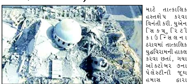
માટે તાત્કાલિક હસ્તેથી પ કરવા વિનંતી કરી. યુએન સિક ઍર ટી ૧ ઈન્સ લ ન ૪૨૧માં તાત્કાલિક યુદ્ધવિરમની હાકલ કરવા છતાં, ગયા ઓક્ટોબર ૭ના પેલેસ્ટીની જૂથ હમાસ દ્વારા

(એજન્સી) ગાઝા, તા.૫ ગાઝામાં ધાર્મિક બાબતોના મંત્રાલયે જાહેરાત કરી હતી કે ઈઝરાયેલે પેલેસ્ટીનીઓ સામેના તેના નરસંહારના યુદ્ધ દરમિયાન ગાઝા પટ્ટીમાં ૭૯% મસ્જિદોનો નાશ કર્યો હતો. ઈઝરાયેલી સેનાએ ગાઝાની ૧,૨૪૫ મસ્જિદોમાંથી ૮૧૪ મસ્જિદોને જમીનદોસ્ત કરી દીધી છે અને તેના તીવ્ર બોમ્બમારુ દરમિયાન અન્ય ૧૪૮૦ને ભારે નુકસાન પહોંચાડ્યું હોવાનું મંત્રાલયે જાહેર કર્યું. નિવેદનમાં જણાવાયું છે કે, મસ્જિદોની સાથે, ત્રણ ચર્ચને પણ નષ્ટ કરવામાં આવ્યા હતા અને ૬૦ કબ્રસ્તાનમાંથી ૧૯૦ને જાણીજોઈને નિશાન બનાવવામાં આવ્યા હતા. મંત્રાલયની મિલકતોને થયેલા નુકસાનની અંદાજિત નાણાકીય કિંમત રૂ. ૧૦ કરોડ ડોલર હોવાનું મંત્રાલયે ઉમેર્યું હતું. મંત્રાલયે ઈઝરાયેલી સેના પર કબરોની અપવિત્રતા, મુત્દેહોને બહાર કાઢવા અને મૃત્યુ પામેલા લોકો સામે ફર હિંસા કરવા, જેમ કે તેમના