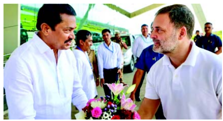
હુગમાં વડાપ્રધાન નરેન્દ્ર મોદીએ ચોથી ડિસેમ્બર ૨૦૨૩ના રોજ નેવીડીના દિવસે ૩૫ ફૂટ ઊંચી શિવાજી મહારાજની પ્રતિમાનું અનાવરણ કર્યું હતું અને એ પછી ૨૬ ઓગસ્ટે પ્રતિમા તૂટી પડી હતી. રાહુલ ગાંધીએ જણાવ્યું હતું કે આ દેશ બધાનો છે એવો છત્રપતિ શિવાજી મહારાજ સંદેશો આપ્યો હતો. આ મહાન યોદ્ધા અને મહારાજ જે સંદેશો આપ્યો છે ભારતીય બંધારણ એવો જ સંદેશો આપી રહ્યું છે. છત્રપતિ શિવાજી મહારાજ અને શાહી મહારાજ જેવા મહાનુભાવો ન હોત તો બંધારણ પણ ન હોત.

(એજન્સી) કોલ્હાપુર, તા. ૫ કોંગ્રેસના નેતા રાહુલ ગાંધીએ આજે ભાજપ સરકાર પર ભારે પ્રહારો કર્યા હતા અને ટકોર કરી હતી કે દેશના બંધારણ તથા લોકશાહી સંસ્થાઓને ખતમ કરીને અને લોકોને ડરાવીને પછી શિવાજી મહારાજની પ્રતિમા સામે માથું નમાવવાનો કોઈ અર્થ નથી. કોલ્હાપુરમાં શનિવારે છત્રપતિ શિવાજી મહારાજની પ્રતિમાનું અનાવરણ રાહુલ ગાંધીના હસ્તે થયું હતું. આ પ્રસંગે જાહેર સભાને સંબોધન કરતા રાહુલ ગાંધીએ સિંધુદુર્ગ જિલ્લામાં કિલ્લામાં લગાવેલી શિવાજી મહારાજની પ્રતિમા તૂટી પડી એ બદલ ભાજપની આકરી ટીકા કરી હતી અને કહ્યું હતું કે ભાજપની વિચારધારા જ યોગ્ય નથી. તેમણે ઉમેર્યું કે લોકોને ડરાવો છો અને બંધારણ તથા લોકશાહી સંસ્થાઓને ખતમ કરો છો અને એ પછી શિવાજી મહારાજની સામે માથું નમાવો તો તેનો કોઈ અર્થ રહેતો નથી. દેખીતી રીતે વડાપ્રધાન નરેન્દ્ર મોદી દ્વારા પ્રતિમા તૂટી પડી એ પછી માફી માંગવામાં આવી તેનો ઉલ્લેખ કરીને રાહુલે ઉપર મુજબ ટકોર કરી હતી. ગત ૩૦ ઓગસ્ટે વડાપ્રધાન નરેન્દ્ર મોદીએ પ્રતિમા તૂટવાના બનાવ બાદ કહ્યું હતું કે છત્રપતિ શિવાજી મહારાજ એ માત્ર રાજા નથી પણ મારા માટે તો એ દેવતા છે એટલે આજે અમે દેવતાના ચરણોમાં માથું નમાવીને એમની માફી માંગી છે. સિંધુ