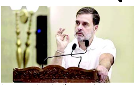
છે. પછાત દલિતો આનો સર્વે કરાવીશું અને આ બિલ પસાર થશે. વડાપ્રધાન નરેન્દ્ર મોદી પર પ્રહાર કરતા રાહુલ ગાંધીએ કહ્યું, "પહેલા પીએમ મોદી ૪૦૦ પાર કહેતા હતા. ત્યારબાદ હિન્દુસ્તાનના લોકોએ કહ્યું કે તેને સ્પર્શ કરી શક્યો નહીં, બાદમાં મોદીજીને બંધારણ સામે ઝૂકવું પડ્યું. બંધારણની રક્ષા કરવાના બે રસ્તા છે. જાતિ આધારિત ગણતરી અને ૫૦ ટકા અનામતની દિવાલ તોડી. મહારાષ્ટ્રમાં મરાઠા આરક્ષણનો મુદ્દો ખૂબ જ મહત્વપૂર્ણ છે અને કોંગ્રેસ તેનો ફાયદો ઉઠાવવા માંગે છે."

(એજન્સી) તા.૫ મહારાષ્ટ્રમાં વિધાનસભાની યૂટરૂની જાહેરાત થઈ નથી, છતાં તમામ રાજકીય પક્ષો યૂટરૂ મોડમાં આવી ગયા છે. વડાપ્રધાન નરેન્દ્ર મોદી અને વિપક્ષી નેતા રાહુલ ગાંધી બંને મોટા નેતાઓ શનિવારે (પાંચમી ઓક્ટોબર) મહારાષ્ટ્રમાં છે. આ દરમિયાન રાહુલ ગાંધીએ કોલ્હાપુરમાં મોટી જાહેરાત કરતા કહ્યું કે, "જો કોંગ્રેસ સત્તામાં આવશે તો અનામતની મર્યાદા વધારવામાં આવશે." નોંધનીય છે કે, હાલમાં આરક્ષણ પર ૫૦ ટકાની મર્યાદા છે. કોલ્હાપુરમાં સંવિધાન સન્માન સંમેલનમાં કોંગ્રેસ નેતા રાહુલ ગાંધીએ વચન આપતા કહ્યું હતું કે, "જાતિ આધારિત વસ્તી ગણતરી કરવામાં આવશે. સામાજિક-આર્થિક સર્વેક્ષણ હાથ ધરવામાં આવશે. અનામતની મર્યાદા ૫૦ ટકાથી વધારવી જોઈએ." અગાઉ શરદ પવારે પણ સાંગલીમાં આ જ વાત કહી હતી. આનાથી સ્પષ્ટ છે કે મહારાષ્ટ્ર વિધાનસભા યૂટરૂમાં વિપક્ષ અનામતને મહત્વનો મુદ્દો બનાવવા જઈ રહ્યો છે. કોંગ્રેસ નેતા રાહુલ ગાંધીએ કહ્યું કે, "જો કોંગ્રેસ સત્તામાં આવશે તો જાતિ આધારિત વસ્તી ગણતરી કરાશે. કોની કેટલી વસ્તી છે અને તેમની પાસે કેટલી આર્થિક પકડ છે. આ માટે અમે સામાજિક-આર્થિક સર્વેક્ષણ કરીશું. ભારતના IAS ક્લાં બેઠા છે અને ક્લાં