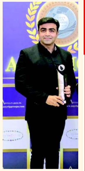
તમારું કામ જ તમારી ઓળખ

આ અભ્યાસનો એક હેતુ વન્ય જીવો અને લોકો વચ્ચેનો સંઘર્ષ ઓછો થાય તેવો પણ છે