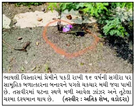
ભાયલી વિસ્તારમાં પ્રેમીને પકડી રાખી ૧૬ વર્ષની સગીરા પર સામૂહિક બળાત્કારના બનાવને પગલે ચકચાર મચી જવા પામી છે. તસવીરમાં ઘટના સ્થળે મળી આવેલ ઝાંઝર અને તૂટેલા યશ્મા દર્શ્યમાન થાય છે.

(સંવાદદાતા દ્વારા) વડોદરા, તા.૫ હાલમાં નવરાત્રિ ચાલી રહી છે ત્યારે બીજા નોરતે વડોદરા જિલ્લાના ભાયલી વિસ્તારમાં સામૂહિક દુષ્કર્મની ઘટના બનતા ચકચાર મચી જવા પામી છે. જેમાં ૧૬ વર્ષીય સગીરા પોતાના પ્રેમી યુવક સાથે રાત્રિના સમયે ફરવા માટે નીકળી હતી અને સમિયાલા રોડ પર એકાંત જગ્યામાં બંને બેઠા હતા. તે દરમિયાન ત્રણ જેટલા શખ્સો ધસી આવી યુવકને પકડી રાખ્યા બાદ ત્રણ જણાએ વારાફરતી સગીરા પર દુષ્કર્મ ગુજારી ત્યાંથી નાસી ગયા હતા. ૪ ઓક્ટોબરના રોજ રાત્રિના ૧૧ વાગ્યાના અરસામાં ૧૬ વર્ષની પરપ્રાંતીય સગીરા લક્ષ્મીપુરા વિસ્તારમાં તેના પ્રેમી યુવકને મળી હતી અને ત્યારબાદ બંને જણા ફરવા માટે નીકળ્યા હતા. ફરતા ફરતા તેઓ ભાયલીથી