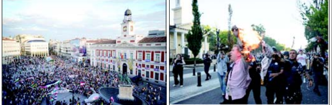
૫ ઓક્ટોબર, ૨૦૨૪ના રોજ મેડ્રિડ, સ્પેનમાં આ હુમલાની વર્ષગાંઠ પહેલાં લોકો ઈઝરાયેલ અને હિઝબુલ્લાહ વચ્ચેના સંઘર્ષમાં વધારો થવાનો વિરોધ કરવા અને ગાઝા પટ્ટી અને ઈઝરાયેલના કબજા હેઠળના વેસ્ટ બેંકમાં લશ્કરી કાર્યવાહીનો અંત લાવવા માટે એકત્ર થયા હતા.

૪૦,૦૦૦થી વધુ પેલેસ્ટીની તરફી પ્રદર્શનકારોએ મધ્ય લંડનમાં રેલી કાઢી હતી અને હજારો લોકો પેરિસ, બર્લિન, મનિલા અને કેપ ટાઉનમાં પણ એકઠા થયા હતા.