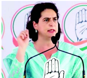
કહ્યું, 'નફાકારક મીની રત્ન ફાર્માસ્યુટિકલ કંપનીને વેચવા પાછળ સરકારનો શું હેતુ છે? કોર્પોરેશન લિમિટેડ (IMPCL)ની સ્થાપના ૧૯૭૮માં

(એજન્સી) તા.૬ કોંગ્રેસ નેતા પ્રિયંકા ગાંધી રવિવારે 'ઇન્ડિયન મેડિસિન્સ ફાર્માસ્યુટિકલ કોર્પોરેશન લિમિટેડ' (IMPCL)નું ખાનગીકરણ કરવાની તેની કથિત યોજનાઓ પર નરેન્દ્ર મોદી સરકાર પર નિશાન સાધ્યું અને પુછ્યું કે 'પસંદગીના નિયમો તિજોરી ભરવા' સિવાય તેનો હેતુ શું છે. કોંગ્રેસના મહાસચિવ પ્રિયંકા ગાંધી વાડ્રાની ટિપ્પણીઓ એવા અહેવાલો વચ્ચે આવી છે કે સરકાર ફાર્માસ્યુટિકલ કંપનીનું વિનિવેશ કરવાની યોજના બનાવી રહી છે, જેણે ઘણા સ્થાનિક રહેવાસીઓમાં ચિંતા ઊભી કરી છે જેમની આજીવિકાને અસર થઈ શકે છે. પ્રિયંકા ગાંધીએ સોશિયલ મીડિયા પ્લેટફોર્મ 'X' પર એક પોસ્ટમાં