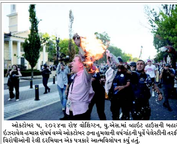
ઓક્ટોબર ૫, ૨૦૨૪ના રોજ વોશિંગ્ટન, યુ.એસ.માં વ્હાઈટ હાઉસની બહાર ઈઝરાયેલ-હમાસ સંઘર્ષ વચ્ચે ઓક્ટોબર ૭ના હુમલાની વર્ષગાંઠની પૂર્વે પેલેસ્ટીની તરફી વિરોધીઓની રેલી દરમિયાન એક પત્રકારે આત્મવિલોપન કર્યું હતું.