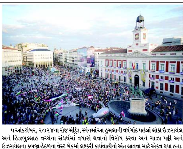
૫ ઓક્ટોબર, ૨૦૨૪ના રોજ મેડ્રિડ, સ્પેનમાં આ હુમલાની વર્ષગાંઠ પહેલાં લોકો ઈઝરાયેલ અને હિઝબુલ્લાહ વચ્ચેના સંઘર્ષમાં વધારો થવાનો વિરોધ કરવા અને ગાઝા પટ્ટી અને ઈઝરાયેલના કબજા હેઠળના વેસ્ટ બેંકમાં લશ્કરી કાર્યવાહીનો અંત લાવવા માટે એકત્ર થયા હતા.

(એજન્સી) તા. ૬ ૬ ઓક્ટોબર, ૨૦૨૪ના રોજ તેલ અલીવ પર હુમલાના એક વર્ષ નિમિત્તે હમાસ દ્વારા ઘાતક હુમલા દરમિયાન અપહરણ કરાયેલા બંધકોને સમર્થન દર્શાવવા વિરોધીઓ મુખ્ય માર્ગને અવરોધી રહ્યા છે. પેલેસ્ટીની એન્કલેવમાં ઈઝરાયેલના યુદ્ધની શરૂઆત તેની પ્રથમ વર્ષગાંઠની નજીક આવી રહી છે ત્યારે ગાઝા અને મધ્ય-પૂર્વમાં રક્તપાતનો અંત લાવવાની માંગ સાથે હજારો વિરોધીઓ શનિવારે વિશ્વભરના મુખ્ય શહેરોમાં શેરીઓમાં આવ્યા હતા. ૪૦,૦૦૦થી વધુ પેલેસ્ટીની તરફી પ્રદર્શનકારોએ મધ્ય લંડનમાં રેલી કાઢી હતી અને હજારો લોકો પેરિસ, બર્લિન, મનિલા અને કેપ ટાઉનમાં પણ એકઠા થયા હતા. વોશિંગ્ટનમાં વ્હાઈટ હાઉસની નજીક પણ દેખાવો યોજવામાં આવ્યા હતા, જેમાં ગાઝા અને લેબેનોનમાં લશ્કરી ઝુંબેશમાં તેના સાથી ઈઝરાયેલ માટે યુએસ સમર્થનની વિરોધ કરવામાં આવ્યો હતો. હમાસના ૭ ઓક્ટોબર, ૨૦૨૩ના રોજ દક્ષિણ ઈઝરાયેલમાં હુમલાના લગભગ એક વર્ષ પછી ન્યૂયોર્ક સિટીમાં ઓક્ટોબર ૫, ૨૦૨૪ના રોજ થયેલા પ્રદર્શન દરમિયાન વિરોધીઓ એમ્પાયર સ્ટેટ બિલ્ડિંગની સામે ટ્રાફિકને અટકાવી રહ્યા હતા. ન્યૂયોર્ક સિટીના ટાઈમ્સ સ્ક્વેર ખાતે દેખાવકારોએ કાળા અને સફેદ કફીલે સ્કાર્ફ પહેલી હતા અને સૂરોચ્ચાર કર્યા હતા કે, ‘ગાઝા, લેબેનોન