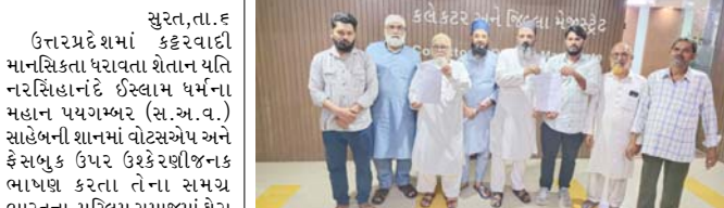
સુરત, તા. ૬

ઉત્તરપ્રદેશમાં કટ્ટરવાદી માનસિકતા ધરાવતા શેતાન યતિ નરસિંહાનંદે ઈસ્લામ ધર્મના મહાન પયગમ્બર (સ.અ.વ.) સાહેબની શાનમાં વોટસએપ અને ફેસબુક ઉપર ઉકેર રાખી જનક ભાષણ કરતા તેના સમગ્ર ભારતના મુસ્લિમ સમાજમાં ઘેરા પડ્યા અને પ્રત્યાષા પડ્યા છે અને ડેર-નેર વિરોધ પ્રદર્શનો થઈ રહ્યા છે અને તેની સામે કડક કાર્યવાહી કરવાની માંગ ઉઠી છે. જેમાં સુરત ખાતે ગૌંબિયા બાલાપીર ચેરિટીબલ ટ્રસ્ટ દ્વારા જિલ્લા કલેક્ટરને સંબંધિત પાઠવેલી તેની સામે કાર્યવાહી કરવાની કાર્યવાહી કરવાની માંગ કરી છે. કટ્ટરવાદી યતિ નરસિંહાનંદે પયગમ્બર