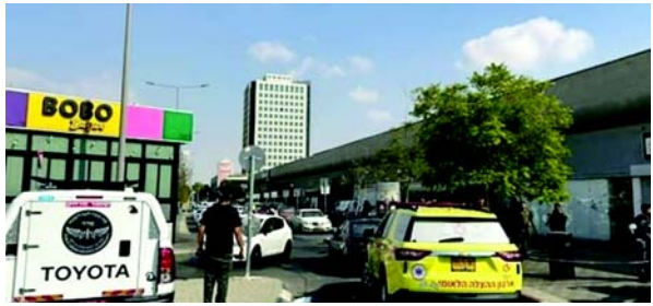
મેડિકલ સેન્ટરમાં લઈ જવાયા હતા જ્યાં એકની હાલત ગંભીર માનવામાં આવે છે. પહેલી ઓક્ટોબરે પણ ઈઝરાયેલની રાજધાની તેલ અવીવમાં આવ્યો હુમલો થયો હતો તેમાં પણ કેટલાક લોકો માર્યા ગયા હતા. પોલીસે આઠનાં મોત થયાનું ત્યારે જાહેર કર્યું હતું. પાટનગરના હુમલામાં બે બંદૂકબાજો હતા એવું પોલીસ માને છે અને એ બંનેને ઈઝરાયેલની પોલીસે ઠાર કર્યા હતા.

(એજન્સી) તા.૬ ઈઝરાયેલના બિરશેબા વિસ્તારમાં એક વ્યક્તિએ બેફામ ગોળીબાર કરતા એક નાગરિકનું મૃત્યુ થયું હતું અને બીજા નવ ઘાયલ થયા હતા. ઈઝરાયેલ પોલીસે વળતી કાર્યવાહી કરીને ગોળીબાર કરનાર હુમલાખોરને ઠાર માર્યો હતો તેવું પોલીસે જાહેર કર્યું હતું. પોલીસે આ હુમલો આતંકવાદી ગણાવ્યો હતો.