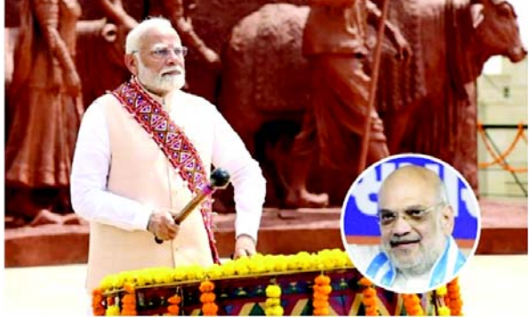
સમસ્યાઓ તરફ ટુકડે-ટુકડે જોવાને બદલે વડાપ્રધાન મોદીએ નક્કર સમગ્રપણે નિરાકરણનો દેશને સંદેશો અને નવી દૃષ્ટિ આપ્યા છે

(એજન્સી) નવી દિલ્હી, તા.૭ કેન્દ્રના ગૃહમંત્રી અમિત શાહે જણાવ્યું હતું કે, વડાપ્રધાન નરેન્દ્ર મોદીની જાહેર જીવનમાં સેવાની લાંબી યાત્રા એ સમર્પણની વિલક્ષણ પ્રેરણાદાયક યાત્રા છે જે બતાવે છે કે, કેવી રીતે એક વ્યક્તિએ તેમનું સમગ્ર જીવન દેશના હિતમાં અને