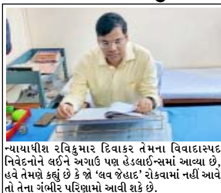
ન્યાયાધીશ રવિકુમાર દિવાકર તેમના વિવાદાસ્પદ નિવેદનોને લઈને અગાઉ પણ હેડલાઈન્સમાં આવ્યા છે, હવે તેમણે કહ્યું છે કે જો 'લવ જેહાદ' રોકવામાં નહીં આવે તો તેના ગંભીર પરિણામો આવી શકે છે.

નિવેદનને ફગાવી દીધું હતું અને સંકેત આપ્યો હતો કે તેણી આલીમથી પ્રભાવિત હતી. ન્યાયાધીશે આશ્ચર્ય વ્યક્ત કર્યું કે છોકરી ઘણા વર્ષોથી તેના માતાપિતાથી દૂર રહેતી હોવાથી, તે એન્ડ્રોઈડ ફોન સાથે કોર્ટમાં આવવા અને જીવનના અન્ય ખર્ચાઓ તેને કેવી રીતે પરવડી શકે છે? તેમણે કહ્યું કે આલીમે તેને આર્થિક મદદ કરી હશે. ન્યાયાધીશ દિવાકરે કોર્ટ રજિસ્ટ્રારને તેમના ચુકાદાની નકલ પોલીસ અધિકારક બરેલીને મોકલવા માટે તમામ પોલીસ સ્ટેશનોને ચેતવણી આપવા માટે પણ નિર્દેશ આપ્યો હતો કે, જ્યારે પણ લવ જેહાદ અથવા અન્ય પ્રકારના ગેરકાયદેસર ધર્માતરણના કેસ હોય, તો અન્ય કાયદામાં કલમો સાથે, પોલીસે ઉત્તર પ્રદેશના ગેરકાયદેસર ધર્મ પરિવર્તનના નિષેધ અધિનિયમ, ૨૦૨૧ હેઠળ પણ કાર્યવાહી કરવી જોઈએ. ન્યાયાધીશે એમ પણ કહ્યું હતું કે ચુકાદાની નકલો યુપીના પોલીસ મહાનિર્દેશક (ડીજીપી) અને ગુડ સચિવને મોકલવામાં આવશે જેથી તેઓ રાજ્યમાં ગેરકાનૂની ધર્માતરણ કાયદાનું કડક પાલન સુનિશ્ચિત કરી શકાય. 'લવ જેહાદ' જેવા શબ્દોનો ઉપયોગ મોટાભાગે (સો. : ડ વાયર)