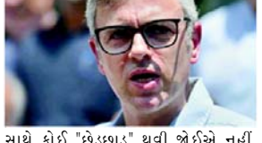
સાથે કોઈ "છેડછાડ" થવી જોઈએ નહીં. અબ્દુલ્લાહે અહીં પત્રકારોને કહ્યું, "પારદર્શિતા હોવી જોઈએ. જે પણ થાય તે પારદર્શક રીતે થવું જોઈએ. જનાદેશ સાથે કોઈ છેતરપિંડી ન થવી જોઈએ. જો જનાદેશ ભાજપની વિરુદ્ધ હોય તો ભાજપે કોઈ જુગાડ કે અન્ય કોઈ યુક્તિ ન રમવી જોઈએ અને કેન્દ્રને સંસદીય ચૂંટણીમાં જે રીતે

(એજન્સી) તા.૮ જમ્મુ-કાશ્મીરમાં નેશનલ કોન્ફરન્સ-કોંગ્રેસ ગઠબંધન સરકાર બનાવે તેવી શક્યતા છે. મંગળવારના વલણમાં, ગઠબંધન ૮૦માંથી ૫૧ બેઠકો પર આગળ છે જ્યારે ભારતીય જનતા પાર્ટી (BJP) ૨૬ બેઠકો પર આગળ છે. ચૂંટણી પંચની વેબસાઈટ પર ઉપલબ્ધ વલણો અનુસાર, પીપલ્સ ડેમોક્રેટિક પાર્ટી (PDP) કેન્દ્રશાસિત પ્રદેશમાં પાંચ બેઠકો પર આગળ છે, જ્યારે સ્વતંત્ર ઉમેદવારો સાત બેઠકો પર આગળ છે. વલણો અનુસાર, નેશનલ કોન્ફરન્સ (NC) ૪૧ બેઠકો પર આગળ છે જ્યારે તેની સહયોગી કોંગ્રેસ ૧૦ બેઠકો પર આગળ છે. વલણો NC તેના હરીફ કરતાં આગળ હોવાથી પાર્ટીના ઉપાધ્યક્ષ ઓમર અબ્દુલ્લાહે કહ્યું કે જમ્મુ અને કાશ્મીરમાં આદેશ