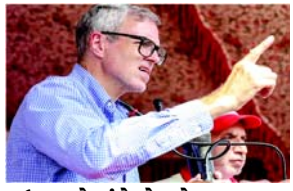
ઉમરનો બંને બેઠકો બડગામ તથા ગંદેરબાલ બેઠક પરથી વિજય : કોંગ્રેસને છ બેઠક મળી

શ્રીનગર, તા. ૮ જમ્મુ-કાશ્મીર તથા હરિયાણા વિધાનસભાની ચૂંટણીઓમાં પરિણામો જાહેર થયા છે અને કાશ્મીરમાં કલમ ૩૭૦ રદ કરવા સામેના પગલાં સામે લોકરોષનો સંકેત આપતો ચુકાદો આપ્યો છે અને નેશનલ કોન્ફરન્સ તથા કોંગ્રેસના જોડાણને બહુમતી સાથે ભવ્ય વિજય મળ્યો છે. જ્યારે એકિઝટ પોલ હરિયાણા બાબતમાં ખોટા પડ્યા છે અને અહીં ભાજપે અનેક પ્રકારે વચ્ચે વિજયની હેટ્ટીક કરીને રાજ્યમાં સત્તા જાળવી રાખી છે એટલે કોંગ્રેસ માટે હરિયાણામાં ૧૦ વર્ષ પછી પણ નિરાશા હાથ લાગી છે. રજમ્મુ અને કાશ્મીરમાં વિધાનસભાની કુલ ૮૦ બેઠકોમાંથી એકલા નેશનલ કોન્ફરન્સને ૪૧ બેઠકો પ્રાપ્ત થઈ જ્યારે સાથી પક્ષ કોંગ્રેસને ૩૯ બેઠકો મળી છે. આ રીતે કાશ્મીરમાં એનસી અને કોંગ્રેસ બહુમતી મેળવીને ચૂંટણીઓમાં સપાટો બોલાવી દીધો છે. જ્યારે ભાજપને જમ્મુ અને કાશ્મીરમાં ૨૭ બેઠકો મળી છે એટલે અસરકારક દેખાવ કર્યો છે પણ બહુમતીથી દૂર રહ્યું છે જ્યારે મહેબુબા