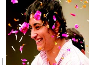
આ રીતે વિનેશનો ૬,૦૧૫ મતોની સરસાઈથી વિજય થયો હતો. મત ગણતરી શરૂ થઈ ત્યારે શરૂઆતમાં આગળ રહેલા રોમાંચક બની રહી હતી કેમ કે ઓલમ્પિકના ફાઈનલમાં વજનના કારણે મેડલ ચૂકીને નિષ્ફળતા મેળવ્યા બાદ હતાશ થયા વિના વિનેશ ફોગટે રાજકીય દંગલમાં જોરદાર દેખાવ કર્યો છે અને પોતાના હરીફને પછાડી દીધો છે. વિનેશને કુલ ૬૫,૦૮૦ મતો મળ્યા હતા જ્યારે એમના નજીકના હરીફ ભાજપના યોગેશકુમારને ૫૮,૦૬૫ મતો મળ્યા હતા