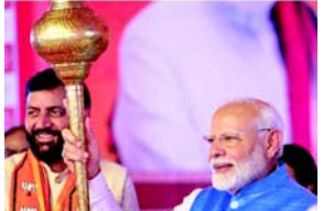
પરિણામો ભાજપ-૪૬ કોંગ્રેસ-૨૬ લોકદળ-૨ અન્ય-૩ કુલ બેઠકો ૮૦

ચંદીગઢ, તા. ૮ ચૂંટણીઓ પહેલા મુખ્યમંત્રીને બદલી નાખવામાં આવ્યા છતાં અને શાસન વિરોધી પરિબલોનો ભય હોવા છતાં તમામ પડકારોને પહોંચી વળીને ભારતીય જનતા પાર્ટીએ હરિયાણામાં વિધાનસભાની ચૂંટણીઓમાં