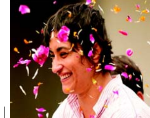
આ રીતે વિનેશનો ૬,૦૧૫ મતોની સરસાઈથી વિજય થયો હતો. મત ગણતરી શરૂ થઈ ત્યારે શરૂઆતમાં આગળ રહેલા રોમાંચક બની રહી હતી કેમ કે ઓલમ્પિકના ફાઈનલમાં વજનના કારણે મેડલ ચૂકીને નિષ્ફળતા મેળવ્યા બાદ હતાશ થયા વિના વિનેશ ફોગટે રાજકીય દંગલમાં જોરદાર દેખાવ કર્યો છે અને પોતાના હરીફને પછાડી દીધો છે. વિનેશને કુલ ૬૫,૦૮૦ મતો મળ્યા હતા જ્યારે એમના નજીકના હરીફ ભાજપના યોગેશકુમારને ૫૮,૦૬૫ મતો મળ્યા હતા

અપસેટ સર્જી દીધો હતો. કોંગ્રેસના ઉમેદવાર તરીકે તેઓ ચૂંટણી લડી રહ્યા હતા. આ બેઠક પરના રાષ્ટ્રીય લોક દળના ઉમેદવાર સુરેન્દ્ર લાથર ત્રીજા ક્રમે રહ્યા છે. જિંદ જિંદલામાં આ બેઠકની ચૂંટણી સૌથી વધુ પ્રતિષ્ઠાભરી અને રોમાંચક બની રહી હતી કેમ કે ઓલમ્પિકના ફાઈનલમાં વજનના કારણે મેડલ ચૂકીને નિષ્ફળતા મેળવ્યા બાદ હતાશ થયા વિના વિનેશ ફોગટે રાજકીય દંગલમાં જોરદાર દેખાવ કર્યો છે અને પોતાના હરીફને પછાડી દીધો છે. વિનેશને કુલ ૬૫,૦૮૦ મતો મળ્યા હતા જ્યારે એમના નજીકના હરીફ ભાજપના યોગેશકુમારને ૫૮,૦૬૫ મતો મળ્યા હતા