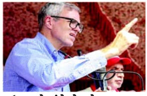
ઉમરનો બંને બેઠકો બડગામ તથા ગંદેરબાલ બેઠક પરથી વિજય : કોંગ્રેસને છ બેઠક મળી

શ્રીનગર, તા. ૮ જમ્મુ-કાશ્મીર તથા હરિયાણા વિધાનસભાની ચૂંટણીઓમાં પરિણામો જાહેર થયા છે અને કાશ્મીરમાં કલમ ૩૭૦ રદ કરવા સામેના પગલાં સામે લોકરોષનો સંકેત આપતો ચુકાદો આપ્યો છે અને નેશનલ કોન્ફરન્સ તથા કોંગ્રેસના જોડાણને બહુમતી સાથે ભવ્ય વિજય મળ્યો છે. જ્યારે એકિઝટ પોલ હરિયાણા બાબતમાં ખોટા પડ્યા છે અને અહીં ભાજપે અનેક પ્રકારે વચ્ચે વિજયની હેટ્ટીક કરીને રાજ્યમાં સત્તા જાળવી રાખી છે એટલે કોંગ્રેસ માટે હરિયાણામાં ૧૦ વર્ષ પછી પણ નિરાશા હાથ લાગી છે. રજમ્મુ અને કાશ્મીરમાં વિધાનસભાની કુલ ૮૦ બેઠકોમાંથી એકલા નેશનલ કોન્ફરન્સને ૪૧ બેઠકો પ્રાપ્ત થઈ જ્યારે સાથી પક્ષ કોંગ્રેસને ૩૯ બેઠકો મળી છે. આ રીતે કાશ્મીરમાં એનસી અને કોંગ્રેસ બહુમતી મેળવીને ચૂંટણીઓમાં સપાટો બોલાવી દીધો છે. જ્યારે ભાજપને જમ્મુ અને કાશ્મીરમાં ૨૭ બેઠકો મળી છે એટલે અસરકારક દેખાવ કર્યો છે પણ બહુમતીથી દૂર રહ્યું છે જ્યારે મહેબુબા