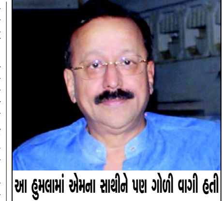
આ હુમલામાં એમના સાથીને પણ ગોળી વાગી હતી મહાયુતી સરકાર પર આકરા પ્રહારો કર્યા છે. આજે સાંજે બાંદ્રા પૂર્વમાં આવેલી ગુજરાત સિદ્ધીકીની

હત્યાની ઘટના પાછળ લોરેન બિસ્નોઈની ગેઝનો હાથ હોવાની શંકા સિદ્ધીકીની હત્યાએ બોલિવુડને હચમચાવી નાખ્યું છે. ત્રણ શકમંદોમાંથી બે પકડાઈ ગયા છે અને ત્રીજા ફરારને પોલીસ શોધી રહી છે.