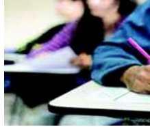
ધોરણ-૧૨ સામાન્ય પ્રવાહની પરીક્ષા ૧૩ માર્ચના રોજ પૂર્ણ થશે. પ્રાપ્ત માહિતી અનુસાર, શિક્ષણ બોર્ડ દ્વારા ધોરણ-૧૦ અને ૧૨ની પરીક્ષાનો કાર્યક્રમ જાહેર કરવામાં આવ્યો છે. જે અનુસાર શિક્ષણ

(સંવાદદાતા દ્વારા) અમદાવાદ, તા.૧૫ ગુજરાત માધ્યમિક અને ઉચ્ચતર માધ્યમિક શિક્ષણ બોર્ડ દ્વારા ધોરણ-૧૦ અને ૧૨ની પરીક્ષાનો કાર્યક્રમ જાહેર કર્યો છે. જે અનુસાર રાજ્યમાં આ વખતે પ્રથમ વખત ફેબ્રુઆરી માસથી જ શિક્ષણ બોર્ડની પરીક્ષા શરૂ થશે. ધોરણ-૧૦ અને ૧૨ની પરીક્ષા ૨૭ ફેબ્રુઆરીથી શરૂ થશે અને ૧૩ માર્ચના રોજ પરીક્ષા પૂર્ણ થશે. બોર્ડ દ્વારા લેવાનારી ધોરણ-૧૦ અને ૧૨ સાયન્સની પરીક્ષા ૧૦ માર્ચના રોજ પૂર્ણ થશે. જ્યારે