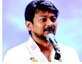
ઉદયનિધિ તામિલનાડુના નાયબ મુખ્યમંત્રી છે

સનાતન ધર્મ અંગેના પોતાના વિધાનો બદલ માફી માંગવાનો ઉદયનિધિનો ઈન્કાર અને કહ્યું કે મારા એ ઉચ્ચારણો મહિલાઓ ઉપર સનાતન ધર્મની દમનકારીઓ તરફનો ઈશારો હતો