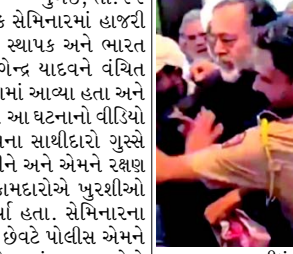
ભાષણ કરવા દીધું નહોતું. કોંગ્રેસે અનામત વિરોધી અભિગમ અપનાવ્યો છે અને અનામતને ખતમ કરવાની વાતો કરે છે ત્યારે યોગેન્દ્ર યાદવ કોંગ્રેસને શું કામ ટેકો આપે છે એ બાબતે કાર્ય કરો એમને પૂછી રહ્યા હતા અને ખીજાયા હતા.. દલીલો ઉગ્ર બની ગઈ હતી અને કામદારોએ યોગેન્દ્ર યાદવને ધક્કા ચડાવ્યા હતા.

(એજન્સી) મહારાષ્ટ્રના આકોલામાં યોજાયેલા એક સેમિનારમાં હાજરી આપવા આવેલા સ્વરાજ ઈન્ડિયા પાર્ટીના સ્થાપક અને ભારત જોડો અભિયાનના નેશનલ કન્વીનર યોગેન્દ્ર યાદવને વંચિત બહુજન અઘાડી કાર્યકરો દ્વારા ધક્કા ચડાવવામાં આવ્યા હતા અને એમને સતત પરેશાન કરવામાં આવ્યા હતા. આ ઘટનાનો વીડિયો વાયરલ થઈ રહ્યો છે. પોલીસ અને યાદવના સાથીદારો ગુસ્સે થયેલા કામદારોથી યોગેન્દ્ર યાદવને બચાવીને અને એમને રક્ષણ આપીને સુરક્ષિત સ્થળે લઈ ગયા હતા. કામદારોએ પુરશીઓ તોડી નાખી હતી અને ભારે સુગ્રોચાર કર્યા હતા. સેમિનારના સ્થળે ખૂબ જ તણાવ ઊભો થઈ ગયો હતો છેવટે પોલીસ એમને શાંત કરવામાં સફળ રહી હતી. આકોલામાં ભારત જોડો અભિયાન અંતર્ગત એક સેમીનાર યોજાયો હતો જેમાં યોગેન્દ્ર યાદવ ભાષણ આપી રહ્યા હતા પરંતુ વંચિત બહુજન અઘાડી કામદારો ત્યાં ધસી આવ્યા હતા અને એમને ભાષણ કરવા દીધું નહોતું પણ ભારે ધક્કા મૂકી તેમની સાથે કરી હતી અને એમને