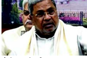
પોલીસ દળની ભૂમિકા પર ભાર મુકતા, મુખ્યમંત્રીએ નાગરિકોના જીવન અને ગૌરવને બચાવતા મૃત્યુ પામેલા નાયકો માટે શોક વ્યક્ત કર્યો હતો. સિદ્ધારમૈયાએ જણાવ્યું હતું કે, “અસમાનતાવાળા સમાજમાં પ્રચંડ શોષણ અને અન્યાય થવાનું બંધાયેલ છે. અમારું પોલીસ દળ

(એજન્સી) તા. ૨૨ ક્ષાટિકના મુખ્યમંત્રી સિદ્ધારમૈયાએ કહ્યું કે દેશની જીડીપી તેની કાયદો અને વ્યવસ્થા સાથે સીધી રીતે જોડાયેલી છે. સિદ્ધારમૈયાએ બેંગલુરુમાં આયોજિત પોલીસ સ્મારક દિવસ દરમિયાન જણાવ્યું હતું કે, “મજબૂત કાયદો અને વ્યવસ્થા વ્યવસ્થા વિશાળ રોકાણ આકર્ષવામાં મદદ કરે છે, જે બદલામાં વધુ નોકરીઓનું સર્જન કરે છે અને આર્થિક વૃદ્ધિને વેગ આપે છે. આર્થિક વૃદ્ધિ GDP અને માથાદીઠ આવકમાં વધારો કરે છે.” સિદ્ધારમૈયાએ નોંધ્યું હતું કે રાજ્યમાં ૧૨ અધિકારીઓ સહિત ૨૧૬ જેટલા પોલીસ કર્મચારીઓએ છેલ્લા એક વર્ષમાં ફરજની લાઈનમાં પોતાનો જીવ આપ્યો હતો. દેશમાં આંતરિક સુરક્ષા જાળવવામાં ગુનાખોરી અટકાવવા અને આપત્તિઓને નિયંત્રિત કરવામાં