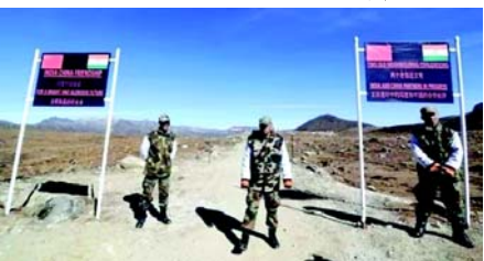
આવ્યા છે તેની પુષ્ટિ કરવાનો સમાવેશ થશે. સૂત્રોએ જણાવ્યું હતું કે, હાલ વિશ્વાસના આધારે કામગીરી કરવામાં આવી રહી છે. ગલવાન વિસ્તાર સહિત ચાર બંધર ઝોન વિશે હજુ સુધી કોઈ ચર્ચા થઈ નથી. સૂત્રોએ જણાવ્યું હતું કે ડેમથોક અને ડેપસાંગ વિસ્તારોમાં પેટ્રોલિંગ સફળ થયા બાદ બંધર ઝોનમાં ફરીથી પેટ્રોલિંગ શરૂ કરવાની શક્યતા અંગે કોર્પ્સ કમાન્ડર સ્ટરે ચર્ચા વિચારણા કરશે. બંને દેશોના સ્થાનિક લશ્કરી કમાન્ડરો દિવસ માટે આયોજિત કામગીરીનું સંકલન કરવા માટે દરરોજ સવારે હોટલાઈન પર દૈનિક ચર્ચામાં વ્યસ્ત રહે છે. વધુમાં તેઓ પ્રોટોકોલની સમીક્ષા કરવા અને સંરેખિત કરવા માટે દરરોજ એક કે બે વાર નિયુક્ત પોઈન્ટ પર વ્યક્તિગત મીટિંગ્સ કરે છે. અમે તમને જણાવી દઈએ કે આ વિકાસ વિદેશ પ્રધાન (EAM) એસ જયશંકરે ૨૭ ઓક્ટોબરે કહ્યું હતું કે એપ્રિલ ૨૦૨૦માં સરહદ અવરોધ શરૂ થાય તે પહેલાં ભારત અને ચીન ટૂંક સમયમાં લદ્દાખમાં વાસ્તવિક નિયંત્રણ રેખા (LAC) પર ફરીથી પેટ્રોલિંગ શરૂ કરશે અને બોર્ડર પુનઃસ્થાપિત કરશે. ગયા અઠવારિયે, ભારતે જાહેરાત કરી હતી કે તેણે પૂર્વી લદ્દાખમાં એલએસી પર પેટ્રોલિંગ કરવા માટે

(એજન્સી) તા.૩૦ વિદેશ પ્રધાન (EAM) એસ જયશંકરે ૨૭ ઓક્ટોબરના રોજ કહ્યું હતું કે ભારત અને ચીન ટૂંક સમયમાં લદ્દાખમાં વાસ્તવિક નિયંત્રણ રેખા (LAC) પર પેટ્રોલિંગ ફરી શરૂ કરશે, એપ્રિલ ૨૦૨૦માં બોર્ડર સ્ટેન્ડ-ઓફ શરૂ થાય તે પહેલાંની વ્યવસ્થાને પુનઃસ્થાપિત કર્યા પછી આ વિકાસ થયો છે. પૂર્વી લદ્દાખના ડેપસાંગ અને ડેમથોક વિસ્તારમાં ભારતીય અને ચીની સૈનિકો વચ્ચે ડિસએન્ગેજમેન્ટની પ્રક્રિયા લગભગ પૂર્ણ થઈ ગઈ છે. સંસદના સૂત્રોએ જણાવ્યું હતું કે ભારતીય સેના અને ચીનની પીપલ્સ લિબરેશન આર્મી (પીએલએ) બંને હાલમાં વાસ્તવિક નિયંત્રણ રેખા (એલએસી) સાથેના સંવેદનશીલ વિસ્તારોમાં કર્મચારીઓને પાછા ખેંચવાની અને લશ્કરી માળખાને તોડી પાડવાની પુષ્ટિ કરી રહ્યા છે. ચકાસણી પ્રક્રિયા બંને સૈન્ય દ્વારા સંયુક્ત રીતે હાથ ધરવામાં આવશે, જેમાં સંમત શરતો અનુસાર સ્થિતિઓ પાલી કરવામાં આવી છે અને સ્થાપનો દૂર કરવામાં