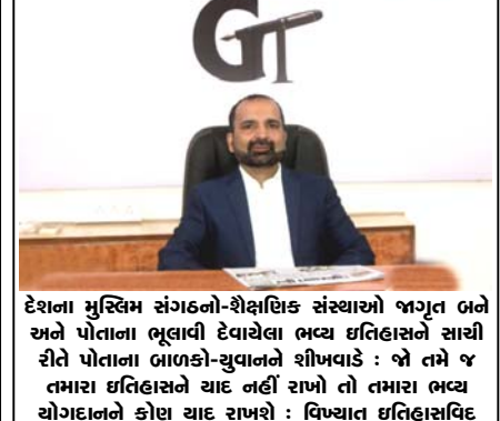
દેશના મુસ્લિમ સંગઠનો-શૈક્ષણિક સંસ્થાઓ જાગૃત બને અને પોતાના ભૂલાવી દેવાયેલા ભવ્ય ઇતિહાસને સાચી રીતે પોતાના ભાષણ-ચુલાબને શીખવડે : જો તમે જ તમારા ઇતિહાસને યાદ નહીં રાખો તો તમારા ભવ્ય યોગદાનને કોણ શ્રદા રાખશે : વિશ્વાસ ઇતિહાસવિદ્