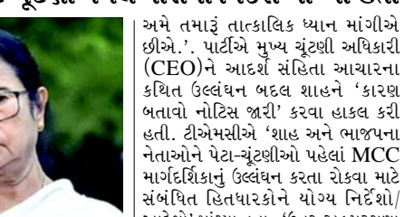
પરગણામાં પેટ્રાપોલ ખાતે સંકલિત ચેકપોસ્ટ, પેસેન્જર ટર્મિનલ અને મૈત્રી દ્વારા ઉદ્દેશ્યકાર્યક્રમ દરમિયાન કેન્દ્રીય ગૃહ પ્રધાન અમિત શાહ દ્વારા થયેલા આદર્શ આચાર સંહિતાના ગંભીર ઉલ્લંઘન અંગે

તૃણમૂલ કોંગ્રેસે કેન્દ્રીય ગૃહ પ્રધાન અમિત શાહ પર તેમની પશ્ચિમ બંગાળની તાજેતરની મુલાકાત દરમિયાન ૧૩ નવેમ્બરની પેટાચૂંટણી માટેની આદર્શ આચારસંહિતાનું ઉલ્લંઘન કરવાનો આરોપ મૂક્યો હતો અને ચૂંટણી પંચને વિનંતી કરી હતી કે તેઓ રાજ્યમાં એક સત્તાવાર કાર્યક્રમમાં રાજકીય ટિપ્પણી કરવા બદલ તેમની સામે કાર્યવાહી કરે. રાજ્યમાં શાસક પક્ષ ECને ભાજપના નેતાને શો-કોઝ નોટિસ જારી કરવા પણ અપીલ કરી હતી અને પેટાચૂંટણી-બાઉન્ડ જિલ્લાઓમાં સત્તાવાર કાર્યોમાં 'રાજકીય ટિપ્પણીઓ' કરવાથી રોકવા માટે ચૂંટણી પેનલ પાસેથી નિર્દેશ માંગ્યો હતો. ટીએમસીનો આરોપ છે કે, 'ઉત્તર ૨૪