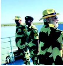
સૌભાગ્ય છે. મને ગર્વ છે કે, આપણા જવાનોએ મુશ્કેલ સમયે પોતાના સામર્થ્યને સિદ્ધ કર્યું છે. આ ગુજરાતનો દરિયાકાંઠે દેશની બહુ મોટી તાકાત છે. એટલા માટે અહીંની દરિયાઈ સરહદ ભારત વિરોધી ધૂંધાંઓનો સૌથી વધુ સામનો કરે છે. સરકાર પર દુશ્મનની નાપાક નજર ક્યારની મંડરાયેલી છે પણ દેશ નિશ્ચિત છે. કારણ કે, સુરક્ષામાં તેમને તેનાં છે. દુશ્મનને પણ ખબર છે કે, ૧૯૭૧ના યુદ્ધમાં કઈ રીતે તેમ જવાબ આપ્યો હતો. એટલા માટે જ આપણી નેવીની હાજરીમાં

(સંવાદદાતા દ્વારા) ગાંધીનગર, તા.૩૧ છેલ્લા ૧૦ વર્ષથી વડાપ્રધાન નરેન્દ્ર મોદી દિવાળીની ઉજવણી દેશના જવાનો સાથે કરતા આવ્યા છે. આજે દિવાળીનું પર્વ છે ત્યારે સતત ૧૧મા વર્ષે દિવાળી ઉજવવા કચ્છ પહોંચ્યા હતા. પીએમ મોદીએ પાકિસ્તાનને અડીને આવેલા કચ્છની સરહદે ફરજ બજાવતા બીએસએફના જવાનોના મોં મીઠા કરવાની શુભેચ્છા પાઠવી હતી.