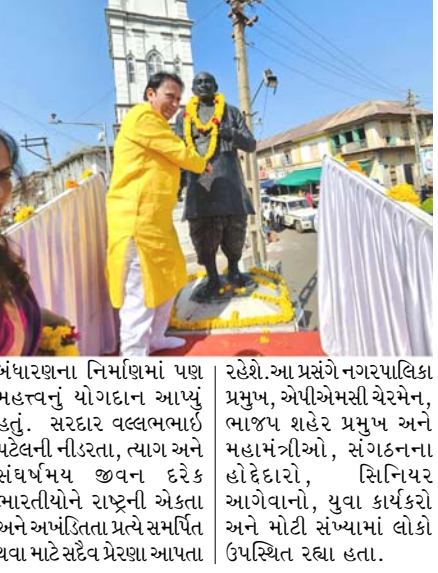
બંધારણના નિર્માણમાં પણ મહત્વનું યોગદાન આપ્યું હતું. સરદાર વલ્લભભાઈ પટેલની નીડરતા, ત્યાગ અને સંઘર્ષમય જીવન દરેક ભારતીયોને રાષ્ટ્રની એકતા અને અખંડિતતા પ્રત્યે સમર્પિત થવા માટે સંદેશ પ્રેરણા આપતા રહેશે. આ પ્રસંગે નગરપાલિકા પ્રમુખ, એપીએમસી ચેરમેન, ભાજપ શહેર પ્રમુખ અને મહામંત્રીઓ, સંગઠનના હોદ્દદારો, સિનિયર આગેવહાનો, યુવા કાર્યકરો અને મોટી સંખ્યામાં લોકો ઉપસ્થિત રહ્યા હતા.