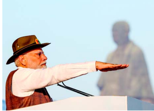
દેશને કેવી રીતે એકતાના તાંત્રણે બાંધવામાં આવ્યો છે ? તેની રૂપરેખા આપતા પહોંચાડવામાં આવી છે. તેના કારણે લોકોમાં સંતોષ સાથે સરકાર ઉપરના ગામગામ સુધી પહોંચાડવામાં આવી છે.

રાષ્ટ્રીય એકતા દિવસની શપથ પછી લેવડાવ્યા હતા. રાષ્ટ્રીય એકતા દિવસની અભૂતપૂર્વ પરેડ પછી તેમણે નિહાળી હતી. આ પ્રસંગે વડાપ્રધાન મોદીએ જણાવ્યું છે કે, છેલ્લા એક દાયકામાં સુશાસનને મોડેલ બનાવીને એકતાની દોરને વધુ મજબૂત કરવામાં આવી છે અને ભેદભાવની સમસ્યા દૂર કરવામાં આવી છે. “સબ કા સાથ, સબ કા વિકાસ”ના મંત્રને ધ્યેય બનાવીને સરદાર દ્વારા કોઈ પણ ભેદભાવ રાખ્યા વિના પાત્રતા ધરાવતા તમામ લોકોને એક સમાન યોજનાકીય લાભો આપવામાં આવ્યા છે. વન નેશન-વન રાશન, વન નેશન-વન આઈડેન્ટી, વન નેશન-વન ટેક્સ, વન નેશન-વન પાવર ગ્રિડ, વન નેશન-વન હેલ્થ ઇન્સ્યોરન્સ ઉપરાંત હવે સરકાર વન નેશન-વન સેક્યુલર સિવિલ કોડ અને વન નેશન-વન ઇલેક્શનની દિશામાં કામ કરી રહી છે. સરકારની નીતિઓ અને નિર્ણય થકી