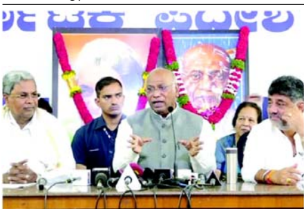
(એજન્સી) બેંગ્લુરુ, તા. ૩૧ કોંગ્રેસના પ્રમુખ મલ્લિકાર્જુન ખડગેએ ગુરુવારે વડાપ્રધાન મોદીની ‘એક રાષ્ટ્ર, એક ચૂંટણી’ પરની ટિપ્પણીઓને ફગાવી દીધી હતી અને કહ્યું હતું કે સંસદમાં સર્વસંમતિ વિના આ પહેલ અશક્ય છે. પત્રકારો સાથે વાત કરતા કોંગ્રેસ અધ્યક્ષ ખડગેએ કહ્યું કે, મોદીએ જે કહ્યું છે, તે તેઓ કરશે નહીં, કારણ કે જ્યારે સંસદમાં વાત આવે છે, ત્યારે તેમણે બધાને વિચારમાં લેવા પડશે, તે જ આ થશે. આ અશક્ય છે. ‘વન નેશન વન ઇલેક્શન’નો અમલ અશક્ય છે. આજે વડાપ્રધાન મોદીએ કહ્યું હતું કે ભાજપની આગેવાની હેઠળની કેન્દ્ર સરકાર ‘એક રાષ્ટ્ર, એક ચૂંટણી’ અને

મોદીએ કહ્યું હતું કે ભાજપની આગેવાની હેઠળની કેન્દ્ર સરકાર ‘એક રાષ્ટ્ર, એક ચૂંટણી’ અને બિનસાંપ્રદાયિક નાગરિકસંહિતા માટે કામ કરી રહી છે