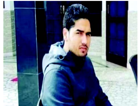
અઠવાડિયે ધરપકડ થઈ હતી એ પછી ડલ્લાને પણ દબોચી લેવાયો છે, એટલે ખાલિસ્તાનીઓને મોટો ફટકો પડ્યો છે.

(એજન્સી) નવી દિલ્હી, તા. ૧૦ ખાલિસ્તાની ત્રાસવાદીઓ સામેની કાર્યવાહીમાં કેનેડાને મોટી સફળતા મળી છે. ગયા મહિને શુટઆઉટની ઘટનામાં સંડોવાયેલા ખાતરનાક ખાલિસ્તાની આતંકવાદી અશદીપસિંહ ઉર્ફે અર્શ ડલ્લાની કેનેડા પોલીસે ધરપકડ કરી લીધી છે. ખાલિસ્તાનના આતંકવાદી જૂથના વડા હરદીપસિંહ નિજજરની જગ્યાએ ડલ્લા સંગઠનનું સંચાલન કરતો હતો. પત્ની સાથે કેનેડામાં જ રહેતા આતંકીએ કોંગ્રેસના નેતા બલજિન્દરસિંહ બલ્લીની પંજાબમાં હત્યા કરાવી હોવાનું કબૂલ કર્યું હતું. કેનેડા પોલીસે ભારતના સૌથી વોન્ડેડ આતંકી અને અપરાધીને ઝડપી લેતાં તેનું પ્રત્યાર્પણ કરવાની કાર્યવાહી શરૂ થાય તેવી શક્યતા છે. આજે દિવસ દરમિયાન પંજાબ પોલીસે પણ એક શીખ સામાજિક કાર્યકરની હત્યાના આરોપસર ડલ્લાના બે સાગરિતોની ફરીદકોટમાંથી ધરપકડ કરી હતી. કેનેડામાં નિજજરના બીજા સાગરિતની ધરપકડ થઈ છે. અગાઉ સંગઠનનું સંચાલન કરતા ઈન્દ્રજિત ગોશલની ગયા