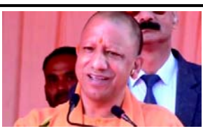
મંદિર બાંધવા પાછળ થયેલા પ્રયાસોને યાદ કર્યા હતા. તેમણે જણાવ્યું હતું કે અયોધ્યા નવી ઓળખ સાથે વિશ્વ શહેર બનીને અધુનિક અને સાંસ્કૃતિક રીતે નવું શહેર બનીને આગળ વધી રહ્યું છે. વડાપ્રધાન નરેન્દ્ર મોદીના પ્રયાસોને કારણે ભગવાન રામ અહીં ૫૦૦ વર્ષ પછી એમના પોતાના મંદિરમાં બિરાજમાન થયા છે.

(એજન્સી) અયોધ્યા, તા. ૫ અયોધ્યાના રામકથા પાર્કમાં ગુરુવારે રામાયણ મેળાના ઉદ્ઘાટન સમારંભને સંબોધન કરતાં ઉત્તરપ્રદેશના મુખ્યમંત્રી યોગી આદિત્યનાથે એવું જણાવ્યું હતું કે સંભલ અને બાંગ્લાદેશમાં તોફાનો કરનારા તોફાનીઓના એક સરખા જ ડીએનએ છે.