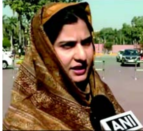
મુખ્ય સફળ રહ્યો છે અને હવે અમે જાહેર સ્થળોએ બીફનું સેવન બંધ કરવાનો નિર્ણય લીધો છે. અમે ત્રણ વર્ષ પહેલા ગોવંધની કતલ પર પ્રતિબંધનો કાયદો પસાર કર્યો હતો અને તે ખૂબ જ સફળ રહ્યો હતો, તેથી હવે આસામમાં અમે નિર્ણય લીધો છે કે, કોઈપણ રેસ્ટોરન્ટ અથવા હોટલમાં બીફ પીરસવામાં આવશે નહીં અને તે સાર્વજનિક કાર્ય અથવા જાહેર સ્થળ કોઈપણ જગ્યાએ પીરસવામાં આવશે નહીં. તેથી આજથી અમે હોટલ, રેસ્ટોરન્ટ અને જાહેર સ્થળોએ બીફનું સેવન સંપૂર્ણપણે બંધ કરવાનો નિર્ણય લીધો છે. તેમણે કહ્યું કે, અગાઉનો નિર્ણય માત્ર

(એજન્સી) નવી દિલ્હી, તા. ૫ સમાજવાદી પાર્ટીના સાંસદ ઈકરા હસને ગુરુવારે આસામમાં હોટલ અને જાહેર સ્થળોએ બીફના સેવન પર સંપૂર્ણ પ્રતિબંધ લાદવા બદલ આસામના મુખ્યમંત્રી હિમંતા બિસ્વા સરમા પર પ્રહારો કર્યા હતા. તેણીએ કહ્યું કે, આ સ્વતંત્રતાના અધિકારની વિરુદ્ધ છે અને જો સરકાર વ્યક્તિગત જીવનમાં દખલ કરવાનું ચાલુ રાખશે તો આ રાષ્ટ્ર સરમુખત્યારશાહી તરફ આગળ વધશે. દેશની સુંદરતા એ છે કે, દેશમાં વિવિધ સંસ્કૃતિ અને ધર્મના લોકો છે અને આ પ્રકારના નિર્ણયો બંધારણ વિરુદ્ધ છે.