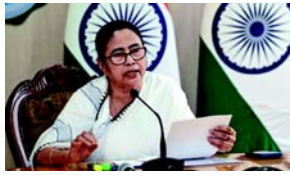
મુખ્યમંત્રીએ મીડિયાને જણાવ્યું હતું કે રાજ્યમાં બહારથી વિરુદ્ધ ઝુંબેશને મજબૂત કરવા માટે CID અને ACB વિભાગોમાં મોટા પાયે ફેરબદલ કરવામાં આવશે. તેણીએ એ પણ સ્વીકાર્યું કે રાજ્ય પોલીસના નીચલા સ્તરના એક વિભાગમાં બહારથી છે જે રાજ્યને બદનામ કરે છે. રાજકીય નેતાઓની હેમશા બહારમાં સંવેદની માટે ટીકા કરવામાં આવે છે. જો કોઈ રાજકારણી માત્ર ૫ રૂપિયાનો બહારવાર કરે છે, તો તેનો ૫૫૦ રૂપિયાનો અંદાજ કરવામાં આવે છે. જો કે, રાજકારણીઓ લોકોને છેતરતા અને બહારવાર કરતાં પહેલા દસ વખત વિચારે છે. કેટલાક નીચલા સ્તરના પોલીસ દળોમાં અધિકારીઓ અને કર્મચારીઓ બહારવારમાં સંવેદનશીલ છે જેના લીધે રાજ્યનું નામ બદનામ થાય છે.

(એજન્સી) તા. ૫ મુખ્ય પ્રધાન મમતા બેનરજીએ રાજ્યમાં પોલીસ વિભાગમાં મોટા ફેરબદલની તાજેતરમાં જાહેરાત કરી છે અને તેના પગલે પશ્ચિમ બંગાળ પોલીસ વિભાગમાં મોટા પાયે ફેરબદલનો આદેશ આપ્યો છે. આ આદેશ આપ્યા પછી મમતા બેનરજીએ મીડિયાને જણાવ્યું હતું કે, રાજ્યમાં બહારથી વિરુદ્ધ ઝુંબેશ માટે CID અને ACB વિભાગોમાં મોટાપાયે ફેરબદલ કરવામાં આવશે. તેમણે કહ્યું કે, આ આદેશ આપ્યા પછી મમતા બેનરજીએ મીડિયાને જણાવ્યું હતું કે, રાજ્યમાં બહારથી વિરુદ્ધ ઝુંબેશ માટે CID અને ACB વિભાગોમાં મોટાપાયે ફેરબદલ કરવામાં આવશે.