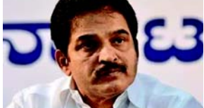
બોલવાની મંજૂરી આપી હતી. સૌથી કમનસીબ ઘટના લોકસભામાં બની જ્યારે સમગ્ર કોંગ્રેસ પાર્ટી સંભવના વિરોધપક્ષના નેતા પર પ્રવાસ પ્રતિબંધનો મુદ્દો ઊઠાવી રહી હતી.' કોંગ્રેસ નેતાએ કહ્યું, 'જે દિવસથી રાહુલ ગાંધી અદાણીના ભ્રષ્ટાચાર સામે ઊભા થયા ત્યારથી આવી હતી જેમણે વિદેશી રોકાણકાર અને વિપક્ષી નેતાઓના એક વર્ગ વચ્ચે કેટલાક જાણીતા આરોપ લગાવ્યા અને દાવો કર્યો હતો કે, વડાપ્રધાન નરેન્દ્ર મોદી હેઠળ ભારતની સફળતાની ગાથાને પાટા પરથી ઉતારવા માટે આંતરરાષ્ટ્રીય પડવંચ ચાલી રહ્યું છે.

(એજન્સી) નવી દિલ્હી, તા. ૫ વિદેશી રોકાણકાર અને વિપક્ષના નેતા રાહુલ ગાંધી વચ્ચે સંબંધ દેખાડવા બદલ ભાજપના સાંસદ નિશિકાંત દુબે પર પ્રહાર કરતાં કોંગ્રેસે ગુરુવારે કહ્યું હતું કે, 'અદાણીના એજન્ટો'ને જૂથના 'મેગા ભ્રષ્ટાચાર'નો પર્દાફાશ કરનારાઓને બદનામ કરવા અને દુરુપયોગ કરવાનું એક જ કાર્ય આપવામાં આવ્યું છે. વિરોધ પક્ષે લોકસભાના સ્પીકર ઓમ બિરલાને એ સુનિશ્ચિત કરવા હાલક કરી છે કે, દુબે તેમની ટિપ્પણી પરત લે અને માફી માંગે. દુબે દ્વારા કરવામાં આવેલી કેટલીક ટિપ્પણીઓને પગલે ગુરુવારે લોકસભાની કાર્યવાહી બે વાર સ્થગિત કરવામાં આવી હતી જેમણે વિદેશી રોકાણકાર અને વિપક્ષી નેતાઓના એક વર્ગ વચ્ચે કેટલાક જાણીતા આરોપ લગાવ્યા અને દાવો કર્યો હતો કે, વડાપ્રધાન નરેન્દ્ર મોદી હેઠળ ભારતની સફળતાની ગાથાને પાટા પરથી ઉતારવા માટે આંતરરાષ્ટ્રીય પડવંચ ચાલી રહ્યું છે.