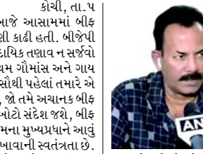
ગણાવ્યો હતો. તેમણે કહ્યું કે, દેશભરમાં 'સંધ પરિવાર'ની સરકારો લોકોમાં સમસ્યા ઊભી કરવાનો પ્રયાસ કરી રહી છે. આસામમાં યૂટ્યૂબી આવી રહી છે તેથી આ 'સંધ પરિવાર'નો એજન્ડા છે અને તેઓ લોકોમાં ભાગલા પાડવા માંગે છે. આસામના મુખ્યપ્રધાન હિંમંતા બિસ્વા સરમાએ બુધવારે રાજ્યભરમાં કોઈપણ રેસ્ટોરન્ટ, હોટલ અને જાહેર સ્થળોએ બીફ પીરસવા અને ખાવા પર પ્રતિબંધની જાહેરાત કરી હતી. તેમણે આ જાહેરાત કરતી વખતે જણાવ્યું હતું કે, ૨૦૨૧માં પસાર થયેલ આસામ કેટલ પ્રિઝર્વેશન એક્ટ, પશુઓની કતલને રોકવામાં મુખ્ય સફળ રહ્યો છે અને હવે અમે જાહેર સ્થળોએ બીફનું સેવન બંધ કરવાનો નિર્ણય લીધો છે.

(એજન્સી) કોચી, તા. ૫ બીજેપી કેરળના ઉપાધ્યક્ષ મેજર રવિએ આજે આસામમાં બીફ પ્રતિબંધને લઈને આસામના મુખ્યમંત્રીની ઝાટકણી કાઢી હતી. બીજેપી નેતાએ કહ્યું કે, આપણે ખોટો સંદેશ આપીને સાંપ્રદાયિક તણાવ ન સર્જવો જોઈએ. બીજેપી કેરળના ઉપાધ્યક્ષે કહ્યું કે, સૌપ્રથમ ગોંડાંસ અને ગાય વચ્ચેનો તફાવત સમજવો જોઈએ. તેમણે કહ્યું કે, સૌથી પહેલાં તમારે એ સમજવાની જરૂર છે કે, બીફ શું છે અને ગાય શું છે, જો તમે અચાનક બીફ પર પ્રતિબંધ લગાવશો તો આનાથી ઘણા લોકોને ખોટો સંદેશ જશે. બીફ એ ગાય નથી. તેમણે એમ પણ કહ્યું હતું કે, આસામના મુખ્યપ્રધાને આવું ન કરવું જોઈએ કારણ કે, દરેકને પોતાનો ખોરાક ખાવાની સ્વતંત્રતા છે. તમને જે જોઈએ તે ખાવાની સ્વતંત્રતા હોવી જોઈએ. અમે ગાયની પૂજા કરીએ છીએ. મેં કોઈ જગ્યા જોઈ નથી. જ્યાં ગાયોની કતલ કરવામાં આવી રહી છે. તેમણે કહ્યું કે, દરેકને કોઈપણ ખાવાની સ્વતંત્રતા હોવી જોઈએ અને સરકારે સાંપ્રદાયિક મુદ્દાઓ ઊભા ન કરવા જોઈએ. માંસ એ માંસ અને બળદનું છે. સૌથી પહેલાં તફાવત સમજો અને પછી પ્રતિબંધ લાદવો જોઈએ. આપણે લોકોને ખોટો સંદેશ ન આપવો જોઈએ અને સાંપ્રદાયિક મુદ્દાઓ ઊભા કરવા જોઈએ નહીં. દરમિયાન કેરળ વિધાનસભામાં એલઓપી અને કોંગ્રેસના નેતા વી.ડી. સથેશને આ પગલાંને સંધ પરિવારનો લોકોને વિભાજિત કરવાનો એજન્ડા