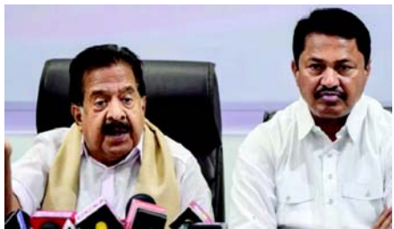
અધિકારીઓ (ઈઆરઓ) દ્વારા કરજિયાત ડેર-ડેર-ડેર ચકાસણી કરવામાં આવે છે. જો કે, મેમોરેન્ડમમાં વ્યાપક ઉલ્લંઘનનો આક્ષેપ કરવામાં આવ્યો હતો :

● પ્રતિ મતવિસ્તારમાં ૨૫૦થી વધુ ફોર્મ-૭ સબમિટ કરનારા વ્યક્તિઓની ઓળખ અને આ ફોર્મ-૭ ફાઇલ કરવા માટે ઉપયોગમાં લેવાતા IP સરનામાઓની વિગતો, સંગઠિત પ્રયત્નો દ્વારા સંભવિતપણે સુવિધાયુક્ત સામૂહિક સબમિશન પર ચિંતા ઊભી કરે છે. ચકાસણી પ્રોટોકોલનું પાલન ન કરવું : મતદારના નિયમો, ૧૯૮૦ની નોંધણીની ટીકાને, કોંગ્રેસ પાર્ટીએ દલીલ કરી હતી કે નામો કાઢી નાખવાની પ્રક્રિયા ફક્ત ફોર્મ-૭ સબમિશન દ્વારા જ થઈ શકે છે, ત્યારબાદ ચૂંટણી નોંધણી