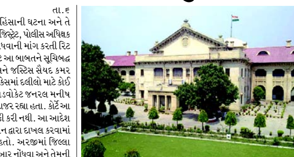
લોકોનાં મોત થયા હતા. આ પહેલા બુધવારે અલાહાબાદ હાઈકોર્ટે સંભલ હિંસા દરમિયાન પોલીસ દ્વારા કથિત અત્યાચારની ઘટનાઓની સ્વતંત્ર તપાસની માંગ કરતી અરજીને ફગાવી દીધી હતી.

(એજન્સી) અલાહાબાદ હાઈકોર્ટે ગુરુવારે સંભલમાં હિંસાની ઘટના અને તે દરમિયાન કથિત પોલીસ અત્યાચાર માટે જિલ્લા મેજિસ્ટ્રેટ, પોલીસ અધિક્ષક અને અન્ય અધિકારીઓ સામે એફઆઈઆર નોંધવાની માંગ કરતી રિટ અરજી પર સામાન્ય પ્રક્રિયા હેઠળ સુનાવણી માટે આ ખાતને સુચિબદ્ધ કરવાનો નિર્ણય કર્યો. જસ્ટિસ સિદ્ધાર્થ વર્મા અને જસ્ટિસ સૈયદ કમર હસન રિઝવીની બેન્ચે આ આદેશ આપ્યો જ્યારે કેસમાં દલીલો માટે કોર્ટ હાજર ન થયું. જો કે સરકાર વતી એડિશનલ એડવોકેટ જનરલ મનીષ ગોયલ અને સરકારી એડવોકેટ એડવોકેટ કોર્ટમાં હાજર રહ્યા હતા. કોર્ટે આ કેસમાં આગામી સુનાવણી માટે કોર્ટ તારીખ નક્કી કરી નથી. આ આદેશ હઝરત ખ્વાજા ગરીબ નવાઝ વેલ્ડર એસોસિએશન દ્વારા દાખલ કરવામાં આવેલી પીઆઈએલ પર આપવામાં આવ્યો હતો. અરજીમાં જિલ્લા મેજિસ્ટ્રેટ અને પોલીસ અધિક્ષક વિરુદ્ધ એફઆઈઆર નોંધવા અને તેમની ધરપકડ કરવા માટે સૂચના જારી કરવાની વિનંતી કરવામાં આવી હતી. અરજીમાં આક્ષેપ કરવામાં આવ્યો છે કે આ અધિકારીઓ સંભલમાં હિંસા અને કથિત પોલીસ ગોળીબાર માટે જવાબદાર છે. ફાયરિંગમાં ચાર