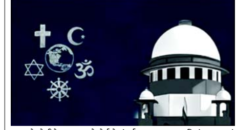
ન કરવો જોઈએ. આ મામલે કોર્ટનો સંપર્ક કરવા પર પણ પ્રતિબંધ મુકવામાં આવ્યો હોવાની ચર્ચા છે. હવે આ અંગે સુપ્રીમ કોર્ટમાં અરજી દાખલ કરવામાં આવી છે કે આ એક્ટ પોતે જ ગેરબંધારણીય છે.

જેને કહ્યું કે, આ એક્ટ અંતર્ગત કટ ઓફ ડેટ ૧૫ ઓગસ્ટ, ૧૯૪૭ નક્કી કરવી એ ગેરબંધારણીય છે. સંસદ એવો કાયદો કેવી રીતે બનાવી શકે, જે લોકોના કોર્ટમાં જવાના મૂળભૂત અધિકારને નકારે છે. આ બંધારણની મૂળ ભાવનાની પણ વિરુદ્ધ છે. આ કાયદો બંધારણની કલમ ૧૪, ૧૫, ૧૯, ૨૧ અને ૨૫માં આપવામાં આવેલા અધિકારોનું ઉલ્લંઘન કરે છે. આ કાયદાને પડકારતી અરજી માર્ચ ૨૦૨૨માં જ દાખલ કરવામાં આવી હતી. તેના પર સુપ્રીમ કોર્ટે કેન્દ્ર સરકાર પાસેથી જવાબ માંગ્યો હતો. એ પછી તે તમામ અરજીઓ એકસાથે સાંભળવાનું નક્કી કર્યું હતું. આજે ચીફ જસ્ટિસ સંજય ભટ્ટની આગેવાની હેઠળની