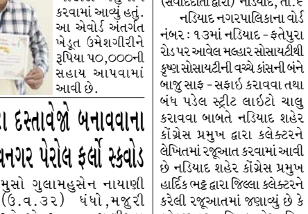
નરિયાદ, તા.૬ નરિયાદના યોગી ફાર્મ સ્થિત બીએ પીએસ સ્વામિનારાયણ મંદિર ખાતે રૂપિ મહોત્સવ ૨૦૨૪ અંતર્ગત કૃષિ મેળો યોજાયો હતો. જેમાં જિલ્લામાં પ્રાકૃતિક કૃષિ કરતાં ખેડૂતોને પ્રોત્સાહન આપવાના ભાગરૂપે નરિયાદના નરસંડા ગામના ખેડૂત ઉ મે શ ગ રી