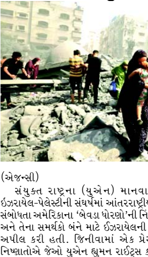
(એજન્સી) સંયુક્ત રાષ્ટ્રના (યુએન) માનવાધિકાર નિષ્ણાતોએ ઈઝરાયેલ-પેલેસ્ટીની સંઘર્ષમાં આંતરરાષ્ટ્રીય કાયદાના ઉલ્લંઘનને સંબોધતા અમેરિકાના 'બેવડા ધોરણો'ની નિંદા કરી અને ઈઝરાયેલ અને તેના સમર્થકો બંને માટે ઈઝરાયેલની ફૂરતાનો અંત લાવવા અપીલ કરી હતી. જિનીવામાં એક પ્રેસ કોન્ફરન્સમાં ચાર નિષ્ણાતોએ જેઓ યુએન હુમન રાઈટ્સ કાઉન્સિલના સ્પેશિયલ

રિપોર્ટર તરીકે સેવા આપે છે, તેમણે આંતરરાષ્ટ્રીય સમુદાયને અપ્રમાણસર હિંસા, માનવતાવાદી નાકાબંધી સહિત આંતરરાષ્ટ્રીય કાયદાના કથિત ઉલ્લંઘન માટે ઈઝરાયેલને જવાબદાર ઠેરવવા વિનંતી કરી અને તેમાં સમાધાન કરીને સમસ્યાનો કાયમી ઉકેલ લાવવા હાકલ કરી હતી. ન્યાયાધીશો અને વકીલોની સ્વતંત્રતા પરના સ્પેશિયલ રિપોર્ટર માર્ગરિટ સેટરથવેટ આંતરરાષ્ટ્રીય કોજદારી અદાલતને 'આક્રમક' ધમકીઓ સાથે નબળી પાડવા બદલ અમેરિકન સરકારની ટીકા કરી હતી અને આંતરરાષ્ટ્રીય ન્યાયની જરૂરિયાત પર ભાર મૂક્યો હતો જે બધાને સમાનરૂપે લાગુ કરવામાં આવે છે. સેટરથવેટે કહ્યું કે આ બેવડા ધોરણોને સમાપ્ત કરવાનો સમય છે. ૧૯૯૭થી કબજા હેઠળના પેલેસ્ટીની પ્રદેશમાં માનવાધિકારની સ્થિતિ પર વિશેષ અહેવાલ આપનાર ફાન્સેસ્કા અલ્બેનિસે આંતરરાષ્ટ્રીય જવાબદારીના અભાવને કારણે ઈઝરાયેલ દ્વારા વ્યવસ્થિત ઉલ્લંઘના પુરાવા તરીકે ઉચ્ચ નાગરિક જાનહાનિ અને યુએનના કર્મચારીઓ પરના હુમલાનો ઉલ્લેખ કરતાં અમેરિકા સામે નિશાન તાક્યું હતું. તેમણે કહ્યું કે ઈઝરાયેલ પર સતત ફૂરતા કરવા છતાં ક્યારેય પ્રતિબંધો લાદવામાં આવ્યા નથી. ન્યાયિક પ્રક્રિયાઓ કે તો અવગણવામાં આવે છે અથવા બાજુ પર મૂકવામાં આવે છે, વેપાર ચાલુ રહે છે અને રાજદ્વારી સંબંધો અકબંધ રહે છે. સભ્ય દેશો લકવાગ્રસ્ત અથવા સ્તબ્ધ દેખાય છે, તેમાંથી ઘણા હજુ પણ વ્યવસાયને સામાન્ય બનાવી રહ્યા છે.