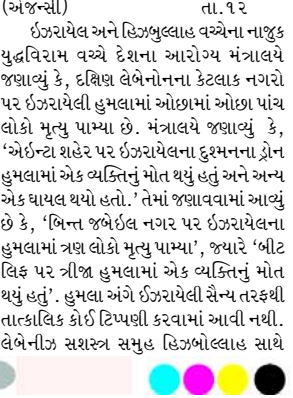
(એજન્સી) તા.૧૨ ઈઝરાયેલ અને હિઝબુલ્લાહ વચ્ચેના નાજુક યુદ્ધવિરામ વચ્ચે દેશના આરોગ્ય મંત્રાલયે જણાવ્યું કે, દક્ષિણ લેબેનોનના કેટલાક નગરો પર ઈઝરાયેલી હુમલામાં ઓછામાં ઓછા પાંચ લોકો મૃત્યુ પામ્યા છે. મંત્રાલયે જણાવ્યું કે, 'એઈન-શહેર પર ઈઝરાયેલના દુશ્મનના ડ્રોન હુમલામાં એક વ્યક્તિનું મોત થયું હતું અને અન્ય એક ઘાયલ થયો હતો.' તેમાં જણાવવામાં આવ્યું છે કે, 'બિન્ત જબેઈલ નગર પર ઈઝરાયેલના હુમલામાં ત્રણ લોકો મૃત્યુ પામ્યા, જ્યારે 'બીટ લિફ પર ત્રીજા હુમલામાં એક વ્યક્તિનું મોત થયું હતું.' હુમલા અંગે ઈઝરાયેલી સૈન્ય તરફથી તાત્કાલિક કોઈ ટિપ્પણી કરવામાં આવી નથી. લેબેનોન સશસ્ત્ર સમુદાય હિઝબુલ્લાહ સાથે

દ્વારા મધ્યસ્થી કરાયેલ યુદ્ધવિરામ ૨૦ નવેમ્બરથી શરૂ થયો હતો, પરંતુ બંને પક્ષોએ એકબીજા પર વારંવાર ઉલ્લંઘનો આરોપ લગાવ્યો છે. સમજૂતી અમલમાં આવી ત્યારથી, ઈઝરાયેલે લગભગ દૈનિક હુમલાઓ કર્યાં છે, મોટે ભાગે દક્ષિણ લેબેનોનમાં, ઘણા લોકો મૃત્યુ પામ્યા. કરારની શરતો અનુસાર, લેબેનોન દળોએ હુમલો ન કરવો પીસકીપર્સ સાથે દક્ષિણમાં તૈનાત રહેવાનું છે, જ્યારે ઈઝરાયેલી દળો ૬૦ દિવસના સમયગાળાની અંદર પાછી ખેંચી લેશે. હિઝબુલ્લાહે તેના દળોને લિટાન નદીની ઉત્તરે, સરહદથી લગભગ ૩૦ કિલોમીટર (૨૦ માઈલ) દૂર કરવા પડશે, અને દક્ષિણમાં તેના લશ્કરી માળખાનો નાશ કરવો પડશે.