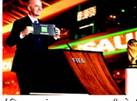
ઈતિહાસમાં પ્રથમ ૪૮ ટીમોની ટુર્નામેન્ટ હશે. ત્રણ દેશો સંયુક્ત રીતે ૨૦૩૦ ફિફા વર્લ્ડ કપની યજમાની

(એજન્સી) તા.૧૨ FIFAએ બુધવારે એક અસાધારણ કોંગ્રેસ દરમિયાન જાહેરાત કરી કે સઉદી અરબિયા ૨૦૩૪ વર્લ્ડ કપની યજમાની કરશે. કતાર પછી સઉદી અરબિયા ૨૦૨૨માં ટોચના સ્તરની આંતરરાષ્ટ્રીય ફૂટબોલ ટુર્નામેન્ટની યજમાની કરનારો બીજા મધ્ય પૂર્વીય દેશ બનશે. આ મેચો પાંચ યજમાન શહેરો-રિયાધ, જુદાહ, ખોબર, આબા અને નીઓમના ૧૫ સ્ટેડિયમમાં યોજવાનું આયોજન છે. ૨૦૩૪ વિશ્વ કપ સ્પર્ધાના