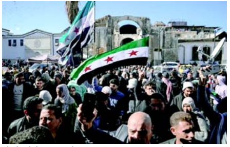
કરે છે. તેણે જણાવ્યું કે, "અત્યાર સુધીમાં ૧૪ મંત્રીઓની નિમણૂક કરવામાં આવી છે અને તે બધા અલ-શારાના નજીકના સહયોગી અથવા મિત્રો છે. "સીરિયાના નવા ડી ફેક્ટો શાસક અલ-શારાએ સત્તા સંભાળ્યા બાદથી વિદેશી પ્રતિનિધિમંડળો સાથે સક્રિયપણે સંપર્ક જાળવી રાખ્યો છે, જેમાં સંયુક્ત રાષ્ટ્રમાં સીરિયાના રાજદૂત અને વરિષ્ઠ યુએસ રાજદ્વારીઓની હોસ્ટિંગનો સમાવેશ થાય છે.

(એજન્સી) તા. ૨૩ સીરિયાના નવા શાસકોએ વિદેશ અને સંરક્ષણ મંત્રીઓની નિમણૂક કરી છે, તેઓ બશર અલ-અસદની હકાલપટ્ટીના બે અઠવાડિયા પછી આંતરરાષ્ટ્રીય સંબંધો સુધારવાનો પ્રયાસ કરે છે. SANAએ જણાવ્યું કે, શાસક જનરલ કમાન્ડ શનિવારે અસદ હસન અલ-શિબાનીને વિદેશ મંત્રી તરીકે નિયુક્ત કર્યા છે. નવા વહીવટના એક સ્તોતે જણાવ્યું કે, આ પગલું "સીરિયન લોકોની આકાંક્ષાઓને પ્રતિસાદ આપે છે જેઓ શાંતિ અને સ્થિરતા લાવે તેવા આંતરરાષ્ટ્રીય સંબંધો સ્થાપિત કરવા માંગે છે." મુહલક અબુ કસરાને વચગાળાની સરકારમાં સંરક્ષણ મંત્રી બનાવવામાં આવ્યા છે, એક સત્તાવાર સૂત્રએ રોઈટર્સને જણાવ્યું હતું. અબુ કસરા, જેને અબુ હસન ૬૦૦ તરીકે પણ ઓળખવામાં આવે છે, તે હયાત તહરિર અલ-શામ (એચટીએસ) સમુહમાં એક વરિષ્ઠ વ્યક્તિ છે, જેણે અલ-અસદને સત્તા પરથી હટાવવાના વિરોધી ઘનોનું નેતૃત્વ કર્યું હતું. દમાસ્કસથી રિપોર્ટિંગ કરતા અલ જઝીરાના રિસોલ સેરદારે જણાવ્યું કે અબુ કસરા અને અલ-શિબાની અચટીએસ નેતા અહેમદ અલ-શારાની "ખૂબ નજીક" હતા. "એટીએટી HTS તેની પોતાની સરકાર બનાવી રહી છે કે સીરિયન સરકાર તે અંગે પ્રશ્નો ઊભા