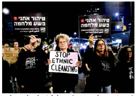
આરોપ મૂક્યો હતો. જંગોકરે રાજકીય લાભ માટે ગાઝામાં લશ્કરી અભિયાન ચાલુ રાખવા અને કેટીઓના વિનિમય કરારને નકારવા બદલ નેતાન્યાહુની ટીકા કરી હતી. તેમણે જણાવ્યું કે, 'યુદ્ધ સમાપ્ત કરવું ન તો કોઈ અવરોધ છે કે ન કોઈ ખર્ચ. ધ્યેય યુદ્ધનો અંત લાવવા અને તમામ કેટીઓને પાછા લાવવાનો છે.' ઈઝરાયેલીઓ અને આંતરરાષ્ટ્રીય અભિપ્રાય આશ્ચર્ય કરે છે કે નેતાન્યાહુએ રાજકીય કારણોસર પેલેસ્ટીની પ્રતિકાર જૂથ હમાસ સાથે કેટીઓની અદલાબદલી માટે મંત્રણા કરવાનો ઈન્કાર કર્યો છે. એક અંદાજ મુજબ ગાઝામાં હાલમાં ૧૦૧ ઈઝરાયેલ કેટીઓ છે.

(એજન્સી) તા. ૨૩ વડાપ્રધાન બેન્જામિન નેતાન્યાહુની સરકારના રાજીનામાની માંગણી સાથે શનિવારે દેશભરમાં ઈઝરાયેલીઓએ વિરોધ પ્રદર્શન કર્યું હતું. તેઓએ તેમના પર ગાઝા પટ્ટી સાથે યુદ્ધવિરામ અને કેટીઓના વિનિમય કરારને અવરોધવાનો આરોપ મૂક્યો. લાખો લોકોએ નેતાન્યાહુની ટીકા કરી અને 'ઈઝરાયેલના ઇતિહાસની સૌથી દશીણપંથી સરકાર' હોવા બદલ તેમની સરકારના રાજીનામા અને વહેલી ચૂંટણીઓ માટે પુનરોચ્ચાર કર્યો. તેલ અવીવ, હૈફા, બેરશેબા, પશ્ચિમ જેરુસલેમ અને દેશના અન્ય ભાગોમાં વિરોધ પ્રદર્શનો થયા. મુખ્ય વિરોધ તેલ અવીવમાં સંરક્ષણ મંત્રાલયની આસપાસ કેન્દ્રિત હતો, જ્યાં વિરોધીઓએ નેતાન્યાહુ અને તેમની સરકારના સભ્યો વિરુદ્ધ બેનરો, પોસ્ટરો અને પ્લેકાર્ડ રાખ્યા હતા. સંરક્ષણ મંત્રાલયની નજીક કપલાન સ્ટ્રીટ પર વિરોધીઓને સંબોધતા, વિરોધ પક્ષના નેતા અને પૂર્વ વડાપ્રધાન યાચર લેપિડે ચૂંટણીમાં સરકારને 'પશ્ચાત્તાપ' કરવાનું વચન આપ્યું હતું. લેપિડે ભારપૂર્વક જણાવ્યું કે તે નેતાન્યાહુની સરકાર સાથે મંત્રણા કરશે નહીં અને પીછેહઠ કરશે નહીં. તેમણે જણાવ્યું કે, 'અમે જીતીશું. બીબી (નેતાન્યાહુ) ખરેખર મજબૂત નથી થઈ રહ્યા. લોકો તેમના પક્ષમાં નથી. ચૂંટણીઓ યોજવામાં આવી રહી નથી કારણ કે તેઓ ચૂંટણીથી ડરે છે કારણ કે તેઓ સત્ય જાણતા હતા.' ઈઝરાયેલના કેટલાંક મહાન જંગાઉકરના, નેતાન્યાહુ પર ગાઝામાં યુદ્ધવિરામ અને કેટીઓના વિનિમય માટેની મંત્રણાને તોડફોડ કરવામાં નિષ્ફળ રહેવાનો