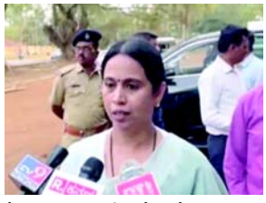
જેવા ભાજપના વરિષ્ઠ નેતાઓના દાવા પર આકોશ ઠાલવતા કે પોલીસે તેમને 'એન્કાઉન્ટર'માં મારવાનો પ્રયાસ કર્યો હતો. હેબ્બાલકરે પુછ્યું, ક્યું એન્કાઉન્ટર? ભાજપના પ્રમાણની ભાજપ વસ્તુઓ ઉડાડવામાં શરમ આવવી જોઈએ. વાસ્તવિક મુદ્દાઓને રહા છે. તેને સંબોધીને તેઓ રાજકારણ કરી રહ્યા છે. આજે એક મહિલા અને બાળ વિકાસ મંત્રી સાથે

(એજન્સી) નવી દિલ્હી, તા. ૨૩ મહિલા અને બાળ વિકાસ મંત્રી લક્ષ્મી હેબ્બાલકરે ગયા અઠવાડિયે વિધાન પરિષદમાં મૌન જાળવવા બદલ ભાજપના નેતાઓને 'ધૃતરાષ્ટ્ર' (અંધ રાજા) ગણાવ્યા હતા. તેમણે કહ્યું કે 'આજે સમગ્ર ભાજપ બહા બહ છે. મેં જોયું કે તેઓ વિધાન પરિષદમાં કેવી રીતે 'ધૃતરાષ્ટ્ર' બન્યા જ્યારે તેમના પક્ષના સભ્ય સી.ટી. રવિએ મારી સામે અપમાનજનક ભાષાનો ઉપયોગ કર્યો.' મંત્રીએ સોમવારે બેલાગવીમાં કહ્યું, જ્યારે તેમને જાણવા મળ્યું કે ધારાસભ્યને તેમની વિદેશ યાત્રા પરિષદમાં કહી છે. રવિની પાછળ રેલી કરવા માટે ભાજપના નેતાઓની ટીકા કરતા હેબ્બાલકરે કહ્યું, 'ભાજપના નેતાઓ ઉડાડવામાં શરમ આવવી જોઈએ. વાસ્તવિક મુદ્દાઓને રહા છે. તેને સંબોધીને તેઓ રાજકારણ કરી રહ્યા છે. આજે એક મહિલા અને બાળ વિકાસ મંત્રી સાથે