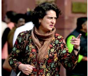
ફોર્મ શેર કર્યું છે, જેમાં પરીક્ષાના ફોર્મ પર ૧૮ ટકા જીએસટી નાખ્યું હોવાનો જોવા મળી રહ્યો છે. તેમણે એક્સ પર પોસ્ટમાં લખ્યું છે કે,

પ્રિયંકા ગાંધીએ પરીક્ષાના ફોર્મ પર GST વસૂલવા મામલે ભાજપ સરકાર પર આકરા પ્રહારો કર્યા (એજન્સી) નવી દિલ્હી, તા. ૨૩ કોંગ્રેસ સાંસદ પ્રિયંકા ગાંધી વાણીએ પરીક્ષાના ફોર્મ પર જીએસટી વસૂલવા મામલે ભાજપ સરકાર પર આકરા પ્રહારો કર્યા છે. તેમણે ઘાવો કર્યો છે કે, 'કેન્દ્ર સરકાર પરીક્ષાના ફોર્મ પર જીએસટી વસૂલી રહી છે. જે માતા-પિતાને પોતાના બાળકોની પરીક્ષાની તૈયારી માટે એક-એક પૈસા બચાવવા હતા, તેઓના સપનાને કેન્દ્ર સરકારે આવકના સોસમાં બદલી નાખ્યો છે.' કેરળની વાયનાડ બેઠકના સાંસદ પ્રિયંકા ગાંધીએ સોશિયલ મીડિયા એક્સ પર સુલતાનપુરના કલ્યાણ સિંહ સુપર સ્પેશિયાલિટી કેન્સર ઈન્સ્ટિટ્યૂટનું પરીક્ષા