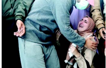
મુક્તિ સુનિશ્ચિત કરવા માટે કામ કરી રહ્યું છે. તેણે એમ પણ જણાવ્યું કે, તેણે ઈઝરાયેલ પર તેની સૈન્ય કાર્યવાહીમાં નાગરિક જાનહાનિ ઘટાડાવા માટે દબાણ કર્યું છે. પરંતુ બાઈડેને યુદ્ધને સમાપ્ત કરવા માટે ઈઝરાયેલને યુએસ સહાયનો ઉપયોગ કરવાનો ઈન્કાર કર્યો છે અને તેના ટોચના સાથી માટે યુએસ શસ્ત્રોના પરિવહનને સ્થગિત કરવાના કોલને નકારી કાઢ્યો છે. જેનાથી એડવોકેટ્સ તરફથી ગુસ્સો અને ટીકા થઈ છે, જેમણે આઉટગોઈંગ ડેમોક્રેટિક પ્રમુખને 'નરસંહાર જો' તરીકે ઓળખાવ્યા છે. અમેરિકા ઈઝરાયેલને વાર્ષિક ઓછામાં ઓછા ૩૮૦ કરડ ડોલરની સૈન્ય સહાય પૂરી પાડે છે અને બ્રાઉન યુનિવર્સિટીના સંશોધકોએ તાજેતરમાં અંદાજ લગાવ્યો છે કે, ગાઝા યુદ્ધની શરૂઆતથી બાઈડેન વહીવટીતંત્રે વધારાના ૧૭૯૦ કરોડ ડોલર પ્રદાન કર્યા છે.