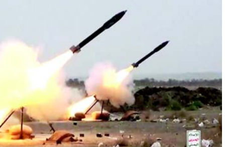
પર 'મૈત્રીપૂર્ણ ફાયર' દ્વારા કાર કરવામાં આવ્યું છે. ગુરુવારે, ઈઝરાયેલના યુદ્ધ વિમાનોએ હૌથી ડ્રોન અને મિસાઈલ હુમલાઓના જવાબમાં યમનના દરિયાકાંઠાના શહેર અલ-હુદાયદાહ અને રાજધાની સના પર હવાઈ હુમલા કર્યા હતા. જુલાઈથી યમનમાં હૌથી-નિયંત્રિત સ્થળો પર તેલ અવીવ દ્વારા શરૂ કરવામાં આવેલ હવાઈ હુમલાની ત્રીજી તરંગ હતી. હૌથીઓએ ગાઝા પટ્ટીના સમર્થનના પ્રદર્શનમાં લાલ સમુદ્રમાં ઈઝરાયેલી માલવાહક જહાજો અથવા તેલ અવીવ સાથે જોડાયેલા જહાજોને મિસાઈલો અને ડ્રોન સાથે નિશાન બનાવ્યા છે, જ્યાં ૭ ઓક્ટોબર, ૨૦૨૩થી ઈઝરાયેલના નરસંહાર યુદ્ધમાં ૪૫,૨૦૦થી વધુ લોકો મૃત્યુ પામ્યા છે.

(એજન્સી) તા. ૨૩ યમનના હૌથી સમુદાયે રવિવારે લાલ દરિયામાં એરક્રાફ્ટ કેરિયર પર હુમલો કર્યા બાદ યુએસ એફ-૧૮ ફાઈટર પ્લેનને તોડી પાડવાનો દાવો કર્યો છે. સૈન્ય પ્રવક્તા યાહ્યા સારીએ એક નિવેદનમાં જણાવ્યું કે હૌથી ઘનોએ યમન પર યુએસ-બ્રિટિશ હુમલાને સફળતાપૂર્વક પાછું ખેંચ્યું હતું. તેમણે જણાવ્યું કે 'છેલ્લી રાત્રે, એરક્રાફ્ટ કેરિયર યુએસએસ હેરી એસ. ટ્રુમેન અને તેની સાથે આવેલા કેટલાક વિનાશકને યમન સામેના હુમલા દરમિયાન નિશાન બનાવવામાં આવ્યા હતા. સારીએ જણાવ્યું કે ઓપરેશન 'આઠ કુઝ મિસાઈલ અને ૧૭ ડ્રોનનો ઉપયોગ કરીને હાથ પરવામાં આવ્યું હતું, જેના પરિણામે ૦-૧૮ ફાઈટર જેટને નીચે ઉતારવામાં આવ્યું હતું, જ્યારે વિનાશકોએ યમનની ડ્રોન અને મિસાઈલોને અટકાવવાનો પ્રયાસ કર્યો હતો.' રવિવારે વહેલી સવારે, યુએસ સેન્ટ્રલ કમાન્ડ (સેન્ટકોમ)એ જાહેરાત કરી કે યુએસ નેવી F/A-૧૮ ફાઈટર પ્લેનને લાલ સમુદ્ર