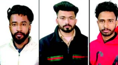
CHC પુરદાસપુર લઈ જવામાં આવ્યા છે. સમગ્ર આતંકવાદી મોઝુલનો પર્દાફાશ કરવા માટે તપાસ ચાલી રહી છે.' એન્કાઉન્ટરમાં માર્યા ગયેલા આતંકવાદીઓ પંજાબના ગુરદાસપુરમાં પોલીસ ચોકી પર ગ્રેનેડ હુમલામાં સામેલ હોવાનું માનવામાં આવે છે. ગુરદાસપુર જિલ્લાના બહીવાલ પોલીસ ચોકીની બહાર ભુધવારે રાત્રે એક કથિત વિસ્ફોટ થયો હતો. ત્યારબાદ શુક્રવારે ગુરદાસપુરમાં વડાલા બાંગર પોલીસ ચોકીની બહાર વિસ્ફોટ જેવો અવાજ સંભળાયો હતો. સોશિયલ મીડિયા પર ફરતી એક વણચકાસાયેલ પોસ્ટમાં આતંકવાદી સંગઠન ખાલિસ્તાન ઝિંદાબાદ ફોર્સે ભુધવારના હુમલાની જવાબદારી સ્વીકારી છે. આ પહેલા મંગળવારે પંજાબના અમુતસરમાં ઈસ્લામાબાદ પોલીસ સ્ટેશનમાં વિસ્ફોટ થયો હતો. જો કે, આ ઘટનામાં કોઈને ઈજા થઈ ન હતી.

(એજન્સી) પીલીભીત, તા. ૨૩ પંજાબ પોલીસ ચોકીઓ પર હુમલાના આરોપી ત્રણ ખાલિસ્તાની સમર્થક આતંકવાદીઓ સોમવારે ઉત્તરપ્રદેશના પીલીભીતમાં એન્કાઉન્ટરમાં માર્યા ગયા છે. ઉત્તરપ્રદેશ પોલીસ અને પંજાબ પોલીસ દ્વારા સંયુક્ત કાર્યવાહીમાં પીલીભીત જિલ્લામાં ત્રણ આતંકવાદીઓ માર્યા ગયા હતા જ્યારે બે એકે સિરીઝની રાઉન્ડફસ અને બે ગ્લોક પિસ્તોલ પણ જપ્ત કરવામાં આવી હતી. મહિતી મળતાં પંજાબ પોલીસે પીલીભીત પોલીસ વિભાગના કર્મચારીઓ સાથે મળીને જિલ્લાની સરહદો સીલ કરી હતી. પોલીસે આતંકવાદીઓને પકડવાની યોજના બનાવી હતી જો કે, તેઓએ પોલીસ કર્મચારીઓ પર ગોળીબાર કર્યો હતો. જવાબી ગોળીબારમાં તેમાંથી ત્રણને ગોળી વાગી હતી તેમ પોલીસે જણાવ્યું હતું. X પર પંજાબ પોલીસના ડીજીપીએ લખ્યું કે, 'પાકિસ્તાન પ્રાયોજિત ખાલિસ્તાન ઝિંદાબાદ ફોર્સ (KZF)ના આતંકવાદી મોઝુલ સામે મોટી સંખ્યામાં યુધ્ધ પોલીસ પાર્ટી પર ગોળીબાર કરનારા ત્રણ મોઝુલ સભ્યો સાથે એન્કાઉન્ટર થયું છે. આ આતંકવાદી મોઝુલ પંજાબના સરહદી વિસ્તારોમાં પોલીસ મથકો પર ગ્રેનેડ હુમલામાં સામેલ છે.' તેમણે ઉમેર્યું કે, 'આ એન્કાઉન્ટર પીલીભીત અને પંજાબની સંયુક્ત પોલીસ ટીમો વચ્ચે પીલીભીતના પી.એસ. પુરદાસપુરના અધિકારક્ષેત્રમાં થયું છે અને ત્રણ મોઝુલ સભ્યો ગુરદાસપુરમાં પોલીસ ચોકી પર ગ્રેનેડ હુમલામાં સામેલ છે. ઘાયલોને તાત્કાલિક તબીબી સારવાર માટે