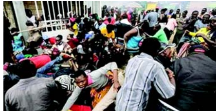
શોકગ્રસ્ત પરિવારો સાથે છે, જેમાં ઈજાગ્રસ્તો અને સારવાર હેઠળ છે. તેમણે કહ્યું, હું ખાસ કરીને એ હકીકતથી વ્યથિત છું કે, નાઈજીરિયાના ઘણા જીવન, ખાસ કરીને બાળકો, નાસભાગમાં ખોવાઈ ગયા છે જે યોગ્ય આયોજન અને સંગઠન દ્વારા ટાળવા જોઈએ.

(એજન્સી) નવી દિલ્હી, તા. ૨૩ નાઈજીરિયામાં પોલીસે રવિવારના રોજ જણાવ્યું હતું કે, નાઈજીરિયામાં ઓછામાં ઓછાં ૩૨ લોકો માર્યા ગયા હતા. આ ઘટના ક્રિસમસ ફૂડ વિતરણ કાર્યક્રમમાં બની હતી. પીડિતો, જેમાં ઓછામાં ઓછાં ચાર બાળકોનો સમાવેશ થાય છે, ભીડના વધારા દરમિયાન ભોંગી પડ્યા હતા કારણ કે લોકો ખોરાક માટે ભયાવહ બન્યા હતા. મૃતકોમાં દક્ષિણપૂર્વીય અનામ્બ્રા રાજ્યના ઓકિજા શહેરમાં ૨૨ લોકોનો સમાવેશ થાય છે. મેતામમાં હોલી ટ્રિનિટી કેથોલિક ચર્ચ ખાતે ચર્ચ દ્વારા આયોજિત ચેરિટી ઈવેન્ટ દરમિયાન રાજધાની અબુજામાં અન્ય દસ લોકોના મોત થયા હતા.