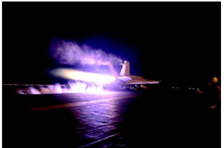
સુંબેશ ચાલુ રાખો. ૨૦૨૪ની શરૂઆતથી, અમેરિકાની આગેવાની હેઠળનું ગઠબંધન હવાઈ હુમલાઓ કરી રહ્યું છે, જેનું કહેવું છે કે લાલ સમુદ્રમાં સમુદ્ર દ્વારા કરવામાં આવેલા હુમલાના જવાબમાં યમનના ભાગોમાં હુથી સ્થાનોને નિશાન બનાવી રહ્યા છે. પ્રતિકૂળ હુમલા ક્યારેક સમુદ્ર તરફથી બદલો લેવા સાથે મળ્યા છે. જેમ જેમ વોશિંગ્ટન અને લંડન હસ્તક્ષેપ કર્યો અને તણાવ વધ્યો, હૌથીઓએ જાહેરાત કરી કે તેઓ તમામ અમેરિકન અને બ્રિટિશ જહાજોને લશ્કરી લક્ષ્યો માને છે.

(એજન્સી) તા. ૨૩ હૌથી સમુદાયે રવિવારે જણાવ્યું કે યુએસ-યુકે ગઠબંધનએ યમનના અલ-હુદાયદાહ પ્રાંત પર હવાઈ હુમલો કર્યો છે. હૌથી સંચાલિત સબાહ ન્યૂઝ એજન્સી અનુસાર, 'યુએસ-બ્રિટિશ હુમલાએ અલ-હુદાયદાહના અલ-હુદાય જિલ્લામાં અલ-જાદા પર્વતને નિશાન બનાવ્યો હતો.' એજન્સીએ હુમલાના પરિણામો વિશે વિગતો આપી નથી. અમેરિકા કે બ્રિટન દ્વારા આ અંગે કોઈ સત્તાવાર ખાતરી કરવામાં આવી નથી. યુએસ સેન્ટ્રલ કમાન્ડ (સેન્ટકોમ)એ શનિવારે મોડી રાત્રે જાહેરાત કરી કે તેણે યમનની રાજધાની સનામાં હૌથી મિસાઈલ સ્ટોરેજ ફેસિલિટી અને કમાન્ડ-એન્ડ-કંટ્રોલ સેન્ટરને નિશાન બનાવીને 'ચોક્કસ' હવાઈ હુમલા કર્યા છે. ગુરુવારે, હૌથીઓએ સના અને અલ-હુદાયદાહમાં સ્થાનો પર ૧૬ ઈઝરાયેલી હવાઈ હુમલાની જાણ કરી. ઈઝરાયેલી દૈનિક હારેટઝના જણાવ્યા અનુસાર બદલો લેવા માટે, હૌથીઓએ શનિવારે સવારે તેલ અવીવ પર બેલિસ્ટિક મિસાઈલ ચલાવી, જેમાં ૨૦ લોકો ઘાયલ થયા અને ડાનેક એપાર્ટમેન્ટ્સને નુકસાન થયું. ૭ ઓક્ટોબર ૨૦૨૩થી ઈઝરાયેલના નરસંહાર યુદ્ધનો સામનો કરી રહેલા ગાઝા સાથે એકતાના પ્રદર્શનમાં, હૌથીઓએ લાલ સમુદ્રમાં તેલ અવીવ તરફ જનારા ઈઝરાયેલી માલવાહક જહાજોને મિસાઈલ અને ગ્રીન વર્ગ નિશાન બનાવ્યા છે, જેનાથી એન્કલેવ પર હુમલો કરવાનો નિર્ધાર વ્યક્ત કર્યો છે અંત સુધી