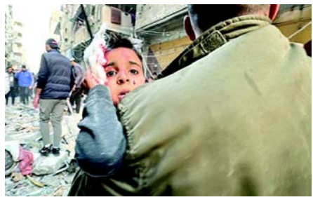
બોમ્બમારો કરવામાં આવ્યો હતો." આ કૂરતા છે, આ યુદ્ધ નથી. "હું આ કહેવા માંગુ છું કારણ કે તે મારા હૃદયને સ્પર્શે છે." ગાઝા પરના હુમલાના ૧૪ મહિના પછી ઈઝરાયેલે શુક્રવારે ગાઝા પટ્ટી પર તેના હુમલા ચાલુ રાખ્યા હતા. અલ-અક્સા શહીદ હોસ્પિટલના જણાવ્યા અનુસાર નુસરત શરણાર્થી શિબિરની બજાર ગલીમાં રહેણાંક મકાનને ડ્રોન મિસાઈલ દ્વારા અથડાવી દેવામાં આવી હતી, જેમાં આઠ લોકો મૃત્યુ પામ્યા છે.

(એજન્સી) તા. ૨૩ પેલેસ્ટીની સિવિલ ડિકેન્સ રેસ્પુ એજન્સીએ જણાવ્યું કે, ગાઝા પટ્ટીના ઉત્તરીય ભાગમાં ઈઝરાયેલના હવાઈ હુમલામાં સાત બાળકો સહિત એક પરિવારના ૧૨ સભ્યો મૃત્યુ પામ્યા છે. એજન્સી દ્વારા શુક્રવારે સાંજે તેની ટેલિગ્રામ ચેનલ પર પોસ્ટ કરવામાં આવેલ એક વીડિયોમાં તેનો સ્ટાફ જબલિયામાં ખાલ્લા પરિવારના ઘરના કાટમાળ નીચેથી પીડિતોને બહાર કાઢતો જોવા મળ્યો હતો. નાગરિક સંરક્ષણના પ્રવક્તા મહમુદ બસલે જણાવ્યું કે, "તમામ શહીદો એક જ પરિવારના છે, જેમાં સાત બાળકોનો સમાવેશ થાય છે, જેમાંથી સૌથી મોટો છ વર્ષનો છે." બસલે જણાવ્યું કે, હવાઈ હુમલામાં અન્ય ૧૫ લોકો ઘાયલ થયા છે. ઈઝરાયેલી સૈન્યએ જણાવ્યું કે, તેણે "કેટલાક આતંકવાદીઓ પર હુમલો કર્યો હતો જેઓ હમાસ આતંકવાદી સંગઠન સાથે જોડાયેલા લશ્કરી માળખામાં કાર્યરત હતા અને આ વિસ્તારમાં કાર્યરત IDF સૈનિકો માટે શ્રેષ્ઠમ ઊભું કરી રહ્યા હતા." તેમ ઉમેર્યું કે, "પ્રારંભિક તપાસ મુજબ, હુમલામાં જાનહાનિની નોંધાયેલી સંખ્યા IDFને ઉપલબ્ધ માહિતી સાથે મેળ ખાતી નથી. "પોપ ફ્રાન્સિસે શનિવારે ગાઝામાં બાળકો પર બોમ્બ વિસ્ફોટની ટીકા કરી અને તેને કૂરતા ગણાવી. "ગઈકાલે બાળકો પર