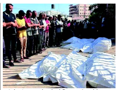
ટાંકીઓ, ઈંધણ પુરવઠો અને ઓક્સિજન સુવિધાઓને નુકસાન થયું હતું. હમાસે ગાઝામાં ઈઝરાયેલની કિયાઓને યુદ્ધ અપરાધો તરીકે વખોડી કાઢી, આંતરરાષ્ટ્રીય હસ્તક્ષેપ, માનવતાવાદી સહાય અને નાગરિક સુરક્ષાની હાકલ કરી. ચાલુ નરસંહાર માટે જવાબદારી પર ભાર મૂક્યો. ૫ ઓક્ટોબર, ૨૦૨૩થી ઈઝરાયેલે હમાસના પુનઃસંગઠનને રોકવા માટે ઉત્તરી ગાઝામાં મોટા પાયે જમીની આક્રમણ શરૂ કર્યું છે, જ્યારે પેલેસ્ટીનીઓએ ઈઝરાયેલ પર કબજો જમાવવાનો અને તેના રહેવાસીઓને બળજબરીથી વિસ્થાપિત કરવાનો આરોપ મૂક્યો છે. કાયકાઓથી પેલેસ્ટીનીઓ પર જુલમ ગુજારતા ઈઝરાયેલી શાસન સામે હમાસના ઓપરેશન અલ-અક્સા આક્રમણને પગલે ઈઝરાયેલે ૭ ઓક્ટોબર, ૨૦૨૩ના રોજ ગાઝા પર યુદ્ધ શરૂ કર્યું હતું. ત્યારથી, ગાઝા પર ઈઝરાયેલના હુમલાના પરિણામે ૪૫,૨૨૭ પેલેસ્ટીનીઓ, મુખ્યત્વે સ્ત્રીઓ અને બાળકોના મૃત્યુ થયા છે, અને ૧૦,૭૫૦૩ અન્ય ઘાયલ થયા છે, હજારોથી વધુ ગુમ થયા છે અને મૃત હોવાનું માનવામાં આવે છે.

(એજન્સી) તા. ૨૫ ગાઝા પટ્ટીમાં સિવિલ પ્રોટેક્શન ઓથોરિટીએ જણાવ્યું હતું કે, ઈઝરાયેલી કબજો પેલેસ્ટીનીઓની હત્યા કરી રહ્યું છે અને રખડતા ફૂતરાઓને ખાવા માટે તેમના મૃતદેહોને શેરીઓમાં છોડી રહ્યું છે અને આંતરરાષ્ટ્રીય કાયદાના સ્પષ્ટ ઉલ્લંઘન કરી રહ્યું છે. ગાઝામાં સિવિલ ડિકેન્સ એક નિવેદનમાં જણાવ્યું હતું કે ઈઝરાયેલી દળો પટ્ટીમાં તેમના આક્રમણના વિસ્તારોમાં શહીદોના મૃતદેહો સુધી પહોંચતા અટકાવી રહ્યા છે અને જ્યારે પણ તેઓ આવે છે ત્યારે તેઓ સીધા જ એમ્બ્યુલન્સ અને બચાવ ટીમોને નિશાન બનાવી રહ્યા છે. પેલેસ્ટીનીઓના મૃતદેહો પણ મળ્યા જે હાડપિંજર થઈ ગયા હતા અને જેઈટીન પડોશ, શુજ્યા, તાલ અલ-હવા, જબાલિયા, તાલ અલ-ઝાતાર, બીત હુનુન અને ખાન યુનિસ અને રફાહ સહિતના વિવિધ વિસ્તારોમાં ફૂતરાઓનો મૃતદેહ યથાગત જોવા હતા. સિવિલ પ્રોટેક્શન ઈન્ટરનેશનલ કમિટી ઓફ રેડ ક્રોસ (ICRC) અને વર્લ્ડ હેલ્થ ઓર્ગેનાઈઝેશન (WHO)ને યુદ્ધમાં મૃતકોના મૃતદેહોને સંભાળવા માટેની માર્ગદર્શિકા અમલમાં મૂકવા ઈઝરાયેલના કબજા પર દબાણ કરવા વિનંતી કરી. અલ જઝીરા ન્યૂઝ નેટવર્ક દ્વારા પ્રસારિત કરવામાં આવેલા ફૂટેજમાં, ઈઝરાયેલી સૈનિકો ઉત્તર ગાઝામાં મૃત પેલેસ્ટીનીઓના મૃતદેહો સાથે રખડતા ફૂતરાઓની જેમ દુર્લભાહાર કરતા જોવા મળ્યા હતા. એક અખબારી નિવેદનમાં, પેલેસ્ટીની પ્રતિકાર જૂથ હમાસે જણાવ્યું હતું કે, ઈઝરાયેલી સૈનિકોની સામે પેલેસ્ટીની શહીદોના મૃતદેહોને ખાઈ રહેલા રખડતા ફૂતરાઓની છબીઓ કબજાની સેનાના વર્તનમાં ફૂરતા અને ઉદાસી, ગુનાહિતતા અને અમાનવીયતાના સ્તરને પ્રકાશિત કરે છે અને તેનું ફાશીવાદી નેતૃત્વ દર્શાવે છે. તેમણે ઈઝરાયેલી દળો પર બેટ લાહિયામાં કમલ અડવાન હોસ્પિટલ સહિત નાગરિકો અને જટિલ માળખાગત સુવિધાઓને નિશાન બનાવવાનો પણ આરોપ મૂક્યો હતો, જેના કારણે પાણીની