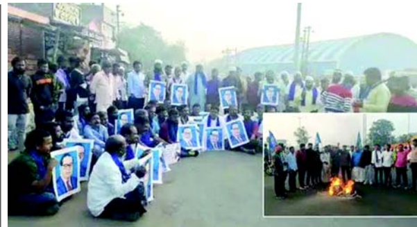
હતા. જાહેર પરિવહન સેવાઓ પણ પોરવાઈ ગઈ હતી અને તંગ વાતાવરણને કારણે ઘણી શાળાઓ અને કોલેજોએ રજા જાહેર કરી હતી. કોઈ અનિચ્છનીય બનાવ ન બને તે માટે પોલીસ દ્વારા પુરતો બંદોબસ્ત ગોઠવવામાં આવ્યો છે. પોલીસના જણાવ્યા અનુસાર, વિવિધ દલિત સંગઠનો દ્વારા આપવામાં આવેલા બંધના એલાનને પગલે બસ, ઓટો રિક્ષા અને ટેક્સીઓ ચાલતી ન હોવાથી શહેર સંપૂર્ણ રીતે બંધ છે અને દુકાનો પણ બંધ છે. બંધના સમર્થકો આંબેડકરની પ્રતિમાઓ સહિત શહેરભરના અગ્રણી જ્થાના પર એકઠાં થયા હતા, તેઓએ વિરોધ પ્રદર્શનો કર્યા હતા અને અમિત શાહ અને ભારતીય જનતા પાર્ટી (BJP) ને નુતન વિરુદ્ધ સુત્રોચ્ચાર કર્યા હતા. ગંજ વિસ્તારની નગરશ્રેણી રેલવે ટીકા કમિશનરની ઓફિસ સુધી એક વિશાળ વિરોધ માર્ચનું પણ આયોજન કરવામાં આવ્યું છે.

(એજન્સી) નવી દિલ્લી, તા.૨૫ સંસદમાં બીઆર આંબેડકર પર કેન્દ્રીય ગૃહ મંત્રી અમિત શાહના તાજેતરના નિવેદનની નિંદા કરવા દલિત સંગઠનો દ્વારા આપવામાં આવેલા બંધના એલાનને પગલે મંગળવારના રોજ કલબુર્ગીમાં દેખાવકારો રસ્તા પર ઉતરી આવ્યા હતા. વિવાદ ત્યારે ફાટી નીકળ્યો જ્યારે અમિત શાહે હુબલીમાં એક જાહેર કાર્યક્રમ દરમિયાન કથિત રીતે એવી ટિપ્પણી કરી હતી કે સમાજના કેટલાક વર્ગો આંબેડકરના યોગદાનનો અનાદર કરે છે. આ ટિપ્પણીઓએ ભારતના રાજકીય અને સામાજિક ઉત્ક્રાંતિમાં આંબેડકરની ભૂમિકાને કથિત રીતે નકારી કાઢી હતી, જેણે દલિત સંગઠનો, આંબેડકરવાદી કાર્યકરો અને અન્ય હાંસિયામાં પહેલાઈ ગયેલા જૂથોને નારાજ કર્યા હતા, જેમણે આ નિવેદનને આંબેડકરના વારસાને નબળી પાડવાના પ્રયાસ તરીકે જોયા હતા. નોંધપાત્ર દલિત વસ્તી ધરાવતા કલબુર્ગીમાં વિવિધ દલિત સંગઠનો, રાજકીય પક્ષો અને સામાજિક કાર્યકરો દ્વારા બંધનું એલાન આપવામાં આવ્યું હતું. દુકાનો, વ્યવસાયો અને જાહેર કચેરીઓ બંધ રહેતાં શહેરમાં સંપૂર્ણ બંધ જોવા મળ્યો