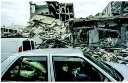
સપ્ટેમ્બરથી લેબેનોનમાં ઈઝરાયેલી હુમલામાં ૪,૦૦૦થી વધુ લોકો માર્યા ગયા અને ૧૬,૫૦૦થી વધુ ઘાયલ થયા. લેબેનોન આરોગ્ય અધિકારીઓના જણાવ્યા અનુસાર, ૧૦ લાખથી વધુ લોકો વિસ્થાપિત થયા છે.

(એજન્સી) તા. ૨૫ એનાદોલુએ અહેવાલ અનુસાર, ૨૭ નવેમ્બરના યુદ્ધવિરામ કરારના તાજેતરના ઉલ્લંઘનમાં ઈઝરાયેલી કબજાની સેનાએ રિવારના દિવસે દક્ષિણ લેબેનોનમાં ઘણાં ઘરોને ઉડાવી દીધા. લેબેનોન અહેવાલો અનુસાર, ઓછામાં ઓછાં ૨૮૬ ઈઝરાયેલ દ્વારા યુદ્ધવિરામનું ઉલ્લંઘન કરવામાં આવ્યું છે. રાજ્યની સમાચાર એજન્સી એનએનએએ જણાવ્યું હતું કે, બિન્ત જબીલ જિલ્લાના હાનિન શહેરમાં ઘરો નાશ પામ્યા હતા. પ્રસારણકર્તાએ ઉમેર્યું હતું કે, બિન્ત જબીલ જિલ્લાના કેટલાક નગરો યુદ્ધવિરામની શરૂઆતથી જ ઈઝરાયેલી ધ્વંસ અભિયાનનો સામનો કરી રહ્યા છે.