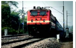
ભવાની મંડી, રામગંજ મંડી, કોટા, સવાઈ માધોપુર, દુર્ગાપુરા, જયપુર અને કિશનગઢ સ્ટેશન પર બંને દિશામાં ઉભી રહેશે. આ ટ્રેનમાં એસી ૨-ટાયર, એસી ૩-ટાયર, એસી ૩-ટાયર (ઈકોનોમી), સ્લીપર ક્લાસ અને જનરલ સેકન્ડ ક્લાસ કોચનો સમાવેશ થાય છે. ટ્રેન નંબર ૦૮૬૨૩/૦૮૬૨૪ બાંદ્રા ટર્મિનસ-અજમેર (સાપ્તાહિક) સુપરફાસ્ટ અનરિઝર્વ્ડ ઈર્સ સ્પેશિયલ (૬ ટ્રીપ્સ) ટ્રેન નંબર ૦૮૬૨૭ બાંદ્રા ટર્મિનસ-અજમેર વીકલી અનરિઝર્વ્ડ સ્પેશિયલ ગુરુવારે બાંદ્રા ટર્મિનસથી ૧૨.૧૫ કલાકે ઉપડશે અને બીજા દિવસે ૦૬.૨૫ કલાકે અજમેર પહોંચશે. આ ટ્રેન ૨૬મી ડિસેમ્બર, ૨૦૨૪ અને ૨૭ જાન્યુઆરી, ૨૦૨૫ના રોજ દોડશે. આ ટ્રેન માર્ગમાં બોરીવલી, પાલઘર, વાપી, વલસાડ, ઉધના, વડોદરા, રતલામ,

(એજન્સી) તા.૨૫ મુસાફરોની સુવિધા માટે અને તહેવાર દરમિયાન મુસાફરોના વધારાના ધસારાને દૂર કરવા માટે, પશ્ચિમ રેલવેએ બાંદ્રા ટર્મિનસ અને અજમેર વચ્ચે વિશેષ ભાડા પર બે વિશેષ ટ્રેનો ચલાવવાનો નિર્ણય કર્યો છે. ટ્રેન નંબર ૦૮૬૨૪/૦૮૬૨૩ બાંદ્રા ટર્મિનસ-અજમેર (સાપ્તાહિક) વિશેષ (૪ ટ્રીપ્સ) ટ્રેન નંબર ૦૮૬૨૪ બાંદ્રા ટર્મિનસ-અજમેર વીકલી સ્પેશિયલ ગુરુવારે બાંદ્રા ટર્મિનસથી ૧૦.૦૦ કલાકે ઉપડશે અને બીજા દિવસે ૧૦.૧૫ કલાકે અજમેર પહોંચશે. આ ટ્રેન ૨૬મી ડિસેમ્બર, ૨૦૨૪ અને ૨૭ જાન્યુઆરી, ૨૦૨૫ના રોજ ચાલશે. તેવી જ રીતે, ટ્રેન નંબર ૦૮૬૨૩/૦૮૬૨૪ બાંદ્રા ટર્મિનસ વીકલી સ્પેશિયલ બુધવારે અજમેરથી ૧૦.૧૫ કલાકે ઉપડશે અને બીજા દિવસે ૦૬.૪૫ કલાકે બાંદ્રા ટર્મિનસ પહોંચશે. આ ટ્રેન ૨૫મી ડિસેમ્બર, ૨૦૨૪ અને ૧લી જાન્યુઆરી, ૨૦૨૫ના રોજ દોડશે. આ ટ્રેન માર્ગમાં બોરીવલી, પાલઘર, વાપી, વલસાડ, ઉધના, વડોદરા, રતલામ,