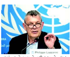
નરસંહારનો સામનો કરી રહ્યા છે. 'બધા

(એજન્સી) તા. ૨૫ પેલેસ્ટીની ઈન્ફોર્મેશન સેન્ટરે અહેવાલ આપ્યો છે કે યુનાઈટેડ નેશન્સ રિલીફ એન્ડ વર્ક્સ એજન્સી ફોર પેલેસ્ટીન રેફ્યુજીસ (યુએનઆરડબ્લ્યુએ)ના કમિશનર-જનરલએ જણાવ્યું છે કે ઈઝરાયેલી કબજાવાળા રાજ્ય દ્વારા ગાઝા પટ્ટીમાં યુદ્ધના તમામ નિયમોનું ઉલ્લંઘન કરવામાં આવી રહ્યું છે. ગાઝામાં પેલેસ્ટીનીઓ ૧૪ મહિનાથી વધુ સમયથી ઈઝરાયેલના