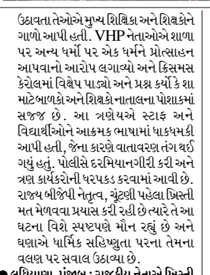
ઉઠાવતા તેઓએ મુખ્ય શિક્ષક અને શિક્ષકોને ગણી આપી હતી. VHP નેતાઓએ શાળા પર અન્ય ધર્મો પર એક ધર્મને પ્રોત્સાહન આપવાનો આરોપ લગાવ્યો અને ક્રિસમસ કેરોલમાં વિક્ષેપ પાડ્યો અને પ્રશ્ન કર્યો કે શા માટે બાળકોને શિક્ષકોના નાતાલના પોશાકમાં સજજ છે. આ ત્રણેયને સ્ટાફ અને વિદ્યાર્થીઓને આક્રમક ભાવનામાં ધાકધમકી આપી હતી, જેના કારણે તાત્કાલિક તંત્રીઓએ ગણેશ મહાદેવની પ્રતિમાને સુધારી દેવાની જોગવાઈ કરી અને ત્રણ કાર્યકરોની ધરપકડ કરવામાં આવી છે. રાજ્ય બીજા પંજાબ, ચૂંટણી પહેલાં ખ્રિસ્તી મત મેળવવા પ્રયાસ કરી રહી છે ત્યારે તે આ ઘટના વિશે સ્પષ્ટપણે મોન રહ્યું છે અને ઘણાએ ધાર્મિક અસહિષ્ણુતા પરના તેમના વલણ પર સવાલ ઉઠાવ્યા છે.

આડમાં ધાર્મિક લઘુમતીઓ પર હુમલો કરવાની તક તરીકે કરવામાં આવે છે. જાહેર જગ્યા પર તો ટીક પણ લોકો તેમના ઘરની ગોપનીયતામાં પણ મુક્તપણે તેમના ધર્મનું પાલન કરવા માટે વધુને વધુ અસુરક્ષિત બની રહ્યા છે. રાજપૂતની આ ક્રિયાઓ એવા પ્રદેશોમાં લઘુમતી ધાર્મિક પ્રથાઓની આસપાસ ભય અને શંકાનું વાતાવરણ દર્શાવે છે જ્યાં રાજકીય નેતાઓ વ્યક્તિગત લાભ માટે સાંપ્રદાયિક વિષયોને વેગ આપે છે. ● જેલમહેર, રાજસ્થાન: શાળાઓમાં નાતાલની ઉજવણીનો વિરોધ ૨૩ ડિસેમ્બર, ૨૦૨૪ના રોજ VHP કાર્યકરોના એક પ્રતિનિધિમંડળે જેલમહેર જિલ્લા કલેક્ટર સાથે મુલાકાત કરી, તેઓએ મિશનરી શાળાઓ દ્વારા 'ધર્મ પરિવર્તનના