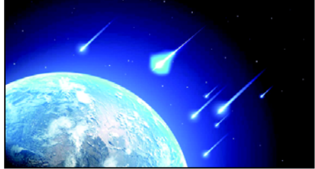
આકાશમાં પ્રતિ કલાકમાં ૧૧૦ ઉલ્કાવર્ષા જોઈ શકાશે