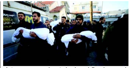
સૌથી ભયાનક જગ્યાઓમાંથી એક છે.' 'હોસ્પિટલો, શાળાઓ અને ઘરોના વિનાશ તેમજ મનોવૈજ્ઞાનિક વિનાશની શ્રેણીએ બાળકો માટે અદૃશ્ય પરંતુ ઓછા વિનાશ ઘા છોડી દીધા છે, જેઓ આ યુદ્ધ માટે કોઈ જવાબદારી લેતા નથી.' અભ્યાસમાં એવા પરિવારોના ૫૦૪ બાળકોના માતા-પિતા અથવા સંભાળ રાખનારાઓનું સર્વેક્ષણ કરવામાં આવ્યું હતું જેમાં ઓછામાં ઓછું એક બાળક અપંગ, ઈજાગ્રસ્ત અથવા ત્વજી દેવાયું હતું. યુનાઈટેડ નેશન્સ હાઈ કમિશનર ફોર હુમન રાઈટ્સ ઓફિસના તાજેતરના મૂલ્યાંકન મુજબ, ગાઝામાં મૃત્યુ પામેલા બાળકોની સંખ્યા યુનિસેફના અંદાજ કરતા વધારે છે. તેમાં જાણવા મળ્યું છે કે ગાઝામાં ઈઝરાયેલ દ્વારા મૃત્યુ પામેલા ૪૫,૩૦૦ પેલેસ્ટીનીમાંથી ૪૪ ટકા બાળકો હતા.

(એજન્સી) તા. ૨૫ યુનાઈટેડ નેશન્સ રિલીફ એન્ડ વર્ક્સ એજન્સી ફોર પેલેસ્ટીન રેફ્યુજીસ (યુએનઆરડબ્લ્યુએ)ના કમિશનર જનરલે જણાવ્યું છે કે ઈઝરાયેલના ચાલુ હુમલાના પરિણામે ગાઝા પટ્ટીમાં દર કલાકે એક પેલેસ્ટીની બાળકનું મૃત્યુ થાય છે. તેમણે જણાવ્યું કે 'યુદ્ધની શરૂઆતથી ગાઝામાં ૧૪,૫૦૦ બાળકો મૃત્યુ પામ્યા હોવાના અહેવાલ છે,' ફિલિપ લાઝારિનીએ યુનિસેફના આંકડાઓને ટાંકીને સોશિયલ મીડિયા પર લખ્યું કે, 'બાળકોની હત્યાને વાજબી ઠેરવી શકાય નહીં. દર કલાકે એક બાળકની હત્યા થાય છે. આ સંખ્યાઓ નથી. આ અધુરી જિંદગી છે. બાળકોની હત્યાને વાજબી ઠેરવી શકાય નહીં.' જેઓ બચી જાય છે તેઓ શારીરિક અને ભાવનાત્મક રીતે ઘાયલ થાય છે, લાઝારિનીએ જણાવ્યું હતું. 'ગાઝામાં છોકરા-છોકરીઓ શિક્ષણથી વંચિત છે અને કાટમાળ નીચે દટાઈ ગયા છે. આ બાળકો માટે સમય પૂરો થઈ રહ્યો છે. તેઓ પોતાનું જીવન, તેમનું ભવિષ્ય અને સૌથી વધુ તેમની આશા ગુમાવી રહ્યાં છે.' વોર ચાઈલ્ડ એલાયન્સ દ્વારા પ્રાયોજિત ગાઝા-આધારિત એનજીઓ દ્વારા હાથ ધરવામાં આવેલ જરૂરિયાતોના મૂલ્યાંકન મુજબ, સર્વેક્ષણમાં ૯૨ ટકા પેલેસ્ટીની બાળકો 'વાસ્તવિકતાને સ્વીકારી શકતા નથી'; ૭૯ ટકા સ્વપ્રોથી પીડાય છે; અને ૭૩ ટકા લોકો આક્રમકતાના લક્ષણોથી પીડાય છે. વોર ચાઈલ્ડ યુકેના ચીફ એક્ઝિક્યુટિવ હેલેન પેટિન્સને જણાવ્યું કે, 'આ રિપોર્ટ દર્શાવે છે કે ગાઝા બાળકો માટે વિચની