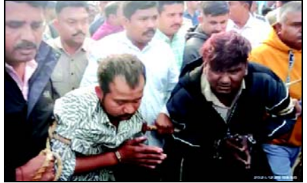
પાંચેય આરોપીઓ પોલીસના સર્કજમાં, નવી પ્રતિમાનું અનાવરણ થતાં બે દિવસથી ચાલતા ધરણા પૂર્ણ

અમદાવાદના ખોખરામાં ડેક્ટર બાબા સાહેબ આંબેડકરની પ્રતિમાને નુકસાન પહોંચાડનારા આરોપીઓનું પોલીસે જાહેરમાં સરઘસ કઢાવી માફી માંગવી હતી. દોરડાથી બાંધીને પોલીસે આરોપીઓને ઘટનાસ્થળે લઈ જઈ રિકન્સ્ટ્રક્શન કર્યું હતું. અહીં ડો. બાબાસાહેબની પ્રતિમાનું નાક તોડનારા આરોપીઓ કાન પકડી વાંકા વળી માફી માગતા જોવા મળ્યા હતા. આ સાથે જ ખંડિત પ્રતિમાને હટાવીને નવી પ્રતિમાનું અનાવરણ થતા જ બે દિવસથી ચાલતાં ધરણાં પણ પૂર્ણ થઈ ગયા છે. આ ઘટનામાં અન્ય ત્રણ આરોપી ફરાર હતાં, જેઓને પોલીસે શોધી કાઢ્યાં છે. હવે આગામી સમયમાં આ આરોપીનું પણ પોલીસ સરઘસ કાઢે તેવી સંભાવના છે. હાલ આ પ્રકરણના તમામ આરોપી હવે પોલીસ કસ્ટડીમાં છે. આ અંગે સ્થાનિક