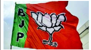
ખ્રિસ્ત કળા અને નિરવચારી સેવાનું પ્રતીક છે. સુરેન્દ્રને ધર્મીએ હિંદુને જણાવ્યું હતું કે પાર્ટીએ તેના વાયનાડ જિલ્લા પ્રમુખને ખ્રિસ્તી વિરોધી ટિપ્પણી કરવા બદલ હાંકી કાઢ્યા છે. શ્રી સુરેન્દ્રને કહ્યું કે તેમને શંકા છે કે નાલોપીલીની ઘટના ખ્રિસ્તીઓ સુધી ભાજપની પહોંચને અટકાવવા માટે કોંગ્રેસ દ્વારા રચવામાં આવેલા રાજકીય કાવતરાનો ભાગ છે. તેમણે કહ્યું કે ખ્રિસ્તી ધરો અને ચર્ચના નેતાઓના નિવાસસ્થાનો સુધી ભાજપની સ્નેહ યાત્રા અવિરત ચાલુ રહેશે. વીએચપીના રાજ્ય સચિવ વિજય ધર્મીએ હિંદુને જણાવ્યું હતું કે પલક્કડના વિરોધ કર્યા હતા અને હાજપ પર પ્રહાર કર્યા હતા. ભાજપની નજર કેરળમાં ખ્રિસ્તી સમુદાયના હિન્દુ કે પલક્કડના નેતા વી.ડી. સતીસને ખ્રિસ્તીઓ પ્રત્યેના ભાજપના આ પ્રેમને ને ધેડાં રૂપમાં વરુ સમાન ગણાવ્યા. તેમણે કહ્યું કે નાલોપીલીની ઘટનાએ સંઘ પરિવારનું સાચું લઘુમતી વિરોધી પાત્ર જાહેર કર્યું છે. ખ્રિસ્તી-સુન્નિયમ દુર્મનાવાટ વચ્ચે, ભાજપ કેરળમાં આ સમુદાયનો (CBCI) દ્વારા આયોજિત નાતાલની ઉજવણીમાં ભાગ લેવાના એક દિવસ પછી કરવામાં આવ્યું હતું. મોદીએ બાઈબલમાંથી ટાંકીને કહ્યું કે ઈસુ

(એજન્સી) તા.૨૫ ભારતીય જનતા પાર્ટી (BJP) કેરળમાં ખ્રિસ્તી સમુદાય સુધી વિસ્તરી રહેલી પહોંચને નોંધપાત્ર સામાજિક-રાજકીય વિરોધનો સામનો કરવો પડી રહ્યો છે. નાતાલની પૂર્વસંધ્યાએ દેખીતી કડાચ સાથેની એક સોશિયલ મીડિયા પોસ્ટમાં, મલકારા ઓર્થોડોક્સ સીરિયન ચર્ચના શ્રીસુર ડાયોસેસના મેટ્રોપોલિટન બિશપ યુહાનોને મેલ્ટિપ્લિક્સ, ખ્રિસ્તી સમુદાયને આકર્ષવાના ભાજપના પ્રયાસનો તીવ્ર વિરોધ કર્યો હતો. વિશ્વ હિન્દુ પરિષદ (VHP) દ્વારા તાજેતરમાં પલક્કડની એક સરકારી શાળામાં નાતાલની ઉજવણીમાં વિશેષ પાડવાના કથિત પ્રયાસના સંદર્ભમાં મેટ્રોપોલિટન બિશપે નોંધ્યું હતું કે પાર્શ્વ (ઈસુ ખ્રિસ્તના જન્મનું નિરૂપણ)નો કેટલીક જગ્યાએ આદર કરવામાં આવે છે અને અન્ય જગ્યાએ તેની તોડફોડ કરવામાં આવી હતી. બિશપનું આ નિવેદન, વડા પ્રધાન નરેન્દ્ર મોદીએ ચર્ચના નેતાઓને સંબોધિત કર્યાના અને નવી દિલ્લીમાં કેબીકેટ બિશપ ક્રોમ્વેન્સ ઓફ ઈન્ડિયા (CBCI) દ્વારા આયોજિત નાતાલની ઉજવણીમાં ભાગ લેવાના એક દિવસ પછી કરવામાં આવ્યું હતું. મોદીએ બાઈબલમાંથી ટાંકીને કહ્યું કે ઈસુ