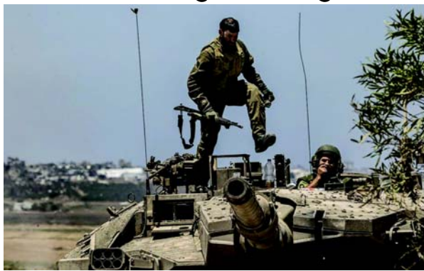
કેન્દ્રમાં 'ખાસ કરીને અવ્યવસ્થિત પ્રયાસો પર પ્રકાશ પાડવામાં આવ્યો છે, જ્યાં ૭ ઓક્ટોબર ૨૦૨૩થી અટકાયતીઓના મૃત્યુની ૩૬ તપાસ ચાલુ છે. એક અનામત સૈનિક ફૂરતાના સામાન્યીકરણનું વર્ણન કર્યું છે કે 'મેં ત્યાં ફૂર લોકો જોયા. જે લોકો અન્યને પીડા પહોંચાડવામાં આનંદ માણતા હતા. સૌથી વધુ અવ્યવસ્થિત બાબત એ હતી કે તેઓ કેટલી સરળતાથી અને કેટલી ઝડપથી પોતાની જાતને અલગ કરી લે છે.' અન્ય સૈનિકે સ્વીકાર્યું કે 'અહીં સંપૂર્ણ અમાનવીયીકરણ છે. તે મને હેરાન કરે છે કે તે મને પરેશાન કરતું નથી. પ્રક્રિયા સામાન્ય થઈ રહી છે, અને અમુક સમયે, તે પરેશાન કરવાનું બંધ કરે છે.' સંબંધિત શિક્ષકમાં, હારેટ્ઝ એક મુખ્ય સંપાદકીય સીર્ષક પ્રકાશિત કર્યું છે, 'ઈઝરાયેલ ગાઝામાં તેની માનવતા ગુમાવી રહ્યું છે'. અખબારે સૈનિકો દ્વારા 'અનિયંત્રિત

(એજન્સી) તા. ૨૫ સાયકોલોજિકલ કાઉન્સિલના પૂર્વ અધ્યક્ષ અને જેરૂસલેમની હિબ્રુ યુનિવર્સિટીના એમેરિટસ પ્રોફેસર, પ્રોફેસર યોએલ એલિઝર દ્વારા હારેટ્ઝમાં પ્રકાશિત વિગતવાર વિશ્લેષણ અનુસાર, ઈઝરાયેલી સૈનિકો ગાઝામાં વધુને વધુ ફૂરતા અને યુદ્ધ અપરાધોમાં સામેલ થઈ રહ્યા છે, વધુ 'નિર્દય' બની રહ્યા છે. વૈચારિક રીતે હિંસક સૈનિકો દેખાય છે. લેખમાં કમાન્ડર દ્વારા ચાર વર્ષના બાળક પર ઉશ્કેરણી વગરના હુમલા સહિત અવ્યવસ્થિત ઘટનાઓની વિગતો આપવામાં આવી છે. લેખમાં સૈનિકોને ટાંકીને કહેવામાં આવ્યું કે, 'કમાન્ડર અચાનક દોડવા લાગે છે, છોકરાને પકડે છે અને તેના હાથની કોણી અને પગ ભાંગી નાખે છે. તે તેના પેટ પર ત્રણ વાર ઠોકર મારીને ચાલ્યો જાય છે.' જ્યારે પ્રશ્ન પૂછવામાં આવ્યો, ત્યારે કમાન્ડરે જવાબ આપ્યો કે 'આ બાળકોને તેઓના જન્મના દિવસથી જ મારી નાખવા જોઈએ આવી કાર્યવાહીનો વિરોધ કરનારા સૈનિકોને ગંભીર પરિણામો ભોગવવા પડે છે. મેક્સ કેશ, એક અનામત ફાઈટર કે જેમણે 'ગાઝાને સ્તરીકરણ' અને માનવતા વિરૂદ્ધના અન્ય ગુનાઓ સામે પોતાનો વિરોધ જાહેર કર્યો હતો, તેને તીવ્ર સામાજિક બહિષ્કારનો સામનો કરવો પડ્યો. 'તેઓએ મને મારી દીધાંથી કાઢી મૂક્યો. તેઓએ સ્પષ્ટ કર્યું કે તેઓ મને નથી જોઈતા, તેમણે જણાવ્યું, અને ઉમેર્યું કે જ્યારે તેઓ ફરજ પરથી પાછા ફર્યા ત્યારે તેઓ 'માનસિક રીતે કચડાયેલા' અનુભવે છે. અહેવાલમાં SD ટિમન અટકાયત