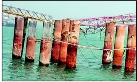
ઘટનાસ્થળે પહોંચી છે. જોકે અકસ્માતનું કારણ અકબંધ છે. આ અંગેની પ્રાપ્ત માહિતી મુજબ ઘટના ઓખા ખાતે આવેલ જીએમબીની પેસેન્જર જેટી પર કામ ચાલતું હતું તે દરમિયાન કેનનો એક ભાગ તૂટી પડતાં ત્યાં કામગીરી કરી રહેલ ત્રણ લોકો દટાઈ જતા મૃત્યુને ભેટવા હતા. જીએમબીની જેટી પર કોસ્ટગાર્ડ

અમદાવાદ, તા. ૨૫ રાજ્યમાં વધુ એક ગોઝારી ઘટના ઘટવા પામી છે. જેમાં ઓખા જેટી ખાતે કેન તૂટી પડવાના બનાવમાં કેન નીચે દબાતાં ૩ લોકોનાં મોત નીપજ્યાં હતાં. કોસ્ટગાર્ડની નવી જેટી બનાવવાની કામગીરી ચાલી રહી હતી તે સમયે ઘટના સર્જાતાં ૩ લોકો કેન નીચે દબાઈને પાણીમાં પડી ગયા હતા. જેમાં એન્જિનિયર, સુપર વાઈઝર તથા એક મજૂરનું મોત નીપજ્યું હતું. હાલ ત્રણ મજૂરના મૃતદેહોને બહાર કાઢી પોસ્ટમોર્ટમ માટે લઈ જવાયા છે. આ ઘટના બાદ ઓખા જેટી પર ચ્મ કોસ્ટ ગાર્ડ, પોલીસ વિભાગ, ફાયર ટીમ તથા ૧૦૮ની ટીમ