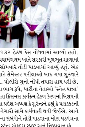
૨૮૯ (b), ૩૫૧ (૨) અને ૧૩૨ હેઠળ કેસ નોંધવામાં આવ્યો હતો. પલક્કડમાં અન્ય એક ઘટનામાં શ્યામગલમ ખાતે સરકારી મૂળભૂત શાળામાં બાંધવામાં આવેલ એક પારખું સોમવારે તોડી પાડવામાં આવ્યું હતું. એક સમાહની નાતાલની રજાઓ માટે સેમેસ્ટર પરીક્ષાઓ બાદ ગયા શુકરવારે શાળા બંધ કરવામાં આવી હતી. પોલીસે ગુનો નોંધી તપાસ હાથ ધરી છે. ભાજપના આઉટરિચ પ્રયાસોના ભાગ રૂપે, પાર્ટીના નેતાઓ 'સ્નેહ યાત્રા' અથવા પ્રેમ યાત્રા તરીકે ઓળખાતા ક્રિસમસ કાર્યક્રમ હેઠળ કેટલાંક બિશપની મુલાકાત લઈ રહ્યા છે. ભાજપના પ્રદેશ અધ્યક્ષ કે સુરેન્દ્રને કહ્યું કે પલક્કડની ઘટનાઓ પાછળ ધર્મચંદ્ર છે. ગુનેગારો સામે વાલી થવી જોઈએ. આને ખ્રિસ્તી સમુદાય સાથેના ભાજપના સંબંધોને તોડી પાડવાના મોટા પર્યવરના ભાગરૂપે જોવું જોઈએ. અમારું સ્ટેન્ડ એકદમ સ્પષ્ટ અને નિઠાવના છે.