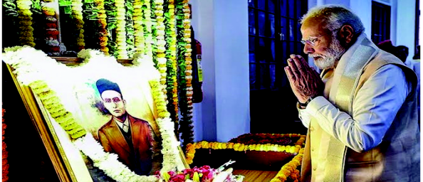
વડાપ્રધાને આજે દિલ્હીના નજફગઢમાં રોશનપુરા ખાતે સાવરકર કોલેજનું ઉદ્ઘાટન કર્યું; દિલ્હી વિધાનસભા ચૂંટણીઓ પહેલાં રાજકીય વિવાદ, નામકરણ અંગે ઉગ્ર ડિબેટ

(એજન્સી) તા.૩ દિલ્હી યુનિવર્સિટી (DU)ની વીર સાવરકર કોલેજ (નજફગઢ)ના શિલાન્યાસ સમારોહને લઈને રાજકીય હોબાળો ચાલી રહ્યો છે. વડાપ્રધાન નરેન્દ્ર મોદી શુક્રવારે તેનો શિલાન્યાસ કરી શકે છે. બીજા તરફ કોંગ્રેસનું વિદ્યાર્થી સંગઠન નેશનલ સ્ટુડન્ટ્સ યુનિયન ઓફ ઈન્ડિયા (NSUI) તેનો વિરોધ કરી રહ્યું છે. તેઓ ઈચ્છે છે કે યુનિવર્સિટીનું નામ ગત મહિને મૃત્યુ પામેલા પૂર્વ વડાપ્રધાન મનમોહન સિંહના નામ પર રાખવામાં આવે. એનએસયુઆઈએ પીએમ મોદીને પત્ર લખીને ત્રણ માગણીઓ રજૂ કરી છે. સૌપ્રથમ, દિલ્હી યુનિવર્સિટીમાં ડૉ. મનમોહન સિંહના નામ પર વિશ્વ કક્ષાની કોલેજ બનાવવી જોઈએ. બીજું, તેમના નામે કેન્દ્રીય યુનિવર્સિટીની સ્થાપના થવી જોઈએ. ત્રીજું, વિભાગને પછીના વિદ્યાર્થીની વૈશ્વિક હસ્તી સુધી તેમની જીવનયાત્રાનો શૈક્ષણિક અભ્યાસક્રમ અને રાજકીય ક્ષેત્રે સમાવેશ થવો જોઈએ. કોંગ્રેસ કહે છે કે દેશમાં ઘણા સ્વાતંત્ર્ય સેનાનીઓ છે, સરકાર તેમાં ના કોઈપણના નામ પર યુનિવર્સિટીનું નામ આપી શકી હોત. દિલ્હી યુનિવર્સિટીનું નામ પૂર્વ સ્વાતંત્ર્ય સેનાનીના નામ પર રાખવામાં આવ્યું હોત. કોંગ્રેસ સાવરકરને સ્વાતંત્ર્ય સેનાની માનતી નથી. કોંગ્રેસના સાંસદ ડૉ. સેઘદ નસીર હુસૈને કહ્યું, 'દેશની સાર્વભૌમિક