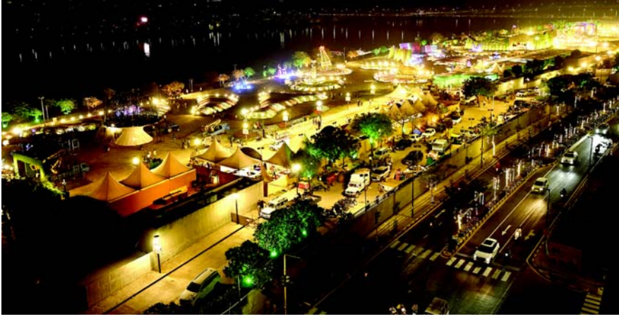
અમદાવાદ મ્યુનિસિપલ કોર્પોરેશન દ્વારા દર વર્ષે જાન્યુઆરી મહિનાના સમયગાળા દરમ્યાન સાબરમતી રિવરફ્રન્ટ પર ફલાવર શોનું આયોજન કરવામાં આવે છે. ચાલુ વર્ષે ફલાવર શો ૨૦૨૫નું આયોજન કરવામાં આવ્યું છે. દર વર્ષે કરતા આ વર્ષે ફલાવર શોમાં સ્ટ્રક્ચર અને સ્ટ્રક્ચરની સંખ્યામાં વધારો કરવામાં આવ્યો છે. ત્યારે ફલાવર શોની રોશનીથી રિવરફ્રન્ટમાં એક વિશેષ વિભિન્નતા જોવા મળી રહી છે જે તસવીરમાં પ્રકાશિત થાય છે.