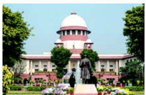
પર્યાપ્ત વળતર વિના કોઈને પણ પોતાની મિલકતથી વંચિત રાખી શકાય નહીં : સુપ્રીમ કોર્ટ

(એજન્સી) તા.૩ આ કેસમાં અપીલકર્તાઓ ૧૮૯૮ના જમીન સંપાદન અધિનિયમ હેઠળ તેમને ઉપલબ્ધ તમામ વૈધાનિક લાભો માટે પણ હકદાર હશે. બંધારણની કલમ ૩૦૦-A જોગવાઈ કરે છે કે, કાયદાની સત્તા સિવાય કોઈપણ વ્યક્તિને તેની સંપત્તિથી વંચિત રાખવામાં આવશે નહીં. સુપ્રીમ કોર્ટે ગુરુવારે ચુકાદો આપતાં કહ્યું કે, મિલકતનો અધિકાર એ માનવ અધિકાર અને બંધારણીય અધિકાર છે અને કોઈપણ વ્યક્તિને પર્યાપ્ત વળતરની ચુકવણી કર્યા વિના તેની મિલકતથી વંચિત રાખી શકાય નહીં, વળતરની વહેંચણીમાં અસાધારણ વિલંબના અસાધારણ સંજોગોમાં, વેલ્યુએશન કિસ્સા કરવાની તારીખને વધુ તાજેતરની તારીખમાં ગણી શકાય છે. સુપ્રીમ કોર્ટે કહ્યું છે કે, મિલકતનો અધિકાર એ બંધારણીય અધિકાર છે અને કાયદા અનુસાર યોગ્ય વળતર ચુકવ્યા વિના વ્યક્તિને તેની મિલકતથી વંચિત રાખી શકાય નહીં. બેંગ્લુરુ-મેસુર ઈન્ફ્રાસ્ટ્રક્ચર કોરિડોર પ્રોજેક્ટ (BMICP) માટે જમીન સંપાદન સંબંધિત મામલામાં ક્ષણિક હાઈકોર્ટના નવેમ્બર ૨૦૨૨ના ચુકાદાને પડકારતી અપીલ પર સર્વોચ્ચ અદાલતે ગુરુવારે પોતાનો ચુકાદો આપ્યો હતો. સર્વોચ્ચ અદાલતે જણાવ્યું હતું કે, જમીન માલિકોએ છેલ્લા ૨૨ વર્ષોમાં ઘણી વખત કોર્ટનો દરવાજો ખટખટાવ્યો પરંતુ હતા અને તે માટે કોઈપણ વળતર વિના