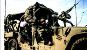
વિક્ષેપો અને ચાર અન્ય ઘટનાઓમાં. દસ સૈનિકો રોગથી મૃત્યુ પામ્યા. ૨૦૨૩માં, શંકાસ્પદ આત્મહત્યાના ૧૭ કેસો ઓળખવામાં આવ્યા હતા, જેમાં સાત ઈઝરાયેલી સૈનિકો, ચાર કારકિર્દી સૈનિકો અને છ અનામત સૈનિકો સામેલ હતા. સૈન્યના અહેવાલ મુજબ, ૨૦૨૪ માં લશ્કરી મૃત્યુની કુલ સંખ્યામાં પાછલા વર્ષની સરખામણીમાં ઘટાડો થયો છે, પરંતુ શંકાસ્પદ આત્મહત્યામાં નોંધપાત્ર વધારો થયો છે. સૈન્યના ડેટા અનુસાર, ૨૧ ઈઝરાયેલી સૈનિકો ૨૦૨૪ માં આત્મહત્યા કરે તેવી અપેક્ષા વાહન અકસ્માતોમાં, એક આકસ્મિક હથિયાર

(એજન્સી) તા.૩ ઈઝરાયેલી સૈન્યએ ગાઝા સામે ચાલી રહેલા લશ્કરી હુમલાને પગલે તેના કર્મચારીઓમાં આત્મહત્યામાં વધારો નોંધ્યો છે. ૨૦૨૩ અને ૨૦૨૪માં ૩૮ ઈઝરાયેલી સૈનિકોએ આત્મહત્યા કરી હોવાની ટીકા છે, જેમાંના ૨૮ કેસ ઓક્ટોબર ૨૦૨૩ પછી મૃત્યુ પામ્યા છે. તુલાનાત્મક રીતે, ૨૦૨૨માં ૧૪ અને ૨૦૨૧માં ૧૧ આત્મહત્યા નોંધાઈ હતી. ગાઝામાં ઈઝરાયેલી સૈનિકોને કારણે એક્ટર સૈન્ય જાનહાનિમાં નોંધપાત્ર વધારો થયો છે, જેણે ૨૦૨૩ અને ૨૦૨૪ને ઈઝરાયેલી કબજાવાળા દળો માટે દાયકાઓમાં સૌથી ભયંકર વર્ષ બનાવ્યા છે. માહિતી અનુસાર, ૨૦૨૩માં ૫૫૮ ઈઝરાયેલ સૈનિકોએ જીવ ગુમાવ્યો હતો, જેમાંથી ૫૧૨ સૈનિક ગતિવિધિઓમાં મૃત્યુ પામ્યા છે. ૨૦૨૩માં મૃત્યુના વધારાના કારણોમાં અકસ્માતોનો સમાવેશ થાય છે, જેમાં ૧૬ લોકોના મોત થયા હતા-બે તાલીમ અકસ્માતોમાં, ચાર નાગરિક કાર અકસ્માતોમાં, પાંચ લશ્કરી વાહન અકસ્માતોમાં, એક આકસ્મિક હથિયાર