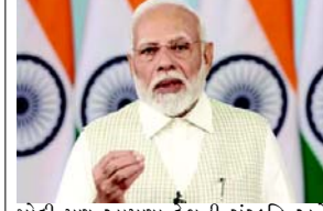
મોદી પણ આપણા દેશની સંસ્કૃતિ અને સભ્યતાને અનુસરી રહ્યા છે. નસરુદ્દીન શિશ્ટીએ કહ્યું, 'આપણી સભ્યતા કહે છે કે દરેક ધર્મ, ધર્મ અને સંપ્રદાય અને દરેક ધર્મના સંતોનું સન્માન કરવું જોઈએ. આ પરંપરાનું પાલન વડાપ્રધાન નરેન્દ્ર મોદી કરી રહ્યા છે અને પૂબ જ સન્માન સાથે તેઓ ૧૦ વર્ષથી આ સત્તામાં છે અને યાદર મોકલી રહ્યા છે. તેમણે કહ્યું, 'જ્યારે સુધાર અભ્યાસ નક્કી કરેલો હોય ત્યારે એક વખત હું પોતે યાદર લેવા ગયો હતો. આ વખતે વડાપ્રધાન

(એજન્સી) તા.૩ વડાપ્રધાન નરેન્દ્ર મોદી દ્વારા અજમેર શરીફ દરગાહને યાદર મોકલી આપવામાં આવી છે. પીએમ મોદીએ કેન્દ્રીય મંત્રી કિરેન રિજિજુના હાથે આ યાદર સોંપી હતી. હવે લઘુમતી મંત્રી સૌપ્રથમ નિજામુદ્દીન ઓલિયા (૩ જાન્યુઆરી)ની દરગાહની મુલાકાત લેશે. નિજામુદ્દીન ઓલિયાને ભેટમાં આપેલી યાદર લીધા બાદ તેને અજમેર શરીફ દરગાહ લઈ જવામાં આવશે. અજમેર દરગાહના વડા નસરુદ્દીન ભેટમાં આપેલી યાદર લીધા બાદ તેને અજમેર શરીફ દરગાહ લઈ જવામાં આવશે. અજમેર દરગાહના વડા નસરુદ્દીન ભેટમાં આપેલી યાદર લીધા બાદ તેને અજમેર શરીફ દરગાહ લઈ જવામાં આવશે. અજમેર દરગાહના વડા નસરુદ્દીન ભેટમાં આપેલી યાદર લીધા બાદ તેને અજમેર શરીફ દરગાહ લઈ જવામાં આવશે.