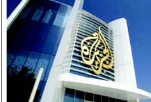
પેલેસ્ટીની ઓથોરિટી (PA) પર પ્રભુત્વ ધરાવે છે, તેણે અલ જઝીરા નેટવર્ક પર 'આપણા અરબ દેશમાં અને ખાસ કરીને પેલેસ્ટીનીઓ' વિભાજન બનાવવાનો આરોપ મૂક્યો છે. અલ જઝીરા ભારપૂર્વક કહે છે કે તે નિષ્પક્ષ છે. PA, જે સુરક્ષાની બાબતો પર ઈઝરાયેલને સહકાર આપે છે, તે પેલેસ્ટીની લોકોમાં વધુને વધુ અપ્રિય બની રહ્યું છે અને જૈનિનના શહેરી શરણાર્થી શિબિર પર તેનું ઓછું નિયંત્રણ છે, જે ઐતિહાસિક રીતે સશસ્ત્ર સમુદાયના ગઠ તરીકે જોવામાં આવે છે. ડિસેમ્બરની શરૂઆતથી, તેના દળો જૈનિન બટાલિયનના સભ્યો સામે લડી રહ્યા છે, જેમાંથી મોટાભાગના ઈસ્લામિક જેહાદ અથવા હમાસ સાથે જોડાયેલા છે, જેમના ૭ ઓક્ટોબર ૨૦૨૩ના રોજ ઈઝરાયેલ પરના હુમલાએ અંદર ગઈ હતી. ભુધવારે સાંજે, એક ગણવેશધારી અધિકારી અલ જઝીરાના સંવાદદાતાને સત્તાવાર ઓફિસ આપતા બતાવવામાં આવ્યો હતો, જે તેને વાંચે છે અને સહી કરે છે. કતાહ, પેલેસ્ટીની સમુદાય કે જે

(એજન્સી) તા.૩ પેલેસ્ટીની ઓથોરિટીએ જણાવ્યું કે તેણે ઉશ્કેરણી અને પૂર્વગ્રહને ટાંકીને કબજાવાળા વેસ્ટ બેંકના ભાગોમાં મુખ્ય અરબ ચેનલ અલ જઝીરા દ્વારા પ્રસારણ સ્થગિત કરી દીધું છે. કતારની માલિકીની અલ જઝીરાએ આ નિર્ણય પર આશ્ચર્ય વ્યક્ત કર્યું અને તેને 'અધિકૃત પ્રદેશોમાં ઘટનાઓ વિશે સત્ય છુપાવવાનો પ્રયાસ' તરીકે ટીકા કરી છે. આ જૈનિન શરણાર્થી શિબિરમાં સશસ્ત્ર ઈસ્લામિક સમુદાયો પર પેલેસ્ટીની સુરક્ષા દળો દ્વારા તાજેતરના મોટા કેડાઉનના સમાચાર કવરેજને બંધ કરવા સાથે જોડાયેલું છે, જ્યાં ઓછામાં ઓછા ૧૧ લોકો મૃત્યુ પામ્યા છે. અલ જઝીરા, જે ખાસ કરીને ગાઝા યુદ્ધના તેના વિગતવાર કવરેજ માટે પેલેસ્ટીનીઓ દ્વારા વ્યાપકપણે જોવામાં આવે છે, તે ઈઝરાયેલમાં અરબી અને અંગ્રેજીમાં પહેલાથી જ બંધ કરવામાં આવ્યું છે. જાહેરાત મહિનાઓમાં બીજી વખત, અલ જઝીરાએ રામલ્લાહમાં તેની ઓફિસની અંદરથી ફૂટેજનું ભોગ બને છે. 'તાત્કાલિક યુદ્ધવિરામ માટે યુએન સુરક્ષા પરિષદના દરવાહોવા છતાં, ઈઝરાયેલી દળોએ ગાઝા પર તેમનું નરસંહાર યુદ્ધ ચાલુ રાખ્યું છે, જેમાં ૭ ઓક્ટોબર ૨૦૨૩ના રોજ નરસંહાર રોકવા માટે તેમની કાનૂની અને નૈતિક જવાબદારીઓ પૂર્ણ કરવા વિનંતી કરી. ઓફિસે