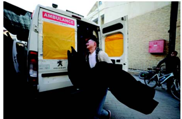
'ગાઝામાં પેલેસ્ટીની લોકો માટે તાત્કાલિક આંતરરાષ્ટ્રીય સુરક્ષા માટે માંગ કરી છે, જેઓ સૌથી ખરાબ પ્રકારના ગુનાઓ અને ઉલ્લંઘનોનો ભોગ બને છે.' તાત્કાલિક યુદ્ધવિરામ માટે યુએન સુરક્ષા પરિષદના દરવાહોવા છતાં, ઈઝરાયેલી દળોએ ગાઝા પર તેમનું નરસંહાર યુદ્ધ ચાલુ રાખ્યું છે, જેમાં ૭ ઓક્ટોબર ૨૦૨૩ના રોજ નરસંહાર રોકવા માટે તેમની કાનૂની અને નૈતિક જવાબદારીઓ પૂર્ણ કરવા વિનંતી કરી. ઓફિસે

(એજન્સી) તા.૩ ગાઝા મીડિયા ઓફિસે ગુરુવારે જણાવ્યું કે, ઈઝરાયેલી દળોએ ગાઝા પટ્ટીમાં પાછલા ૨૪ કલાકમાં નિશાન નાગરિકોને નિશાન બનાવીને ૩૪ હવાઈ હુમલા કર્યા હતા, જેમાં ૭૧ પેલેસ્ટીની મૃત્યુ પામ્યા છે અને ૬૩૦૦ ઘાયલ થયા છે. નિવેદનમાં જણાવવામાં આવ્યું છે કે, 'ઈઝરાયેલી હવાઈ હુમલાઓ નાગરિકો અને ઈન્ફ્રાસ્ટ્રક્ચરને નિશાન બનાવે છે, જે વ્યવસાયના અંધકારમય ઈતિહાસને વધુ ગાઢ બનાવે છે.' તે અહેવાલ આપે છે કે સેનાએ તબીબી અને નાગરિક સુરક્ષા ટીમોને પીડિતોના મૃતદેહોને પુનઃપ્રાપ્ત કરવાથી અટકાવી હતી, જે ખાસ કરીને ગાઝા અને ઉત્તર ગાઝામાં શેરીઓમાં વિખરાયેલા હતા. ઓફિસે ભારપૂર્વક જણાવ્યું કે પેલેસ્ટીની લોકો સામે ઈઝરાયેલના નરસંહારના ઝપટના દિવસે વધારો થયો છે, જેમાં 'એક જ હકીકત લાદવી, જીવનના પાયા, ઈન્ફ્રાસ્ટ્રક્ચરને લક્ષ્ય બનાવવું અને પેલેસ્ટીનીઓની સ્થિતિસ્થાપકતાને સમર્થન આપતી દરેક વસ્તુનો નાશ કરવાનો પ્રયાસ કરવામાં આવ્યો છે.' તેણે 'ફર ગુનાઓ' માટે ઈઝરાયેલને જવાબદાર ગણાવ્યું અને આંતરરાષ્ટ્રીય સમુદાય અને યુએન સંસ્થાઓને નરસંહાર રોકવા માટે તેમની કાનૂની અને નૈતિક જવાબદારીઓ પૂર્ણ કરવા વિનંતી કરી. ઓફિસે