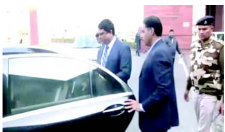
વેવેશેલા ભારતીય હાઈ કમિશનર પ્રણય વર્માએ બેંકક પછી કહ્યું હતું કે ઢાકા અને નવી દિલ્હી વચ્ચે સુરક્ષા માટે સરહદ પર વાડ બનાવવા અંગે સમજૂતી છે. અમારા બે બોર્ડર ગાર્ડ એન્ફોર્સમેન્ટ-BSF અને BGB (બોર્ડર સિક્યુરિટી ફોર્સ અને બોર્ડર ગાર્ડ બાંગ્લાદેશ) -આ સંદર્ભમાં વાતચીત કરી રહ્યા છે. અમને અપેક્ષા છે કે આ સમજૂતી લાગુ કરવામાં આવશે અને સરહદ પર ગુનાઓનો સામનો કરવા માટે સહકારી અભિગમ અપનાવવામાં આવશે.

તા. ૧૩ ભારત અને બાંગ્લાદેશ આ બંને દેશો વચ્ચે વધતા સરહદી તણાવ વચ્ચે સરકારે સોમવારે બાંગ્લાદેશના ડેપ્યુટી હાઈ કમિશનર નુરલ ઈસ્લામને સમન પાઠવ્યા છે. સમાચાર એજન્સી ANIના અહેવાલ મુજબ, વિદેશ મંત્રાલય દ્વારા સમન્સ પાઠવ્યા બાદ નુરલ ઈસ્લામ સાઉથ બ્લોકથી જતા જોવા મળ્યા હતા. ઢાકાએ ભારત-બાંગ્લાદેશ સરહદ પર પાંચ સ્થળોએ વાડ બાંધવાનો પ્રયાસ કરી રહ્યો હોવાનો આરોપ લગાવ્યા બાદ ભારત અને બાંગ્લાદેશ વચ્ચે સરહદી તણાવ વધી ગયો છે, કારણ કે આ દ્વિપક્ષીય કરારનું ઉલ્લંઘન કરે છે. બાંગ્લાદેશના ગૃહ બાબતોના સલાહકાર, લેફ્ટનન્ટ જનરલ (નિવૃત્ત) જહાંગીર આલમ ચૌધરીના જણાવ્યા અનુસાર, પાંચ વિસ્તારોમાં સંઘર્ષો ઉભા થયા છે, જેમાં (ઉત્તરપશ્ચિમ) ચાપૈનવાબાગંજ, નાઓગાંવ, લાલમોનિરહાટ અને ટીન બિથા કોરીડોરનો સમાવેશ થાય છે. ચૌધરીએ દાવો કર્યો હતો કે અગાઉની સરકાર દ્વારા હસ્તાક્ષર કરાયાલા કરારોને કારણે 'બાંગ્લાદેશ-ભારત સરહદ પર અનેક મુદ્દાઓ ઉભા થયા છે'. તેમણે પૂર્વ શેષ હસીનાના નેતૃત્વ હેઠળની સરકારની અસહમત કરારો પર હસ્તાક્ષર કરવા બદલ ટીકા કરી હતી, જેના કારણે ૨૦૧૭થી ૨૦૨૩ વચ્ચે ૧૬૦ સ્થળોએ વાડ બનાવવાના વિવાદ થયા હતા. રવિવારે બાંગ્લાદેશ વિદેશ મંત્રાલયમાં