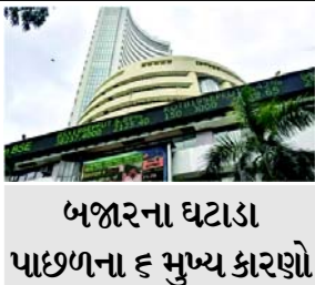
બજારના ઘટાડા પાછળના ૬ મુખ્ય કારણો

(એજન્સી) નવી દિલ્હી, તા. ૧૩ સોમવારે ભારતીય શેરબજારોમાં નોંધપાત્ર નુકસાન થયું કારણ કે, વૈશ્વિક આર્થિક અનિશ્ચિતાઓએ રોકાણકારોના સેન્ટિમેન્ટ પર ભાર મૂક્યો છે. બપોરના સત્ર સુધીમાં બંને બેન્ચમાર્ક સૂચકાંકો - BSE સેન્સેક્સ અને નિકેટી ૫૦ - લાલ રંગમાં ટ્રેડ કરી રહ્યા હતા. બજાર બંધ સમયે BSE સેન્સેક્સ ૧૦૪૮.૮૦ પોઈન્ટ અથવા ૧.૩૬ ટકા ઘટીને ૭૬.૩૩૦.૦૧ પર બંધ થયો હતો, જ્યારે નિકેટી ૫૦ ૩૧૪.૧૫ પોઈન્ટ અથવા ૧.૩૪ ટકા ઘટીને ૨૩,૧૧૦.૩૫ પર બંધ થયો હતો.