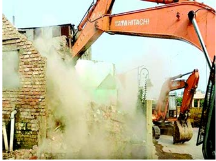
મકાનો જ્યાં તોડી પાડવામાં આવ્યા છે એ જગ્યા પર વાહનોના પાર્કિંગની સુવિધા ઉભી કરવામાં આવશે અને એક પ્રવચન હોલ બનાવવામાં આવશે. ૨૦૧૮માં યોજનાના ઉજ્જૈન સિંહસ્થ કુંભની તૈયારીઓના ભાગરૂપે આ ડિમોલિશન કરવામાં આવ્યું છે અને એ ખુલ્લી જગ્યા પર પ્રવચન હોલ અને વાહન પાર્કિંગ બનશે.

નવી દિલ્હી, તા. ૧૩ મધ્યપ્રદેશના ઉજ્જૈન જિલ્લામાં મહાકાલેશ્વર મંદિરના કોરીડોર પ્રોજેક્ટ માટે અને તેના વિસ્તરણ માટે તકિયા નામની એક મસ્જિદ અને ૨૫૭ જેટલા મકાનોનું ડિમોલિશન કરીને જગ્યા ખુલ્લી કરવામાં આવી હતી તેમ જાણવા મળ્યું છે. બારે મોટા પોલીસ બંદોબસ્ત વચ્ચે નિર્માણકામ કરવામાં આવે તેના માટે મસ્જિદનું ડિમોલિશન કરવામાં આવ્યું હતું ત્યારે વહીવટી તંત્રના મોટા અધિકારીઓ અને પોલીસ અધિકારીઓ સ્થળ પર હાજર રહ્યા હતા. પોલીસે એવું જણાવ્યું હતું કે અહીં રહેનારા લોકોને નોટિસો આપવામાં આવી હતી અને એમને વળતર પણ અપાયું છે. જો કે સંખ્યાબંધ રહેવાસીઓએ સ્પષ્ટતા કરી હતી કે એમને માત્ર ૨૪ કલાકની નોટિસ આપવામાં આવી હતી.