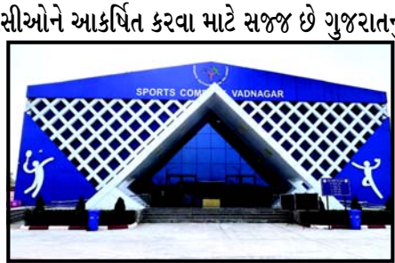
આનમાં રાષ્ટ્રીય વડનગરમાં વિવિધ પ્રવાસન આકર્ષણો તેમજ પ્રવાસી સુવિધાઓ વિકસિત કરવામાં આવી છે. આ ઉપરાંત, મહાદાર રાજ ગાઈને સંગીત સમ્રાટ તાનસેનાના દેહના દાહને શાતા આપનાર વડનગરની બે બહેનો તાના અને રીરીની સ્મૃતિમાં દર વર્ષે તાના-રીરી સંગીત મહોત્સવનું આયોજન કરવામાં આવે છે, જેની શરૂઆત પણ તલાલીન મુખ્યમંત્રી નરેન્દ્ર મોદીએ વર્ષ ૨૦૦૩માં કરાવી હતી. તાના-રીરી મહોત્સવ આજે વિશ્વ કક્ષાએ પ્રસિદ્ધિ પામ્યું છે, જેમાં દર વર્ષે શાસ્ત્રીય સંગીત સાથે સંકળાયેલા કલાકારોને 'તાના-રીરી' એવોર્ડ પણ આપવામાં આવે છે. આ સાથે જ વડનગર અને તેની આસપાસના વિસ્તારના લોકોને તળીબી સુવિધાઓ અને સારવાર માટે વડનગરમાં અદ્યતન હોસ્પિટલ પણ શરૂ કરવામાં આવી છે. ગુજરાતનું વડનગર શહેર પ્રવાસીઓ માટે આકર્ષણનું કેન્દ્ર બન્યું છે. હવે, કેન્દ્રીય ગૃહ મંત્રી અમિત શાહ વડનગરને ત્રણ નવા વિકાસકાર્યોની ભેટ આપવા જઈ રહ્યા છે. કેન્દ્રીય ગૃહમંત્રી અમિત શાહ વડનગરમાં નવનિર્મિત આર્કિયોલોજીકલ એક્સપેરિયન્સ મ્યુઝિયમનું ઉદ્ઘાટન કરશે. આ ભારતનું આ પ્રકારનું પ્રથમ મ્યુઝિયમ છે, જેને કેન્દ્રીય સંસ્કૃતિ મંત્રાલય દ્વારા રાજ્યના ડિરેક્ટોરેટ ઓફ આર્કિયોલોજી અને મ્યુઝિયમના સહયોગથી તૈયાર કરવામાં આવ્યું છે. આ મ્યુઝિયમનો ઉદ્દેશ્ય અહીં ખોદકામ દરમિયાન પ્રાપ્ત થયેલા પુરાતત્વીય પદાર્થો મારફતે વડનગરના બહુસ્તરીય સંસ્કૃતિક ઇતિહાસને ઉજાગર કરવાનો અને ૨૫૦૦ વર્ષથી પણ વધુ સમયથી આ શહેરમાં થતી રહેલી માનવ ઉત્કૃષ્ટિને પ્રદર્શિત કરવાનો છે. આ મ્યુઝિયમને પુલ મારફતે ખોદકામની લાઈવ સાઈટ સાથે જોડવામાં આવ્યું છે. ૨૮ કરોડના અંદાજિત ખર્ચે તૈયાર કરવામાં આવેલું આ ચાર માળનું મ્યુઝિયમ લગભગ ૧૨,૫૦૦ ચોરસ મીટર વિસ્તારમાં ફેલાયેલું છે. આ મ્યુઝિયમના મકાનમાં પુરાતત્વીય ખોદકામ દરમિયાન મળેલી ૫૦૦૦થી વધુ કલાકૃતિઓ પ્રદર્શિત કરવામાં આવી છે, જે વડનગરના ૨૫૦૦ વર્ષના ઇતિહાસ અને તેના પ્રાચીન જ્ઞાનના ભંડારને ઉજાગર કરે છે. ઓડિયો-વિઝ્યુઅલ ફિલ્મો અને પ્રદર્શનો સાથે, આ આર્કિયોલોજીકલ એક્સપેરિયન્સ મ્યુઝિયમ ઇતિહાસ અને સંસ્કૃતિના શોખીનો માટે એક ખાસ ભેટ છે. પ્રવાસીઓને વડનગરના પુરાતત્વીય ખોદકામમાંથી મળેલા અવશેષોનો અનુભવ પૂરો પાડવા માટે એક ક્રમશઃ શેડ બનાવવામાં આવ્યો છે તેમજ અન્ય પ્રવાસન સુવિધાઓ વિકસિત કરવામાં આવી છે. મ્યુઝિયમમાં વિવિધ સમયગાળાની કલાઓ, શિલ્પો અને આ વિસ્તારની ભાષાને પ્રદર્શિત કરતી લ થીમેટિક ગેલેરીઓ