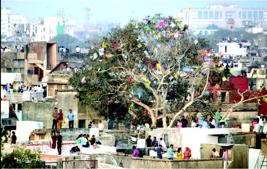
૧૫ જાન્યુઆરી, એટલે કે વાસી ઉત્તરાયણ. આ દિવસે પણ અમદાવાદ, રાજકોટ, વડોદરા અને સુરત સહિત રાજ્યભરમાં ઠેર-ઠેર પતંગરસિકો પતંગ ચગાવવા સવારથી ધાબે પહોંચી ગયા હતા. ક્યાંક લોકો પતંગને ચગાવવા માટે હુમકા મારી-મારીને થાકી ગયા તો ક્યાંક લોકોનો આરામથી બેસીને પવન આવવાની રાહ જોવી પડી હતી. કેટલાક લોકોની પતંગ ઝાડમાં ફસાઈ ગઈ હોય, 'પાંદડાનું ઝાડ' એ 'પતંગનું ઝાડ' બની ગયું તેવું તસવીરમાં નજરે પડે છે.