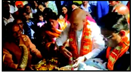
VIP અને ઉપસ્થિત લોકો હસી ઉઠવા હતા, જ્યારે જય શાહ ભણાવવામાં ચોકી ઉઠ્યા હતા. અમિત શાહે જયને જવાબાઓથી બચાવવાનો પ્રયાસ કર્યો. અમિત શાહે ટિપ્પણી કરતા કહ્યું, 'કહ્યું નહીં થાય, તારો કોઈ નવો નવાઈનો છોકરો છે' આ ટિપ્પણીથી

વાતાવરણે ઉત્સવમાં વિશેષ સ્પર્શ ઉમેર્યો હતો. ગુજરાત પ્રવાસના ભાગરૂપે, અમિત શાહે મકરસંક્રાંતિના શુભ અવસર પર વિવિધ વિકાસલક્ષી પહેલોમાં ભાગ લીધો હતો. જેમાં ગતરોજ ઉત્તરાયણ પરિવાર તથા કાર્યકરો સાથે મનાવવા બદ અમિત શાહે દેવવ્રતમાં સળંગ વિવિધ કાર્યક્રમો આટોપ્યા હતા. આરતી દરમિયાન અમિત શાહ અને જય શાહ વચ્ચેની નિખાલસ ળથ ટોક એક પ ટાઉન બની છે, જે મંત્રીની અન્યથા વિકાસ-કેન્દ્રિત મુલાકાતમાં વ્યક્તિગત સ્પર્ધા ઉમેરે છે. આ વિડીયોએ માત્ર નેટીજનસ જ નહીં પરંતુ અમિત શાહના જાહેર જીવનમાં કૌટુંબિક ઉભાને પણ પ્રકાશિત કરી છે.