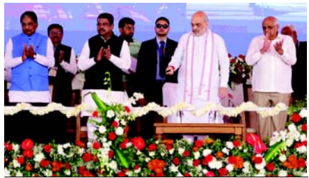
પ્રાચીન નગરીઓના ઇતિહાસને વડનગર સુવર્ણ અક્ષરે અંકિત કરશે : મુખ્યમંત્રી

ગાંધીનગર, તા. ૧૬ કેન્દ્રીય ગૃહમંત્રી અમિત શાહના હસ્તે વડનગરને વિવિધ વિકાસ કામોની ભેટ મળી હતી. આ પ્રસંગે કેન્દ્રીય મંત્રીએ વડપ્રધાનની વતનભૂમિ વડનગર સાથેની નિસ્ખલતનો ઉલ્લેખ કરી જણાવ્યું હતું કે, વડનગરના સંસ્કૃતિ અને વૈશ્વિક નેતા નરેન્દ્રભાઈ મોદીએ બાળપણમાં અનુભવેલી ગરીબીને કુશાભાવમાં બદલી નાખીને દેશના કરોડો ગરીબો, બાળકો, મહિલાઓ, ખેડૂતો, આદિવાસીઓ અને છેવાડાના માનવીના ઉદ્ધારનું પ્રેરણાબળ બનાવ્યું છે.