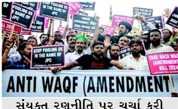
સંયુક્ત રણનીતિ પર ચર્ચા કરી

(એજન્સી) નવી દિલ્હી, તા. ૧૬ દલિતો, આદિવાસી જૂથો અને પછાત વર્ગોનું પ્રતિનિધિત્વ કરતા સંયુક્ત મંચ, ભારતી વિકાસ એલાયન્સ (BVA)ના નેતાઓએ કેન્દ્ર સરકાર દ્વારા પ્રસ્તાવિત વક્ક સુધારા બિલનો સખત વિરોધ કરવાનું વચન આપ્યું છે. ઓલ