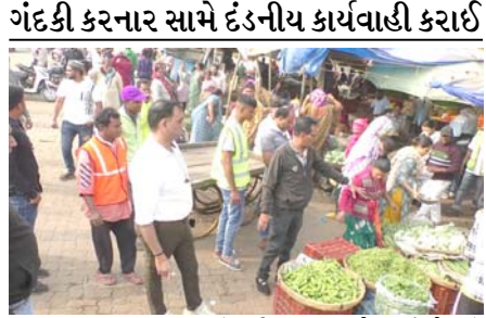
ગંદકી કરનાર સામે દંડનીય કાર્યવાહી કરાઈ

(સંવાદદાતા દ્વારા) અંકલેશ્વર, તા. ૧૭ અંકલેશ્વર નગરપાલિકા દ્વારા શહેરમાં ટ્રાફિકની સમસ્યા હળવી કરવા માટે અને ખાસ કરીને માર્ગને અડચણરૂપ દબાણ દૂર કરવાની કવાયત હાથ ધરવામાં આવી છે. શહેર પોલીસના બંદોબસ્ત સાથે સ્ટેશનથી ત્રણ રસ્તા શાકમાર્કેટ, મુલ્લાવાડ અને સુરતીભાગોળ સહિતના વિસ્તારોમાં કરાયેલા દબાણોને દૂર કરાયા હતા. અંકલેશ્વર નગરપાલિકા દ્વારા પુનઃ ટ્રાફિકને અડચણરૂપ દબાણો દૂર કરવાની કામગીરી હાથ ધરવામાં આવી હતી. શહેરના રેલવે સ્ટેશનથી ત્રણ રસ્તા સર્કલ, સરગમ કોમ્પ્લેક્સ સુધી અને પીરામણ નાકાથી સુરતી ભાગોળ, ગોયાબજાર, મુલ્લાવાડ સહિતના વિસ્તારોના મુખ્ય માર્ગો પરના શહેર એ ડિવિઝન પોલીસ મથકના પીઆઈ પી.જી.ચાવડા સહિત પોલીસની ટીમ અને