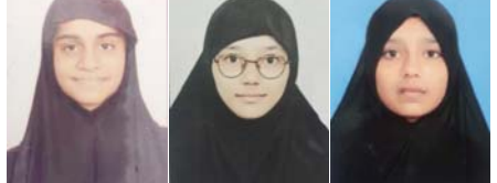
(સંવાદદાતા દ્વારા) નડિયાદ, તા. ૧૭

લોકહિત એજ્યુકેશન એન્ડ ચેરિટેબલ ટ્રસ્ટ કણજરી સંચાલિત જુલાઈ-૨૦૨૪થી નવી શરૂ થયેલ અમન કોમર્સ કોલેજ B.COM (ENG MED) નવેમ્બર-૨૦૨૪માં સરદાર પટેલ યુનિવર્સિટી વિદ્યાનગર સંલગ્ન લેવાયેલ B.COM (ફેકલ્ટી) સેમ-૧ની લેવાયેલ પરીક્ષામાં અમન કોમર્સ કોલેજ કણજરીનું ૯૯% ટકા પરિણામ આવ્યું છે જેમાં કોલેજની ત્રણ વિદ્યાર્થીનીઓએ ટોપ ટેનમાં