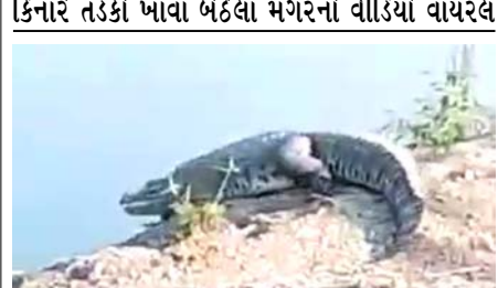
કિનારે તડકો ખાવા બેઠેલા મગરનો વીડિયો વાયરલ

(સંવાદદાતા દ્વારા) અંકલેશ્વર, તા. ૧૭ અંકલેશ્વર આંબોલી નજીક સી.આઈ.એસ.એફ કેમ્પ નજીક આમલાખાડીમાં મગરની હયાતી જોવા મળી હતી. નર્મદા નદીમાંથી આમલાખાડી પર આવેલ આંબોલી સી.આઈ.એસ.એફ કેમ્પ નજીક મગર પહોંચ્યા હોવાનું અનુમાન છે. ૨ વર્ષ પૂર્વે આંબોલી સીઆઈએસએફ કેમ્પ નજીક મગર દેખા દીધી હતી. કિનારે તડકો શેકાવા બેઠેલા મગરનો વીડિયો વાયરલ થતા ઘટના સામે આવી છે. અંકલેશ્વરમાં મગરની સંખ્યા દિવસે દિવસે વધી રહી છે. ભૂતકાળમાં અંકલેશ્વર જુના નેશનલ હાઈવે નંબર ૮ પર ભૂત મામા ડેરી પાસે ૨ મગરો ની હયાતી જોવા મળી હતી આ ઉપરાંત નર્મદા નદીમાં વિલિન થતી આમલાખાડીમાં જુના પુન ગામ નજીક, અમરાવતી