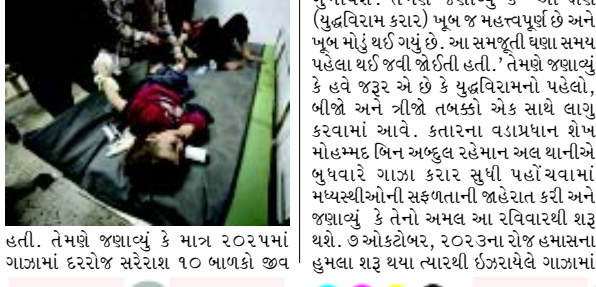
હતી. તેમણે જણાવ્યું કે માત્ર ૨૦૨૫માં ગાઝામાં દરરોજ સરેરાશ ૧૦ બાળકો જીવ

(એજન્સી) તા. ૧૮ યુનિસેફના પ્રવક્તાએ શુક્રવારે જણાવ્યું કે ગાઝા યુદ્ધવિરામ કરાર 'મહત્વપૂર્ણ અને લાંબા સમયથી બાકી' છે કારણ કે છેલ્લા ૧૪ મહિનામાં આ ક્ષેત્રમાં દરરોજ લગભગ ૩૫ બાળકો મૃત્યુ પામ્યા છે. જેમ્સ એલ્ડરે જિનીવામાં યુએન બ્રીફિંગમાં જણાવ્યું કે 'ધ લેન્સેટ'માં પીઅર-સમીક્ષા કરેલા અહેવાલમાં પેલેસ્ટીની આરોગ્ય મંત્રાલય દ્વારા નોંધવામાં આવેલા મૃત્યુની સંખ્યા વધુ છે, જેમાં ૧૫,૦૦૦થી વધુ બાળકો મૃત્યુ પામ્યા છે. તેમણે જણાવ્યું કે '૧૪ મહિનામાં દરરોજ લગભગ ૩૫ બાળકોની હત્યા કરવામાં આવી