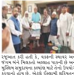
રજૂઆત કરી હતી કે, વક્કની સ્થાવર અને જંગમ બંને મિલકતો અલ્લાહ પાકની છે અને મુસ્લિમ સમુદાયના કલ્યાણ માટે તેનો ઉપયોગ કરવાનો હોય છે. એટલે ઈસ્લામી શરિયાતના

(એજન્સી) નવી દિલ્હી, તા. ૧૮ દેશના અગ્રણી મુસ્લિમ સંગઠનોએ વક્ક સુધારા ખરડાને ભયજનક રીતે પાછળ લઈ જતું પગલું ગણાવીને આ ખરડો પરત તાત્કાલિક પાછું ખેંચી લેવા જોરદાર માંગણી કરી છે. ઓલ ઈન્ડિયા મુસ્લિમ પર્સનલ લો બોર્ડ, જનીબત એ ઉલેમાએ હિન્દ, જમાત એ ઈસ્લામી હિન્દ અને અન્ય મુસ્લિમ સંસ્થાઓનું એક સંયુક્ત ડિવેલોપમેન્ટ આજે વક્ક ખરડા અંગેની JPCના ચેરમેનને મળ્યું હતું અને લેખિત રજૂઆત કરીને એવી દલીલ કરી હતી કે, સૂચિત વક્ક સુધારા ખરડો હકીકતો અને કાનૂની દૃષ્ટિએ ખોટો છે અને તેનાથી સુપ્રીમ કોર્ટના આદેશો તથા બંધારણીય અધિકારોનું ઉલ્લંઘન થાય છે. તેમણે