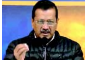
ફિલ્મમાં વર્ણન કરવામાં આવ્યું હતું એટલા માટે જ ભાજપને આ ફિલ્મથી ઈર લાગી ગયો. જે પ્રકારે આ પ્રસારણ અટકાવવામાં આવ્યું છે તેની હું નિંદા કરું છું અને આશા રાખું છું કે ફિલ્મના પ્રસારણ માટેની મંજૂરી આપવામાં આવશે. તેમણે કહ્યું હતું કે આ યૂટ્યૂબી કાર્યક્રમ નહોતો અને યૂટ્યૂબી સાથે તેને કોઈ લાગતું વળગતું નહોતું. અમે પોલીસને પણ એ સમજાવવાની કોશિશ કરી હતી. આ તો ગુંડાગીરી છે અને રીતસરની તાનાશાહી છે. દિલ્હી પોલીસે એવો પુલાસો કર્યો છે કે આ કાર્યક્રમ માટે પરવાનગી લેવામાં આવી નહોતી એટલે યૂટ્યૂબીને લગતી માર્ગદર્શિકાનો ભંગ થયો હતો. યૂટ્યૂબીનો સમય હોય ત્યારે કોઈ પણ આવો રાજકીય કાર્યક્રમ હોય એટલે જિલ્લા યૂટ્યૂબી અધિકારીની સિંગલ વિન્ડો સિસ્ટમ પાસેથી મંજૂરી લેવાની રહે છે અને એ જરૂરી છે. આ કાર્યક્રમ માટે આવી કોઈ મંજૂરી મેળવવામાં આવી નહોતી એટલે ગાઈડલાઈન્સનો ભંગ થયો હતો. અમે દરેક

(એજન્સી) નવી દિલ્હી, તા. ૧૮ આજે દિલ્હી પોલીસે આમ આદમી પાર્ટીની 'અનબ્રેકેબલ' શીર્ષક સાથેની એક ડોક્યુમેન્ટરીનું પ્રસારણ અટકાવી દીધું હતું અને કારણ એવું આખું હતું કે આ માટે જરૂરી પરવાનગી પહેલાથી લેવામાં આવી નહોતી. આમ આદમી પાર્ટીના વડા અરવિંદ કેજરીવાલે સ્પષ્ટતા કરી હતી કે આ કાર્યક્રમ ખાનગી હતો અને યૂટ્યૂબી પ્રચાર સાથે તેને કોઈ સંબંધ નહોતો. પત્રકાર પરિષદને સંબોધન કરતા કેજરીવાલે જણાવ્યું હતું કે આમ આદમી પાર્ટી વિશેની આ ટૂંકી દસ્તાવેજી ફિલ્મો બનાવવામાં આવી હતી અને તેનું પ્રસારણ કરવાનું હતું. આજે અમે પત્રકારો માટે ખાસ પ્રસારણ ગોઠવ્યું હતું પરંતુ સવારે જ દિલ્હીની પોલીસ સ્થળ પર પહોંચી ગઈ હતી અને ફિલ્મનું પ્રસારણ અટકાવી દીધું હતું. આ તો ખાનગી કાર્યક્રમ હતો અને યૂટ્યૂબી પ્રચાર માટે નહોતો. ત્યાં કોઈ યૂટ્યૂબી પ્રતીક નહોતું કે કોઈ વજર નહોતી કે યૂટ્યૂબી અંગેની કોઈ પ્રચારલક્ષી ભાષણબાજી પણ નહોતી કે કોઈ યૂટ્યૂબી પ્રચાર પણ કરવામાં આવનાર નહોતો કે થયો નહોતો છતાં ભાજપને આ ફિલ્મથી ઈર કેમ લાગ્યો? પત્રકારો માટે વ્યક્તિગત પોરણે આ પ્રસારણ ગોઠવવામાં આવનાર હતું. મેં પણ હજી ફિલ્મ જોઈ નથી પણ મને એવું કહેવામાં આવ્યું છે કે જ્યારે આપના નેતાઓને જેલમાં મોકલવામાં આવ્યા હતા અને ભાજપની સરકારે ગેરકાનૂની અને ગેરબંધારણીય પગલાં લીધા હતા તેનું આ