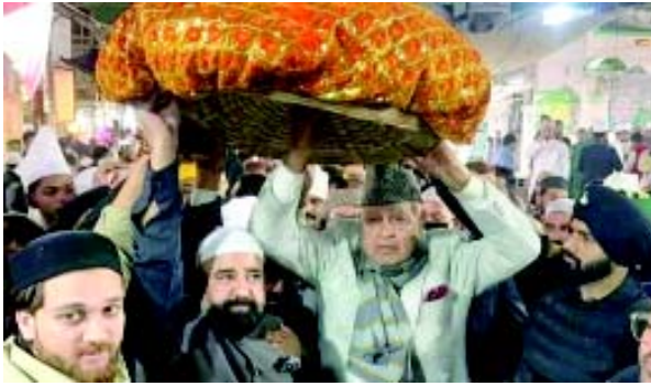
કોન્ફરન્સના ભાજપ સાથે સહયોગ અંગેની શક્યતા અંગે પૂછવામાં આવતા ડોક્ટર ફારુકે મક્કમ રીતે આ વિચાર ફગાવી દીધો હતો અને કહ્યું હતું કે આવું કદી થઈ શકે તેમ નથી કેમ કે જે લોકો નફરત ફેલાવી રહ્યા છે અમે તેની સાથે જોડાઈ શકીએ નહીં. કાશ્મીરના રાજેરીમા ફેલાઈ ગયેલી એક ભેદી બીમારીમાં ૧૫ લોકોનો મોત થયા છે એ બીમારી અંગે તેમણે કહ્યું હતું કે આ વાયરસ ક્યા પ્રકારનો છે તે શોધવાના પ્રયત્નો થઈ રહ્યા છે. દરમિયાન શુક્રવારે રાત્રે લગભગ ૧:૪૫ વાગ્યાનો સોમવારે રાજસ્થાનના ડોસા પાસે ડોક્ટર ફારુક અબ્દુલ્લાહના કાકલાની એક કારને અકસ્માત કર્યો હતો. એક નીલગાય અવાનક રસ્તા પર કારની સામે આવી ગઈ હતી અને કાર સાથે અથડાઈ હતી જેનાથી દિલ્હી પોલીસની એન્કોર્ટ કારને થોડું નુકસાન થયું હતું પણ સદનસીબે કોઈને ઈજા થઈ નહોતી.

(એજન્સી) જયપુર, તા. ૧૮ જમ્મુ અને કાશ્મીરના પૂર્વ મુખ્યમંત્રી ડોક્ટર ફારુક અબ્દુલ્લાહે આજે અજમેર શરીફ પહોંચીને ખ્વાજા સાહેબની દરગાહના દીદાર કર્યા હતા અને દેશભરમાં ભાઈચારો જળવાય તથા શાંતિ રહે એ માટે દુઆ કરી હતી. તેમણે દરગાહ શરીફની મુલાકાતથી અત્યંત આનંદની લાગણી વ્યક્ત કરી હતી અને એવી આશા દર્શાવી હતી કે જમ્મુ અને કાશ્મીરની પ્રજા પાછલા એક દાયકામાં સહન કરવા પડેલા પડકારોની ભાર આવી જશે અને તેને પહોંચી વળશે. તેમણે કહ્યું હતું કે પાશ્ચીની તકલીફ હોવાથી કાશ્મીરમાં ભરફ વર્ષા થાય એ જરૂરી છે એટલે મેં શાંતિ તથા વિકાસની સાથે સાથે કાશ્મીરમાં ભરફ વર્ષા માટે પણ દુઆ કરી. અમિનતા સેફ અલી ખાન ઉપર થયેલા હુમલાનો પણ તેમણે ઉલ્લેખ કર્યો હતો અને કહ્યું હતું કે આવા બધા બનાવો હવે સામાન્ય બની ગયા છે પણ સૈફ અલી ખાનનો જીવ બચી ગયો તેનાથી રાહત અનુભવતું હું અને તેઓ જલ્દી સાજા થાય એવી દુઆ કરું છું. તેમણે કહ્યું હતું કે આપણા દેશમાં આવા હુમલા થવા ના જોઈએ અને વધુ સુરક્ષિત હવામાનના સર્જનની જરૂર છે. નેશનલ