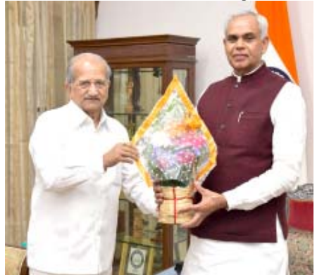
ગવર્નર આચાર્ય દેવવ્રતના જન્મ દિવસ નિમિત્તે સરકારના પૂર્વ મંત્રી ભૂપેન્દ્ર સિંહ યુગાસમાએ તેમની મુલાકાત લઈ અભિનંદન આપી શુભેચ્છા પાઠવી હતી.

ગવર્નરને જન્મદિવસની શુભેચ્છા આપવામાં આવ્યાં છે. ગવર્નર આચાર્ય દેવવ્રતના જન્મ દિવસ નિમિત્તે સરકારના પૂર્વ મંત્રી ભૂપેન્દ્ર સિંહ યુગાસમાએ તેમની મુલાકાત લઈ અભિનંદન આપી શુભેચ્છા પાઠવી હતી.