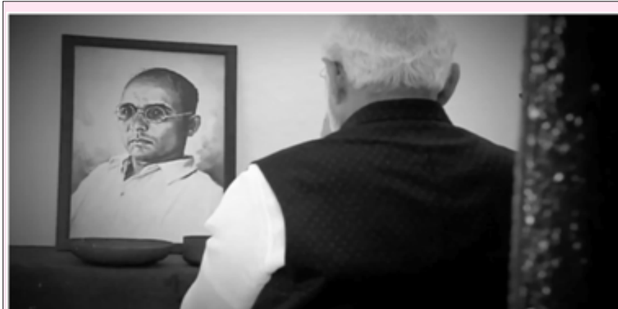
વડા પ્રધાન નરેન્દ્ર મોદી વી.ડી. સાવરકરને શ્રદ્ધાંજલિ અર્પણ કરે છે.

વડાપ્રધાન નરેન્દ્ર મોદી જે આપણા દેશના વડાપ્રધાન છે અને તેઓ સમગ્ર રાષ્ટ્રના વડા છે જે રાષ્ટ્રને પોતાના સંબોધનમાં વારંવાર વી.ડી. સાવરકરનું નામ લેતા હોય છે અને હવે તેમણે તાજેતરમાં દિલ્હી યુનિવર્સિટીમાં સાવરકરના નામ પર એક કોલેજનો પાયો નાખવાનો અવિશ્વાસનીય રેકોર્ડ સ્થાપિત કર્યો છે. તેમના તરફથી કરવામાં આવતા આવા કૃત્યો એ મહાત્મા ગાંધી, સરદાર વલ્લભભાઈ પટેલ, બી.આર. આંબેડકરના દષ્ટિકોણ અને સ્વતંત્રતા સંગ્રામના સિદ્ધાંતોનું અપમાન છે.