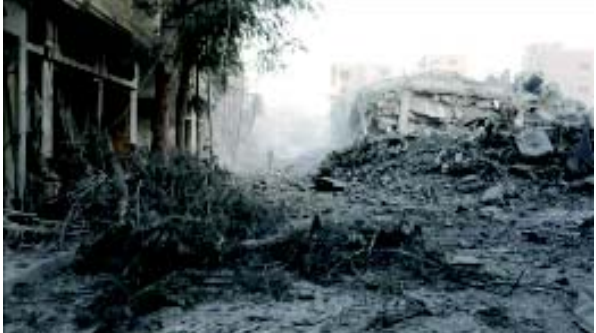
સંરક્ષણ મંત્રી યોવ ગાલાંટ સામે ધરપકડ વોરંટ જારી કર્યું છે. હવે, ઈઝરાયેલ અને હમાસ વચ્ચેના તાજેતરના યુદ્ધવિરામ કરારને પગલે, વૈશ્વિક ધ્યાન ગાઝાના પુન: નિર્માણના ભયાનક પડકાર તરફ વળ્યું છે. કરારનો ત્રીજો તબક્કો બહુવિધ દેશો અને સંગઠનોની દેખરેખ હેઠળ ગાઝાના પુન: નિર્માણને પ્રાથમિકતા આપે છે, અને નિષ્ણાતો ચેતવણી આપે છે કે આગળનો રસ્તો જટિલ અવરોધોથી ભરેલો છે-કાટમાળ દૂર કરવાના પ્રોજેક્ટિલ દુ:સ્વપ્નથી લઈને પુન: નિર્માણના વ્યયના ટકાવીય ભોજ સુધી બોજ માત્ર ૩૬૦ ચોરસ કિલોમીટર (૧૩૯ ચોરસ માઈલ)માં આવી રહેલી, ગાઝા પટ્ટીએ વિશ્વની સૌથી વિનાશક યુદ્ધ સમયની કેટલીક ઘટનાઓની યાદો જગાડી છે, જેમ કે બીજા વિશ્વયુદ્ધમાં ડ્રેસન પર બોમ્બ વિસ્ફોટ અથવા હિરોશિમા અને નાગાસાકી પર અણુ વિસ્ફોટ થવાનું. સપ્ટેમ્બરમાં યુનાઈટેડ નેશન્સ સેટેલાઈટ સેન્ટર (UNOSAT) દ્વારા લાય ભયાનક પડકાર તરફ વળ્યું છે.

(એજન્સી) તા. ૧૮ ઈઝરાયેલના ચાલુ લશ્કરી હુમલાને કારણે ગાઝા પટ્ટી ખંડેર બની ગઈ હોવાથી, પેલેસ્ટિનિયન પ્રદેશના પુન: નિર્માણનું કાર્ય આધુનિક ઇતિહાસમાં સૌથી મુશ્કેલ પુનર્નિર્માણ પ્રયત્નોમાંનું એક હશે. ૭ ઓક્ટોબર ૨૦૨૩થી, સતત ઈઝરાયેલી હવાઈ હુમલાઓ અને બોમ્બારો ગાઝાના ઈન્ફ્રાસ્ટ્રક્ચરનો નાશ કરે છે, જેના કારણે તેના ૨.૩ મિલિયન રહેવાસીઓને ભયાનક વેદના અને વિનાશનો સામનો કરવો પડ્યો છે. ઈઝરાયેલી દળોએ ૧૫૭,૦૦૦થી વધુ પેલેસ્ટિનિયનોને મારી નાખ્યા અથવા ઘાયલ કર્યા, જેમાં મોટાભાગની મહિલાઓ અને બાળકો હતા, અને હજારો ઘરો, શાળાઓ અને હોસ્પિટલોને કાટમાળમાં ઘટાડી દીધા. ઈઝરાયેલ આંતરરાષ્ટ્રીય ન્યાય અદાલતમાં નરસંહારના કેસનો સામનો કરી રહ્યું છે, જ્યારે આંતરરાષ્ટ્રીય ફોજદારી અદાલત તેના વડા પ્રધાન બેન્જામિન નેતન્યાહુ અને ભૂતપૂર્વ