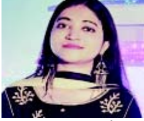
જ્યાં તેણીએ સિવિલ સર્વિસમાં જોડાવાની પોતાની મહત્વાકાંક્ષાને પૂર્ણ

(એજન્સી) નવી દિલ્હી, તા. ૧૮ ૨૦૨૧ બેચની IAS અધિકારી થેતા ભારતી બિહારના નાલંદા જિલ્લાના રાજગીર બજારની રહેવાસી છે. તે એક સામાન્ય પરિવારમાંથી આવે છે અને તેણે પટનાની ઈશાન ઈન્ટરનેશનલ પબ્લિક સ્કૂલમાંથી પોતાનું શિક્ષણ પૂર્ણ કર્યું છે. ૧૨મું ધોરણ પૂર્ણ કર્યા પછી, થેતાએ ભાગલપુર એન્જિનિયરિંગ કોલેજમાંથી ઈલેક્ટ્રિકલ અને ટેલિકોમ્યુનિકેશન એન્જિનિયરિંગમાં સ્નાતકની પદવી મેળવી. અનુસ્નાતક થયા પછી, થેતાએ પ્રખ્યાત કંપની વિપ્રોમાં નોકરી મેળવી,