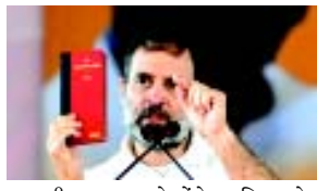
ગણતરી કરાવવા માટે કોંગ્રેસ કટિબદ્ધ છે. આ પ્રકારના સર્વેણ અને ગણતરીથી એમની વસ્તી કેટલી છે અને લોકશાહીમાં તેમજ શિક્ષણ સંસ્થાઓમાં અને ખાનગી કંપનીઓમાં એમને કેટલું સ્થાન મળ્યું છે તેનો ખ્યાલ આવી જશે. તેમણે ઉમેર્યું હતું કે તેમની વસ્તીના આધારે અને એમની સામાજિક તથા આર્થિક હાલતના આધારે વિકાસની નીતિઓનું ઘડતર કરવામાં આવશે. કોંગ્રેસ નેતાએ આક્ષેપ કર્યો હતો કે દેશની સંપત્તિ કેટલાક મુશ્કેલ લોકોના હાથમાં જ કેદ થઈ ગઈ છે અને ગરીબો અને કિસાનો અત્યંત દયાજનક હાલતમાં જીવી રહ્યા છે. ખાનગી ક્ષેત્રમાં તો દલિત તથા આદિવાસી અને પછાત વર્ગોનું નામનું જ અસ્તિત્વ છે એ વિશે ચિંતા વ્યક્ત કરતા તેમણે કહ્યું હતું કે તમે ૫૦૦ ખાનગી કંપનીઓની યાદી જુઓ તો તમને આ શ્રેણીના સમુદાયની કોઈપણ કંપની

રાહુલ ગાંધીએ આક્ષેપ કર્યો હતો કે કેન્દ્ર ખાતેની મોટી સરકાર બંધારણને બદલવાના પ્રયાસો કરી રહી છે પણ તેઓ બંધારણની નકલો માથા પર લઈને આવ્યા અને લોકોએ એમને અરીસો બતાવ્યો છે (એજન્સી) પટણા, તા. ૧૮ લોકસભા વિરોધ પક્ષના નેતા અને કોંગ્રેસના અગ્રણી રાહુલ ગાંધીએ પટણા ખાતે કાર્યકર્તા સંમેલનને સંબોધન કરતા જણાવ્યું હતું કે બિહારમાં થયેલો જાતિ સર્વે બનાવટી છે અને દેશવ્યાપી જાતિ આધારિત વસ્તી ગણતરી કરવાની જરૂર છે. તેમણે ગંભીર આક્ષેપ કર્યો હતો કે બિહારમાં જે કહેવાતો જાતિ આધારિત સર્વે થયો છે એ બનાવટી છે અને ખોટો છે. તેઓ પટણામાં બંધારણ બચાવો કોન્ફરન્સમાં કોંગ્રેસના કાર્યકરોને સંબોધન કરી રહ્યા હતા અને રાષ્ટ્રવ્યાપી જાતિ આધારિત વસ્તી ગણતરીની જરૂરિયાત પર ભાર મૂક્યો હતો. રાહુલે કહ્યું હતું કે અમને રાજકીય નુકસાન થાય તો પણ અમે જાતિ આધારિત વસ્તી ગણતરી કરાવશો જ અને બિહારમાં થયેલો પ્રકારનો સર્વે નહીં હોય. બિહારમાં તો જાતિ આધારિત સર્વેના નામે રાજ્યની જનતાને મૂંઝવે બનાવવામાં આવી છે. તેમણે બિહારમાં ૨૦૨૨ તથા ૨૩ માં થયેલા જાતિ સર્વેનો ઉલ્લેખ કર્યો હતો. તેમણે કહ્યું હતું કે, દેશના દલિત વર્ગ તથા પછાત વર્ગ તેમજ આદિવાસીઓ અને લઘુમતી સમુદાયોના હિતમાં અને દેશથી પ્રજાના વ્યાપક હિતમાં જાતિ આધારિત વસ્તી