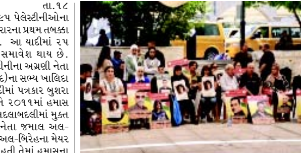
પ્રયત્નોનું સંકલન' કરવાની ખાતરી કરી. દિવસની શરૂઆતમાં, ઈઝરાયેલના વડા પ્રધાન બેન્જામિન નેતન્યાહુના કાર્યાલયે જણાવ્યું કે સુરક્ષા કેબિનેટે કેદીઓની વિનિમય અને યુદ્ધવિરામ કરારને મંજૂરી આપી છે. કતારે બુધવારે ગાઝા પહીં પર ઈઝરાયેલના ૧૫ મહિનાથી વધુના હુમલાઓને સમાપ્ત કરવા માટે ત્રણ તબક્કાના કરારની જાહેરાત કરી હતી. આ હુમલાઓમાં અંદાજે ૪૭,૦૦૦ લોકો મૃત્યુ પામ્યા છે અને પ્રદેશને ભરબાદ થઈ ગયો છે. ઈન્ટરનેશનલ ક્રિમિનલ કોર્ટ નવેમ્બરમાં નેતન્યાહુ અને તેમના પૂર્વ સંરક્ષણ મંત્રી યોવ ગાલાંટ માટે ગાઝામાં યુદ્ધ અપરાધો અને માનવાત્મક વિરૂદ્ધના ગુનાઓ માટે ધરપકડ વોરંટ જારી કર્યું હતું. ઈઝરાયેલને ઈફ્ફલેવ પર્ના યુદ્ધ માટે ઈન્ટરનેશનલ કોર્ટ ઓફ જસ્ટિસમાં નરસંહારના કેસનો પણ સામનો કરવો પડી રહ્યો છે.

(એજન્સી) તા. ૧૮ ઈઝરાયેલના ન્યાય મંત્રાલયે શુક્રવારે ૯૫ પેલેસ્ટીનીઓના નામ જાહેર કર્યા છે જેમને ગાઝા યુદ્ધવિરામ કરારના પ્રથમ તબક્કા હેઠળ રવિવારે મુક્ત કરવામાં આવનાર છે. આ યાદીમાં ૨૫ વર્ષ સુધીની મહિલાઓ અને યુવાનોનો સમાવેશ થાય છે. પોપ્યુલર ફ્રન્ટ ફોર ડિલિવરેશન ઓફ પેલેસ્ટીનીના અગ્રણી નેતા અને પેલેસ્ટીની લેજિસ્લેટિવ કાઉન્સિલ (સંસદ)ના સભ્ય ખાલિદા જરાનું નામ પણ આ યાદીમાં છે. આ યાદીમાં પત્રકાર બુશરા અલ-તલીલનો પણ સમાવેશ થાય છે, જેમને ૨૦૧૧માં હમાસ અને ઈઝરાયેલ વચ્ચે અગાઉના કેદીઓની અદલાબદલીમાં મુક્ત કરવામાં આવ્યા હતા. તે વરિષ્ઠ હમાસ નેતા જમાલ અલ-તાલીલની પુત્રી છે, જેઓ વેસ્ટ બેંકના શહેર અલ-બિરહના મેયર હતા. જે મહિલાઓને મુક્ત કરવામાં આવી હતી તેમાં હમાસના ડેપ્યુટી લીડર સાલેહ અલ-અરોરીની બહેન દલાલ અલ-અરોરીનો સમાવેશ થાય છે, જેની ગયા વર્ષે જાન્યુઆરીમાં ઈઝરાયેલ દ્વારા હત્યા કરવામાં આવી હતી. દરમિયાન, હમાસમાં શહીદ અને કેદીઓના કાર્યાલયના વડા ઝહીર જબરીન, શુક્રવારે ગાઝા યુદ્ધવિરામ અને કેદીઓની અદલાબદલી કરારમાં વિકાસ અંગે ચર્ચા કરવા માટે કેદીઓ અને પૂર્વ કેદીઓની બાબતોની સત્તાના વડા કદોરા ફારેસ સાથે મળ્યા હતા. ઈઝરાયેલની જેલોમાંથી આવી હતી. હમાસ સમુહના એક નિવેદન અનુસાર, બંનેએ 'સંયુક્ત સમિતિઓ દ્વારા સતત વાતચીત' અને 'કેદીઓના હિતોની સેવા કરવા અને કેદીઓના વિનિમય કરારને અંતિમ સ્વરૂપ આપવા માટેના તમામ અવરોધોને દૂર કરવા માટેના