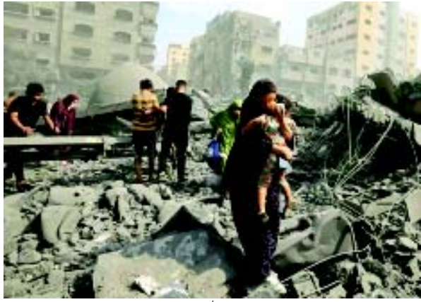
માનવામાં આવે છે. એક રિપોર્ટ પ્રમાણે, ૨૪-૮ વોટથી કેબિનેટે ફેસલાને મંજૂરી આપી હતી, જેનો અમલ રવિવારથી થશે. આ સમજૂતી ગાઝામાં યુદ્ધ વિરામના પહેલા તબક્કાની શરૂઆત કરશે અને ઈઝરાયેલના બંધકો અને પેલેસ્ટીનીના કેદીઓ બંનેની મુક્તિ કરાવશે. આ સંઘર્ષ વિરામ ત્રણ તબક્કામાં લાગુ થશે. પ્રથમ તબક્કામાં ઈઝરાયેલના ૩૩ બંધકોને

(એજન્સી) તા. ૧૮ કતારના વિદેશ મંત્રાલયે શનિવારે જણાવ્યું હતું કે હમાસ અને ઈઝરાયેલ વચ્ચે ૨૪ કલાકથી ઓછા સમયમાં યુદ્ધવિરામ અમલમાં આવશે. X પરની એક પોસ્ટમાં, વિદેશ પ્રધાન મોજીબ અલ-અસારીએ જણાવ્યું હતું કે યુદ્ધવિરામ રવિવારે સવારે ૮:૩૦ વાગ્યે (૬:૩૦ GMT) શરૂ થશે અને લોકોને સાવચેતી રાખવા અને અધિકારીઓના નિર્દેશોની રાહ જોવાની સલાહ આપી. શનિવારે સવારે, ઈઝરાયેલી કેબિનેટે ગાઝામાં યુદ્ધવિરામ માટેના સોદાને મંજૂરી આપી હતી જે ડગનબંધ બંધકોને મુક્ત કરશે અને હમાસ સાથેના ૧૫ મહિનાથી ચાલતા યુદ્ધનો અંત લાવશે, જેમાં બંને પક્ષો તેમના સૌથી ઘાતક અને સૌથી વધુ હિંસક અથડામણો બાદ વિનાશક યુદ્ધનો અંત લાવવાની એક ડગલું નજીક આવશે. ગાઝામાં છેલ્લા ૧૫ મહિનાથી ચાલી રહેલા હમાસ અને ઈઝરાયેલ વચ્ચેનું યુદ્ધ લગભગ સમાપ્ત થઈ ગયું છે. ઈઝરાયેલની સરકારે હમાસ સાથે યુદ્ધવિરામ અને બંધકોની મુક્તિ માટે સમજૂતીને કેબિનેટે શનિવારે મંજૂરી આપી હતી. અમેરિકાના રાષ્ટ્રપતિ તરીકે ડોનાલ્ડ ટ્રમ્પે કાર્યભાર સંભાળે તે પહેલા જ આવેલા આ સમાચારને ખૂબ સૂચક