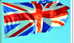
નાટકીય ઘટાટો બ્રિટન દ્વારા એશિયાન કાપડ સામે કડક સંરક્ષણવાદી નીતિઓના અમલીકરણને કારણે હોઈ શકે છે, જેણે ભારતની ઔદ્યોગિક વિકાસ શક્તિને વ્યવસ્થિત રીતે નબળી પાડી હતી. ઓક્સફર્મે જણાવ્યું હતું કે વસાહતીવાદ ખાનગી બહુરાષ્ટ્રીય કંપનીઓ દ્વારા સંચાલિત હતો, જેમને ઘણીવાર એકાધિકાર આપવામાં આવતો હતો અને તેઓ વિદેશી વિસ્તરણમાંથી જંગી નફો કમાતા હતા. ભારતમાં ઈસ્ટ ઈન્ડિયા કંપનીની સેનામાં કુલ ૨૬૦,૦૦૦ સૈનિકો હતા જે બ્રિટિશ શાંતિ સમયની સેના કરતા બમણા હતા. તેઓ જમીન કબજે કરવા, હિંસા કરવા અને વિલીનીકરણ અને સંપાદન કરતાં હતા, વૈશ્વિકરણને આગળ ધપાવ્યું અને વિશ્વની પ્રથમ વૈશ્વિક નાણાકીય વ્યવસ્થાના નિર્માણમાં ફાળો આપ્યો હતો. ૧૮૩૦થી ૧૯૨૨ સુધી ૩૭ લાખ ભારતીય, ચીની, આફ્રિકન, જાપાની, મેલાનેશિયન અને અન્ય લોકોને વસાહતી વાવેતરો અને ખાણોમાં કામ કરવા અને કારખાનું મજૂરો તરીકે માળખાગત સુવિધાઓ સ્થાપિત કરવા માટે પરિવહન કરવામાં આવ્યા હતા. અહેવાલમાં વધુમાં નોંધવામાં આવ્યું છે કે ૧૮૭૫માં ભારતમાં સૌથી વધુ કમાણી કરનારા લોકો મુખ્યત્વે સૈન્ય અને વહીવટના યુરોપિયન અધિકારીઓ હતા, પરંતુ ૧૯૪૦ સુધીમાં તેઓ મુખ્યત્વે વેપારીઓ, બેંકરો અને ઉદ્યોગપતિઓ હતા. સ્વતંત્રતા પછી ગ્લોબલ સાઉથના ઘણા દેશોમાં સંપત્તિ અને રાજકીય શક્તિ સૌથી ધનિક લોકોમાં કેન્દ્રિત રહી હતી. આજે આ દેશો જે અસમાનતાનો અનુભવ કરે છે તે નોંધપાત્ર રીતે વસાહતી નિર્માણનું પરિણામ છે. વસાહતીવાદના ચાલુ પ્રભાવ અંગે ઓક્સફર્મે જણાવ્યું હતું કે ભારતની માત્ર ૦.૧૪ ટકા માતૃભાષાનો ઉપયોગ શિક્ષણના માધ્યમ તરીકે થાય છે અને ૦.૩૫ ટકા ભાષાઓ તેની શાળાઓમાં શીખવવામાં આવે છે. ઓક્સફર્મે વધુમાં જણાવ્યું હતું કે ઐતિહાસિક વસાહતી સમયગાળા દરમિયાન જાતિ, ધર્મ, લિંગ, જાતિયતા, ભાષા અને ભૂગોળ સહિત અનેક અન્ય વિભાગોનો વિસ્તાર અને શોષણ, સંકલન અને સંયોજન કરવામાં આવ્યું હતું. બ્રિટિશ વસાહતી સમયગાળા દરમિયાન ભારતમાં, જાતિ વ્યવસ્થાને કાનૂની અને વહીવટી પગલાં દ્વારા ઔપચારિક બનાવવામાં આવી હતી. ઓક્સફર્મે જણાવ્યું હતું કે, જ્યારે દુનિયા આંતરરાષ્ટ્રીય કોલોનિયલ ફાઇનાન્સિયલ કોર્પોરેશન દ્વારા આપવામાં આવેલી વધુ હતું અને મીઈ અને જમીન કર પછી તે બ્રિટિશ રાજનો સૌથી મોટો આવક સ્ત્રોત હતો. આ પેટન્ટ કંપનીએ દાવો કર્યો હતો કે તેની પેટન્ટ એક અનોખી શોધનું ઉત્પાદન છે, ત્યારે ઓક્સફર્મે જણાવ્યું હતું કે ભારતના પ્રામીણ ખેડૂતો દ્વારા ૨,૦૦૦ વર્ષથી વધુ સમયથી જંતુનાશક, સાબુ અને ગર્ભનિરોધકમાં લીમડાના અર્કનો ઉપયોગ કરવામાં આવે છે. યુરોપિયન પેટન્ટ ઓફિસના ડેક્રીમાં આ એક અપીલ ૧૦ વર્ષની કાનૂની કાર્યવાહી પછી આ પેટન્ટ ૨૬ કરી દીધી હતી. ઓક્સફર્મે જણાવ્યું હતું કે વસાહતી યુગમાં શરૂ થયેલા અસ્થિભૂત ઈંધણનું વિશાળ શોષણ આજે પણ ચાલુ છે, જેના કારણે વિશ્વ આબોહવા બંગાળના આરે પહોંચી ગયું છે. આ અહેવાલમાં વસાહતી શક્તિઓએ ઓટોમો સમ્રાજ્ય અને ભારતને કેવી રીતે વિભાજિત કર્યા તે વિશે પણ વાત કરવામાં આવી હતી. તેમાં અભ્યાસોનો ઉલ્લેખ કરવામાં આવ્યો હતો કે ૧૮૮૧થી ૧૯૨૦ દરમિયાન બ્રિટિશ શાસન હેઠળ ૧.૮ કરોડ મૃત્યુ થયા હતા. બીજા વિશ્વયુદ્ધ દરમિયાન અનાજની આયાત પર પ્રતિબંધો, જે જાતિવાદી વિચારસરણી દ્વારા આધારભૂત હતા, તે ૧૯૪૩માં બંગાળ દુષ્કાળમાં નોંધપાત્ર ફાળો આપ્યો હતો અથવા તેનું કારણ બન્યું હતું નોંધવામાં આવ્યું છે, જેમાં હાલના ભારત અને બાંગ્લાદેશમાં અંદાજે ૩૦ લાખ લોકોનો જીવ ગયો હતો. ઓક્સફર્મે જણાવ્યું હતું કે એવું સૂચવવામાં આવ્યું છે કે આ વસ્તીમાં સ્થૂળતા અને ટાઇપ ૨ ડાયાબિટીસનો ઊંચો દર વસાહતી સમયગાળા દરમિયાન ભૂખમરના ચક્રમાં મેટાબોલિક અનુકૂળનનું પરિણામ છે. ઓક્સફર્મે જણાવ્યું હતું કે ગ્લોબલ નોર્થ વૈશ્વિક સંસ્થાઓમાં ઔપચારિક દૈનિક સમાન દરજ્જો ધરાવે છે અને પ્રભુત્વ જાળવી રાખે છે. WTO ઐતિહાસિક રીતે ગ્લોબલ સાઉથના હિતોને સંબોધવામાં નિષ્ફળ ગયો હોવાનો આરોપ લગાવતા, ઓક્સફર્મે જણાવ્યું હતું કે આ ફક્ત ઉત્તરીય દેશોને જ નહીં પરંતુ ગ્લોબલ નોર્થમાં સ્થિત કોર્પોરેશનોને પણ મદદ કરે છે, જેમ કે COVID-૧૯ રોગચાળા દરમિયાન હતું જ્યારે જીવનરક્ષક સ્ત્રીઓ, સારવાર અને અન્ય તકનીકો પર બૌદ્ધિક સંપદા પ્રતિબંધોને સંપૂર્ણ માફ કરવા માટે WTO આરે દક્ષિણ આફ્રિકા અને ભારતીય દરખાસ્તને ૧૦૦થી વધુ દેશોએ ટેકો આપ્યો હતો પરંતુ સમુદ્ર રાષ્ટ્રોએ સફળતાપૂર્વક વિરોધ કર્યો હતો. વિશ્વ બંધ અને ઘણી યુરોપિયન વિકાસ નાણાકીય સંસ્થાઓ, ગ્લોબલ નોર્થમાં ખાનગી મૂડી અને રોકાણ ભંગોળ સાથે ભાગીદારીમાં, ગ્લોબલ સાઉથમાં જાહેર સેવાઓના આ ખાનગીકરણ અને નાણાકીયકરણને પ્રોત્સાહન આપી રહી છે. ઓક્સફર્મે દાવો કર્યો હતો કે વિશ્વ બેંકના ઈન્ટરનેશનલ ફાઇનાન્સ પ્રોવિઝન (IFC)એ ભારતના શહેરી કેન્દ્રોમાં ઉચ્ચ ક્ષાત્રી ખાનગી હોસ્પિટલોના નાણાં પૂરા પાડ્યાં છે, જે એક એવો દેશ છે જ્યાં ૩૭ ટકા ભારતીયો ખાનગી હોસ્પિટલોમાં અતિશય આરોગ્ય ખર્ચ ભોગવે છે અને તે માનવ અધિકારોનું સ્થાનિક ઉલ્લંઘન છે. વસાહતી અસમાનતા જાળવવામાં લશ્કરી શક્તિની ભૂમિકા અને ઓક્સફર્મે જણાવ્યું હતું કે ઈસ્ટ ઈન્ડિયા કંપનીના શાસનના દરમિયાન ભારતમાં, લશ્કરી ખર્ચ લગભગ ૭૫ ટકા હતો જ્યારે જાહેર કરો ચોરસ માત્ર ૩ ટકા હતા. તેમાં સત્તાવાળાઓ સિંચાઈ પ્રણાલીઓમાં નિષ્ફળ ગયા, જેના કારણે કૃષિ ઉત્પાદકતામાં ઘટાટો થયો અને દુષ્કાળ વધુ તીવ્ર બન્યો અને આધુનિક સમયમાં પણ ચાલુ રહ્યો છે.