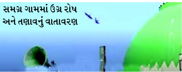
સમગ્ર ગામમાં ઉગ્ર રોષ અને તણાવનું વાતાવરણ

(એજન્સી) બરેલીશરીફ, તા. ૨૧ ઉત્તરપ્રદેશના બરેલી જિલ્લામાં બહેલી પ્રાંતમાં આવેલા જામ સાવંત શુમાલી ગામમાં આવેલી એક કામચલાઉ ઉભી કરાયેલી નાનકડી મસ્જિદમાં જુમ્માની નમાઝ માટે મુસ્લિમો ભેગા થતા એક હિન્દુ સંગઠને વાંધો લીધો હતો. હિન્દુ જૂથની ફરિયાદ પરથી પોલીસે તુરંત કાર્યવાહી કરી હતી. પતરાના છાપરાવાળી ખાનગી માલિકીની જગ્યામાં નમાઝ પઢવા બદલ ચાર મુસ્લિમોની પોલીસે ધરપકડ કરી હતી. જેના પગલે સમગ્ર ગામમાં ભારે તંગદિલી પ્રસરી ગઈ છે અને મુસ્લિમ સમાજમાં રોષ ફેલાયેલો છે.