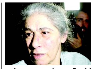
જરાર, જેને વહીવટી અટકાયત હેઠળ રાખવામાં આવ્યા હતા, તેમને ડિસેમ્બર ૨૦૨૩માં મુક્ત કરવામાં આવ્યા હતા. ગાઝામાં પેલેસ્ટીની સમૂહ હમાસ દ્વારા બંધક બનાવવામાં આવેલી ત્રણ મહિલા ઈઝરાયેલીઓને મુક્ત કરવામાં આવી ત્યારે આ બન્યું. વહીવટી અટકાયત એ એક નીતિ છે જે ઈઝરાયેલી સત્તાવાળાઓને

(એજન્સી) તા.૨૨ મુક્ત કરાયેલા પેલેસ્ટીની નેતા, રાજકારણી અને કાર્યકર્તા ખાલિદા જરારે જણાવ્યું કે ઈઝરાયેલ સત્તાવાળાઓ પેલેસ્ટીની કેદીઓ સાથે માણસ જેવો વ્યવહાર કરતા નથી. તેમણે જેલની સ્થિતિને '૧૯૬૭માં વેસ્ટ બેંકના કબજા પછીની સૌથી ખરાબ અને મુશ્કેલ' ગણાવી છે. સોમવારે સવારે, ઈઝરાયેલે યુદ્ધવિરામ અને કેદીઓની અદલાબદલી કરાર હેઠળ ૮૦ પેલેસ્ટીની કેદીઓને મુક્ત કર્યાં, જેણે ગાઝા પટ્ટી પરના તેના નરસંહાર યુદ્ધને સ્થગિત કર્યું, જેમાં ૭ ઓક્ટોબર, ૨૦૨૩ સુધીમાં ૪૭,૦૦૦થી વધુ લોકો મૃત્યુ પામ્યા. આ વિસ્તાર પર કબજો કર્યો અને બરબાદ કરી નાખ્યો.