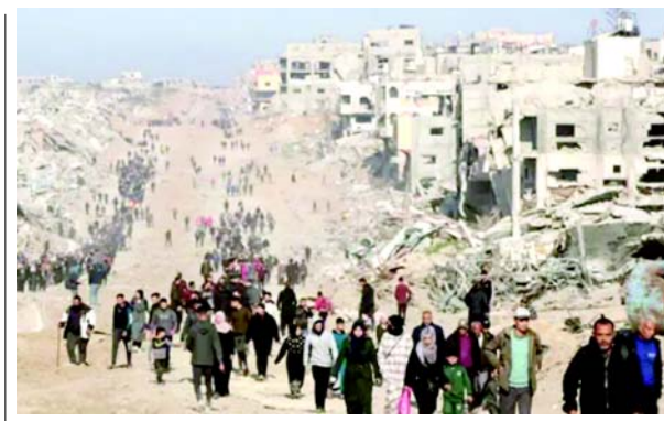
રહેવાની સ્થિતિમાં સુધારો કરવો અને આશા પૂરી પાડવી મહત્વપૂર્ણ છે, કારણ કે આમ કરવામાં નિષ્ફળતા વધુ અશાંતિ તરફ દોરી શકે છે. આ સોદો કરવા માટે ઈઝરાયેલી વડાપ્રધાન બેન્જામિન નેતન્યાહુ સાથે વિટકોફની ચર્ચાઓ મહત્વપૂર્ણ હતી, એક યુએસ અધિકારીએ નેતન્યાહુને કહ્યું હતું કે, 'જો તમે સોદો કરવા તૈયાર નથી, તો મને જણાવો, અને હું વિમાનમાં બેસીશ અને હું ઘરે જતો રહીશ.' વિટકોફે રાષ્ટ્રપતિ ટ્રમ્પના તેમના પ્રથમ કાર્યકાળ દરમિયાન બેન્જામિન નેતન્યાહુ સાથે સમર્થન પર ભાર મૂક્યો હતો.

(એજન્સી) તા.૨૨ અમેરિકાના ચૂંટાયેલા રાષ્ટ્રપતિ ડોનાલ્ડ ટ્રમ્પની ટીમ ચાલુ સંઘર્ષ દરમિયાન નુકસાન પામેલા ઘરોના પુનર્નિર્માણને સરળ બનાવવા માટે 'કામચલાઉ' ધોરણે ગાઝાથી કેટલાક પેલેસ્ટિનિયનોને ઈન્ડોનેશિયા ખસેડવાનું વિચારી રહી છે. મિડલ ઈસ્ટ મોનિટરે NBCને ટાંકીને જણાવ્યું હતું કે આ યોજના ગાઝામાં પુનર્નિર્માણ પ્રયાસો માટે માર્ગ મોકળો કરવામાં મદદ કરશે. વધુમાં, NBCએ અહેવાલ આપ્યો છે કે મધ્ય પૂર્વના નવા રાજદૂત સ્ટીવ વિટકોફ હમાસ અને ઈઝરાયેલ વચ્ચેના યુદ્ધવિરામ કરારની સ્થિરતા સુનિશ્ચિત કરવામાં મદદ કરવા માટે ગાઝાની યાત્રા પર વિચાર કરી રહ્યા છે. વિટકોફનો ઉદ્દેશ્ય ઈઝરાયેલી વસ્તી અને બે મિલિયન વિસ્થાપિત પેલેસ્ટિનિયનો બંને માટે લાંબા ગાળાની સ્થિરતા સુનિશ્ચિત કરવાનો છે, આ ધ્યેય ગયા અઠવારિયે અંતિમ સ્વરૂપ પામેલા ત્રણ-પગલાના કરાર સાથે જોડાયેલો છે. એક સ્ત્રોતે સૂચવ્યું કે ગાઝાના લોકોને