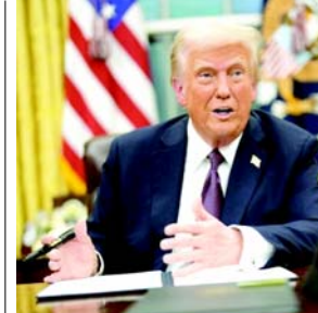
ઈઝરાયેલી વસાહતીઓએ કબજાવાળા વેસ્ટ બેંકમાં અલ-ફુડુક અને જીનાસહુટના પેલેસ્ટીની ગામો પર હુમલો કર્યો, ઘરો, મુકવાની સત્તા આપી. વેસ્ટ બેંકમાં તેના જવાબમાં, પેલેસ્ટીની ઓથોરિટીએ આજે ચેતવણી આપી કે વસાહતીઓ પરનો પ્રતિબંધ હટાવવાથી પેલેસ્ટીનીઓ સામે હિંસા વધશે. 'આ નિષ્ણાયક વસાહતીઓને

(એજન્સી) તા.૨૨ અમેરિકા રાષ્ટ્રપતિ ડોનાલ્ડ ટ્રમ્પે ગઈકાલે કબજાવાળા વેસ્ટ બેંકમાં હિંસક ઈઝરાયેલી વસાહતો પર લાદવામાં આવેલા પ્રતિબંધોને હટાવવાના એક્ઝિક્યુટિવ ઓર્ડર પર હસ્તાક્ષર કર્યાં છે. આ પ્રતિબંધો મૂળ તેમના પુરોગામી જો બાઈડેન દ્વારા ફેબ્રુઆરીમાં લાદવામાં આવ્યા હતા. ૧૭ દક્ષિણપંચી ઈઝરાયેલી વસાહતીઓ અને ૧૬ સંગઠનો પર પેલેસ્ટીનીઓ વિરૂદ્ધ હિંસાનો આરોપ મુકવામાં આવ્યો છે. તેણે રાજ્ય અને ટ્રેડરની વિભાગોને તેમની અમેરિકન અસ્થાયીતો ફીઝ કરવાની, તેમની એક્સેસને અવરોધિત કરવાની અને સામાન્ય રીતે અમેરિકનોને તેમની સાથે વ્યવહાર કરવા પર પ્રતિબંધ મુકવાની સત્તા આપી. વેસ્ટ બેંકમાં પેલેસ્ટીનીઓ વિરૂદ્ધ ઈઝરાયેલી વસાહતીઓ દ્વારા વધતી હિંસા અને કબજાવાળા પ્રદેશોમાં જમીન હડપ કરવા છતાં આ નિષ્ણાયક લેવામાં આવ્યો છે. ગઈકાલે ગેરકાયદેસર