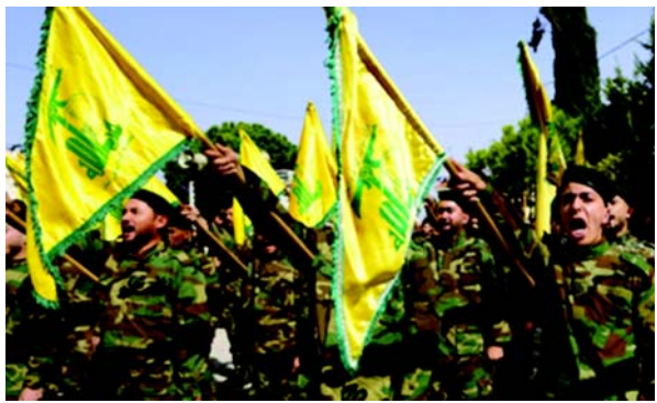
આતંકવાદીઓની યાદીમાં હતા. તેમણે ૧૫૩ ઉતાડૂઓ ભરેલાં એક વિમાનનું અપહરણ કરવામાં મોટી ભૂમિકા ભજવી હતી. ગાઝામાં અત્યારે યુદ્ધવિરામ જાહેર થયો છે ત્યારે હિઝબુલ્લાહ કમાન્ડરની હત્યાથી લેબેનોનમાં પરિસ્થિતિ તંગ બની છે.

(એજન્સી) બેરૂત, તા.૨૨ હિઝબુલ્લાહ જૂથના સિનિયર નેતા શેખ મોહમદઅલી હમાદીની એમના ઘરની બહાર અજાણ્યા હુમલાખોરોએ ગોળીબાર કરીને હત્યા કરી નાંખી હતી. પૂર્વ લેબેનોનની બેકા વેલી વિસ્તારમાં હત્યા થઈ હતી.