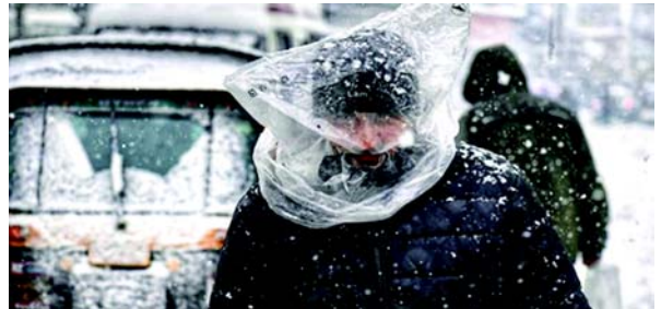
સેલ્ફિસ હતું અને ટ્રાફિક સ્થગિત થઈ ગયો હતો. પરંતુ સ્થાનિકો અમારા બચાવમાં આવ્યા હતા. તેઓએ અમારી પાસેથી એક પૈસો પણ વસૂલ્યો નથી. તેઓએ ખૂબ જ સરસ વર્તન કર્યું હતું. મને કાશ્મીરની મુલાકાત લેવાનો ડર હતો પરંતુ આ અનુભવે મારી વિચારસરણી બદલી નાખી છે. આ વીડિયો સત્તાધારી નેશનલ ફોર્સ-૨ને તેના સોશિયલ મીડિયા પેજ પર શેર કર્યો હતો. રૈનાએ જણાવ્યું હતું કે કેટલાક પ્રવાસીઓ મસ્જિદમાં રોકાયા હતા જ્યાં તેમને આખી રાત હમામની અંદર આગ શરૂ કરવામાં આવી હતી જ્યારે સ્થાનિક રહેવાસીઓએ બે થી ત્રણ પરિવારોને સમાવી લીધા હતા જેમને કોઈપણ શુલ્ક વિના ગરમ ખોરાક અને આશ્રય આપવામાં આવ્યો હતો. અમારા લોકો દ્વારા આતિથ્યનું આ અદ્ભુત પ્રદર્શન જોઈને અમને આનંદ થયો છે. હમામ એ એક વિશિષ્ટ આઉટડોર કાશ્મીરની મોટાભાગના વિસ્તારમાં વીજ શૂન્યથી નીચે જાય છે. હુરિયત નેતા અને કાશ્મીરના મુખ્ય મોલવી મીરવાઈઝ ઉમર ફારુકે કહ્યું કે ભારે હિમવર્ષા વચ્ચે કાશ્મીરના લોકો તેમની મસ્જિદો અને ઘરો ફસાયેલા પ્રવાસીઓ માટે ખોલતા જોઈને આનંદ થયો. હૂંફ અને

(એજન્સી) શ્રીનગર, તા.૨૯ શિયાળાની મોસમની પ્રથમ હિમવર્ષાથી ૨૮ ડિસેમ્બરે સામાન્ય જીવન ઠપ થઈ ગયું હતું, લપસી જતાં રસ્તાઓને કારણે મધ્ય કાશ્મીરમાં ફસાયેલા સેંકડો પ્રવાસીઓને સ્થાનિક રહેવાસીઓ દ્વારા મસ્જિદ અને ઘરોમાં સમાવી લેવામાં આવ્યા હતા, અને સોશિયલ મીડિયા પ્લેટફોર્મ પર તેઓના વખાણ કરવામાં આવ્યા હતા. ભારતીય હવામાન વિભાગના શ્રીનગર સ્ટેશન દ્વારા હવામાનની કોઈ મોટી આગાહી વિના, અણધારી હિમવર્ષાને કારણે શુક્રવારે સાંજે સમગ્ર કાશ્મીરમાં વાહન વ્યવહાર થંભી ગયો હતો, જેમાં મુખ્યમંત્રી ઓમર અબ્દુલ્લાનો કાફલો પણ હતો જન્મથી શ્રીનગર તરફ જઈ રહ્યા હતા. ગંદેરબલ જિલ્લાના ડાઉનેક ગામોના રહેવાસીઓ સેંકડો વિદેશી અને સ્થાનિક પ્રવાસીઓને ભોવવા આવ્યા હતા જેઓ ગુનિવાનથી સોનમર્ગ વ્યારોગ્ય રિસોર્ટ સુધીનો રસ્તો બરફના સંચયને કારણે જામમી રીતે લપસણો થઈ ગયો હતો ત્યારે પાનગી વાહનોમાં ફસાયેલા હતા. ગંદેરબલમાં સ્વયંસેવક જૂથ, સિવિલ સોસાયટી ટહેરીલ ગુંડાના અધ્યક્ષ ઈરફાન રૈનાએ જણાવ્યું હતું કે શુક્રવારે સાંજે લગભગ ૬૦૦-૭૦૦ પ્રવાસીઓ પાસે રસ્તો બંધ હોવાને કારણે તેમની કારમાં રસ્તા પર રાત વિતાવવા સિવાય કોઈ વિકલ્પ બચ્યો ન હતો. જો કે, ગંદેરબલ જિલ્લાના ગુંડ અને આસપાસના ગામોના સ્થાનિક રહેવાસીઓએ હાડકાં થીજવી દેનાર હવામાન પરિસ્થિતિઓને કારણે કોઈ અપ્રિય ઘટનાને રોકવા માટે તેમના ઘરો તેમજ સ્થાનિક મસ્જિદ ખોલી હતી. સ્થાનિક પત્રકારો સાથે વાત કરતા, મહારાષ્ટ્રના એક યુવાન પ્રવાસીએ જણાવ્યું હતું કે તે તેના પરિવાર સાથે સોનમર્ગથી પરત ફરી રહ્યો હતો જ્યારે શુક્રવારે સાંજે લગભગ ૮ વાગ્યે બરફવર્ષાને કારણે રસ્તો બંધ થઈ ગયો હતો. તાપમાન -૧૦ ડિગ્રી