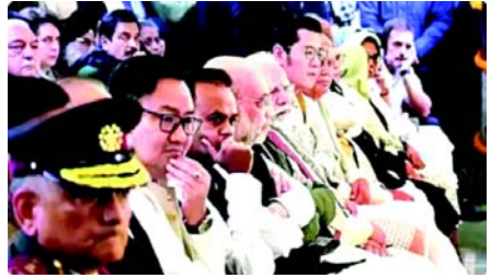
વાત એ છે કે, બંને પક્ષોની વચ્ચે રાષ્ટ્રપતિ દ્રૌપદી મુર્મુ, ભૂટાનના રાજા જિગ્મે ખેસર નામગ્યેલ વાંગચુક, ઉપરાષ્ટ્રપતિ જગદીપ ધનખર અને લોકસભાના સ્પીકર એમ બિરલા બેઠા હતા.

નવી દિલ્હી, તા.૨૯ મનમોહન સિંહ માટે નિગમબોધ ઘાટ રાજ્યના અંતિમ સંસ્કારમાં બેઠક વ્યવસ્થામાં સરકારી નેતાઓ અને કોંગ્રેસની છાવણી પંક્તિની બે અલગ બાજુઓ પર કબજો કરતી જોવા મળી હતી. જ્યારે દેખીતી વિભાજન રાજ્યના પ્રોટોકોલને કારણે હોઈ શકે છે, તે કોંગ્રેસ અને ભાજપ વચ્ચેના શીત યુદ્ધને પ્રતિબિંબિત કરે છે. અંતિમ સંસ્કારની પૂર્વસંધ્યાએ કોંગ્રેસની એ માંગ પર મતભેદો તીવ્ર બન્યા હતા કે સિંહના તેમના સ્મારક તરીકે વિકસિત કરી શકાય તે સ્થળે અંતિમ સંસ્કાર કરવામાં આવે. સત્તાવાર પક્ષમાં વડાપ્રધાન મોદીની આગેવાની હેઠળના પ્રધાનો હતા, જેમાં સંરક્ષણ અને ગૃહ પ્રધાનો, અમલદારો, સર્વિસ ચીફ સહિત અન્યો સામેલ હતા, જ્યારે કોંગ્રેસ કેમ્પમાં પક્ષ પ્રમુખ મલ્લિકાર્જુન ખડગે, સોનિયા ગાંધી, રાહુલ ગાંધી, પ્રિયંકા ગાંધી વગેરે ઉપરાંત મનમોહન સિંહના પરિવારના સભ્યો હતા. રસપ્રદ