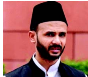
તણાવ વધ્યો અને જામીન પર મુક્ત થતા પહેલા તેને શાંતિ ભંગ કરવાના આરોપમાં અટકાયતમાં લેવામાં આવ્યો. સ્થાનિક પોલીસે કાનિષ્ઠ ફરિયાદના આધારે કેસ નોંધીને તપાસ શરૂ કરી છે. એસપી કમ્પ કુમાર બિશોઈએ ટિપ્પણી કરી: 'અમે જાનથી મારી નાખવાની ધમકી આપીને તેમના પિતાને તેમને ખૂબ પરેશાન કર્યાં છે. તે લેવામાં મારી નાખશે. વિરોધ કરતાં તે અપરાધો બોલીને ભાગી ગયો હતો. ફરિયાદમાં કહેવામાં આવ્યું છે કે ધમકી આપવાનો યુવક ૨૦ ડિસેમ્બરે જામા મસ્જિદમાં ઘૂસવાનો પ્રયાસ પણ કર્યો હતો. તે વાતાવરણને બગાડવા માંગે છે. ફરિયાદમાં કહેવામાં આવ્યું છે કે સાંસદ અને તેમના પિતાના જીવને જોખમ છે. તેથી આરોપીઓ સામે કડક કાર્યવાહી થવી જોઈએ. બીજા તરફ પોલીસ સ્ટેશન ઈન્ચાર્જ જણાવ્યું કે અજાણ્યા વ્યક્તિ વિરૂદ્ધ ફરિયાદ દાખલ કરવામાં આવી છે. ફરિયાદના આધારે તપાસ હાથ ધરી છે.

(એજન્સી) તા.૨૯ ઉત્તરપ્રદેશના સંભલથી સમાજવાદી પાર્ટીના લોકસભા સભ્ય જિયાઉર રહેમાન બર્ક અને તેમના પિતા મોલાના મમલુકર-ઉર-રહેમાન બર્કને આ મહિનાની શરૂઆતમાં જુમ્મીની નમાજ દરમિયાન શહેરની શાહી જામા મસ્જિદમાં ઘૂસવાનો પ્રયાસ કરવા પર જાનથી મારી નાખવાની ધમકી આપી હતી. આ ધમકી જામીન પર ઘટ્ટેલા ગુનેગારોએ આપી હતી. કથિત ધાકધમકીનો બનાવ ૨૬ ડિસેમ્બરે નાનાસા પોલીસ સ્ટેશનના કાર્યક્ષેત્ર હેઠળના મોહલવા દીવા સરાઈમાં સાંસદના નિવાસસ્થાને બન્યો હતો. સાંસદના નિવાસસ્થાનના કેરેક્ટર કમિલે આ અંગે ફરિયાદ નોંધાવી છે. ફરિયાદ મુજબ યુવક ઘરમાં ઘૂસીને સાંસદ અને તેના પિતા બંનેને જાનથી મારી નાખવાની ધમકી આપી હતી. જ્યારે આરોપીઓએ પરિવારનો પ્રકાશ પણ કરવાનો પ્રયાસ કર્યો ત્યારે પરિસ્થિતિ વધુ વણસી હતી, પરંતુ બીડ ભંગી થતાં તે સ્થળ પરથી ભાગી ગયો હતો. ૨૦ ડિસેમ્બરના રોજ, કપાળ પર તિલક અને ગુનેગારોને કેસરી ખેસ પહેરવા તે જ વ્યક્તિએ કડક સુરક્ષા વ્યવસ્થા વચ્ચે શુક્રવારની નમાજ દરમિયાન કથિત રીતે જામા મસ્જિદમાં પ્રવેશવાનો પ્રયાસ કર્યો હતો. તેની ક્રિયાઓથી