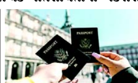
કારણોને આભારી હોવાનું જણાયું છે. MEA એ જણાવ્યું હતું કે, નાગરિકતા છોડવાનું કે લેવાનું કારણ વ્યક્તિગત છે, જ્ઞાન આધારિત અર્થતંત્રના યુગમાં સરકાર વૈશ્વિક કાર્યક્ષેત્રની સંભવિતતાને ઓળખે છે. તેણે ભારતીય સમુદાય સાથેના તેના સંબંધોમાં પરિવર્તનકારી બદલાવ પણ લાવ્યું છે. કેટલાક નિષ્ણાતોએ વલણને વધુ સારી કારકિર્દીની તકો, જીવનની ગુણવત્તામાં સુધારો, ઉન્નત શૈક્ષણિક સંભાવનાઓ અને વૈશ્વિક ગતિશીલતાના એક્સેસ જેવા પરિબળો સાથે જોડ્યા છે. વિદેશી રોજગાર વિશ્લેષક અર્ચના કુમારીએ જણાવ્યું હતું કે, મજબૂત સામાજિક સુરક્ષા પ્રણાલીઓ અને દ્વિ નાગરિકતાની જોગવાઈ સાથે વિકસિત દેશોની લાલચ, જેને ભારતે હાલમાં મંજૂરી આપતું નથી, તેને પણ ભૂમિકા ભજવી હોઈ શકે છે. ૨૦૨૨ પહેલા લગભગ ૧,૬૩,૩૭૦ ભારતીયોએ અન્ય

કેટલાક નિષ્ણાતોએ વલણને વધુ સારી કારકિર્દીની તકો, જીવનની ગુણવત્તામાં સુધારો, ઉન્નત શૈક્ષણિક સંભાવનાઓ અને વૈશ્વિક ગતિશીલતાના એક્સેસ જેવા પરિબળો સાથે જોડ્યા છે (એજન્સી) નવી દિલ્હી, તા.૨૯ રાજ્યસભામાં રજૂ કરાયેલા સરકારી ડેટા અનુસાર છેલ્લા ૧૩ વર્ષમાં ૧૮ લાખથી વધુ ભારતીયોએ ૧૩૫ દેશોની રાષ્ટ્રીયતા પસંદ કરીને તેમની નાગરિકતાનો ત્યાગ કર્યો છે. જે દેશોએ નાગરિકતાની પસંદગી કરી છે તેમાં પાકિસ્તાન, બાંગ્લાદેશ, ફિજી, મ્યાનમાર, થાઈલેન્ડ, નામીબિયા, નેપાળ અને શ્રીલંકાનો સમાવેશ થાય છે, જે વિકાસ અને વૈશ્વિક પ્રભાવની દૃષ્ટિએ ભારતથી નોંધપાત્ર રીતે પાછળ છે. અન્ય દેશો કે જેઓ લોકપ્રિય પસંદગી તરીકે ઉભરી આવ્યા તેમાં યુએસ, કેનેડા, રશિયા, ચીન, ઈજિપ્ત, સુગ્રીવેન, સિંગાપોર, દક્ષિણ આફ્રિકા, એન, સુદાન, સ્વિટ્ઝર્લેન્ડ, ત્રિનિદાદ અને ટોબેગો, યુકે, તુર્કી, યુએઈ અને વિદેશના સમાવેશ થાય છે. વિદેશ મંત્રાલય (MEA) દ્વારા રજૂ કરાયેલા ડેટા અનુસાર ૨૦૨૨માં ૨૦૨૨, ૨૫, ૨૦૦ ભારતીયોએ તેમની નાગરિકતા છોડી દીધી હતી, ત્યારબાદ ૨૦૨૩માં ૨,૧૬,૨૧૯ લોકોએ નાગરિકતા છોડી દીધી હતી. ૨૦૧૯થી ૨૦૨૩ સુધીમાં ૧૨ લાખથી વધુ લોકોએ ભારતીય નાગરિકતા છોડી અન્ય દેશની નાગરિકતા મેળવવાનું પસંદ કર્યું હતું. ઉચ્ચ ગુણમાં તેના જવાબમાં MEA એ આ વલણ વ્યક્તિગત