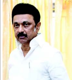
માટે નિગમબોધ ઘાટ પર મોકલવો એ ધમક, પૂર્વગ્રહ અને જાહેર સ્મૃતિમાંથી તેમના પુષ્કળ યોગદાનને ભૂંસી નાખવાનો ઈરાદાપૂર્વકનો પ્રયાસ છે. તેમણે કહ્યું, ડો.મનમોહન સિંહના

(એજન્સી) તા.૨૯ તમિલનાડુના મુખ્યપ્રધાન એમ. કે. સ્ટાલિને શનિવારે કેન્દ્ર સરકાર પર પૂર્વ વડાપ્રધાન મનમોહન સિંહના પરિવારને યોગ્ય જગ્યાએ તેમના અંતિમ સંસ્કાર કરવાના અધિકારથી 'વંચિત' કરવાનો આરોપ મૂક્યો હતો જ્યાં તેમનું સ્મારક પછીથી બનાવવામાં આવી શકે છે. તેમણે આને દિવંગત નેતાના વિરાટ વારસા અને શીખ સમુદાયનું અપમાન ગણાવ્યું છે. સ્ટાલિને 'X' પર એક પોસ્ટમાં કહ્યું, ડો.મનમોહન સિંહના પરિવારને તેમના સ્મારક માટે યોગ્ય જગ્યાએ તેમના (સિંહ) અગ્નિસંસ્કાર કરવાનો અધિકાર નકારવાનો ભાજપ સરકારનો નિર્ણય તેમના વિશાળ વારસા અને શીખ સમુદાયનું સીધું અપમાન છે. પરિવારની વિનંતીને નકારી કાઢવી અને બે વખતના વડાપ્રધાનના નશ્વર દેહને અંતિમ સંસ્કાર