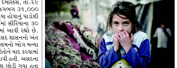
ગૃહમંત્રી અલીના જણાવ્યા અનુસાર અત્યાર સુધીમાં ૩૧,૦૦૦ જેટલા સીરિયાના લોકો વતન પરત ફરી ગયા છે.

(એજન્સી) દમાસ્કસ, તા. ૨૯ સીરિયામાં અસદ શાસનના પતન બાદ લગભગ ૩૧,૦૦૦ જેટલા સીરિયન નાગરિકો વતન પાછા ફરી ગયા હોવાનું પાટોશી તુર્કી દેશના ગૃહમંત્રીએ જાહેર કર્યું હતું. તુર્કીમાં સીરિયાના ૩૦ લાખ જેટલા શરણાર્થીઓને આશરો આપવામાં આવી રહ્યો છે. દરમિયાન શુક્રવારે ૧૩ વર્ષના બચરા અલ-અસદ શાસનનો અંત આવ્યા બાદ જે લોકો આ શાસન દરમિયાન જુલમનો ભોગ બન્યા છે તેમની યાદમાં આખા દેશમાં એ તેમામ પીડિતોને યાદ કરવામાં આવ્યા હતા અને એમને અંજલિ આપવામાં આવી હતી. અસદના રાજમાં લાખો લોકો જુલમથી બચવા માટે દેશ છોડી ગયા હતા અને મોટાભાગના લોકોએ તુર્કીમાં આશરો લીધો હતો. હવે એ બધા વતન પરત ફરવાની આશા રાખીને બેઠા છે અને તુર્કીના