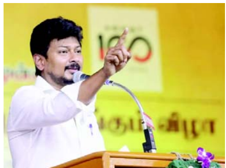
સનાતન ધર્મનો માત્ર વિરોધ કરવાને બદલે તેને નાબૂદ કરવો પડશે. ઉદયનિધિ સ્ટાલિને ૨૦૨૩માં સનાતન ધર્મ પર તમિલનાડુ પ્રગતિશીલ લેખકોના એક કાર્યક્રમમાં કહ્યું હતું કે તે સામાજિક ન્યાયની વિરુદ્ધ છે. ઉદયનિધિ સ્ટાલિનની ‘સનાતન ધર્મ એ ડેન્ગ્યુ જેવો છે’ ટિપ્પણીએ હલચલ મચાવી દીધી હતી બાદમાં, તેમણે તેમની ટિપ્પણી માટે માફી માંગવાનો ઈનકાર કર્યો હતો અને તેને ન્યાયી ટેરવીને કહ્યું હતું કે: હું આવું સતત કહીશ. અ અગાઉ, સર્વોચ્ચ અદાલતે કહ્યું હતું કે તે ઉદયનિધિ સ્ટાલિનના વિવાદાસ્પદ નિવેદનો પર તેમના વિરુદ્ધ અવમાનનાની કાર્યવાહીની માંગ કરતી અરજી પર વિચાર કરશે નહીં કારણ કે દેશભરમાં વ્યક્તિગત કેસોની સુનાવણી કરવી અશક્ય છે. જો અમે આવી અવમાનના અંગે સુનાવણી શરૂ કરીશું, તો અમે વ્યક્તિગત કેસો પર ધ્યાન આપી શકીશું નહીં.

(એજન્સી) તા.૨૮ સુપ્રીમ કોર્ટે સોમવાર, ૨૭ જાન્યુઆરીના રોજ તમિલનાડુના નાયબ મુખ્યમંત્રી ઉદયનિધિ સ્ટાલિન સામે ‘સનાતન ધર્મ’ પરના તેમના વિવાદાસ્પદ નિવેદનો બદલ FIR નોંધવા સહિત કાનૂની કાર્યવાહીની માંગ કરતી અરજીઓ પર વિચાર કરવાનો ઈનકાર કર્યો હતો. જસ્ટિસ બેલા એમ ત્રિવેદી અને પીબી વરાલેની બેન્ચે બંધારણની કલમ ૩૨ હેઠળ દાખલ કરવામાં આવેલી રિટ અરજીઓની જાળવણી પર પ્રશ્ન ઉઠાવ્યો હતો. સુપ્રીમ કોર્ટ દ્વારા અરજી પર વિચારણા કરવાનો ઈનકાર કરતા, બી જગન્નાથ અને અન્ય બે અરજદારો વતી હાજર રહેલા વરિષ્ઠ વકીલ દામા શેખાદ્રિ નાયડુએ અરજીઓ પાછી ખેંચવાની પરવાનગી માંગી હતી. આખરે, કાયદા હેઠળ ઉપલબ્ધ ઉપાયો મેળવવાની સ્વતંત્રતા સાથે અરજી પાછી ખેંચી લેવામાં આવી હતી. સુપ્રીમ કોર્ટે ઉદયનિધિ સ્ટાલિન દ્વારા દાખલ કરાયેલી અરજીમાં તેમના વિવાદાસ્પદ નિવેદનો પર તેમની સામે નોંધાયેલી વિવિધ એકઠાઈઓ અને ફરિયાદોને એકીકૃત કરવા માટે નિર્દેશો માંગવામાં આવ્યા હતા. આ અરજીની તપાસ કરવા સંમતિ આપતા, ન્યાયાધીશ સંજય ખન્ના (હવે સીજેઆઈ)ની અધ્યક્ષતાવાળી બેન્ચે આ મામલે વિવિધ રાજ્ય સરકારો પાસેથી જવાબો માંગ્યા હતા. અરજીમાં દલીલ કરવામાં આવી હતી કે ડીએમકે નેતાને તેમની હત્યાની ધમકીઓ મળી રહી છે અને તેમને વિવિધ પ્રદેશોમાં વિવિધ પોલીસ સ્ટેશન અને કોર્ટમાં હાજર થવામાં ભારે મુશ્કેલીનો સામનો કરવો પડશે.