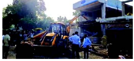
(તસવીર : બુરહાન પઠાણ, આણંદ)

(સંવાદદાતા દ્વારા) આણંદ, તા. ૧૧ આણંદ જિલ્લાના ખંભાત શહેરમાં પ્રેસ રોડ પર નગરપાલિકા પાસેથી ભાડા પટ્ટાથી મેળવેલી જમીન પર બનાવેલા બે માળના મકાનને ગેરકાયદેસર દબાણ ગણી વહીવટીતંત્ર દ્વારા બે માળનું મકાન તોડી પાડવામાં આવતા ચક્રચાર મચી જવા પામી છે.