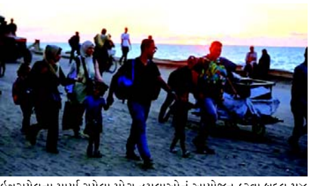
ઈઝરાયેલના માર્યા ગયેલા મોટા હુમલાઓનું આયોજન કરવા બદલ ૫૪ આજીવન કેદની સજા આપવામાં આવી છે.

(એજન્સી) ઈઝરાયેલી અખબાર યેડિઓથ અહરોનોએ ખુલાસો કર્યો કે ઈઝરાયેલે છ વરિષ્ઠ પેલેસ્ટીની અટકાયતીઓને મુક્ત કરવાનો ઈન્કાર કર્યો છે, જેને 'ચાલીરૂપ સોદાબાજી કાર્ગેટ્સ' તરીકે ઓળખવામાં આવ્યા છે, જ્યારે હમાસે નવા ટ્રમ્પ કેદી વિનિમય કરારમાં તેમના સમાવેશની માંગ કરી છે. અખબારના જણાવ્યા અનુસાર, ઈઝરાયેલે છ નેતાઓની મુક્તિ પર 'સંપૂર્ણ વીટો' લાદ્યો છે, જેઓ ૫૦ કેદીઓની વિસ્તૃત સુચિનો ભાગ છે. આ છ છે :