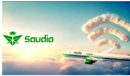
એરબિયન એરલાઈન્સ કોર્પોરેશનના બોડીના અધ્યક્ષ સાહેબ અલ-જસેર અને સઉદીયા ગ્રુપના ડિરેક્ટર જનરલ એન્જિનિયર ઈબ્રાહિમ બિન અબ્દુલરહેમાન અલ-ઓમારે નવી સેવાનો ઉપયોગ કરીને સઉદી પ્રો લીગ મેચનું લાઈવ પ્રસારણ જોયું. મંત્રી અલ-જસેરે સંદેશવ્યવહાર અને માહિતી ટેકનોલોજી મંત્રી અબ્દુલ્લા અલ-સ્વાલા સાથે લાઈવ ટેલિવિઝન ઈન્ટરવ્યુ અને વીડિયો કોલ પણ કર્યો, જેમાં જોડાણની સ્થિતિ દર્શાવવામાં આવી.

(એજન્સી) સઉદીયા એરલાઈન્સે સેવાનું પરીક્ષણ કરવા અને મુસાફરોના પ્રતિસાદ એકત્રિત કરવા માટે પાયલોટ તબક્કાના ભાગરૂપે તેની પ્રથમ સંપૂર્ણપણે ઈન્ટરનેટ-સક્ષમ ફ્લાઈટ શરૂ કરી છે, જે એરલાઈનની ડિજિટલ પરિવર્તન યાત્રામાં એક મહત્વપૂર્ણ સીમાચિહ્નરૂપ છે. આ પહેલ સઉદીયાની હાઈ-સ્પીડ અને વિશ્વસનીય ઈન-ફ્લાઈટ કનેક્ટિવિટી દ્વારા મુસાફરોના અનુભવને વધારવાની પ્રતિબદ્ધતાને પ્રતિબિંબિત કરે છે. એકવાર સત્તાવાર રીતે શરૂ થયા પછી, આ સેવા બધા મુસાફરો માટે મફતમાં ઉપલબ્ધ થશે, જે સીમલેસ ડિજિટલ અનુભવ પ્રદાન કરવાના એરલાઈનના ધ્યેયને વધુ મજબૂત બનાવશે. આ ટેકનોલોજી ૩૦૦ મેગાબિટ પ્રતિ સેકન્ડ સુધીની ઝડપ પ્રદાન કરે છે, જે ભવિષ્યમાં ૮૦૦ Mbps સુધી પહોંચવાની સંભાવના ધરાવે છે. આનાથી પ્રવાસીઓ કોઈપણ અવરોધ વિના બહુવિધ ઉપકરણોનો ઉપયોગ કરીને બ્રાઉઝ કરી શકે છે, લાઈવ સામગ્રી સ્ટ્રીમ કરી શકે છે અને વર્ચ્યુઅલ મીડિયામાં જોડાઈ શકે છે. ૩૫,૦૦૦ ફૂટની ઊંચાઈએ SV1044ની પરીક્ષણ ઉડાન દરમિયાન, પરિવહન અને લોજિસ્ટિક્સ સેવાઓ મંત્રી અને સઉદી