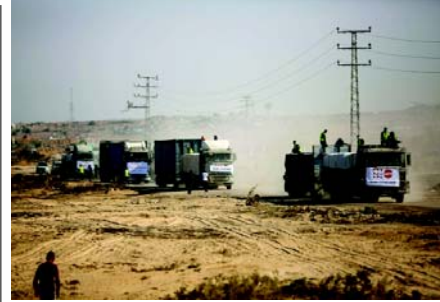
રેકોર્ડ કરવામાં નિષ્ફળ રહેવાનો આરોપ મૂકવામાં આવ્યો હતો, જેમાં ૨૫૪ પેલેસ્ટીનીઓ મૃત્યુ પામ્યા છે અને ૫૮૫ અન્ય ઘાયલ થયા છે. સેન્ટકોમે ડ્રોન ડ્રેજ શેર કર્યું છે જેમાં કથિત રીતે હમાસના કાર્યકરો સહાય ટૂકો લૂંટતા દેખાય છે. હમાસે જણાવ્યું કે ગાઝામાં પ્રવેશતા સહાય ટૂકોની સરેરાશ સંખ્યા દરરોજ ૧૩૫થી વધુ નથી, જ્યારે બાકીના વ્યાપારી ટૂક છે, જે ગાઝાની વસ્તી પર વડી શકે તેમ નથી, 'માનવતાવાદી સહાય ટૂકોની સંખ્યા વધારવા અને વ્યાપારી શિપમેન્ટ ઘટાડવા માટે અમારા વારંવારના કોલ છતાં.' 'યુએસએ ઈઝરાયેલી કથા અપનાવવાથી વોશિંગ્ટનનો અનૈતિક પક્ષપાત વધુ ઊંડો થાય છે અને તેને નાકાબંધી અને પેલેસ્ટીની લોકોના દુઃખમાં સીધો ભાગીદાર બનાવે છે.'

(એજન્સી) પેલેસ્ટીની સમૂહ હમાસે રવિવારે અમેરિકન સેન્ટ્રલ કમાન્ડ (સેન્ટકોમ)ના આરોપોને નકારી કાઢ્યા કે તેણે ગાઝા પટ્ટીમાં સહાય ટૂકો લૂંટી હતી. એક નિવેદનમાં, હમાસે યુએસના આરોપોને 'પાયાવિહીણ' ગણાવ્યા અને જણાવ્યું કે તે 'ગાઝામાં નાગરિકો પર લાદવામાં આવેલી નાકાબંધી અને ભૂખમરો સમાપ્ત કરવામાં આંતરરાષ્ટ્રીય સમુદાયની નિષ્ફળતાને છુપાવીને, પહેલાથી જ મર્યાદિત માનવતાવાદી સહાયમાં વધુ કાપને યોગ્ય ઠેરવવાનો પ્રયાસ છે.' તેમાં જણાવવામાં આવ્યું છે કે, 'ઈઝરાયેલી' કબજેદાર દળોની પોઈન્ટ પછી તરત જ અરાજકતા અને લૂંટફાટના તમામ અભિવ્યક્તિઓ બંધ થઈ ગયા, જે સાબિત કરે છે કે કબજે એકમાત્ર પક્ષ હતો જે આ ગેંગને પ્રાયોજિત કરતો હતો અને અરાજકતાનું આયોજન કરતો હતો.' હમાસે જણાવ્યું કે માનવતાવાદી સહાય કાફલાઓનું રક્ષણ કરવાનો અને જરૂરિયાતમંદોને સહાય પહોંચાડવાનો પ્રયાસ કરતી વખતે ૧,૦૦૦થી વધુ પેલેસ્ટીની પોલીસ અને સુરક્ષા દળોએ પોતાના જીવ ગુમાવ્યા અને સેંકડો ઘાયલ થયા. તેણે પુષ્ટિ આપી કે કોઈ આંતરરાષ્ટ્રીય કે સ્થાનિક સંગઠન અથવા સહાય કાફલાઓ સાથે કામ કરતા કોઈપણ ધાર્ણવરે હમાસે દ્વારા લૂંટફાટ અંગે કોઈ રિપોર્ટ કે ફરિયાદ નોંધાવી નથી. તેમાં જણાવવામાં આવ્યું છે કે, 'આ સ્પષ્ટપણે દર્શાવે છે કે યુએસ સેન્ટ્રલ કમાન્ડ દ્વારા ટોકવામાં આવેલ દૃશ્ય નાકાબંધી નીતિઓ અને માનવતાવાદી સહાયમાં ઘટાડાને યોગ્ય ઠેરવવા માટે બનાવેલી અને રાજકીય રીતે પ્રેરિત છે.' તેમાં અમેરિકા પર યુદ્ધવિરામ છતાં ચાલુ રહેલા ઈઝરાયેલી હુમલાઓને