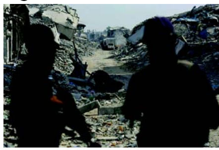
સાથે પ્રવેશ કરી રહ્યા છે અને 'બહારથી ભારે મશીનની મદદથી કાટમાળ નીચે મૃતદેહો પહોંચી રહ્યા છે.' તેમણે જણાવ્યું કે, 'હવે, ઈઝરાયેલ તે વિસ્તારોમાં ઘરોનો નાશ કરવાનું ચાલુ રાખે છે, પછી ભલે તે બાની સુલેલા હોય, જ્યાં આ રવિવારે ત્રણ અટકાયતીઓના મૃતદેહો મળી આવ્યા હતા અથવા ગાઝા શહેરની પૂર્વમાં શુજ્યા પડોશ હોય, જ્યાં ઈઝરાયેલી અટકાયતીઓના વધુ મૃતદેહોની શોધ ચાલુ છે.' નિષ્પાતો અને અમેરિકન અધિકારીઓ અપેક્ષા રાખે છે કે બાકીના આઠ લોકોની શોધ વધુ જટીલ બનશે. ઓહદે જણાવ્યું કે, 'ગાઝામાં સેંકડો ટન કાટમાળ છે, અને તે અનિશ્ચિત છે કે હમાસ તે બધા મૃતદેહો શોધી શકશે કે નહીં.' તેમણે ઉમેર્યું, 'યુદ્ધવિરામ લંબાવવો એ ટ્રમ્પ વહીવટ પર આધાર રાખશે, કારણ કે ઈઝરાયેલે યુદ્ધવિરામના બીજા તબક્કામાં આગળ વધવા માટે તમામ ઈઝરાયેલી અટકાયતીઓના મૃતદેહો પરત કરવાની શરત રાખી છે.'

(એજન્સી) ઈઝરાયેલી દળોએ ગાઝામાં વધુ એક પેલેસ્ટીનીની હત્યા કરી છે, જેનાથી યુદ્ધવિરામ પછી મૃત્યુઆંક ૨૩૬ પર પહોંચી ગયો છે, જ્યારે હમાસે વધુ ત્રણ અટકાયતીઓના અવશેષો સોંપ્યા છે. રવિવારે તબીબી અધિકારીઓએ જણાવ્યું કે ગાઝા શહેરના શુજ્યા વિસ્તારમાં ઈઝરાયેલી ડ્રોન હુમલામાં પેલેસ્ટીની વ્યક્તિનું મોત થયું, જ્યાં ઈઝરાયેલી ડ્રોન સવારથી ઈમારતો તોડી રહ્યા હતા. ઈઝરાયેલી સૈન્યએ કોઈ પુરાવા આપ્યા વિના જણાવ્યું કે તે વ્યક્તિ યુદ્ધવિરામ રેખાને ધિક્કાર કરતી 'પીળી રેખા' પાર કરી ગયો હતો અને તેમના સૈનિકો પાસે પહોંચ્યો હતો. ગાઝા આરોગ્ય મંત્રાલયના જણાવ્યા અનુસાર, ગયા મહિને યુદ્ધવિરામ અમલમાં આવ્યા પછી ઈઝરાયેલી દળોએ ૨૩૬ પેલેસ્ટીનીઓ મૃત્યુ પામ્યા છે અને ૬૦૦ અન્ય ઘાયલ થયા છે. તેમાં જણાવવામાં આવ્યું છે કે યુદ્ધવિરામ પછી નાશ પામેલા ઘરો અને ઈમારતોના કાટમાળ નીચેથી ૫૦૨ પેલેસ્ટીનીઓના મૃતદેહ પણ મળી આવ્યા છે, જેનાથી ઈઝરાયેલના યુદ્ધ સમયના કુલ મૃત્યુઆંક ૬૮,૮૬૬ પર પહોંચી ગયો છે. દરમિયાન, હમાસે ઈન્ટરનેશનલ કમિટી ઓફ ધ રેડ ક્રોસ (ICRC) દ્વારા ત્રણ અટકાયતીઓના અવશેષો ઈઝરાયેલને સોંપવાની જાહેરાત કરી છે. ઈઝરાયેલી વડાપ્રધાન બેન્જામિન નેતાન્યાહુના કાર્યાલયે મૃતદેહોની પુનઃપ્રાપ્તિની ખાતરી કરી છે. ટાઈમ્સ ઓફ ઈઝરાયેલે જણાવ્યું કે તેલ અવીવમાં અબુ કબીર ફોરેન્સિક ઇન્સ્ટિટ્યૂટમાં અવશેષોની તપાસ કરવામાં આવશે અને આગળ પ્રક્રિયામાં બે દિવસ જેલો સમય લાગી શકે છે. ઈઝરાયેલે હવે ૪૫ મૃત પેલેસ્ટીની કેદીઓના મૃતદેહ પરત કરવા પડશે, એટલે કે દરેક ઈઝરાયેલી કેદી માટે ૧૫ મૃતદેહ. ઓહદે જણાવ્યું કે હાલમાં 'યલો લાઈન' પર શોધ કામગીરી ચાલી રહી છે, જ્યાં હમાસના લડાકુઓ ICRC સ્ટાફ