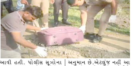
આવી હતી. પોલીસ સુત્રોના જણાવ્યા મુજબ, મહિલાની ઉંમર આશરે ૩૦-૩૫ વર્ષ હોવાનું

(સંવાદદાતા દ્વારા) સુરત, તા. ૩ સુરત જિલ્લાના માંગરોળ તાલુકાના કોસંબા નજીક આજે એક હયમચાવી દેનારી ઘટના સામે આવી છે. અહીં રેલવે ઓવરબ્રિજની બાજુમાં આવેલા જાહેર રોડ પરથી એક બંધ ટ્રોલી બેગ મળી આવી હતી, જેમાંથી અજાણી મહિલાનો મૃતદેહ મળી આવતાં સમગ્ર વિસ્તારમાં ચકચાર મચી જવા પામી હતી.