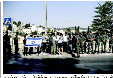
સમૂહો દ્વારા રહેવાસીઓને બહાર કાઢવાના વર્ષોના નિષ્ફળ પ્રયાસો પછી, ઈઝરાયેલ પોતે હવે આ પ્રયાસોનું નતુંવ કરી રહ્યું છે, ઈઝરાયેલી હાજરીને મજબૂત કરવા અને પેલેસ્ટીનીઓને વ્યાંથી જવા માટે દબાણ કરવા માટે નવા કાનૂની, વહીવટી અને આયોજન સાધનોનો ઉપયોગ કરી રહ્યું છે. 'શેખ જરાહમાં જે થઈ રહ્યું છે તે એક જ પડોશ પૂરતું મર્યાદિત નથી; તે સમગ્ર શહેરને ફરીથી આકાર આપવાની સરકારની વ્યાપક નીતિને પ્રતિબિંબિત કરે છે.' સરકાર સમર્થિત વસાહતી સંગઠનો ૧૯૫૦ના દાયકાથી રહેતા સેંકડો પેલેસ્ટીનીઓને તેમના ઘરોમાંથી બહાર કાઢવાનો પ્રયાસ કરી રહ્યા છે. વસાહતીઓ ઘાવો કરે છે કે જમીન ૧૯૪૮ પહેલા યહુદીઓની હતી, જે ઘાવને પેલેસ્ટીની રહેવાસીઓ નક્કર છે. તાજેતરના વર્ષોમાં, ગેરકાયદેસર વસાહતીઓએ શેખ જરાહ પડોશમાં ઘરો પર કબજો કર્યો છે અને વસાહતી સ્થાપિત કરવા માટે વધારાની મિલકતો કબજે કરવાનું ચાલુ રાખ્યું છે. પેલેસ્ટીનીઓ કહે છે કે પૂર્વ જેરુસલેમ ભવિષ્યના પેલેસ્ટીની રાજ્યની રાજધાની છે, જ્યારે ઈઝરાયેલ આખું શહેર પોતાની રાજધાની હોવાનું માને છે.