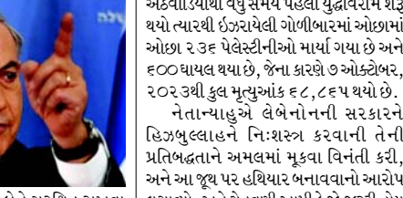
અઠવાડિયાથી વધુ સમય પહેલા યુદ્ધવિરામ શરૂ થયો ત્યારથી ઈઝરાયેલી ગોળીબારમાં ઓછામાં ઓછા ૨૩૬ પેલેસ્ટીનીઓ માર્યા ગયા છે અને ૬૦૦ ઘાયલ થયા છે, જેના કારણે ઓક્ટોબર, ૨૦૨૩થી કુલ મૃત્યુઆંક ૬૮,૮૬૫ થયો છે. નેતાન્યાહુએ લેબેનોનની સરકારને હિઝબુલ્લાહને નિ:શસ્ત્ર કરવાની તેની પ્રતિબદ્ધતાને અમલમાં મૂકવા વિનંતી કરી, અને આ જૂથ પર હથિયાર બનાવવાનો આરોપ લગાવ્યો, અને ચેતવણી આપી કે જો જરૂરી હોય તો ઈઝરાયેલ સ્વ-બચાવમાં કાર્યવાહી કરશે. સંરક્ષણ પ્રધાન ઈઝરાયેલ કાલો બેટ્વેનને દક્ષિણ લેબેનોનમાંથી હિઝબુલ્લાહ દળોને દૂર કરવા હકલ કરી, અને એક નિવેદનમાં કહ્યું કે મહત્તમ અમલ ચાલુ રહેશે અને તે વધુ તીવ્ર બનશે અને અમે ઉત્તરના રહેવાસીઓ માટે કોઈ ખતરો ઊભો થવા દઈશું નહીં. ઈઝરાયેલી સૈન્યએ જણાવ્યું હતું કે તેણે શનિવારે તાજેતરના હુમલામાં હિઝબુલ્લાહના યુનંદા રડવાન ફોર્સના ચાર સભ્યોને મારી નાખ્યા છે.

(એજન્સી) ઈઝરાયેલી વડાપ્રધાન બેન્જામિન નેતાન્યાહુએ રવિવારે હમાસને નિ:શસ્ત્ર કરવાની અને ગાઝા પટ્ટીને બિનલશ્કરીકરણ કરવાની પ્રતિજ્ઞા લેતા કહ્યું કે તેમની સરકાર ગયા મહિને અમલમાં આવેલા યુદ્ધવિરામ છતાં બાકીના આંતકવાદી સ્થળોને નિશાન બનાવતી રહેશે. નેતાન્યાહુએ મંત્રીઓને જણાવ્યું કે, અમારા નિયંત્રણ હેઠળના ગાઝાના કેટલાક ભાગોમાં હમાસના કેટલાક કોષો સક્રિય છે, અને અમે તેમને વ્યવસ્થિત રીતે ખતમ કરી રહ્યા છીએ. તેમણે દક્ષિણ ગાઝાના રફાહ અને ખાન યુનિસના વિસ્તારોનો ઉલ્લેખ કર્યો હતો અને કહ્યું કે, હમાસને નિ:શસ્ત્ર કરવું અને ગાઝા પટ્ટીને બિનલશ્કરીકરણ કરવું એ અમારો માર્ગદર્શક સિદ્ધાંત છે. આ એક ધ્યેય છે જેના પર તેમણે યુએસ રાષ્ટ્રપતિ ડોનાલ્ડ ટ્રમ્પ સાથે સંમતિ વ્યક્ત કરી હતી. જો તે એક રીતે પ્રાપ્ત ન થઈ શકે, તો તે બીજી રીતે પ્રાપ્ત થશે. નેતાન્યાહુએ કહ્યું કે ઈઝરાયેલી દળો