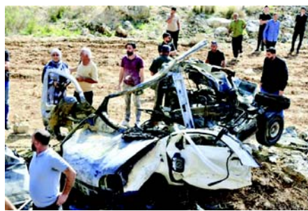
સરકારે તમામ શસ્ત્રોને રાજ્ય નિયંત્રણમાં મર્યાદિત કરવાની યોજનાને મંજૂરી આપી હતી. હિઝબુલ્લાહ આ યોજનાને નકારી કાઢી અને આગ્રહ કર્યો કે જ્યાં સુધી ઈઝરાયેલ દક્ષિણમાં પાંચ કબજે કરેલી સરહદ ચોકીઓ પરથી પાછી ન ખેંચે ત્યાં સુધી તે તેના શસ્ત્રો જાળવી રાખશે. ઈઝરાયેલી સૈન્યએ લેબેનોન પરના હુમલાઓમાં ૪,૦૦૦થી વધુ લોકો મૃત્યુ પામ્યા છે અને લગભગ ૧૦,૦૦૦ ઘાયલ થયા છે, જે ઓક્ટોબર ૨૦૨૩માં શરૂ થયા હતા અને સપ્ટેમ્બર ૨૦૨૪માં પૂર્ણ-સ્તરના આક્રમણમાં ફેરવાયા હતા. યુદ્ધવિરામ હેઠળ, ઈઝરાયેલી સૈન્ય આ જાન્યુઆરીમાં દક્ષિણ લેબેનોનથી પાછી ખેંચી લેવાનું હતું, પરંતુ તેણે માત્ર આંશિક રીતે પાછી ખેંચી લીધી અને પાંચ સરહદ ચોકીઓ પર લશ્કરી હાજરી જાળવી રાખી.

(એજન્સી) લેબેનોનના આરોગ્ય મંત્રાલયે રવિવારે જણાવ્યું કે દક્ષિણ લેબેનોન પર ઈઝરાયેલી હવાઈ હુમલામાં ચાર લોકો મૃત્યુ પામ્યા છે અને ત્રણ અન્ય ઘાયલ થયા છે, જે યુદ્ધવિરામ કરારનું ઉલ્લંઘન છે. સત્તાવાર રાષ્ટ્રીય સમાચાર એજન્સીએ અહેવાલ આપ્યો કે શનિવારે મોડી રાત્રે નાબાતીહ જિલ્લામાં દોહા-કાફરમાન રોડ પર ઈઝરાયેલી ડ્રોન દ્વારા એક વાહન પર હુમલો કરવામાં આવ્યો હતો. એજન્સીએ અહેવાલ આપ્યો કે લક્ષ્ય બનાવેલ વાહન સંપૂર્ણપણે નાશ પામ્યું, જેમાં ચાર લોકો મૃત્યુ પામ્યા છે. પસાર થતી મોટરસાઈકલ પર સવાર બે અન્ય લોકો પણ ઘાયલ થયા હતા. તેણે જણાવ્યું કે ઈઝરાયેલી હુમલામાં મુખ્યત્વે રહેણાંક વિસ્તાર દોહામાં ડઝનેક ઘરોની બારીઓ પણ તૂટી ગઈ હતી. ઈઝરાયેલી સૈન્યએ હુમલાની ખાતરી કરી અને ઘાવો કર્યાં કે તેમાં હિઝબુલ્લાહ અધિકારીઓને નિશાન બનાવવામાં આવ્યા હતા. તાજેતરના અઠવાડિયામાં લેબેનોન-ઈઝરાયેલ સરહદ પર તણાવ વધ્યો છે, તેલ અવીવે નવેમ્બર ૨૦૨૪ સુધી યુદ્ધવિરામ અમલમાં હોવા છતાં, દક્ષિણ શહેરોમાં હવાઈ હુમલાઓ તીવ્ર બનાવ્યા છે. સંરક્ષણ મંત્રી ઈઝરાયેલ કાલો અમેરિકન સંસદિય મીડિયા કંપની X પર લેબેનોન રાષ્ટ્રપતિ દ્વારા હિઝબુલ્લાહને નિઃશસ્ત્ર કરવા માટે કાર્યવાહીમાં વિલંબ કરવાનો આરોપ મૂક્યો હતો, આ પગલું ઈઝરાયેલે માંગ્યું હતું. તેમણે જણાવ્યું કે હિઝબુલ્લાહ 'આગ સાથે રમી રહ્યું છે,' અને ચેતવણી આપી છે જે સમુદાય નિઃશસ્ત્રીકરણનો સંપૂર્ણ અમલ નહીં થાય તો તેઓ હુમલાઓ વધુ તીવ્ર બનાવશે. આ નિવેદન પર લેબેનોન અથવા હિઝબુલ્લાહ તરફથી તાત્કાલિક કોઈ ટિપ્પણી કરવામાં આવી નથી. ઓગસ્ટમાં, લેબેનોન