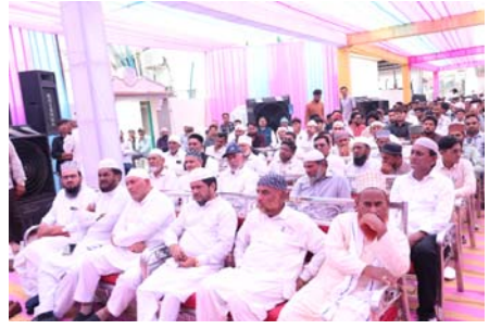
દાતાઓનો આભાર વ્યક્ત કર્યો હતો.

અંજાર, તા.૩ તા.૦૨/૧૧/૨૦૨૫ના કચ્છ જિલ્લાના અંજાર તાલુકાના મથડા ગામ ખાતે સમસ્ત કચ્છી આગરિયા સુન્ની મુસ્લિમ સમાજ દ્વારા ૧૮મી સમૂહ શાદીનું આયોજન કરવામાં આવેલ હતું. જેમાં આગરિયા સુન્ની મુસ્લિમ સમાજના ૧૪ નવદંપતીઓના નિકાહની અદાપગી કરવામાં આવી હતી.