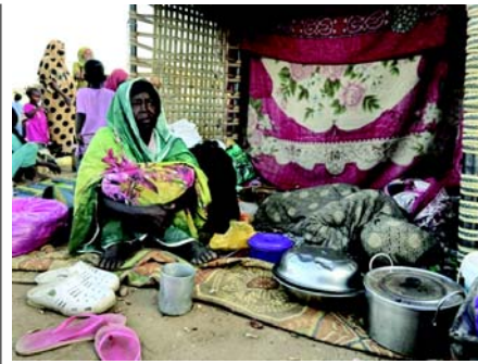
તેમના દળો દ્વારા 'ઉલ્લંઘનો' કરવામાં આવ્યા અને ઘાવો કર્યા કે તપાસ સમિતિઓની રચના કરવામાં આવી છે. ૧૫ એપ્રિલ, ૨૦૨૩થી, સુદાનની સેના અને RSF એક એવા યુદ્ધમાં ફસાયેલા છે જેને સમાપ્ત કરવામાં પ્રાદેશિક અને આંતરરાષ્ટ્રીય મધ્યસ્થી નિષ્ફળ ગઈ છે. યુએન અને સ્થાનિક અહેવાલો અનુસાર, સંઘર્ષમાં ૨૦,૦૦૦ લોકો મૃત્યુ પામ્યા છે અને ૧.૫ લાખથી વધુ લોકોને શરણાર્થીઓ અને આંતરિક રીતે વિસ્થાપિત કર્યા છે.

(એજન્સી) સુદાનના સમાજ કલ્યાણ રાજ્ય મંત્રી સલમા ઈશાકે શનિવારે જણાવ્યું કે પશ્ચિમ સુદાનમાં ઉત્તર દારફૂર રાજ્યની રાજધાની અલ-ફશેરમાં પ્રવેશ્યા પછી રેપિડ સપોર્ટ ફોર્સિસ (RSF) એ પ્રથમ બે દિવસમાં ૩૦૦ મહિલાઓની હત્યા કરી હતી. 'RSFએ અલ-ફશેરમાં પ્રવેશ્યા પછી પ્રથમ બે દિવસમાં ૩૦૦ મહિલાઓની હત્યા કરી,' ઈશાકે એક નિવેદનમાં જણાવ્યું કે, મહિલાઓએ 'જાતીય હુમલો, હિંસા અને ત્રાસનો સામનો કરવો પડ્યો હતો.' ઈશાકે જણાવ્યું કે, 'અલ-ફશેરથી તાવીલાહ (ઉત્તર દારફૂરમાં) મુસાફરી કરનાર કોઈપણ વ્યક્તિ જાંબુમાં છે, કારણ કે અલ-ફશેર-તાવીલાહ રસ્તો મૃત્યુનો રસ્તો બની ગયો છે.' તેમણે ઉમેર્યું કે 'અલ-ફશેરમાં હજુ પણ એવા પરિવારો છે જેમને ખેંચી, ત્રાસ, અપમાન અને જાતીય હિંસાનો ભોગ બનાવવામાં આવી રહ્યા છે.' મંત્રીએ ભારપૂર્વક જણાવ્યું કે 'અલ-ફશેરમાં જે બન્યું તે વંશીય સફાઈનું વ્યવસ્થિત કૃત્ય છે, એક મોટો ગુનો જેમાં દરેક વ્યક્તિ પોતાની મૌનને કારણે સંડોવાયેલ છે.' સ્થાનિક અને આંતરરાષ્ટ્રીય સંગઠનો અનુસાર, ૨૬ ઓક્ટોબરના રોજ, રેપિડ સપોર્ટ ફોર્સિસ અલ-ફશેરનો કબજો મેળવ્યો અને નાગરિકો સામે 'નરસંહાર' કર્યા, એવી ચેતવણીઓ વચ્ચે કે આ હુમલો સુદાનના ભૌગોલિક વિભાજનને વધુ મજબૂત બનાવી શકે છે. બુધવારે, RSF નેતા મોહમ્મદ હમદાન દગાલો (હેમેદી) એ સ્વીકાર્યું કે અલ-ફશેરમાં