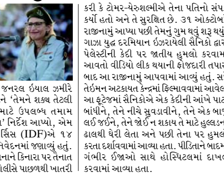
કરી કે ટોમર-યેરુશાલમીએ તેના પતિનો સંપર્ક કર્યો હતો અને તે સુરક્ષિત છે. ૩૧ ઓક્ટોબરે રાજીનામું આપ્યા પછી તેમનું ગુમ થવું શરૂ થયું. ગાઝા યુદ્ધ દરમિયાન ઈઝરાયેલી સૈનિકો દ્વારા પેલેસ્ટીની કેદી પર જાતીય હુમલો કરવામાં આવતો વીડિયો લીક થયાની ફાજદારી તપાસ બાદ આ રાજીનામું આપવામાં આવ્યું હતું. સંદે તેઈમન અટકાયત કેન્દ્રમાં ફિલાવવામાં આવેલા આ ફેટ્ગરમાં સૈનિકોએ એક કેદીની આંખે પાટા બાંધીને, તેને નીચે સુવડાવીને, તેને એક બાજુ લઈ જઈને, તેને જોઈ ન શકાય તે માટે હુલ્લાડના ઢાલથી ઘેરી લેતા અને પછી તેના પર હુમલો કરવા દર્શાવવામાં આવ્યાં હતાં. પીડિતાને બાદમાં ગંભીર જીઓ સાથે હોસ્પિટલમાં દાખલ કરવામાં આવ્યા હતા.

(એજન્સી) ઈઝરાયેલી લશ્કરના ટોચના વકીલ, મેજર જનરલ યિફત તોમર-યેરુશાલમી, જેમણે તાજેતરમાં પેલેસ્ટીની કેદી સાથેના બળાત્કાર કૌભાંડ બાદ રાજીનામું આપ્યું હતું, તેઓ ઘણા કલાકો સુધી ગુમ રહ્યા બાદ, રવિવાર, ૨ નવેમ્બરના રોજ સુરક્ષિત મળી આવ્યા હતા. ઈઝરાયેલી કોન્સ્ટ્રિક્ટિવ કોર્પોરેશન (KAN)ના જણાવ્યા અનુસાર, રવિવારે સવારે તેણી ગુમ થઈ ગઈ હતી, જ્યારે ઉત્તરી તેલ અવીવમાં હાટ્ટુક બીચ નજીક તેની કાર ત્યજ દેવામાં મળી આવી હતી, જેમાં આત્મહત્યાના ઈરાદા દર્શાવતી એક ચિઠ્ઠી પણ હતી. હાલની વીડિયો લીક થયા બાદ ઈઝરાયેલના ટોચના લશ્કરી ફરિયાદીએ રાજીનામું આપ્યું. જવાબમાં, ચીફ