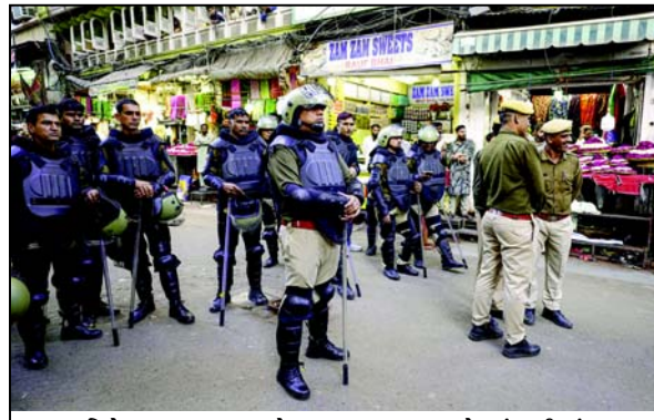
૧૭ ડિસેમ્બર, ૨૦૨૪ના રોજ રાજસ્થાનના અજમેરમાં સૂફી સંત ખ્વાજા મોઈનુદીન ચિશ્તી (ર.અ.)ની દરગાહ પર વાર્ષિક 'ઉર્સ' ઉત્સવ શોભાયાત્રા દરમિયાન સુરક્ષા કર્મચારીઓ હાજર રહ્યા હતા.