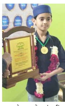
સમાજસેવાના ક્ષેત્રમાં સક્રિય આ બાળકની સેવાભાવના કોઈ સામાન્ય વાર્તા નથી. દર મહિને તેઓ ગરીબ અને જરૂરિયાતમંદ લોકોને પાઠ્ય ક્રીટ વહેંચે છે, ઉપરાંત, અનાથ

બાંગ્લાદેશમાં યુવાનની થયેલી હત્યાના વિરોધમાં સોમવારે અમદાવાદ શહેરના પાલડી વિસ્તારમાં ભજરંગ દળ દ્વારા પ્રદર્શન કરવામાં આવ્યું હતું. પોલીસ ઘટના સ્થળે પહોંચતા ભજરંગ દળના કાર્યકર્તાઓ અને પોલીસ વચ્ચે ઘર્ષણ થયું હતું.