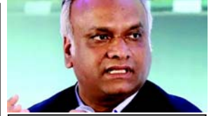
ક્ષણાટકના મંત્રીએ ચેતવણી આપી છે કે આ કાયદો અગાઉના કાયદાને અધિકાર-આધારિત ગ્રામીણ રોજગાર કાર્યક્રમ તરીકેના મુખ્ય વચનથી વિચિત્ર રાખે છે

(એજન્સી) તા. ૨૨ ક્ષણાટકના મંત્રી પ્રિયાંક ખડગેએ સોમવારે કેન્દ્ર સરકારના નવા લાગુ કરાયેલા VB-G RAM G કાયદા ૨૦૨૫ની આડેરી ટીકા શરૂ કરી, જે બે દાયકા જૂના મહાત્મા ગાંધી રાષ્ટ્રીય ગ્રામીણ રોજગાર ગેરંટી કાયદા (MGNREGA)ને બદલે છે. ખડગેએ ચેતવણી આપી હતી કે આ કાયદો અગાઉના કાયદાના આત્મને જ નબળો પાડે છે, તેને અધિકાર-આધારિત ગ્રામીણ રોજગાર કાર્યક્રમ તરીકેના તેના મુખ્ય વચનથી વિચિત્ર રાખે છે. સોશિયલ મીડિયા પ્લેટફોર્મ X પર એક વિગતવાર પોસ્ટમાં, ખડગેએ દલીલ કરી હતી કે નવો કાયદો યોજનાને માંગ-આધારિત કાનૂની હકદારીથી પુરવઠા-આધારિત પદ્ધતિમાં પરિવર્તિત કરે છે. જે ધીમે ધીમે નાગરિકોની કામ કરવાનો અધિકાર કરવાની કમતાને નષ્ટ કરે છે. તેમણે વધુમાં કહ્યું કે કેન્દ્ર પાસે નિર્ણય લેવાની વ્યાપક સત્તા રહેશે, પરંતુ રાજ્યોને નાણાકીય અને વહીવટી જવાબદારીઓનો ભાર ઉઠાવવો પડશે. VB-G RAM G બિલ વિશે ઘણું બધું કહેવામાં આવ્યું છે. પરંતુ બીજા બંધી બાબતો ઉપરાંત, આ ફેરફારો ધીમે ધીમે યોજનાને અસરથી બનાવશે અને આખરે અધિકાર-આધારિત ગ્રામીણ રોજગાર ગેરંટીના વિચારને નાશ કરશે. મંત્રીએ