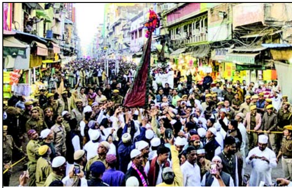
રવિવાર ૨૧ ડિસેમ્બર, ૨૦૨૪ના રોજ રાજસ્થાનના અજમેરમાં સૂફી સંત ખ્વાજા મોઈનુદીન ચિશ્તી (ર.અ.)ની દરગાહ પર વાર્ષિક 'ઉર્સ' ઉત્સવ શોભાયાત્રા દરમિયાન ઢોલ વગાડનારાઓએ શાનદાર પ્રદર્શન કર્યું હતું.