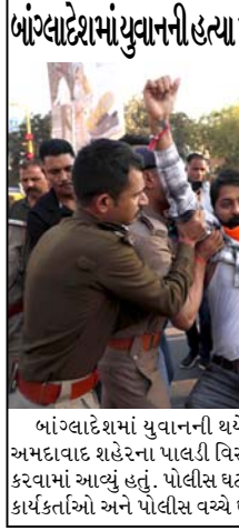
બાંગ્લાદેશમાં યુવાનની થયેલી હત્યાના વિરોધમાં સોમવારે અમદાવાદ શહેરના પાલડી વિસ્તારમાં ભજરંગ દળ દ્વારા પ્રદર્શન કરવામાં આવ્યું હતું. પોલીસ ઘટના સ્થળે પહોંચતા ભજરંગ દળના કાર્યકર્તાઓ અને પોલીસ વચ્ચે ઘર્ષણ થયું હતું.