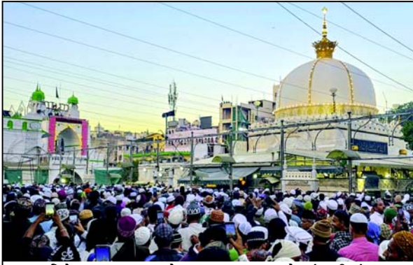
૧૭ ડિસેમ્બર, ૨૦૨૪ના રોજ રાજસ્થાનના અજમેરમાં સૂફી સંત ખ્વાજા મોઈનુદીન ચિશ્તી (ર.અ.)ની દરગાહ પર વાર્ષિક 'ઉર્સ' ઉત્સવ શોભાયાત્રા દરમિયાન હજારો લોકોએ ધ્વજારોહણ સમારોહમાં ભાગ લીધો હતો.