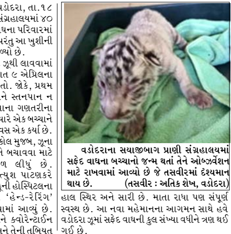
વડોદરા, તા.૧૮ વડોદરાના સયાજીબાગ પ્રાણી સંગ્રહાલયમાં ૪૦ વર્ષના લાંબા વિરામ બાદ સફેદ વાઘના પરિવારમાં નવા મહેમાનનું આગમન થયું છે, પરંતુ આ પુશ્ટીની સાથે શોકનો માહોલ પણ જોવા મળ્યો છે.