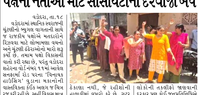
વડોદરા, તા.૧૮ વડોદરામાં સ્થાનિક સ્વરાજની ચૂંટણીનો ભુગ્ધ વાગતાની સાથે જ રાજકીય પક્ષોએ મતદારોને રિજીવવા માટે લોભામણા વચનો અને ચૂંટણી ઢેરાઓનો મારો શરૂ કર્યો છે. તમામ પક્ષો વિકાસની વાતો કરી રહ્યા છે, પરંતુ વડોદરા શહેરના વોર્ડ નંબર ૧૧માં આવેલ સનાકામાં રોડ પરના 'વિનાયક હાઉસિંગ' યુવાના મકાનોની વાસ્તવિકતા કંઈક અલગ જ ચિત્ર રજૂ કરી રહી છે.

અહીં વિકાસ માત્ર કાગળ પર હોય તેમ પ્રાથમિક સુવિધાઓના નામે શૂન્યતા જોવા મળી રહી છે, જેના કારણે સ્થાનિક રહીશોમાં શાસકો સામે ભારે રોષ ફાટી નીકળ્યો છે. વિનાયક હાઉસિંગમાં આવેલા યુવાના આવાસની હાલત અત્યંત બિસ્માર અને જર્જરિત થઈ ગઈ છે. મકાનોના પાણી પૂરવડા અને તિરાડો પડવી અહીં સામાન્ય બાબત બની ગઈ છે. સ્થાનિકોના જણાવ્યા અનુસાર, મકાનોની સ્થિતિ જોતા ગમે ત્યારે કોઈ મોટી હોનારત સર્જઈ શકે તે છે. છતાં તંત્ર દ્વારા આ જોખમી ઈમારતોના સમારકામ કે નવીનીકરણ બાબતે કોઈ જ નક્કર કાર્યવાહી કરવામાં આવતી નથી. લોકો અહીં જીવના જોખમ રહેવા મજબૂર બન્યા છે. આ વિસ્તારમાં રોડ-રસ્તાના