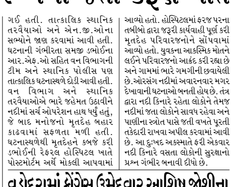
વડોદરા, તા.૧૮ વડોદરા જિલ્લાના ડભોઈ તાલુકામાંથી કાંઈક વાગ્યા સામે આવી છે. ડભોઈ ઓરસંગ નદીમાં ગરમીથી રાહત મેળવવા અને પાણી પીવા ઉતરેલા એક યુવકને મગરે અચાનક ખેંચી જતાં તેનું કડણ મોત નિપજ્યું હતું. આ ઘટનાને પગલે ભિલોડાના ગામ સહિત સમગ્ર પંથકમાં ભારે શોકનું મોજુ કરી વધ્યું છે.

આ બાબતે તાલુકા કક્ષાના ચૂંટણી અધિકારીઓ સમક્ષ રજૂઆતો કરવામાં આવી હોવા છતાં કોઈ કાર્યવાહી કરવામાં આવી નથી. તા.૧૩મી એપ્રિલથી આ પ્રકારની હેરાનગતિના બનાવો બની રહ્યા છે. જેથી જાણે તંત્ર જ ચૂંટણી લડી રહ્યું હોય તેમ લાગી રહે છે. તો આવા કિસ્સાઓની તાકિદે અને તટસ્થ રીતે તપાસ કરી પગલાં લેવા જોઈએ.