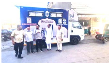
આ વાનનું સંચાલન Khidmate Khalq Charitable Trust, ભરૂચ દ્વારા કરવામાં આવશે.

(સંવાદદાતા દ્વારા) ભરૂચ, તા.૧૮ ભરૂચમાં 'મૈયત ગુસલ વાન' સેવા શરૂ કરવામાં આવી છે, જે સંપૂર્ણ આધુનિક અને જરૂરી સુવિધાઓથી સજ્જ છે. આ વાન કોઈપણ સ્થળે પહોંચી મૈયતને શરિયત મુજબ ગુસલ આપવાની સુવિધા પૂરી પાડે છે, જેથી મૃત્યુ પામનારનો માન અને સન્માન જળવાઈ રહે.