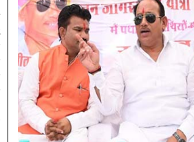
વહીવટીતંત્રના મનોબળને તોડતી નથી, પરંતુ કાયદાના શાસન પર પણ હુમલો છે. નિવેદનમાં કાયદાના શાસન પર પણ હુમલો છે. નિવેદનમાં કાયદામાં ઉમેર્યું છે કે, જમપ્રતિનિધિઓ પાસેથી સંયમ અને ગરિમા જાળવવાની અપેક્ષા રાખવામાં આવે છે અને આવા વર્તનને એસોસિએશનના મતે આવી ધમકીઓ માર

(એજન્સી) બોધાલ, તા. ૨૨ મધ્યપ્રદેશમાં ભાજપના ધારાસભ્ય પ્રીતમ લોધી દ્વારા એક પોલીસ અધિકારીને જાહેરમાં ધમકાવવાના મામલે રાજ્યનું IPS ઓફિસરને એસોસિએશન લાલચુમ થયું છે. એસોસિએશને લોધીની ભાષાને 'અશ્લીલ, અશોભનીય અને લોકતાંત્રિક મર્યાદાઓથી વિપરત' ગણાવી તેને તેની કડક પગલામાં નિંદા કરી છે. આ વિવાદ હવે રાજ્યના રાજકારણ અને વહીવટીતંત્રમાં ચર્ચાનું કેન્દ્ર બન્યો છે. IPS એસોસિએશને વ્યક્ત કરી નારાજગી IPS ઓફિસરને એસોસિએશને જારી કરેલા એક નિવેદનમાં જણાવ્યું છે કે, સબ-ડિવિઝનલ ઓફિસર એક પોલીસ (SDOP) આયુષ્ય જામવ વિરૂદ્ધ ધારાસભ્ય દ્વારા કરવામાં આવેલી ટિપ્પણીઓ અત્યંત નિંદનીય છે. આ મુદ્દાને એસોસિએશનના મતે આવી ધમકીઓ માર