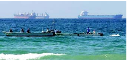
લાવવા માટેના વિકલ્પો શોધવા માટે વિદેશ અને ગૃહ પ્રધાનોને મળવાની અપેક્ષા રાખે છે. ડોનાલ્ડ ટ્રમ્પે ઈરાન સાથે યુદ્ધવિરામ અનિશ્ચિત સમય માટે લંબાવવાની જાહેરાત કર્યા પછી ભુખવારે તેલના ભાવમાં ઘટાડો થયો. નેટવર્ક મોનિટરિંગ ગ્રુપ નેટબ્લોક્સે જણાવ્યું હતું કે મેટ્રિક્સ દર્શાવે છે કે ઈરાન ૧, ૨૭૨ કલાકથી વધુ સમય સુધી ચાલેલા રાષ્ટ્રવાપી ઈન્ક્ટરનેટ બ્લેકઆઉટના પડઠા દિવસમાં પ્રવેશી ગયું છે. જૂથે કહ્યું કે સતત બંધ અપ્રમાણસર હતું અને જમીન પર માનવાધિકાર ઉલ્લંઘનના કથિત ઉલ્લંઘનને છુપાવી રહ્યું હતું. ઈરાનના શિક્ષણ પ્રધાન અલીરેઝા કાઝેમીએ જણાવ્યું હતું કે યુએસ-ઈરાનથી હુમલાઓમાં નુકસાન પામેલી ૧, ૩૦૦ શાળાઓમાંથી ૭૭૫ શાળાઓનું સમારકામ કરવામાં આવ્યું છે, કાઝેમીએ જણાવ્યું હતું કે લગભગ ૨૦ શાળાઓ નાશ પામી હતી, જેમાં સૌથી વધુ નુકસાન તેહરાન, કરમાનશાહ, ઈસ્ફહાન અને હોર્મોઝગન પ્રાંતોમાં થયું હતું. તેમણે ઉમેર્યું હતું કે સૌથી વધુ નુકસાન પામેલી શાળાઓનું સમારકામ ઓક્ટોબર સુધીમાં પૂર્ણ થવાની ધારણા છે. બ્લુમબર્ગ એનાલિટિક્સ ફર્મ વોર્ટક્સના શિપિંગ ડેટાને ટાંકીને અહેવાલ આપ્યો છે કે યુએસ પ્રતિબંધ છતાં ઈરાન કૂડ ઓઈલ નિકાસ ચાલુ રાખે છે, ટેકરો પ્રતિબંધોને બાયપાસ કરીને વૈશ્વિક બજારો સુધી પહોંચવામાં સફળ રહે છે. ડોનાલ્ડ ટ્રમ્પે કહ્યું હતું કે હોર્મોઝ સ્ટ્રેટ બંધ થવાને કારણે ઈરાન “આર્થિક રીતે તૂટી રહ્યું છે”. દુધ સોશિયલ પોસ્ટમાં, તેમણે ઘાવો કર્યો હતો કે તેહરાન ઈઝ્મિર જેટલા કોઈપણ નાકાબંધી ફરીથી ખોલવામાં આવે અને “રોકડ માટે ભૂખ્યા” હતા, એએફપીના અહેવાલ મુજબ. ઈરાનના ન્યાયતંત્રે જણાવ્યું હતું કે એક નાગરિક સંવેદનશીલ માસિકી પ્રસારિત કરવા બદલ દોષિત કર્યો હતો અહેવાલો અનુસાર, ઈઝરાયેલીની મોસાદ ગુપ્તચર એજન્સીને મુલ્ટુડેડની સજા ફટકારવામાં આવી છે.