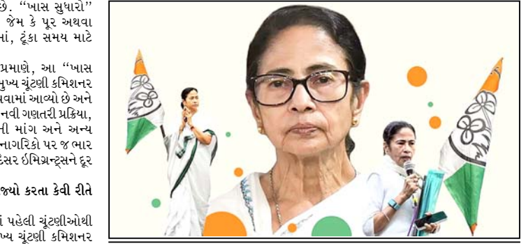
જવાહર સિરકાર બંગાળમાં SIRના કારણે ભાજપે કેવી રીતે પોતાને જ નુકસાન કર્યું તે અંગે વાત કરે છે