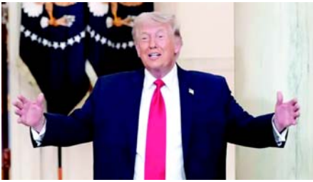
જણાવ્યું હતું કે ઈરાનનું બિન-પ્રતિબદ્ધ જાહેર વલણ વોશિંગ્ટન પર દબાવી લાવવાનો પ્રયાસ છે. યુનાઈટેડ સ્ટેટ્સ અને ઈરાન વચ્ચેનો ધાર્મિક મુદ્દા સંકળિત હવે શમતાઓનો સંઘર્ષ નથી, પરંતુ રાજકીય સહનશક્તિ અને સોદાબાજીના લાભનો સંઘર્ષ છે. ચાલુ અનિશ્ચિતતા છતાં, સંઘર્ષને સમાપ્ત કરવા માટે સૌદામી આશાઓ વચ્ચે મંગળવારે શેરબજારમાં વધારો થયો હતો. યુદ્ધના બીજા મોરચે, ઈઝરાયેલ અને લેબેનોન, જેમના કોઈ રાજદ્વારી સંબંધો નથી, તેઓ ગુરૂવારે વોશિંગ્ટનમાં નવી વાટાઘાટો કરશે. શુક્રવારે બંને રાષ્ટ્રો વચ્ચે ૧૦ દિવસનો અલગ યુદ્ધવિરામ થયો હતો અને તેમાં ડિઝાબલ્ડલોનો પણ સમાવેશ થયો હતો. હળવી હિંસા ચાલુ રહી છે અને ઈઝરાયેલની સેનાએ નાગરિકોને દક્ષિણ લેબેનોનના ડાઉનબંધ ગામોમાં પાછા ફરવા સામે ચેતવણી આપી હતી. ઈઝરાયેલી સેનાએ જણાવ્યું હતું કે “હિઝબુલ્લાહ આતંકવાદી સંગઠને લેબેનોનમાં તેના સૈનિકો પર ઘણા રોકેટ છોડ્યા હતા અને જે લોન્ચરથી રોકેટ છોડવામાં આવ્યા હતા તે લોન્ચર પર હુમલો કર્યો હતો. લેબેનોન પર ઈઝરાયેલી હુમલાઓમાં યુદ્ધની શરૂઆતથી ઓછામાં ઓછા ૨,૪૫૪ લોકો માર્યા ગયા છે. હિઝબુલ્લાહ જણાવ્યું હતું કે તેણે મંગળવારે ઉત્તર ઈઝરાયેલ પર હુમલો કર્યો હતો, જે ઈઝરાયેલી દ્વારા યુદ્ધવિરામના ઉલ્લંઘનને બદલી દેશે.”