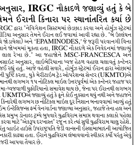
હુમલા કર્યાં અને દક્ષિણમાં આક્રમણ કર્યું. શુક્રવારથી શરૂ થયેલા યુદ્ધવિરામ છતાં ઈઝરાયેલી સૈનિકો હજુ પણ દક્ષિણ લેબેનોનમાં સક્રિય છે, સંરક્ષણ પ્રધાન ઈઝરાયેલ કાબે રિખવારે કહ્યું હતું કે, જો ધમકી આપવામાં આવશે તો તેઓ ‘સંપૂર્ણ ભંગ’નો ઉપયોગ કરશે. યુદ્ધવિરામની શરતો હેઠળ, ઈઝરાયેલ કહે છે કે, તે ‘આયોજિત, નિકટવર્તી અથવા હુમલાઓ’ સામે કાર્યવાહી કરવાનો અધિકાર અનામત રાખે છે.

(એજન્સી) બેરુત, તા. ૨૨ ઈઝરાયેલ અને ઈરાન સમર્થિત હિઝબુલ્લાહ વચ્ચે ચાલી રહેલા યુદ્ધવિરામ છતાં ભુખવારે લેબેનોનના બેકા પ્રદેશ પર ઈઝરાયેલી હુમલામાં એક વ્યક્તિનું મોત થયું હતું અને બે અન્ય ધાયલ થયા હતા. એમ લેબેનોનના રાજ્ય મીડિયાએ અહેવાલ આપ્યો હતો. “પશ્ચિમ બેકામાં અલ-જાબુરની બહાર વહેલી સવારે દુરમન ગ્રોન દ્વારા કરવામાં આવેલા હુમલામાં એક વ્યક્તિનું મોત થયું હતું અને બે અન્ય ધાયલ થયા હતા,” લેબેનોનની રાજ્ય સંચાલિત રાષ્ટ્રીય પેસિફિક નેશનલ (NNA)એ અહેવાલ આપ્યો હતો. હિઝબુલ્લાહ મંગળવારે જણાવ્યું હતું કે, તેણે ‘સ્મષ્ટ’ ઈઝરાયેલી યુદ્ધવિરામ ઉલ્લંઘનના જવાબમાં ઉત્તર ઈઝરાયેલમાં એક સ્થળ પર રોકેટ અને હુમલો ગ્રોન છોડ્યા હતા, જેમાં તેણે કહ્યું હતું કે, “નાગરિકો પર હુમલા અને તેમના ઘરો અને ગામગણોનો વિનાશ” સામેલ છે. ઈઝરાયેલી સૈન્યએ તે દિવસે કહ્યું હતું કે, હિઝબુલ્લાહ દક્ષિણ લેબેનોનમાં તૈનાત સૈનિકો પર “ઘણા રોકેટ છોડ્યા” હતા અને સૈન્યએ જવાબમાં લોન્ચર પર હુમલો કર્યો હતો. NNAએ ભુખવારે ઈઝરાયેલના હાલમાં કબજા હેઠળના દક્ષિણ નગરોમાં ઈઝરાયેલી તોપમારો અને તોડફોડની જાણ કરી હતી. ૨ માર્ચે હિઝબુલ્લાહ તેના સમર્થક ઈરાનના સમર્થનમાં મધ્ય-પૂર્વ યુદ્ધમાં પ્રવેશ્યા પછી, ઈઝરાયેલે લેબેનોનમાં મોટા