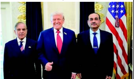
ટ્રમ્પ દ્વારા યુદ્ધવિરામ લંબાવવાનો કોઈ અર્થ નથી; હારનાર પક્ષ શરતો નક્કી કરી શકતો નથી. પાકિસ્તાનના વડાપ્રધાન શેહબાઝ શરીફ X પર એક પોસ્ટમાં યુદ્ધવિરામ લંબાવવા બદલ યુએસ પ્રમુખ ડોનાલ્ડ ટ્રમ્પનો આભાર માન્યો, અને કહ્યું કે આ નિર્ણયથી રાજદ્વારી પ્રયાસો ચાલુ રહેશે. મારા વ્યક્તિગત અને ફિલ્મ માર્શલ સેવદ અસીમ મુનીર વતી, હું રાષ્ટ્રપતિ ટ્રમ્પનો હૃદયપૂર્વક આભાર માનું છું કે તેમણે ચાલુ રાજદ્વારી પ્રયાસો માટે યુદ્ધવિરામ લંબાવવાની અમારી વિનંતીને ઠોઠાટાથી સ્વીકારી છે. આશા છે કે બંને પક્ષો યુદ્ધવિરામનું પાલન કરશે અને ઈસ્લામાબાદમાં યોજનારી આગામી વાટાઘાટોમાં વ્યાપક “શાંતિ કરાર” તરફ કામ કરશે.

અમેરિકા રાષ્ટ્રપતિ ડોનાલ્ડ ટ્રમ્પે પાકિસ્તાનની વિનંતી પછી ઈરાન યુદ્ધવિરામ લંબાવ્યો છે, જેમાં અસીમ મુનીર અને શેહબાઝ શરીફની અપીલનો ઉલ્લેખ કરવામાં આવ્યો છે અને ઈરાન દ્વારા એકીકૃત દરખાસ્ત રજૂ ન થાય ત્યાં સુધી હોર્મુઝ નાકાબંધી અને લશ્કરી તૈયારી જાળવી રાખવાની જાહેરાત કરી છે. અમેરિકા રાષ્ટ્રપતિ ડોનાલ્ડ ટ્રમ્પે મંગળવારે ઈરાન સાથે યુદ્ધવિરામ લંબાવવાની જાહેરાત કરી, કહ્યું કે જ્યાં સુધી ઈરાની નેતાઓ એકીકૃત દરખાસ્ત રજૂ ન કરે અને ચાલુ ચર્ચામાં પૂર્ણ ન થાય ત્યાં સુધી તે યથાવત રહેશે. ટ્રમ્પે કહ્યું કે આ નિર્ણય પાકિસ્તાન દ્વારા વધુ લશ્કરી કાર્યવાહીમાં વિલંબ કરવા અને રાજદ્વારી માટે સમય આપવાની વિનંતીને અનુસરીને લેવામાં આવ્યો છે. ટ્રમ્પે કહ્યું કે આ નિર્ણય અસીમ મુનીર અને વડાપ્રધાન શેહબાઝ શરીફ સહિત પાકિસ્તાનના નેતૃત્વની સુધી અપીલ બાદ લેવામાં આવ્યો હતો. મેં અમારી સેનાને નાકાબંધી ચાલુ રાખવા અને અન્ય તમામ બાબતોમાં, તૈયાર અને સક્ષમ રહેવાનો નિર્દેશ આપ્યો છે, અને તેથી જ્યાં સુધી યુદ્ધવિરામ લંબાવવાનો પ્રસ્તાવ રજૂ ન થાય અને ચર્ચાઓ પૂર્ણ ન થાય ત્યાં સુધી યુદ્ધવિરામ લંબાવી છે. ઈરાનના મુખ્ય વાટાઘાટકાર અને સંસદીય સ્પીકરના સલાહકાર, ડોહમદદ બાકર ગાલિબાકે મંગળવારે જણાવ્યું હતું કે યુએસ પ્રમુખ ડોનાલ્ડ ટ્રમ્પનો યુદ્ધવિરામ લંબાવવાનો નિર્ણય સંબંધિત અચાનક હુમલો કરવા માટે “સમાય મેળવવાનું કાવતરું” છે. આ સલાહકારે ચેતવણી આપી હતી કે ઈરાની બંદરો પર સતત યુએસ નાકાબંધી બોમ્બારા જેવી જ છે અને તેનો લશ્કરી જવાબ આપવો જોઈએ.