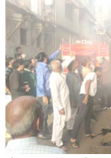
ભોંયરામાં આગ લાગી હોવાથી

અમદાવાદ, તા. ૨૪ શહેરના કોટ વિસ્તારમાં આવેલા ધમધમતા માણેકચોક વિસ્તારમાં આગની ઘટના બનતા અકરાતફરી મચી હતી. અહીં આવેલી જીણાભાઈ ચેમ્બર્સના ભોંયરામાં અચાનક આગ ફાટી નીકળી હતી. ભરચક બજારમાં આગ લાગવાના સમાચાર મળતા જ વેપારીઓ અને ગ્રાહકોમાં ફફડાટ વ્યાપી ગયો હતો. સદનસીબે, ફાયર વિભાગની ત્વરિત કામગીરીને કારણે મોટી જાનહાનિ ટળી છે. આગ જીણાભાઈ ચેમ્બર્સના ભોંયરામાં આવેલી વીજ મીટર પેટીમાં લાગી હતી. મીટર પેટીમાં અચાનક ઘડાકા પાડી આગ લાગ્યા બાદ ધુમાડાના ગોઠેગોટા બહાર નીકળવા લાગ્યા હતા. પ્રાથમિક દૃષ્ટિએ ગલીઓ અને રસ્તા પરના લાગી હોવાનું મનાઈ રહ્યું છે.