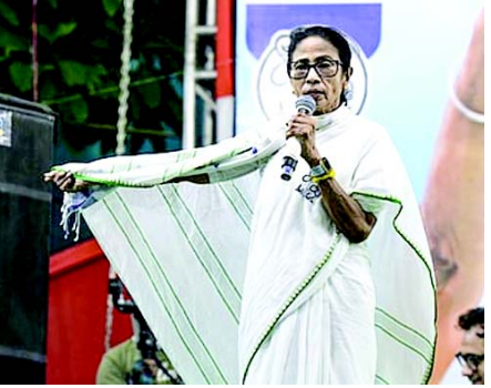
છે. તેમણે લોકોને મતભેદોથી ઉપર ઉઠીને ફરી એકવાર TMCને મતદાન કરીને બંગાળની ઓળખ માટે સર્વસંમતિથી મતદાન કરવા વિનંતી કરી હતી.

(એજન્સી) કોલકાતા, તા.૨૪ પશ્ચિમ બંગાળના મુખ્યમંત્રી મમતા બેનરજીએ શુક્રવારે ભાજપ પર નિશાન સાધ્યું અને તેમના પર રાજ્યના રાજકારણ પર ‘હુકમ’ ચલાવવાનો અને તેના લોકોને વિભાજિત કરવાનો અને તેની સંસ્કૃતિને વિકૃત કરવાનો પ્રયાસ કરવાનો આરોપ મૂક્યો, અને ભારપૂર્વક કહ્યું કે આવા પ્રયાસોનો પ્રતિકાર કરવામાં આવશે. પશ્ચિમ બંગાળમાં મહત્વપૂર્ણ વિધાનસભા ચૂંટણીના પ્રથમ તબક્કાના મતદાનના એક દિવસ પછી, ઠ પર એક પોસ્ટમાં, મમતાએ રાજ્યની ઓળખનું રક્ષણ કરવા માટે લોકોના દૈનિક નિશ્ચયને કારણે ઉચ્ચ મતદાન થયું હોવાનું જણાવ્યું. તેમણે ભારપૂર્વક જણાવ્યું કે આ રાજ્ય દિલ્હીથી ચલાવવામાં આવશે નહીં કે નિર્દેશિત કરવામાં આવશે નહીં.