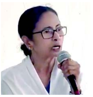
છે, ત્યારે ભાજપને દિલ્હીમાંથી પણ હાંકી કાઢવો જોઈએ. બેનરજી તેમના પક્ષના ઉમેદવાર અને બે વખતના વર્તમાન પારાસભ્ય નયના બંદોપાધ્યાય માટે પ્રચાર કરી રહ્યા હતા, જે તેમના ભાજપ હરીફ સંતોષ પાઠક સામે ચૂંટણી લડી રહ્યા છે. ભાજપ પર નિશાન સાધતા તેમણે કહ્યું કે તેમણે ભાજપ માટે કામ કરતા દરેક વ્યક્તિના

(એજન્સી) તા.૨૪ પશ્ચિમ બંગાળના મુખ્યમંત્રી મમતા બેનરજીએ ગુરુવારે રાજ્યના એક ભાગમાં મતદાન થતાં ભાજપ પર હુમલો કર્યો છે, અને જણાવ્યું છે કે વિધાનસભા ચૂંટણી જીત્યા પછી તેઓ પોતાનું ધ્યાન દિલ્હી તરફ વાળશે. તેમના પર વળતો પ્રહાર કરતા, કેન્દ્રીય ગૃહમંત્રી અમિત શાહે કહ્યું કે બંગાળમાં તેમના માટે કંઈ બચ્ચું નથી. કોલકાતાના ચોરંગી વિસ્તારમાં એક રેલીમાં બોલતા, મુખ્યમંત્રીએ કહ્યું કે તેઓ વિપક્ષી પક્ષોને એકસાથે લાવીને કેન્દ્રમાં ભાજપને ‘દૂર’ કરશે. યાદ રાખો, તમે અમને હરાવી શકતા નથી. અમે અન્યાય સામે લડીએ છીએ; અમે અમારા અધિકારો માટે લડીએ છીએ. મારો જન્મ બંગાળમાં થયો હતો, અને હું આ જ બંગાળમાં મારા છેલ્લા શ્વાસ લઉંશ. બંગાળમાં વિજય મેળવ્યા પછી હું દિલ્હીનો કબજો લઉંશ. હું બધા રાજકીય પક્ષોને એકસાથે ભેગા કરીને આવું કરીશ. મને સાનની પુરસ્કૃતિ નહીં; હું દિલ્હીમાં ભાજપનો સંપૂર્ણ નાશ ઉચ્છેદું છું. જ્યારે બંગાળમાં તેમનો વિનાશ અનિવાર્ય