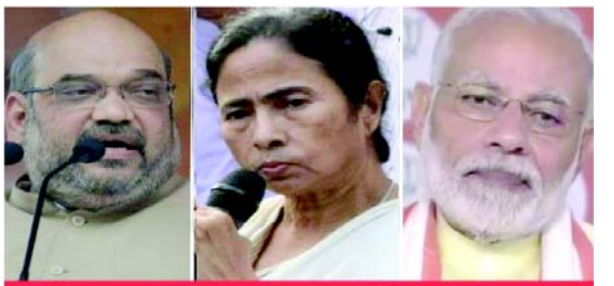
અમિત શાહ મમતા બનર્જી નરેન્દ્ર મોદી

લોકોએ પ્રથમ તબક્કામાં મતદાન કર્યું હતું. મુશ્કેલી ઊભી કરી શકે છે. જજે કમિશનને છેલ્લા પાંચ વર્ષમાં બાઈક ગેંગ સાથે સંકળાયેલા કેટલા કેસ નોંધાયા છે તેનો ડેટા આપવા પણ કહ્યું.