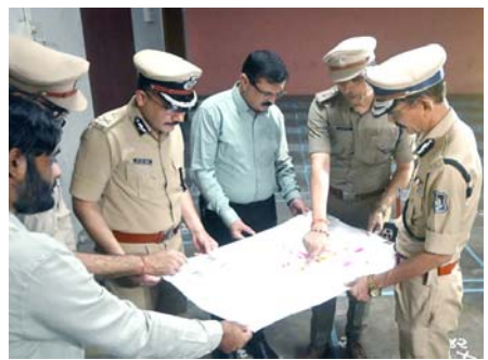
મત પેટી અહીં આવશે. LD કોલેજમાં ૨૭ અને ગુજરાત કોલેજમાં ૨૯ વોર્ડની મતગણતરી રાખવામાં આવી છે.

(સંવાદદાતા દ્વારા) અમદાવાદ, તા. ૨૪ અમદાવાદમાં મતગણતરી માટે તમામ તૈયારીઓ થઈ ચૂકી છે, ૨૬ એપ્રિલના રોજ મતદાન યોજાશે અને ૨૮ તારીખે મતગણતરી હાથ ધરવામાં આવશે, મતગણતરી LD એન્જિનિયરિંગ અને ગુજરાત કોલેજમાં થશે જેથી પોલીસની શ્રી લેયર સુરક્ષા ગોઠવાઈ આવેલી છે, ફર્સ્ટ લેયરમાં CRPF, સેકન્ડ લેયરમાં હથિયારી પોલીસ અને ત્યારબાદ અન્ય પોલીસ પણ તેનાત કરવામાં આવી છે. કુલ ૮ હજાર પોલીસ તેનાત રહેશે અને ૨૬ તારીખે ચૂંટણી બાદ