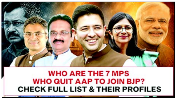
WHO ARE THE 7 MPS WHO QUIT AAP TO JOIN BJP? CHECK FULL LIST & THEIR PROFILES

(એજન્સી) નવી દિલ્લી, તા. ૨૪ આમ આદમી પાર્ટી (AAP) માટે એક અત્યંત આઘાતજનક સમાચાર સામે આવ્યા છે. પાર્ટીના વરિષ્ઠ નેતા અને રાજ્યસભા સાંસદ રાઘવ ચઢ્ઢાએ જાહેરાત કરી છે કે, તેઓ અન્ય છ સાંસદો સાથે મળીને પક્ષ છોડી રહ્યા છે અને ભારતીય જનતા પાર્ટી (BJP)માં ભળી જવાનો નિર્ણય કર્યો છે. આ પગલું જો વાસ્તવિકતામાં પરિણમશે તો સાંસદોમાં AAPનું સંખ્યાબળ નોંધપાત્ર રીતે ઘટશે અને દેશના રાજકીય સમીકરણમાં મોટો ફેરફાર જોવા મળશે. આ તમામ નેતાઓ ટૂંક સમયમાં દિલ્લીમાં ભાજપના રાષ્ટ્રીય અધ્યક્ષ સાથે મુલાકાત કરે તેવી શક્યતા છે.