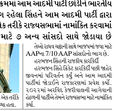
રાજ્યમાંથી તેમના પાંચ ઉમેદવારોમાંથી એક તરીકે રાજ્યસભામાં નામાંકિત કરવામાં આવ્યા હતા. તેઓ રાઘવ ચઢ્ઢાની સાથે ભાજપમાં જવા માટે AAPના 7/10 AAP સાંસદોનો ભાગ છે. હરભજન સિંહને રાજકીય કારકિર્દી હરભજન સિંહે ક્રિકેટ કારકિર્દી પછી જાહેર જીવનમાં પરિવર્તન કર્યું અને આમ આદમી પાર્ટીમાં ચૂંટાઈને રાજકારણમાં પ્રવેશ કર્યો. ૨૦૨૨માં અરવિંદ કેજરીવાલની આગેવાની હેઠળની પાર્ટીએ તેમને રાજ્યસભા માટે નામાંકિત કર્યાં.

ભારતના પૂર્વ ક્રિકેટર હરભજન સિંહે શુક્રવારે એક મોટા ઘટનાક્રમમાં આમ આદમી પાર્ટી છોડીને ભારતીય જનતા પાર્ટીમાં જોડાયા છે. બે વર્લ્ડ કપ વિજેતા પક્ષોનો ભાગ રહેલા સિંહને આમ આદમી પાર્ટી દ્વારા ૨૦૨૨માં પંજાબ રાજ્યમાંથી તેમના પાંચ ઉમેદવારોમાંના એક તરીકે રાજ્યસભામાં નામાંકિત કરવામાં આવ્યા હતા. તેઓ રાઘવ ચઢ્ઢાની સાથે ભાજપમાં જવા માટે ૭ અન્ય સાંસદો સાથે જોડાયા છે (એજન્સી) તા. ૨૪ આમ આદમી પાર્ટીના સાંસદ અને પૂર્વ ભારતીય ક્રિકેટર હરભજન સિંહ ભાજપમાં જોડાયા છે. શુક્રવારે એક મોટી ઘટનાક્રમમાં ભારતીય જનતા પાર્ટીમાં જોડાવા માટે ભારતના પૂર્વ ક્રિકેટર હરભજન સિંહ આમ આદમી પાર્ટી છોડીને ભારતીય જનતા પાર્ટીમાં જોડાયા છે. બે વર્લ્ડ કપ વિજેતા પક્ષોનો ભાગ રહેલા સિંહને આમ આદમી પાર્ટી દ્વારા ૨૦૨૨માં પંજાબ રાજ્યસભામાં નામાંકિત કરવામાં આવ્યા હતા.