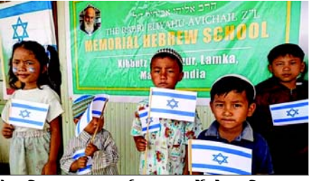
મધ્ય પૂર્વથી દૂર, ઈઝરાયેલ ભારતમાં એક મોન મિશન હાથ ધર્યું. ગયા વર્ષે બેન્જામિન નેતન્યાહૂ દ્વારા જાહેરાત કરવામાં આવી હતી, ઈઝરાયેલે ગુરુવારે તેના ઓપરેશન વિંગ્સ ઓફ ડેનના ભાગ રૂપે બનેઈમેનાશે સમુદાયના લગભગ ૨૫૦ સભ્યોને એરલિફ્ટ કર્યા હતા

(એજન્સી) ઈરાનથી લગભગ ૪,૦૦૦ કિમી દૂર, ઈઝરાયેલ ભારતમાં બીજું એક ઓપરેશન હાથ ધરી રહ્યું છે. ઓપરેશન વિંગ્સ ઓફ ડેન નામનું આ મિશન ઉત્તરપૂર્વની પહાડીઓમાં બનેઈમેનાશે સમુદાયના લગભગ ૫,૦૦૦ સભ્યોને મહિપુરથી તેલ અવીવ લઈ જવામાં આવી રહ્યા છે. કેટલાક લોકો માટે તે એક હિંસાચૂર પ્રદેશથી બીજા પ્રદેશમાં પ્રવાસ છે. પરંતુ મોટાભાગના બનેઈમેનાશે સમુદાયના સભ્યો માટે જેઓ ઈઝરાયેલના બાઈબલના ‘લુપ્ત આદિવાસીઓ’માંથી એકમાં મૂળ ધરાવે છે, તે તેમના પૂર્વજોના ધર સુધીની લાંબી યાત્રાનો અંત છે. ઈઝરાયેલી સરકારે ગુરુવારે દિલ્હી દ્વારા લગભગ ૨૫૦ સમુદાયના સભ્યોના પ્રથમ જૂથને એરલિફ્ટ કર્યું. ગયા વર્ષે, બેન્જામિન નેતન્યાહૂ સરકારે ભારતમાંથી સમુદાયના