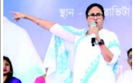
યાદીમાંથી કાઢી નાખવામાં આવ્યા છે, જ્યારે તેમના મતવિસ્તારમાં પણ મતદારોના નામ કાઢી નાખવામાં આવ્યા છે. મને વિંતા નથી, મને લોકોમાં વિશ્વાસ છે; અમને મતદાર યાદીમાં કાઢીના બધા મત મળશે.

(એજન્સી) તા.૧૦ મમતા બેનરજીએ શુક્રવારે આરોપ લગાવ્યો કે ભાજપે આસામની ચૂંટણી માટે બહારથી લોકોને લાવી છે અને દાવો કર્યો કે તેમને ઉત્તરપૂર્વીય રાજ્યના રહેવાસીઓ પાસેથી મત મેળવવામાં વિશ્વાસનો અભાવ છે. ઉત્તર ૨૪ પરગણા જિલ્લાના તેતુલિયા ખાતે એક ચૂંટણી રેલીને સંબોધતા, તેમણે દાવો કર્યો કે ભાજપની આગેવાની હેઠળની કેન્દ્ર સરકાર હેઠળ દેશની કોઈપણ એજન્સી ટટચ રહી નથી અને "ભગવા પક્ષે તે બધાને ખરીદી લીધા છે. ઉત્તર પ્રદેશથી ૫૦,૦૦૦ લોકોને આસામ લાવવામાં આવ્યા હતા."