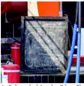
કંપનીએ આ પ્રદેશને ઉચ્ચ જોખમી ક્ષેત્ર તરીકે વર્ગીકૃત કરવાનું ચાલુ રાખે છે.

(એજન્સી) નવી દિલ્હી, તા.૧૦ પશ્ચિમ એશિયામાં ચાલી રહેલા સંકટ વચ્ચે, દેશની સૌથી મોટી ખાનગી કૈનગી તેલ રિફાઈનિંગ કંપની - રિલાયન્સ ઇન્ડસ્ટ્રીઝ લિમિટેડે તેના પેટ્રોલ પંપ પર ઈંધણ વેચાણ પર મર્યાદા લાદી છે. ગ્રાહકોને હવે પ્રતિ ટ્રાન્ઝેક્શન આશરે રૂ. ૧૦૦૦ (લગભગ ૧૧ ગેલોન)ની કિંમતનું પેટ્રોલ અથવા ડીઝલ પૂરું પાડવામાં આવી રહ્યું છે.