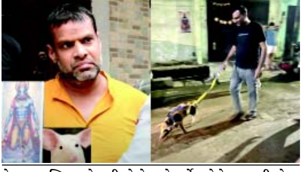
કેટલાક મુસ્લિમ રહેવાસીઓએ દાવો કર્યો હતો કે આ પ્રાણીઓના નામ "અબ્દુલ" અને "સુલતાન" છે અને જ્યારે તેઓ પસાર થાય છે ત્યારે જ તેમને આ નામે બોલાવવામાં આવે છે

પરિસ્થિતિએ વધુ તીવ્ર વળાંક લીધો હતો. ગયા વર્ષે દિવાળી પહેલા, ગલી નંબર ૩માં પરિવારોએ પાંચ ભૂંડ મેળવ્યા અને તેમને તેમના ઘરની બહાર પાંજરામાં રાખ્યા. એક પછી એક પ્રાણીઓ મૃત્યુ પામ્યા. હિન્દુ રહેવાસીઓએ તેમના મુસ્લિમ પડોશીઓને ઘણી ઠેરવ્યા અને દાવો કર્યો કે ભૂંડોને જેર આપવામાં આવ્યું હતું અને મોં પર ફીણ અને શરીરનો વાદળી રંગ જેવા લક્ષણો તરફ ધ્યાન દોર્યું, જે તેઓએ કહ્યું કે પશુચિકિત્સકોએ જેરને જવાબદાર ગણાવ્યું હતું. આ દાવાને સમર્થન આપવા માટે કોઈ તબીબી પુરાવા રજૂ કરવામાં આવ્યા ન હતા. મુસ્લિમ રહેવાસીઓએ અલગ નિવેદન આપ્યું. તેઓએ કહ્યું કે, પ્રાણીઓને પૂરતી કાળજી વિના, તડકા અને વરસાદ બંનેમાં કઠોર હવામાનમાં ખુલ્લા રાખવામાં આવ્યા હતા અને જ્યારે પણ મીડિયા આવે ત્યારે દોષ તેમના પર જ બોલાવવામાં આવતો હતો. એક મુસ્લિમ પોતાના ઘરની બહારના સીસીટીવી કેમેરા ફૂટેજમાં પ્રાણીઓના મલિકો તેમને ખવડાવતા પહેલા કોઈ અજાણ્યા પદાર્થનું ઈન્જેક્શન આપતા દેખાયા, તેમણે ધ્રુવ સાથે ફૂટેજ શેર કરતા કહ્યું. તેમણે નિર્દેશ કર્યો કે ઈન્જેક્શન આપ્યા પછી ડુકર દેખીતી રીતે બુમો પાડી રહ્યા હતા. પ્રાણીઓ સાથેના ખરાબ વર્તન અંગે દિલ્હી મ્યુનિસિપલ કોર્પોરેશનમાં ફરિયાદ નોંધાવવા છતાં, બારીને તેમના મૃત્યુ માટે દોષી ઠેરવવામાં આવે છે. મૃત્યુ અંગે કોઈ ઓપિયારિક ફરિયાદ તેમની સામે દાખલ કરવામાં આવી નથી.