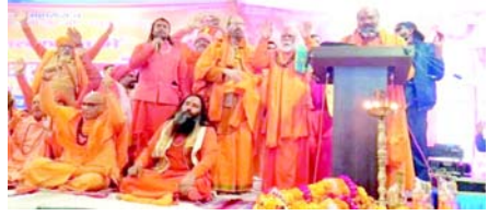
અનુરાગ ઠાકુર અને પરવેશ વર્માના 'ગોલી મારો' (તેમને ગોળી મારી દો) ભાષણો

(એજન્સી) તા. ૧ નફરતી ભાષણના ચુકાદા : ૨૮ એપ્રિલના રોજ, સુપ્રીમ કોર્ટે નફરતી ભાષણ સંબંધિત અરજીઓ પર વિગતવાર ચુકાદા આપ્યો. ન્યાયાધીશ વિક્રમ નાય અને ન્યાયાધીશ સંદીપ મહેતાની બનેલી બેન્ચે સ્પષ્ટ કર્યું કે હાલના ફોજદારી કાયદા દેખપૂર્ણ ભાષણનો સામનો કરવા માટે પૂરતા છે. અદાલતે ગુનાઓની નવી વ્યાખ્યાઓ બનાવી શકતી નથી, ન તો તેઓ વિધાનસભાને ચોક્કસ કાયદાઓ ધરાવવા માટે ફરજ પાડી શકે છે. દેખપૂર્ણ ભાષણ સંબંધિત અરજીઓ લાંબા સમયથી પેન્ડિંગ હતી. આ ચુકાદા સાથે, કોર્ટે ઘણા હાઈ-પ્રોફાઇલ દેખપૂર્ણ ભાષણના કેસોને ફગાવી દીધા - જે બાબતો વર્ષોથી હેડલાઈન-સમાં છવાયેલી હતી. સમય પસાર થવાના કારણે અને તેમાં સામેલ ચોક્કસ તથ્યો, તેમજ તેમની ફાઈલિંગમાં પ્રક્રિયાગત ખામીઓને કારણે તે નિરર્થક (અપ્રસ્ટુત) બની ગયા હોવાના આધારે તેમાં સાત કેસ બંધ કરવામાં આવ્યા હતા. આમાંની મુખ્ય અરજી એન્ડોક્ટ અને ભાજપ નેતા અચિની કુમાર ઉપાધ્યાય વિરૂદ્ધ ભારત સંઘ અને અન્ય હતી.