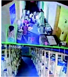
સીસીટીવી ફૂટેજ સ્પષ્ટપણે સ્થાપિત કરે છે કે ભાજપ, ચૂંટણી પંચ સાથે મળીને, કોઈપણ સંબંધિત પક્ષના અજ્ઞાતો અથવા સાક્ષીઓની ગેરહાજરીમાં મતપેટીઓ ખોલી રહી છે. આ ચૂંટણી પંચના સંપૂર્ણ જ્ઞાન અને સુરક્ષા કવચ હેઠળ ખુલ્લેઆમ આચરવામાં આવી રહેલી ઘોર ચૂંટણી ગોટાળાનું પ્રતિનિધિત્વ કરે છે.

કોલકાતા, તા. ૧ મત ગણતરી શરૂ થાય તે પહેલાં સ્ટ્રોંગરૂમ અંગે પશ્ચિમ બંગાળમાં એક મોટો રાજકીય વિવાદ ફાટી નીકળ્યો છે. ટીએમસીએ ચૂંટણી પંચ અને ભાજપ સામે ગંભીર આરોપ લગાવ્યા છે, જેમાં દાવો કરવામાં આવ્યો છે કે સ્ટ્રોંગરૂમની અંદર મતપેટીઓ ખોલવામાં આવી હતી. પાર્ટીએ જણાવ્યું હતું કે કોઈપણ પક્ષના પ્રતિનિધિઓની હાજરી વિના પરિસરની અંદર પ્રવૃત્તિ ચાલી રહી હતી. ટીએમસીએ 'X' (અગાઉ ટ્રિબ્યુટર) પર એક વીડિયો શેર કર્યો છે. પાર્ટીનો દાવો છે કે સીસીટીવી ફૂટેજ સ્પષ્ટપણે દર્શાવે છે કે કોઈ સંબંધિત પક્ષના અજ્ઞાતો અથવા ઉમેદવારોની ગેરહાજરીમાં મતપેટીઓ ખોલવામાં આવી રહી છે. આના વિરોધમાં, ઘણા ટીએમસી નેતાઓએ ધરણા પ્રદર્શન કર્યા છે અને સ્ટ્રોંગરૂમની બહાર નજર રાખી રહ્યા છે. જોકે, ચૂંટણી પંચે ટીએમસીના આરોપોને ફગાવી દીધા છે અને સ્પષ્ટતા કરી છે કે પ્રશ્નમાં રહેલી સુવિધા પોસ્ટલ બેલેટ માટે સંચાલન અને અલગ સ્ટ્રોંગરૂમ છે, જ્યાં એસી-વાઈઝ (વિધાનસભા મતવિસ્તાર મુજબ) મતપત્રોનું અલગીકરણ કરવામાં આવી રહ્યું હતું. પંચે ભારપૂર્વક જણાવ્યું હતું કે રાજકીય પક્ષોને આ પ્રક્રિયા વિશે અગાઉથી યોગ્ય રીતે જાણ કરવામાં આવી હતી.