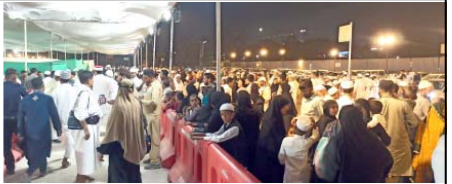
ગુજરાત હજ કમિટી મારફત પવિત્ર હજયાત્રાએ જનારા હજયાત્રિકોની પહેલી ફલાઈટ અમદાવાદ આંતરરાષ્ટ્રીય હવાઈ મથક ખાતેથી ગઈ કાલે રાત્રે રવાના થઈ ત્યારની તસવીરો