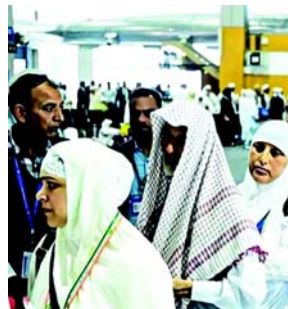
કહ્યું કે, મુંબઈ એમ્બાઈશન પોઈન્ટથી રવાના થતા, બે મહિના પહેલા પ્રતિ યાત્રાળુ ૮૦,૮૪૪ રૂપિયા વસુલવા છતાં આ વધારો થયો છે. આ વ્યક્તિગત મુસાફરો માટેના પ્રચલિત દરો કરતાં લગભગ બમણું છે. ઓવેસીએ ટવીટ કર્યું કે, શું યાત્રાળુઓને હજ સમિતિમાં જવા બદલ સજા કરવામાં આવી રહી છે? મોટાભાગના યાત્રાળુઓ શ્રીમંત નથી; તેઓ હજ પર જવા માટે વર્ષો સુધી પૈસા બચાવે છે. આ તેમના માટે ભૂલભરી નથી. કો ગ્રે સ સાંસદ ઇમરાન પ્રતાપગઢીએ હજ યાત્રા પહેલા જ સરકાર દ્વારા હવાઈ ભાડામાં વધારો કરવાની જરૂરિયાત પર પ્રશ્ન ઉઠાવતા કહ્યું કે, જ્યારે સંપૂર્ણ ભાડું પહેલાથી જ નક્કી કરવામાં આવ્યું હતું, ત્યારે છેલ્લી ઘડીએ આ વધારો શા માટે લાદવામાં આવ્યો છે. લઘુમતી બાબતોના પ્રધાન કિરેન રિજિજુએ સરકારના પગલાને સ્પષ્ટ કરવા માટે હસ્તક્ષેપ કર્યો.

(એજન્સી) ઈરાન સંઘર્ષને કારણે ATF (એવિએશન ટર્બાઈન ફ્યુઅલ)ના ભાવમાં તીવ્ર વધારા વચ્ચે હજ વિમાન ભાડામાં રૂ. ૧૦,૦૦૦નો વધારો કરવાના લઘુમતી બાબતોના મંત્રાલય હેઠળ કાર્યરત હજ સમિતિ દ્વારા લેવામાં આવેલા નિર્ણયથી યાત્રાળુઓમાં રોષ છે અને વિપક્ષ તરફથી તેને પાછો ખેંચવાની માંગણી કરવામાં આવી છે. સરકારી પરિપત્રમાં કહેવામાં આવ્યું છે કે મધ્ય પૂર્વમાં પ્રવર્તમાન પરિસ્થિતિને કારણે એક વખતના વિમાન ભાડામાં સુધારો જરૂરી છે. ૨૮ ફેબ્રુઆરીએ ઈરાન યુદ્ધ શરૂ થયા પછી વૈશ્વિક સ્તરે ATFના ભાવ બમણાથી વધુ થઈ ગયા છે. હવે, ATFના ભાવ સામાન્ય રીતે એરલાઈનના સંચાલન ખર્ચના ૩૦-૪૦% જેટલા હોય છે. ભાવમાં વધારાથી ઘણી એરલાઈનના સંચાલનને ફટકો પડ્યો છે. આ નવા હવાઈ ભાડામાં, કોઈપણ સ્થળ પર જવાના હોય, પ્રતિ યાત્રાળુ દીઠ USD ૧૦૦ની વધારાની રકમનો સમાવેશ થાય છે. હજ સમિતિના પરિપત્રમાં જણાવ્યું છે કે આ વર્ષે હજ પર જતા તમામ યાત્રાળુઓએ ૧૫ મે સુધીમાં ડિફરન્શિયલ હવાઈ ભાડા પેટે રૂ. ૧૦,૦૦૦ જમા કરાવવા પડશે. હજ એ સઉદી અરેબિયાના મક્કામાં વાર્ષિક ઈસ્લામિક યાત્રા છે. જોકે, હવાઈ ભાડામાં વધારો થતાં યાત્રાળુઓ ગુસ્સે છે અને વિપક્ષે પણ તેમની તરફેણ કરી છે, આ વધારાને “અન્યાય” ગણાવ્યો છે. આ અંગે AIMIMના વડા અસદુદ્દીન ઓવેસીએ કેન્દ્રને પરિપત્ર ૨૨ કરવા વિનંતી કરી, અને વધારાના રૂ. ૧૦,૦૦૦ ચાર્જને શોષણ ગણાવ્યું છે. તેમણે