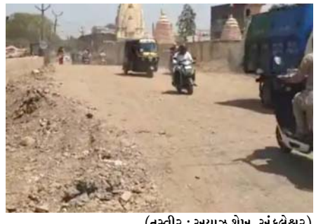
ગરનાળાની કામગીરી ચાલી રહી છે. ગરનાળું તો બની ગયું છે પણ તેના પર ડામરનો રસ્તો બનાવવામાં આવ્યો નથી. જેના કારણે ઉબડખાબડ માર્ગ પરથી રોજના હજારો વાહનચાલકો

(સંવાદદાતા દ્વારા) અંકલેશ્વર, તા.૧ અંકલેશ્વર નગરપાલિકાના વોર્ડ નંબર-૧માં જલારામ મંદિર પાસે જૂના ગરનાળાના સ્થાને નવું ગરનાળું બનાવવામાં આવ્યું છે. ગરનાળાની ઉપર પાકો રસ્તો બનાવવામાં થઈ રહેલાં વિલંબના કારણે રોજના હજારો લોકો હાલાકી ભોગવી રહ્યાં છે. રોજના હજારો લોકો હાલાકી ભોગવી રહ્યાં હોવા છતાં પાલિકા તથા હાઈવે ઓથોરિટી ડુંબર્કાની નિદ્રામાં હોય તેમ લાગી રહ્યું છે. પાલિકાના વોર્ડ નંબર-૧માં જલારામ મંદિર પાસેથી દાંડી હેરીટેજ માર્ગ પસાર થાય છે. આ માર્ગ પર આવેલું ગરનાળું જઈ રહેલાં ઓથોરિટી તેનું નવીનીકરણ કરવામાં આવ્યું છે. ચાર મહિના ઉપરાંતથી