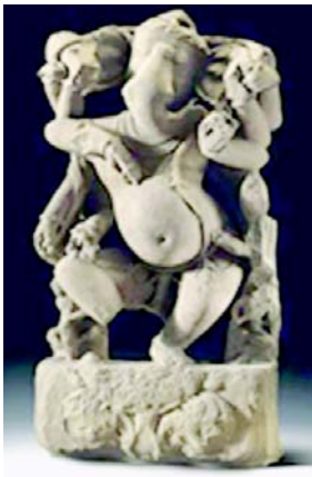
ગયું અને યુનાઈટેડ સ્ટેટ્સમાં દાણચોરી કરવામાં આવ્યું. ત્યારબાદ, ૨૦૧૪ સુધીમાં તે ન્યુ યોર્કના એક ખાનગી સંગ્રહમાં પહોંચી ગયું. ગયા વર્ષે, મેનહટન ડિસ્ટ્રિક્ટ એટર્ની ઓલિવિયન બ્રેગે આ કલાકૃતિ શોધી કાઢી અને તે સંગ્રહમાંથી તેને જસ પાંખવાળા સિદ્ધાસન પર કોતરેલા ઉબલ-આભાર માનું છું.