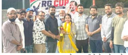
અમદાવાદ, તા. ૨૩ કોંગ્રેસના વરિષ્ઠ નેતા અને સંસદમાં વિરોધ પક્ષના નેતા રાહુલ ગાંધીના જન્મ દિવસે ૧૯ જૂને ક્રિકેટ ટુર્નામેન્ટ 'RG CUP'નું લોન્ચિંગ કરવામાં આવ્યું હતું. આ ટુર્નામેન્ટનું આયોજન યુવા ખેલાડીઓને વેટકોર્મ પુરું પાડવા અને રમતગમતની ભાવનાને પ્રોત્સાહન આપવા માટે કરવામાં આવ્યું છે. ટુર્નામેન્ટમાં ઘણી ટીમો

એ ભાગ લીધો છે અને દરરોજ યોજાતી ક્રિકેટ મેચમાં અનેરા ઉત્સાહ સાથે ખેલાડીઓ ભાગ લઈ રહ્યા છે. ટુર્નામેન્ટમાં સફળ રીતે જીત હાંસલ કરી ઉત્કૃષ્ટ પ્રદર્શન કરનાર ક્રિકેટ ખેલાડીઓ તથા ટીમોને શુભેચ્છાઓ વરસી રહી છે. એમ એક યાદીમાં AICCના માર્ગદર્શક ડી. રિ. ડિપાર્ટમેન્ટના રાષ્ટ્રીય વા. ચેરમેન શાહનવાઝ શેખે જણાવ્યું છે.