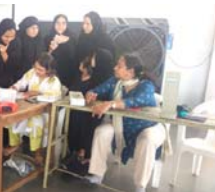
હિમતનગર, તા. ૨૩ સાબરકાંઠા જિલ્લાના જેડીપુરા ખાતે મહોરમ પૂર્વે માનવતા અને સામાજિક સેવાનું એક અનોખું દૈન્ય સર્જાયું હતું, જ્યાં આયોજિત 'હુસૈની રકતદાન કેમ્પ'માં સ્થાનિક યુવાઓએ ભારે ઉત્સાહ દર્શાવી કુલ ૧૩૫ યુનિટ રક્ત એકત્રિત કર્યું હતું.

હિમતનગર, તા. ૨૩ સાબરકાંઠા જિલ્લાના જેડીપુરા ખાતે મહોરમ પૂર્વે માનવતા અને સામાજિક સેવાનું એક અનોખું દૈન્ય સર્જાયું હતું, જ્યાં આયોજિત 'હુસૈની રકતદાન કેમ્પ'માં સ્થાનિક યુવાઓએ ભારે ઉત્સાહ દર્શાવી કુલ ૧૩૫ યુનિટ રક્ત એકત્રિત કર્યું હતું. દર વર્ષે મહોરમ પર્વ અગાઉ યોજાતા આ કેમ્પમાં સમાજના ૧૧૩ યુવાનો અને ૧૮ બહેનોએ સક્રિય ભાગીદારી નોંધાવી જીવનદાન સમાન ગણાતા આ કાર્યમાં પોતાનો અમૂલ્ય ફાળો આપ્યો હતો. તબીબી દ્રષ્ટિએ રકતદાન એ માત્ર દાન નહીં પણ સાચા અર્થમાં મહાદાન છે, કારણ કે એકત્રિત