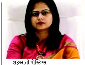
શરૂઆતી પોસ્ટિંગ ૧. ઝાબુઆમાં આસિસ્ટન્ટ કલેક્ટર અને રક્તદાન કરવા માટે આગળ વધવું. ૨. મિલવા સશક્તિકરણનું ઉદાહરણ : મહાદેવ સંસાધનો છતાં IAS અધિકારી બનીને સમાજ માટે એક મિસાલ સ્થાપિત કરી. ૩. માતા પાસેથી પાઠ : શિક્ષણ પરિવર્તન માટે સૌથી શક્તિશાળી સાધન છે.

(એજન્સી) તા. ૨૩ મધ્યપ્રદેશ કેરના ૨૦૧૨ બેચના IAS અધિકારી નિધિ નિવેદિતા આજે ભારતીય વહીવટી બેચમાં એક શક્તિશાળી વ્યક્તિ તરીકે ઓળખાય છે. તેઓ એક એવા અધિકારી તરીકે ઓળખાય છે જે શાસન પ્રત્યે કડક અભિગમ અને ભષ્ટાચાર પ્રત્યે શૂન્ય-સહિષ્ણુતાની નીતિ જાળવી રાખે છે. જો કે, તેમની કારકિર્દીમાં ઘણા ઉચ્ચ-પ્રોફાઇલ વિવાદો પણ રહ્યા છે જેણે તેમને રાષ્ટ્રીય સ્તરે ચર્ચામાં લાવ્યા. ૧. શૈક્ષણિક શ્રેણતા : તેણીનું શિક્ષણ પૂર્ણ કર્યા પછી, નિધિએ સિવિલ સર્વિસમાં કારકિર્દી બનાવવાનું નક્કી કર્યું. ૨. યુપીએસસી સફળતા (૨૦૧૨) : આ તેણીનો સૌથી મોટો સીમાચિહ્ન હતો, જેનો શ્રેય તેણી તેની માતાને આપે છે. સિવિલ સર્વિસમાં