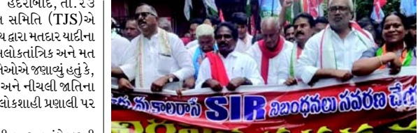
ચૂંટણી પંચના અધિકારીઓએ જણાવ્યું હતું કે, SIRનો પ્રાથમિક ઉદ્દેશ્ય મતદાર યાદીઓનું શુદ્ધિકરણ અને તમામ પાત્ર નાગરિકોનો મતદાર યાદીમાં સમાવેશ થાય છે તેની ખાતરી કરવાનો છે.

(એજન્સી) હૈદરાબાદ, તા. ૨૩ કોંગ્રેસ, ડાબેરી પક્ષો અને તેલંગાણા જન સમિતિ (TJS)એ મંગળવાર, ૨૩ જૂનના રોજ ભાજપ અને ચૂંટણી પંચ દ્વારા મતદાર યાદીના SIR દ્વારા કથિત રીતે કરવામાં આવી રહેલી 'અલોકાત્મિક અને મત ચોરી' પ્રવૃત્તિઓનો વિરોધ કરતી રેલી કાઢી હતી. તેઓએ જણાવ્યું હતું કે, ગરીબો, નબળા વર્ગો, આદિવાસીઓ, દલિતો અને નીચલી જાતિના લોકોને મતદાર યાદીમાંથી દૂર કરવાના પ્રયાસો લોકશાહી પ્રણાલી પર હુમલો સમાન છે.