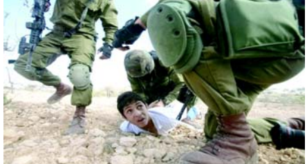
(એજન્સી) તા. ૨૩

ઈઝરાયેલીઓએ અટકાયતમાં રહેલા પેલેસ્ટીની બાળકોને કૌટુંબિક સંપર્ક અને તેમના સૌથી મૂળભૂત અધિકારોમાંના એક: શિક્ષણથી વંચિત રાખ્યા છે. હાલમાં ૩૫૦થી વધુ પેલેસ્ટીની બાળકો ઈઝરાયેલી બનાવકાર અને ત્રાસ આપતી જેલમાં બંધ છે, જેઓ તેમના ઈઝરાયેલી ત્રાસ આપનારાઓના હાથે અમાનવીય દુર્વ્યવહારનો ભોગ બને છે, જેમને અટકાયતમાં રાખેલા પેલેસ્ટીનીઓ પર બનાવકાર કરવા માટે તાલીમ પામેલા કૂતરાઓનો ઉપયોગ કરવા તરીકે વ્યાપકપણે દસ્તાવેજીકૃત કરવામાં આવ્યા છે. આ કેદમાં બંધ બાળકોમાં ૬૫ સામાન્ય માધ્યમિક શાળાના વિદ્યાર્થીઓ, જેમને પેલેસ્ટીની શિક્ષણ અને ઉચ્ચ શિક્ષણ મંત્રાલયના ડેટા અનુસાર, ઈઝરાયેલી અધિકારીઓ દ્વારા આ વર્ષે તેમની સામાન્ય માધ્યમિક પરીક્ષાઓ બેસવાથી અટકાવવામાં આવ્યા છે. નરસંહારના ગુનાની શરૂઆતથી, તેઓએ કઠોર પરિસ્થિતિઓનો સામનો કરવો પડ્યો છે જેમાં ત્રાસ, દુર્વ્યવહાર અને દુર્વ્યવહારનો સમાવેશ થાય છે, ઉપરાંત તેમના પરિવારોની હુકું અને તેમના સૌથી મૂળભૂત અધિકારોમાંના એક: શિક્ષણને અધિકારથી વંચિત રાખવામાં આવ્યા છે. "પેલેસ્ટિનિયન પ્રિઝનર્સ સોસાયટી (PPS) એ સમ્પ્રદાન અંતે એક નિવેદનમાં જણાવ્યું હતું. પીપીએસના નિવેદનમાં ઉમેરવામાં આવ્યું છે કે, ગાઝા પટ્ટી પર નરસંહાર હુમલાની શરૂઆતથી, કબજા સત્તાવારમાં શિક્ષણના વિવિધ તબક્કામાં વિદ્યાર્થીઓને લક્ષ્ય બનાવીને ધરપકડ ઝુંબેશને વધુ તીવ્ર બનાવી છે. તેમાં સમજાવવામાં આવ્યું છે કે આ વધારો એવા આમૂલ અને ખતરનાક પરિવર્તનોના સંદર્ભમાં થયો છે