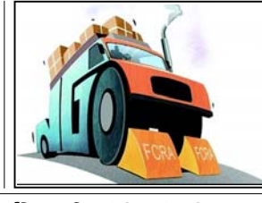
જેમણે પ્રાચ્યાર્ત રીતે જાહેર કર્યું હતું કે, "હું ભષ્ટાચારમાં સામેલ થઈશ નહીં, અને તેને થવા દઈશ નહીં" - શું આ મામલાની તપાસનો આદેશ આપશે ?

(એજન્સી) નવી દિલ્હી, તા. ૨૩ કેન્દ્રીય ગૃહ મંત્રાલયે બિન-સરકારી સંસ્થાઓ દ્વારા વિદેશી ભંડોળ મેળવવા અને ઉપયોગ માટેના નિયમોમાં સુધારો કર્યો છે અને વિદેશી યોગદાન (નિયમન) અધિનિયમ (FCRA), ૨૦૧૭ હેઠળ અનેક ગુનાઓ માટે દંડમાં સુધારો કર્યો છે. કાયદાની કલમ ૪૧(૧) દ્વારા આપવામાં આવેલી સત્તાઓ હેઠળ મંત્રાલય દ્વારા આ આદેશો સૂચિત