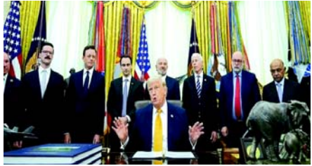
(એજન્સી) દુબઈ/વોશિંગ્ટન, તા. ૨૩

ઈરાને મંગળવાર, ૨૩ જૂને કહ્યું હતું કે આંતરરાષ્ટ્રીય પરમાણુ ઊર્જા એજન્સી (IAEA)ના નિરીક્ષકો માટે યુનાઈટેડ સ્ટેટ્સ દ્વારા અગાઉ બોમ્બમારો કરાયેલા પરમાણુ સ્થળો જોવા માટે કોઈ મુલાકાતનું આયોજન કરવામાં આવ્યું નથી. ઈસ્માઈલ બાઘાઈએ ઈરાનની રાજધાની તેહરાનમાં એક પત્રકાર પરિષદમાં પત્રકારોને આ ટિપ્પણી કરી હતી. બાઘાઈની ટિપ્પણીઓ યુએસ ઉપપ્રમુખ જેડી વાન્સે દ્વારા કરવામાં આવેલી ટિપ્પણીઓ વિરુદ્ધ લાગે છે, જેમણે કહ્યું હતું કે સ્વિટ્ઝર્લેન્ડમાં વાટાઘાટોથી IAEA માટે ઈરાની સ્થળોની મુલાકાત લેવાનો કરાર થયો હતો. ૨૦૨૫માં ઈઝરાયેલી ઈરાન સામેના ૧૨ દિવસના યુદ્ધ પછી IAEA ઈરાનમાં આવે છે અને બહાર જાય છે, પરંતુ તે યુદ્ધમાં અમેરિકા દ્વારા લક્ષિત બોમ્બમારો કરાયેલા સંવેદન સ્થળોની એક્સેસ તેમને આપવામાં આવી નથી. યુએસ પ્રમુખ ડોનાલ્ડ ટ્રમ્પે કહ્યું કે ઈરાન તરફથી "આદર" એ ઈરાન-ઈઝરાયેલ યુદ્ધના અંત પછી શાંતિ ટકાવી રાખવા માટે ચાલી રૂપ રહેશે, તેમણે હોર્મુઝ સ્ટ્રેટને સંપૂર્ણપણે ફરીથી ખોલવા અંગે આશાવાદ વ્યક્ત કર્યો જેથી