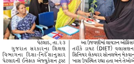
પેટલાદ, તા. ૨૩ ગુજરાત સરકારના શિક્ષણ વિભાગના દિશા-નિર્દેશનુસાર પેટલાદની ઈનેકાક એજ્યુકેશન ટ્રસ્ટ સંચાલિત એસ.ડી. પઠાણ હાઈસ્કૂલ ખાતે શૈક્ષણિક વર્ષ ૨૦૨૬-૨૭ના અંતર્ગત 'કન્યા કેળવણી મહોત્સવ' અને પ્રગતિનો પ્રવેશોત્સવ કાર્યક્રમની ઉજવણી કરવામાં આવી છે.