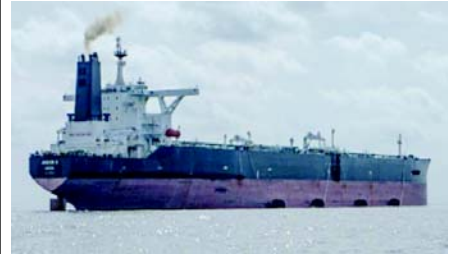
મિલિયન બેરલ તેલ આયાત કર્યું હતું, જે તેની કુલ આયાતના આશરે ૪૪% છે. વૈશ્વિક પુરવઠાની અછત અને ભામાં અસ્થિરતાને ધ્યાનમાં રાખીને, ઈરાની તેલ અંગેની આ ૬૦ દિવસની છૂટ ભારત માટે સ્વાગતના સમાચાર હોઈ શકે છે.

ભારત માટે આનો અર્થ શું છે ? ઈરાની તેલ પરના પ્રતિબંધો હટાવવા ભારત માટે ખૂબ જ મહત્વપૂર્ણ છે, કારણ કે તે ઐતિહાસિક રીતે ઈરાની તેલનો મુખ્ય ખરીદદાર રહ્યો છે. ૨૦૦૮માં ભારતની કુલ કુડ ઓઈલ આયાતમાં ઈરાનનો હિસ્સો ૧૪% હતો, જે તે સમયે દેશનો બીજો સૌથી મોટો સપ્લાયર હતો. જોકે, ૨૦૧૯માં તત્કાલીન યુએસ પ્રમુખ ડોનાલ્ડ ટ્રમ્પે કડક પ્રતિબંધો લાદ્યા હતા, જેના કારણે ભારતે ઈરાની તેલની ખરીદી સંપૂર્ણપણે બંધ કરી દીધી હતી. ત્યારબાદ, ભારતે રશિયા પાસેથી તેની તેલ ખરીદીમાં વધારો કર્યો. બાદમાં, અમેરિકાએ રશિયાને તેલ પર પ્રતિબંધો લાદ્યા હતા. જોકે, મધ્ય પૂર્વમાં વધતી તણાવ વચ્ચે - ખાસ કરીને હોર્મુઝ સ્ટ્રેટને લગતા - રશિયાને તેલ ખરીદી પરના નિયંત્રણો હળવા કરવામાં આવ્યા હતા. અને ભારત હવે રશિયા પાસેથી રેકોર્ડ જથ્થામાં તેલ આયાત કરી રહ્યું છે. ફક્ત જૂન મહિનામાં જ, ભારતે મોસ્કોથી દરરોજ ૨.૬