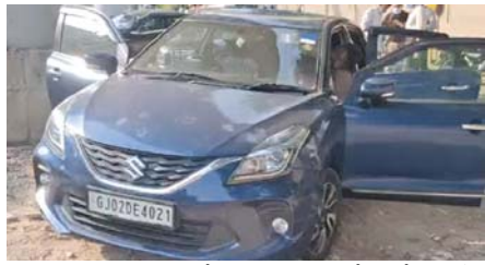
નવરંગપુરા વિસ્તારમાં સિટી ગોલ્ડ શિયેટરની પાછળ આવેલા મેટ્રોના પીલર નીચેથી એક વાદળી કલરની ગાડીમાં યુવકની લાશ હતી. જે અંગે પોલીસને જાણ થતા નવરંગપુરા પોલીસની ટીમ સ્થળ પર પહોંચી હતી. પોલીસે સ્થળ પર પહોંચીને તપાસ હાથ ધરી છે.

(સંવાદદાતા દ્વારા) અમદાવાદ, તા. ૨૩ અમદાવાદના નવરંગપુરામાં એક ગાડીમાંથી યુવકની શકાયેલા હાલતમાં લાશ મળી આવી છે. મેટ્રો બ્રિજ નીચે પાર્ક કરેલી ગાડીમાંથી યુવકની લાશ મળી છે. યુવકના શરીર પર ઈજાના કોઈ નિશાન જોવા મળ્યા નથી. જાણ થતા સ્થાનિક પોલીસની ટીમ સ્થળ પર પહોંચી છે સાથે જ ડ્રગ્સની ટીમ પણ પહોંચી છે. ગાડીમાંથી દારૂની બોટલ પણ મળી હતી. મુતક યુવક પેટ્રોલ પૂરું થતા કારમાં સુઈ જતા મોત થયાની શંકા સેવાઈ રહી છે અને ઉલ્લેખનીય છે કે નવરંગપુરા પોલીસ સ્ટેશનથી ૨૦૦ મીટરના અંતરે જ આ બનાવ બન્યો છે