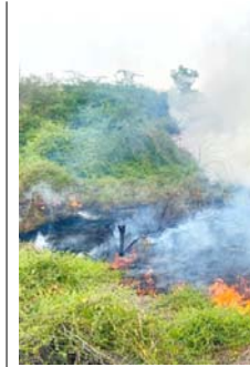
પર આવેલી ક્રિએટિવ કાર્બન કંપનીના સંકુલમાં આજે અચાનક આગ લાગવાની દુર્ઘટના સામે આવી હતી. કંપનીના પ્રાંગણમાં

(સંવાદદાતા દ્વારા) નડિયાદ, તા. ૨૩ બેડા પાસે કાર્બન કંપનીના પુલ્લા પ્લોટમાં પડેલા વેસ્ટ કચરાના જથ્થામાં અચાનક ભીષણ આગ ફાટી નીકળી હતી. આગે જોતજોતામાં વિકરાળ સ્વરૂપ ધારણ કરી લેતા આકાશમાં કાળા ડિબાંગ ધુમાડાના ગોટેગોટા ઉડવા હતા, જેને પગલે વિસ્તારમાં અફરાતફરીનો માહોલ સર્જાયો હતો. ઘટનાની ગંભીરતા એ બાબતને લઈને વધુ હતી કે, આગ જ્યાં લાગી હતી તેની બિલકુલ નજીક જ ONGCનો કૂવો આવેલો છે.