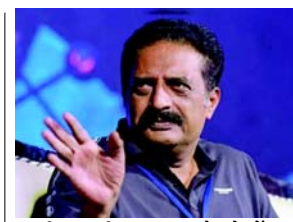
આવી ન હતી. ત્યારબાદ તેમણે બેંગલુરૂ શહેર પોલીસ કમિશનર અને ભારતીય ચૂંટણી પંચનો સંપર્ક કર્યો. બંનેમાંથી કોઈ પણ સત્તા તરફથી કોઈ જવાબ ન મળતાં તેમણે કોર્ટનો દરવાજો ખખડાવ્યો. ચૂંટણી પંચના નિયમો હેઠળ, દેશમાં કંઈક એક જ જગ્યાએ નાગરિક મતદાર તરીકે

(એજન્સી) તા. ૨૩ બેંગલુરુની એક કોર્ટે અભિનેતા પ્રકાશ રાજ વિરુદ્ધ અનેક રાજ્યોમાં મતદાર ઓળખ કાર્ડ ધરાવતા હોવાના આરોપો સંબંધિત કેસમાં બિનજામીનપાત્ર વોરંટ (NBW) જારી કર્યું છે. આ મામલો ૨૦૧૯માં હલાસુરૂ ગેટ પોલીસ સ્ટેશનમાં એડવોકેટ દિલીપ કુમાર દ્વારા દાખલ કરવામાં આવેલી ફરિયાદથી ઉદ્ભવ્યો છે. ફરિયાદીએ આરોપ લગાવ્યો હતો કે, રાજ કપાટિક, તમિલનાડુ અને તેલંગાણા સહિત ચાર રાજ્યોમાં મતદાર ઓળખ કાર્ડ ધરાવતા હતા, જે સાબિત થાય તો ચૂંટણી નિયમોનું ઉલ્લંઘન થશે. કુમારના જણાવ્યા મુજબ પોલીસ દ્વારા ફરિયાદ પર કોઈ કાર્યવાહી કરવામાં