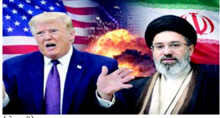
(એજન્સી) તા. ૨૩

ઈરાન પર યુએસ-ઈઝરાયેલ યુદ્ધનો ૧૧મો દિવસ હતો, કારણ કે ઈરાનના સુપ્રીમ લીડરના એક વરિષ્ઠ પ્રતિનિધિએ ચેતવણી આપી હતી કે વોશિંગ્ટન અને તેહરાન વચ્ચે મહિનાઓથી ચાલી રહેલા સંઘર્ષને સમાપ્ત કરવાના ઉદ્દેશ્યથી વાટાઘાટોમાં પ્રગતિની જાહેર થઈ હોવા છતાં, ઈરાનનો ત્યાં સુધી શાંત નહીં રહે જ્યાં સુધી યુએસ રાષ્ટ્રપતિ ડોનાલ્ડ ટ્રમ્પ 'કોધના સમુદ્ર'માં 'ડૂબી' ન જાય. ઈસ્લામિક રિવોલ્યુશનરી ગાર્ડ્સ કોર્પ્સ (IRGC)માં સુપ્રીમ લીડરના પ્રતિનિધિ અબુલકાસ હાજરે સંદેશોએ કહ્યું કે ઈરાન ક્યારેય વિદેશી વર્ચસ્વ સ્વીકારશે નહીં અને વાટાઘાટકારોને યુનાઈટેડ સ્ટેટ્સ સાથે વ્યવહારમાં સાવધ રહેવા વિનંતી કરી. ઈરાન ઈન્ટરનેશનલ અનુસાર, તેમણે વોશિંગ્ટનને એક એવો દુસ્મન ગણાવ્યો જેના પર ઈરાન ન તો વિશ્વાસ કરી શકે છે કે ન તો તિન બની શકે છે. આ ટિપ્પણીઓ ત્યારે આવી જ્યારે બંને પક્ષોએ સ્વિટ્ઝર્લેન્ડમાં પ્રતિબંધો રાહત, તેલ નિકાસ અને કેન્દ્રશાસી અંતમાં શરૂ થયેલા સંઘર્ષને સમાપ્ત કરવાના વ્યાપક પ્રયાસો પર કેન્દ્રિત ઉચ્ચ-સ્તરીય વાટાઘાટો પછી પ્રગતિમાં સંકેત આપ્યો.