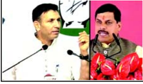
(એજન્સી) નવી દિલ્હી, તા. ૨૩ કોંગ્રેસે મધ્યપ્રદેશના મુખ્યમંત્રી મોહન યાદવના પરિવાર દ્વારા જમીન ખરીદીમાં મોટા ભાગના આરોપ લગાવ્યા છે અને સુપ્રીમ કોર્ટના ન્યાયાધીશ દ્વારા દેખરેખ હેઠળ તપાસની માંગ કરી છે. આ મુદ્દા ઉઠાવતા, કોંગ્રેસે મોહન યાદવને "બ્રહ્મ મુખ્યમંત્રી" ગણાવ્યા છે. કોંગ્રેસના નેતા જીતુ પટવારીએ મુખ્યમંત્રીને ૧૫ મુદ્દાવાળા પ્રશ્નો પૂછવા માટે એક પત્રકાર પરિષદ યોજી હતી, જેમાં જણાવ્યું હતું કે જમીન જવાબો મેળવવાને પાત્ર છે. કોંગ્રેસે આ બાબતે ઉઠાવેલી ચોક્કસ માંગણીઓ અને પ્રશ્નો પર નજર નાખતા પહેલા, મુખ્યમંત્રી મોહન યાદવ સામેના આરોપોની ગંભીરતા સમજાવી મહત્વપૂર્ણ છે. ૫ ઈન્ડિયન એક્સપ્રેસ દ્વારા કરવામાં આવેલી તપાસમાં ઘણાં કરવામાં આવ્યો હતો કે મુખ્યમંત્રી બન્યા પછી, મોહન યાદવ, તેમના પરિવાર અને સંલગ્ન રિયલ એસ્ટેટ કંપનીઓએ ઈજ્જત અને આસપાસના વિસ્તારોમાં ૧૩૭ પ્લોટ - કુલ આશરે ૧૬૮ એકર - ખરીદ્યા હતા. તેમના પરિવારના સભ્યો દ્વારા હસ્તગત કરાયેલી જમીનની સંપૂર્ણ વિગતો આપવામાં આવી હતી. જવાબમાં, એમપી કોંગ્રેસે એક્સપ્રેસ પર "બ્રહ્મ મુખ્યમંત્રી" પોસ્ટ કર્યું. મોહન યાદવના પરિવાર પાસે કેટલી જમીન છે? કુલ જમીન માલિકી અંગેના અહેવાલને ટાંકીને, એમપી કોંગ્રેસના પ્રમુખ જીતુ પટવારીએ પ્રેસ કોન્ફરન્સમાં જણાવ્યું હતું કે મોહન યાદવના પરિવાર અને સંબંધીઓ ૨૪૫ પ્લોટમાં ૩૩૫ એકર જમીન ધરાવે છે. તેમણે આની સંપૂર્ણ વિગતો આપી છે:

એક પત્રકાર પરિષદમાં કોંગ્રેસે મધ્યપ્રદેશના મુખ્યમંત્રી મોહન યાદવને પૂછ્યું કે શું એ સાચું છે કે, પદ સંભાળ્યા પછી, તેમના પરિવાર અને તેની સાથે સંકળાયેલી કંપનીઓએ ૧૩૭ પ્લોટ ધરાવતી ૧૬૮ એકર જમીન ખરીદી હતી. શું આ જમીનમાંથી ૧૧૧ એકર વિકાસ પ્રોજેક્ટ્સથી પ્રભાવિત વિસ્તારોમાં હસ્તગત કરવામાં આવી હતી ?