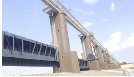
એક્ટે હેઠળ કરાયેલા પ્રિ-મોન્યુન નિરીક્ષણમાં યાંત્રિક શાખા દ્વારા બેરેજના દરવાજાઓનું નવીનીકરણ અને રીપેરિંગ માટે ભલામણ કરવામાં આવી હતી. આ ભલામણના આધારે બેરેજની લાંબાગાળાની સુરક્ષાને ધ્યાને રાખીને ગત તા. ૧૭ એપ્રિલ ૨૦૨૬થી બેરેજમાંથી પાણી સંપૂર્ણ પાલી કરી યુદ્ધના ધોરણે કામગીરી

(સંવાદદાતા દ્વારા) અમદાવાદ, તા. ૨૩ ગુજરાતના આર્થિક પાટનગર અમદાવાદની મધ્યમાંથી પસાર થતી સાબરમતી નદી પરના મહત્વપૂર્ણ એવા વાસણા-બેરેજના આધુનિકીકરણની કામગીરી માત્ર ૩૫ દિવસના રેકર્ડ સમયમાં પૂર્ણ કરવામાં આવી છે. રાજ્યના જળસંપત્તિ વિભાગ હેઠળ કાર્યરત યાંત્રિક શાખા દ્વારા રૂ. ૧૦.૧૫ કરોડના ખર્ચે ૧૯ નવા દરવાજા નાખવાનું અને ૧૦ ગેટનું રીપેરિંગ કામ પૂર્ણ કરવામાં આવ્યું છે. આ સાથે જ સાબરમતી નદીમાં ફરી પાણી ભરવાનું શરૂ થઈ ચૂક્યું છે. વર્ષ ૧૯૭૬માં નિર્માણ પામેલો વાસણા બેરેજ અમદાવાદ શહેર માટે પુર નિર્ણય અને જળ વ્યવસ્થાપનનું મહત્વપૂર્ણ માળખું છે. વર્ષ ૨૦૨૫માં ૩૫-સેક્ટરી